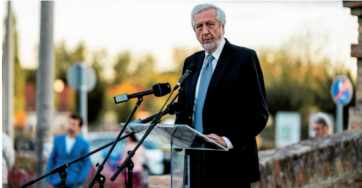
JESZENSZKY GÉZA, VOLT KÜLÜGYMINISZTER, '56 HARCOSAINAK ESMÉJÉT ÉS A NYUGATOT KÖVETNÉ