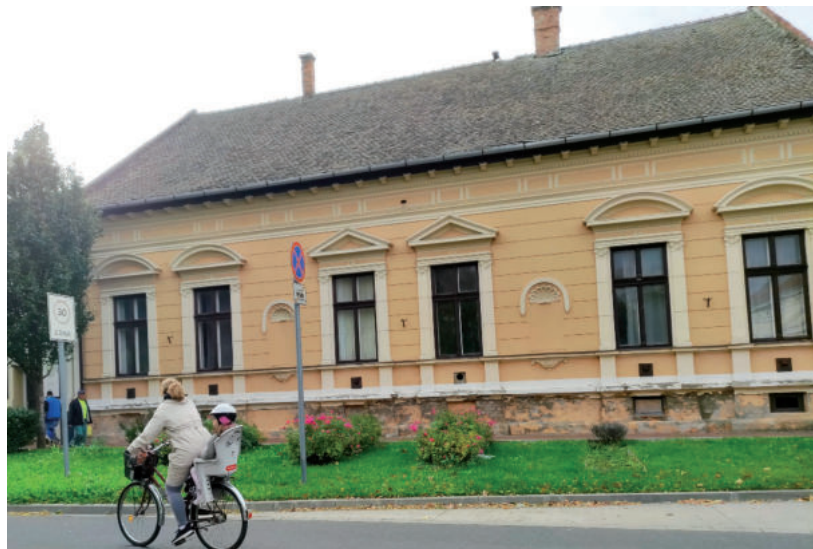
A ZRÍNYI UTCAI ÉPÜLET EGYKOR A PÁRTOK HÁZAKÉNT MŰKÖDÖTT