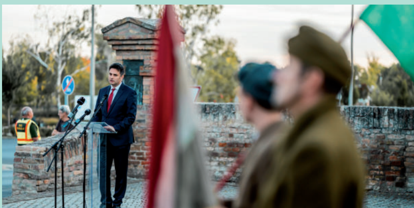
MÁRKI-ZAY PÉTER BESZÉDET MOND