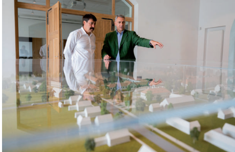
MEZŐHEGYESEN MINDENRE LESZ PÉNZ, IGAZ NEM ÖNERŐBŐL

A K-Monitor vette észre, hogy a Jövő Nemzedék Földje Alapítvány – ahogy írják, – közérdekű céljainak megvalósítása, illetve közfeladata ellátása érdekében újabb vagyonelemmel gazda-