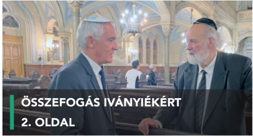
ÖSSZEFOGÁS IVÁNYIÉKÉRT 2. OLDAL