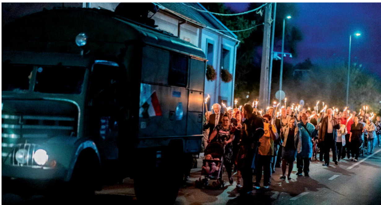
FÁKLYÁS FELVONULÁSSAL TISZTELEGTEK AZ OKTÓBER 23-I ÜNNEPSÉG RÉSZTVEVŐI 56 HŐSEI ELŐTT