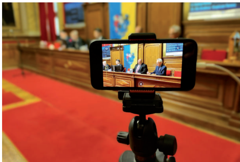
VITA NÉLKÜL SZAVAZTAK MEG MINDENT VÁSÁRHELY KIVÁLÁSÁHOZ