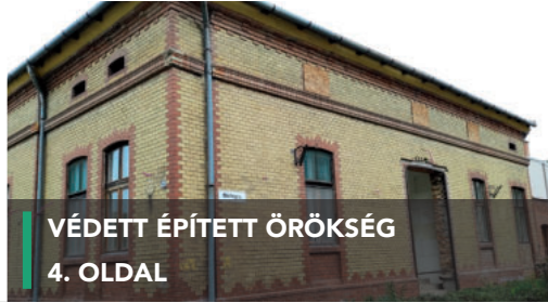
VÉDETT ÉPÍTETT ÖRÖKSÉG 4. OLDAL