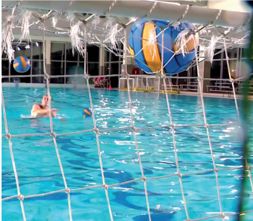
GÖDÖRBEN A CSAPAT