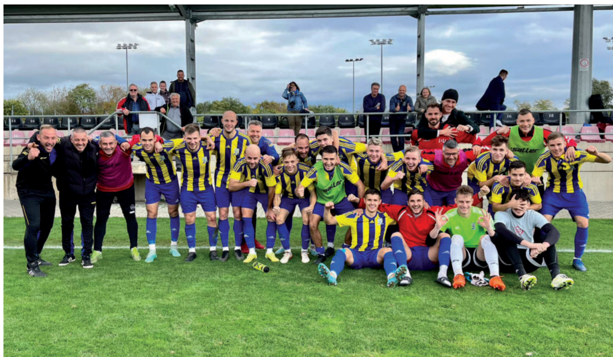
TÖBBSZÖR VAN OKUK ÖRÖMRE A VÁSÁRHELYI FIÚKNAK

A vásárhelyiek leginkább a Kőrösladánnyal vannak versenyben, akik egy ponttal előzik meg Antal Krisztián együttesét