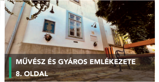
MŰVÉSZ ÉS GYÁROS EMLÉKEZETE 8. OLDAL