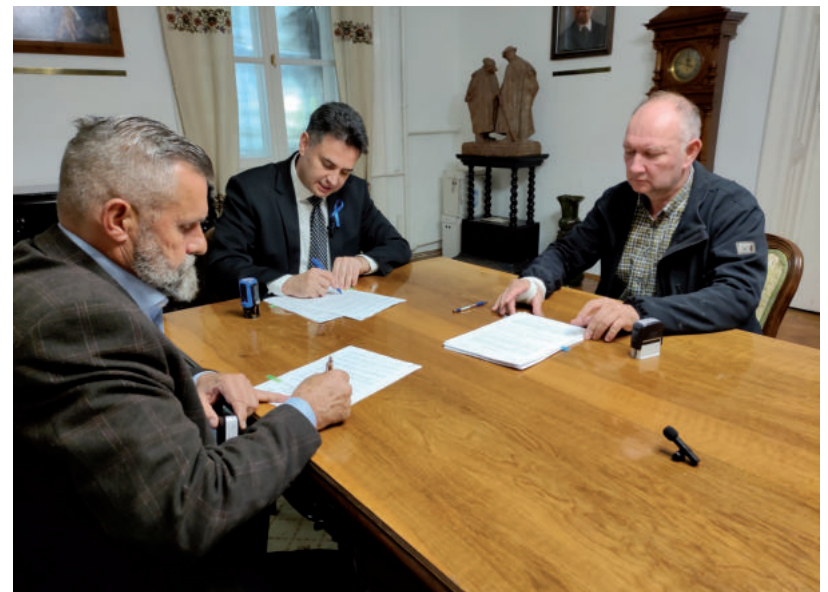
A SZERZŐDÉSALÁÍRÁS MEGTÖRTÉNT, A KIVITELEZÉS SEM VÁRAT SOKÁIG MAGÁRA