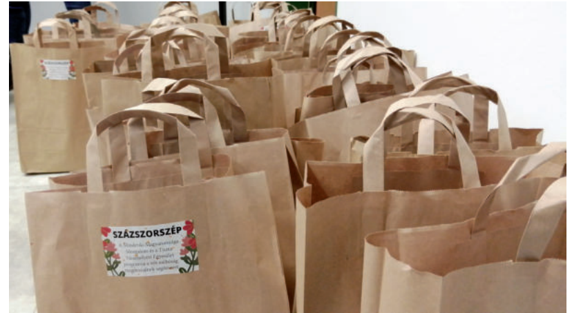
A CSOMAGOK HIGIÉNÉS TERMÉKEKET TARTALMAZNAK, AMELYEKET ADOMÁNYOKBÓL ÁLLÍTANAK ÖSSZE AZ ÖNKÉNTESEK

– A párkapcsolati témákat boncolgattuk: mire szoktak panaszkodni a nők, mire a férfiak a kapcsolaton belül. A témát tabu övezi, nehéz felvállalni ezeket a