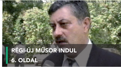
RÉGI-ÚJ MŰSOR INDUL 6. OLDAL