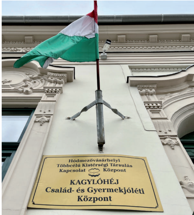
A KAGYLÓHÉJ CSALÁD- ÉS GYERMEKJÓLÉTI KÖZPONTOT IS AZ ÖNKORMÁNYZAT MŰKÖDTETI MAJD

A határozati javaslat szerint ezek a következők: 1. Vásárhely átvállalja a HTKT-ból való kilépés minden költségét, beleértve ebben a munkavállalói döntésekhez kapcsolódókat, 2. Vásárhely vállalta, hogy biztosítja a mártélyiak és a székkutasiak felvételét a vásárhelyi idősok otthonába, 3. Vásárhely vállalta, hogy a Mindszenti Gondozási Központ Idősok Otthona ideiglenes működési engedélye meghosszabbítása hiányában helyet biztosít (max. 21 személynek) a vásárhelyi idősok otthonában, 4. Vásárhely módosítja a HTKT és a HTKT Kapcsolat Központ által kötött, jelenleg is érvényes a kistelepülésekre vonatkozó szerződéseket és felmondja azokat, melyek a kistelepüléseket nem érintik, 5. Minden önkormányzat hagyja jóvá a HTKT Kapcsolat Központ alapító okiratának 2024. január 1-től való módosítását, 6. Erősítse meg a Kapcsolat Központ használati szerződéseit, 7. Tárgyalja újra a Kapcsolat Központ intézményvezetői pályázata véleményezésére vonatkozó döntést, mert abból kimaradt az egyik a bizottságba javasolt tag neve, 8. Foglalja határozatba a Kapcsolat Központ ideiglenesen