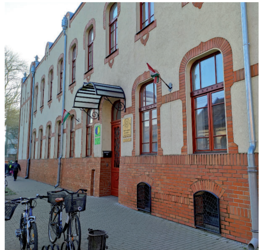
AZ 1 MILLIÁRD ÉRTÉKŰ INGATLANVAGYON RÉSZÉ A PETŐFI 6. SZÁM IS