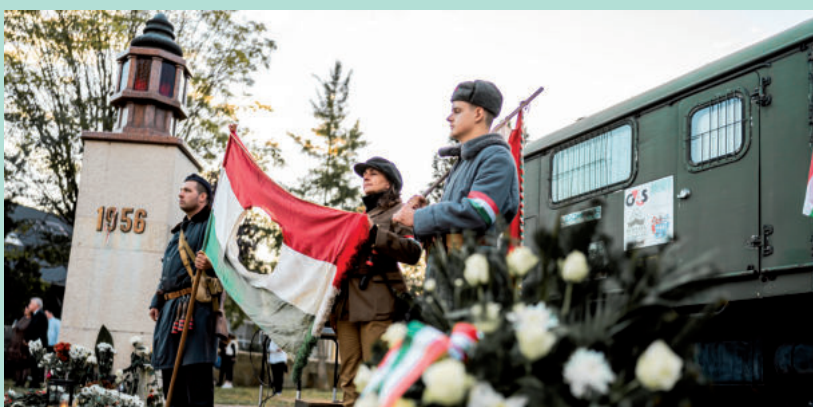
KORHÚ ÖLTÖZÉKBEN, KORABELI AUTÓ ELŐTT