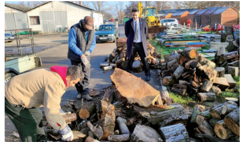
TAVALY IS SOKAKNAK JELENTETT SEGÍTSÉGET A SZOCIÁLIS TŰZIFA