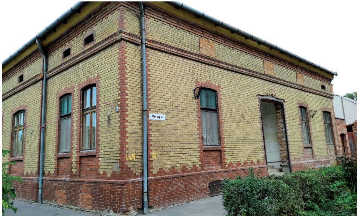
AZ EGYKORI VASUTASHÁZ IS MEGÚJUL A TÁMOGATÁSBÓL

Az önkormányzat utófinanszírozású, vissza nem térítendő támogatást nyújtott a kedvező elbírálásban részesülő pályázóknak. A cél, hogy segítsék a tulajdonosokat az állagmegóvási kötelezettségük teljesítésében. A támogatás mértéke, nyílászáró-felújítás esetében maximum 65 százalék lehet, egyéb munkáknál 50 százalék, a maximum összeg pedig bruttó 5 millió forint.