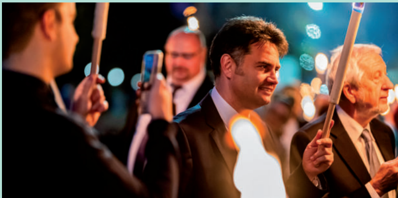
MÁRKI-ZAY PÉTER ÉS JESZENSZKY GÉZA A FÁKLÁS FELVONULÁSON

Az ünnepségen a beszédeket követően koszorút helyeztek a különböző pártok, szervezetek, egyesületek képviselői, majd fáklyás felvonulás indult. Az Emlékpontban pedig Bornai Tibor Megyünk, vagy maradunk című zenés összeállítással emlékezett 1956-ra. ■