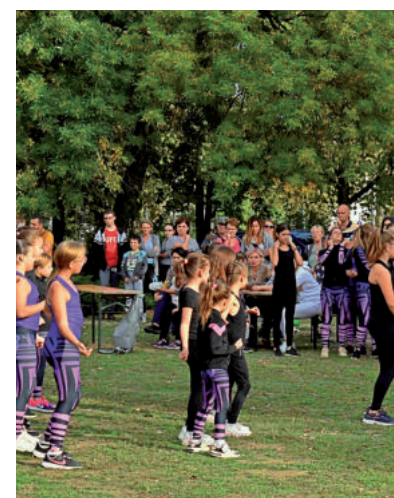
SOKAN VOLTAK KÍVÁNCSIAK A RENDEZVÉNY FELLEPŐIRE

A rendezvényen felléptek a Tailor Dance táncosai és a Hód-Fitness SE elképesztően hajlékony és ügyes sportolói. A jelenlévők nemcsak meghallgathatták a rajtkocka.hu Forma-1-es mestereitől, milyen jelen lenni egy versenyen, de a szimulátor