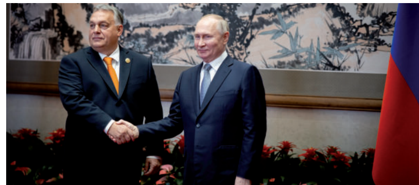
AZ ÉSZT KORMÁNYFÓ PL. NEM ÉRTI, HOGYAN LEHET EGY „BÜNZŐZŐNEK” KEZET NYÚJTANI

újabb szankciókat. (Már tavasz óta rendre felmerül, hogy az Egyesült Államok kormányközeli embereket tiltana ki Amerikából. Áprilisban a budapesti székhelyű, orosz hátterű Nemzetközi Beruházási Bank és magyar alelnöke került fel az amerikai szankciós listára.) „Szövetségesként tekintünk Magyarországra, de ugyanakkor látjuk azt is, hogy Magyaror-