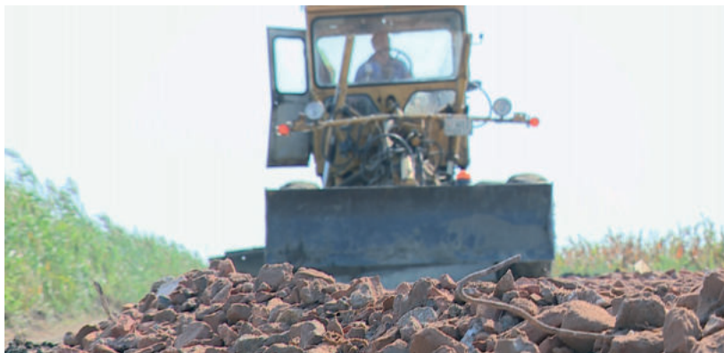
KÖZBEIKTATOTT FŐVÁLLALKOZÓ NÉLKÜL 18-SZOR OLCSÓBB A MUNKA