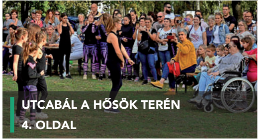
UTCABÁL A HŐSÖK TERÉN 4. OLDAL