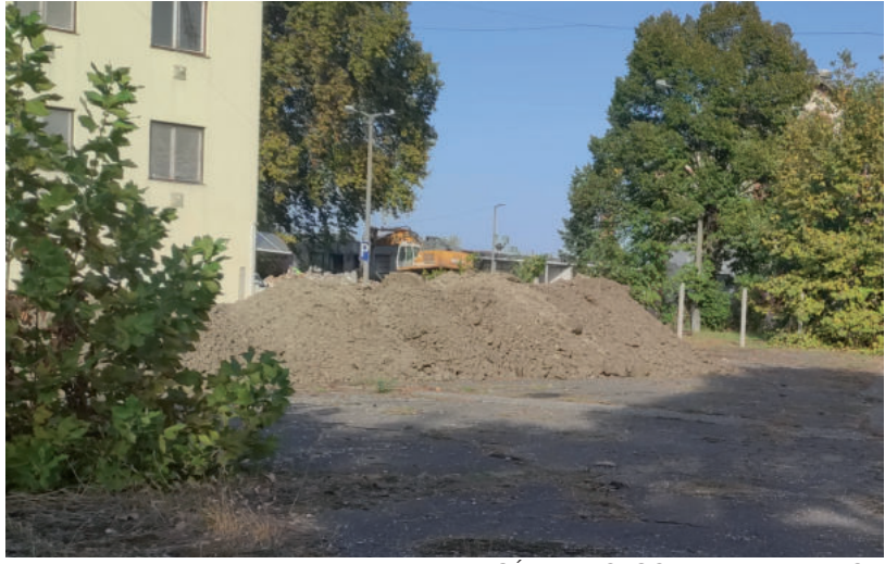
GÉPPEL DOLGOZNAK AZ UDVARON