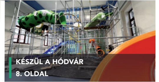
KÉSZÜL A HÓDVÁR 8. OLDAL