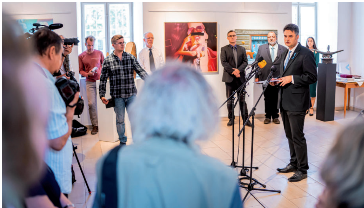
NAGY SAJTÓÉRDEKLŐDÉS KÍSÉRTE A LEGNAGYOBB VIDÉKI TÁRLAT MEGNYITÓJÁT