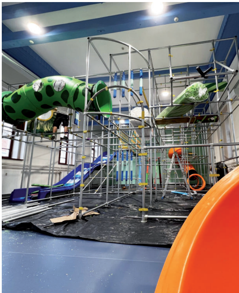
ÉPÜL A HÓDVÁR JÁTSZÓHÁZ ÓRIÁSI JÁTSZÓRÉSZE