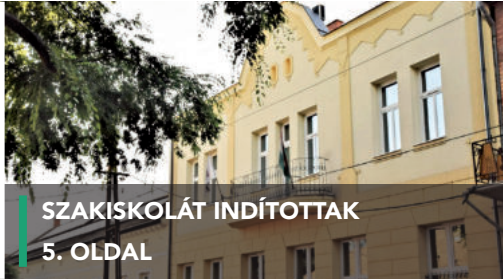
SZAKISKOLÁT INDÍTOTTAK 5. OLDAL