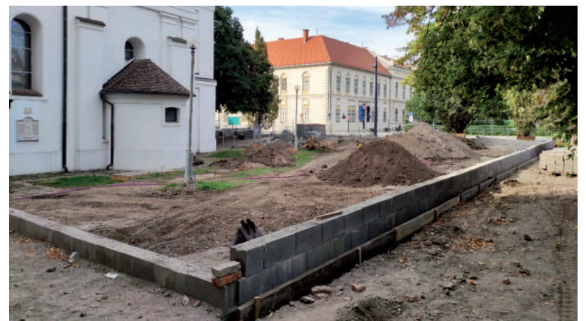
A RÉGI TÁMFAL NYOMVONALA MÁR JÓL LÁTSZIK

A 200 millióba kerülő munkálatok a tervek szerint jövőre fejeződnek be. ■