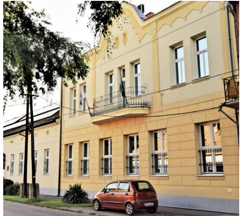
TÍZ GYEREK KEZDTE MEG SZAKISKOLAI TANULMÁNYAIT A KLAUZÁL UTCÁN

A szakiskola a tanulásban akadályozott, autizmussal élők és pszichés fejlődési zavarral küzdők számára jött létre. Értelmileg akadályozottakat jelenleg nem fogadnak – azt ellátja a városban más intézmény -, viszont erre is van igény a szülők részéről, tehát lehet, hogy a későbbiekben ilyen irányban is bővülni fognak. A következő tanévtől tervezik, hogy nyitottá válik az iskola olyanok részére, akik korábban nem az Aranyossyban tanultak,