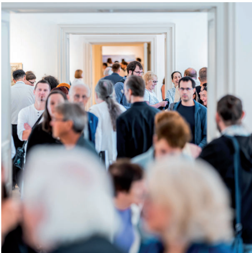
RENGETEGEN JÖTTEK EL A 69. ŐSZI TÁRLATRA