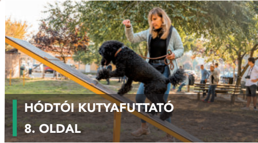
HÓDTÓI KUTYAFUTTATÓ 8. OLDAL