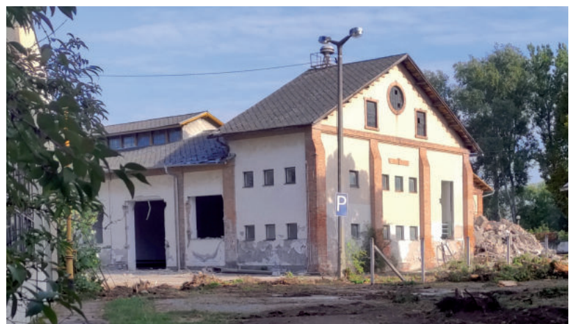
A RÉGI ÉPÜLETEK MEGMARADNAK, A 60-AS, 70-ES ÉVEKBEN KÉSZÜLTEKET BONTJÁK LE

Azt lehet az építkezésről még tudni, hogy a telken csak a régi épületek maradtak meg, a hatvanas-hetvenes években készült irodaházat, a szolgálati lakásokat, a volt garázst és az egyéb építményeket teljesen lebontják. ■