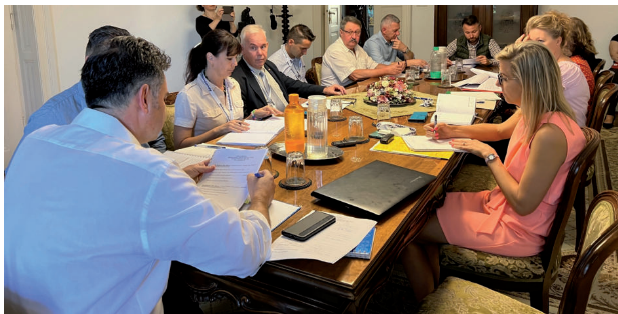
A BENNMARADÓK MÉG NEM TUDJÁK, HOL LEGYEN A HTKT ÚJ SZÉKHELYE (KORÁBBI FELVÉTEL)