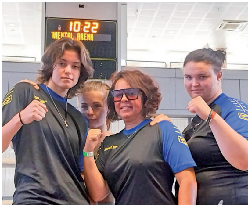
KIVÁLÓAN SZEREPELTÉK A VÁSÁRHELYIEK