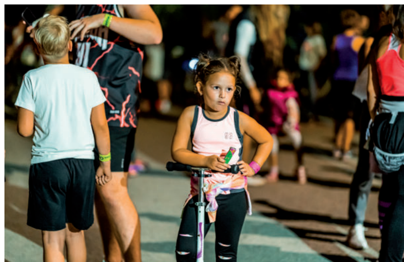
KICSIK ÉS NAGYOK IS CSATLAKOZTAK A JÓTEKONYSÁGI FUTÁSHOZ

Miután mindenki beért a célba és felfrissült, még tombolat sorsoltak, majd ki kétlábton, ki kétkezőn, néhányan pedig négykezőn tették meg a visszautat hazafelé. ■