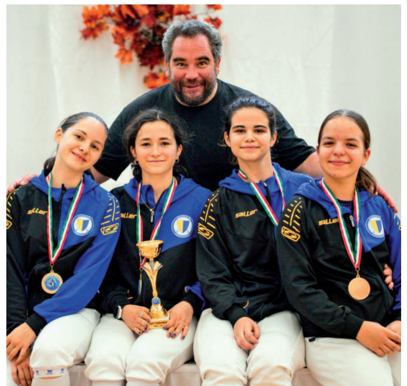
ARANYÉRMES LETT A NŐI TÖRCSAPAT

A lányokkal egyidőben a férfi párbajtőrözőik is pástra álltak, ők a 10. helyen végeztek. ■