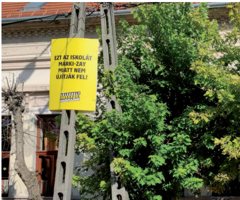
A FÉLREVEZETŐ MOLINÓKAT, TÁBLÁKAT AZÓTA ELTÁVOLÍTOTTA