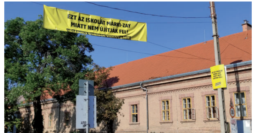
HÁROM ISKOLA KÖRÜL HELYEZETT KI A HELYI FIDESZ HAMIS ÁLLÍTÁSOKAT TARTALMAZÓ MOLINÓKAT AZ ÉJ LEPLE ALATT

KÖZÖSSÉG • Egy kisfiúért futottak és egy sikert ünnepeltek szombat este Kishomokon