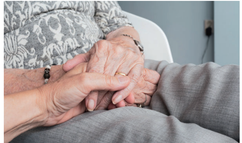
AZOK AZ IDŐSEK KÉRVÉNYEZHETIK, AKIKNEK NYUGDÍJA KEVESEBB MINT 142 500 FORINT

Fontos, hogy legyen a kérvényezőnél bankszámlaszám, lakcímkártya, személyi igazolvány