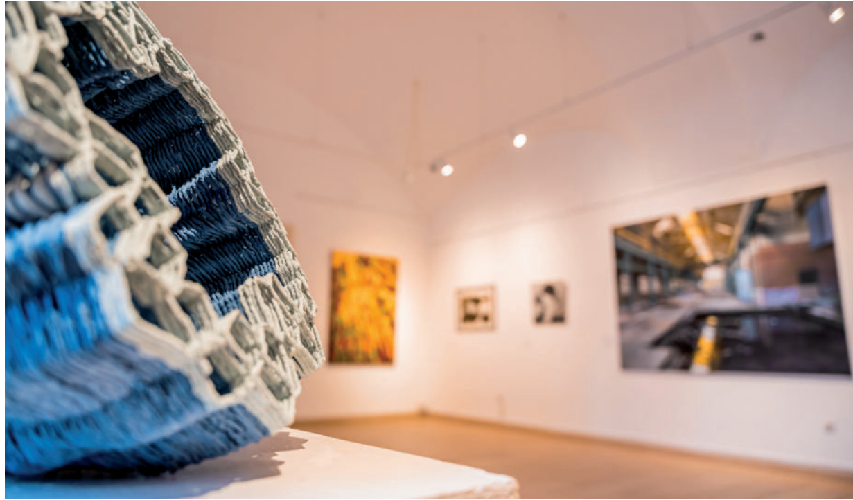
ÖSSZEHANGOLTÁK A TERMÉSZETES ÉS A MESTERSÉGES FÉNYEKET, HOGY A LÁTOGATÓK SZÁMÁRA TÖKÉLETES LEGYEN A VÉGEREDMÉNY

A nagy hagyományú kiállításra félézer művet regisztráltak, ebből válogatta ki a zsűri azt a 174 műalkotást, amelyek a 2023-as kiállítás anyagát adják. Az immár hatvankilencedik tárlaton 139 művész alkotásait láthatja majd a közönség: összesen 89 festmény, 49 grafika, valamint 30 plasztika és hat egyéb kategóriájú alkotás kap helyet a kiállítóhely földszinti termeiben. Nátyi Róbert, kurátor, művészettörténész koncepciója az volt, hogy a korábbiakhoz képest 30-40 darabbal kevesebb munka kerüljön bemutatásra, mert így azok nagyobb autonómiát kaphatnak. A művészettörténész szerint így van egyfajta szellőség, van egy jó érzés, amikor belépünk, természetesen ennek ára van, hiszen szigorúnak kellett