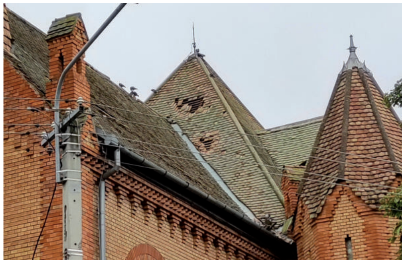
JÓL LÁTSZIK, HOGY A CSEREPTETŐ KOMOLYAN MEGSÉRÜLT AZ AUGUSZTUSI VIHARBAN

A tetőszerkezet tatonóg lyukakat még az augusztusi vihar okozta. A közgyűlés döntésének