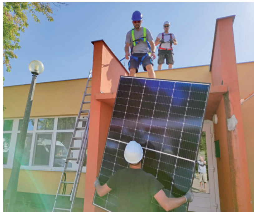
ÖSSZESEN 55 NAPELEM TÁBLA KERÜLT FEL A KÉT BÖLCSÖDÉRE

A városnak az a terve, hogy az óvodákat is ellátják napelemtablettákkal. ■