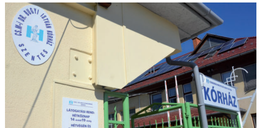
TÖBB HELYEN IS BEZÁRTAK SZÜLÉSZETI OSZTÁLYOKAT AZ ORSZÁGBAN, A SZENTESI IS ERRE A SORSRA JUTOTT

Amíg Szentesen nem nyit újra a szülészeti osztály, addig Szegeden, esetleg Hódmezővásárhelyen van szülészeti ellátás. Utóbbi sürgős esetben is, illetve befogadó nyilatkozat birtokában ellátja a kismamákat. A portálnak az egyetem azt is írta, hogy külön a szülészeti és nőgyógyászati ellátások megyei szervezésével megbízott vezető szeptember 1-én kezdte meg a munkáját, aki folyamatosan dolgozik azon, hogy megyén kívüli, vagy nem a közellátásban dolgozókat vonjon be az ellátásba. ■