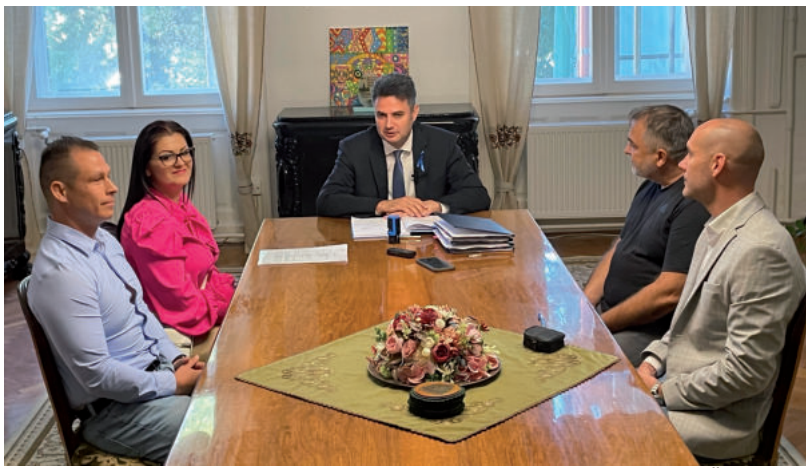
A POLGÁRMESTER ÜNNEPÉLYES KERETEK KÖZÖTT ÍRTA ALÁ A SZERZŐDÉSEKET

Végre megépülhet a hányattott sorsú egykori nyilvános WC helyére az építészeti stílusban odaillő kávéházi pavilon is. Ez az a főtéri WC, amelyre annak idején a fideszes városvezetés jelzalogot tetetett. A Kossuth téri kávézó megépítését az Épker Expert Kft. nyerte el, 35 millió