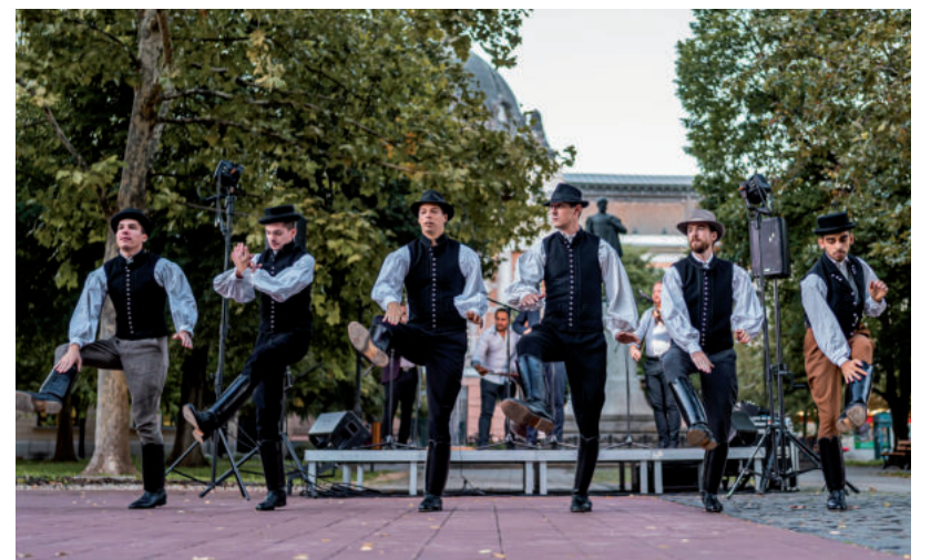
A MEGEMLEKÉZÉSEN AZ ÁRENDÁS NÉPTÁNCGYŰTTES A SERGŐ ZENEKAR ZENÉJÉRE ROPTA

A megemlékezésen közreműködött az Árendás néptáncgyűttes és a Sergő zenekar. ■