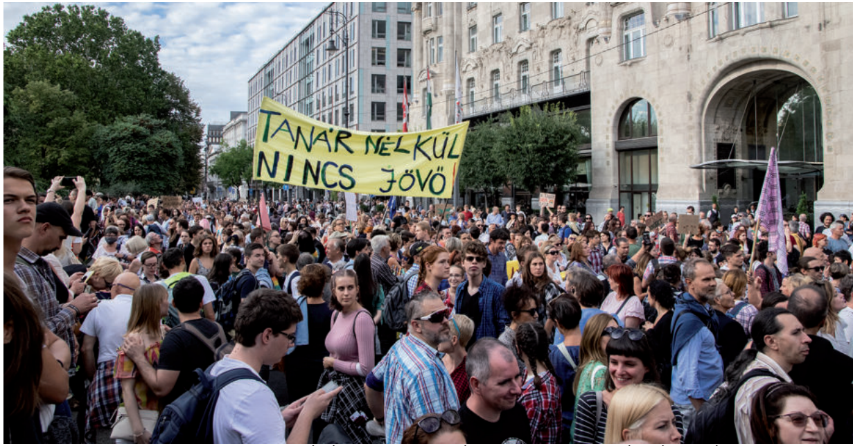
NAGYJÁBÓL 12 EZER NYUGDÍJAS FEDHETI EL A TANÁRHIÁNYT.