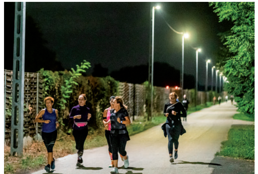
A KIS LEVIÉRT FUTOTTAK

– Szeretünk jótekonnykodni, a futók sokszor vesznek részt ilyen eseményeken. Erről az eseményről nem tudtunk sokat, de úgy gondoltuk, mozogni amúgy