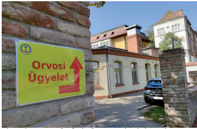
SÁRGA TÁBLA JELZI A SÜRGŐSSÉGI ÜGYELET BEJÁRATÁNÁL, HOVÁ KELL MENNI

A telefonszám a teljes ügyeleti időszakban, hétköznap 16 óra és másnap reggel 8 óra között,