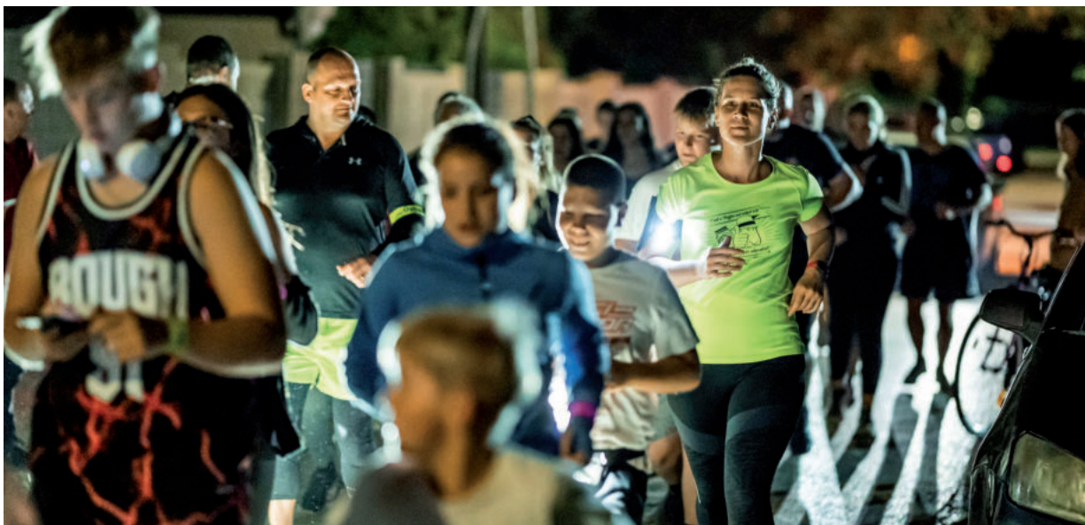
KÖZEL SZÁZAN FUTOTTAK VAGY BICIKLIZTEK A SZIKES UTCÁTÓL A KÖKÉNYDOMBI CSÁRDÁIG

Szinte szünet nélkül folytatódott a szombati egész napos szüreti mulatság az éjszakai jótekönyös futással szeptember 30-án Kishomokon. A Hirtelen zenekar esti koncertje alatt már sokan összegyűltek, hogy ki futva, ki biciklizve avassa fel a Szegedi utca mentén felújított