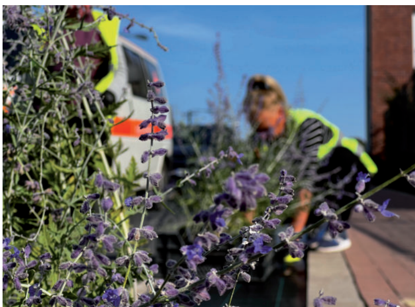
TÖBB UTCÁBAN IS ÉVELŐKKEL SZÉPÜL A VÁROS

A lakossági fogadóórákat a helyszínen a hivatal munkatársai segítik.