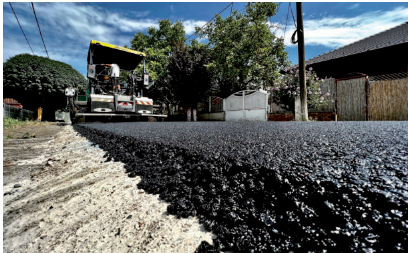
FÉLTUCAT UTCÁT ÚJÍTANAK MEG