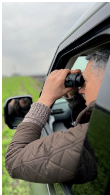
LÁZÁR JÁNOS MEGTEKINTI FÖLDJEIT

Ezúttal két kisebb földterületet is vásárolt Lázár János országgyűlési képviselő, miniszter, a batidai vadászkastély közelében, melyet egyébként is családtagjai földjei öveznek. A budapesti Horváth Ákos Miklós ügyvéd által készített és ellenjegyzett idén július 17-én kelt egyik adásvételi szerződés szerint Lázár János az állami földet kezelő Nemzeti Földügyi Központtól vásárolta meg a 4 605 000, azaz négy millió-hat százötzezer forintért a Nemzeti Földalapba tartozó Hódmezővásárhely külterület 01666/1. helyrajzi számú 3,8459 hektár 29,97