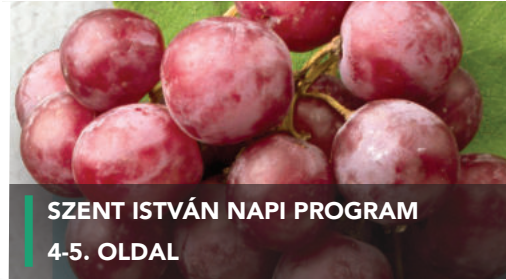
SZENT ISTVÁN NAPI PROGRAM 4-5. OLDAL