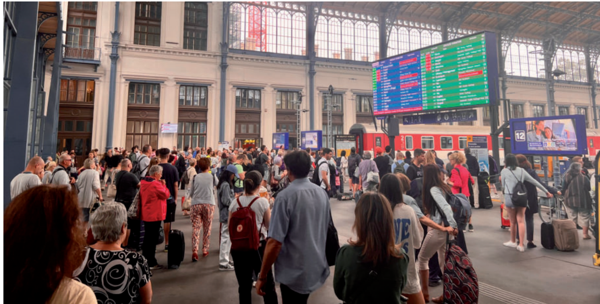
ÖSSZEOMLÓBAN A TÖMEGKÖZLEKEDÉS, MIKÖZBEN A KIJELEZŐKÖN A VÁRMEGYEBÉRLÉK REKLÁMJA FUT

Mintha tüvel szurkálták volna az ember bőrét. Olajos gőz robbant! – így emlékezett vissza egy túlélő, aki az elmúlt hónapok egyik vonatbalesetében sérült meg. Július elején Hodásznál okozott több utasnak égési sérüléseket egy motorvonat tartályából kiáramló gőz. A sérültek között volt egy 13 éves kislány is. Alig néhány nap múlva egy ve-