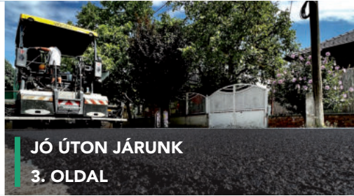
JÓ ÚTON JÁRUNK 3. OLDAL