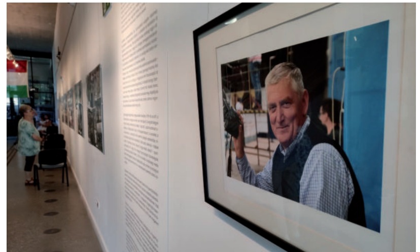
SZÁZAK EMLÉKEZTEK A VÁROSI SPORT KRÓNIKÁSÁRA

- Nagyon hiányzik Vásárhely sporttörténetének meghatározó krónikása, tevékeny, rendkívül tájékozott sportszervező, kö-