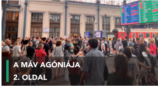
A MÁV AGÓNIAJA 2. OLDAL