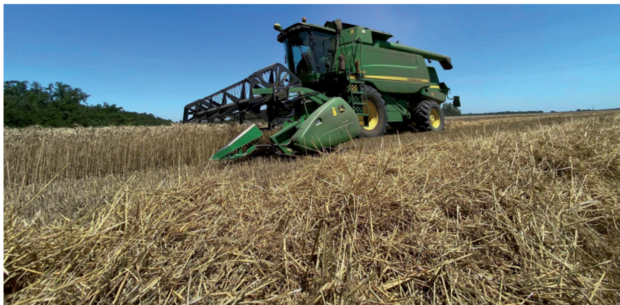
AZ ÖNKORMÁNYZAT KÖLTSÉGVETÉSÉT A MEGSZÜNTETÉS NEM ÉRINTI

A mai napig amúgy közel 26 millió Ft folyt be földadóból a vásárhelyi önkormányzathoz. Ebből több mint 1 millió Ft-ot már kifizettek segélyként, olyan alacsony jövedelemmel rendelkező személyek részére, akiknek