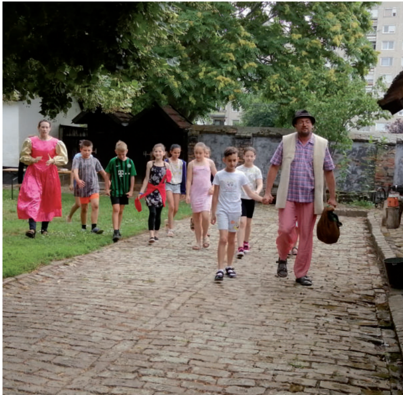
INTERAKTÍV MESEELŐADÁS A ROMA TÁBORBAN