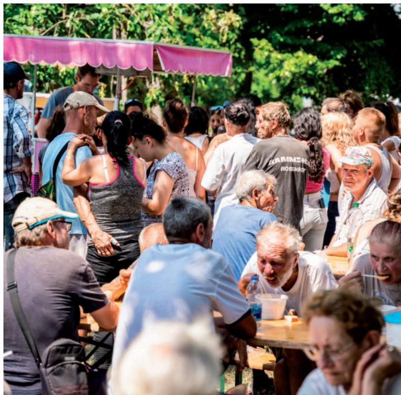
VOLT OLYAN ALKALOM, AMIKOR FAGYI IS JÁRT AZ ÉTEL ÉS JÓ SZÓ MELLE

Következő alkalommal a Csúcsi Olvasókör épületében lesz ruha- és ételosztás augusztus 13-án, a megszokott menetrend szerint: 11 órától ruhát lehet válogatni, 12-től pedig ebédelni. Azok, akik egészségi állapotuk miatt nem tudnak a helyszínen részt venni, de igényelnék az ételt és a jó szót, jelezzék legkésőbb szombat délutánig a 06704267475-ös telefonszámon. ■