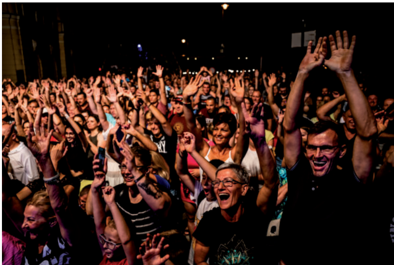
A SZERVEZŐK REMÉNYEI SZERINT IDÉN IS MINDENKI JÓL ÉRZI MAGÁT