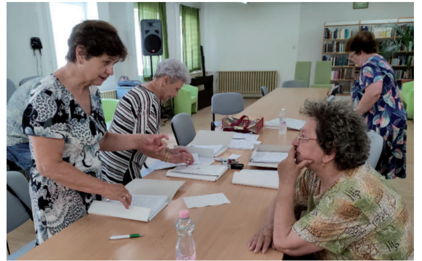
A SZÖVETSÉG TAGJAI A LEDCSERE PROGRAMOT IS SEGÍTETTÉK

A háztartásokban használt régi villanykörtek cseréjének igény-