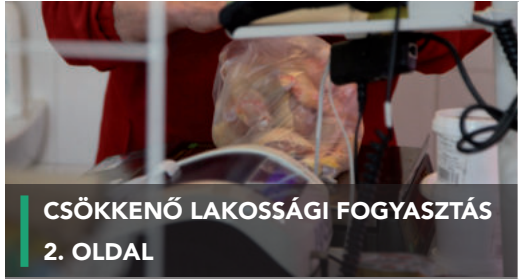
CSÖKKENŐ LAKOSSÁGI FOGYASZTÁS 2. OLDAL