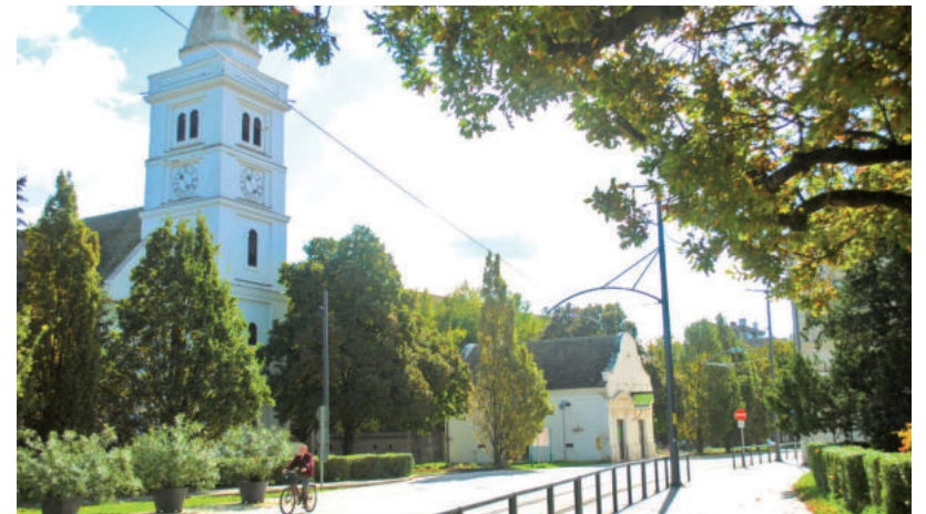
A MAGTÁR ÉS AZ ÓTEMLPOM KÖRÜL IS MEGÚJUL A TÉR

KÖZGYŰLÉS • 750 millió forinttal nőtt az adóbevétel, 250 új lime, városkártya-, Prizma Food bővítés