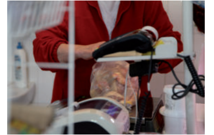
A VÁLASZTÁSOK ELŐTTI PÉNZSZŰRÉS MEGLÖKTE A BOLTOK FORGALMÁT, AM IDÉN LÁTVÁNYOS A VISSZAESÉS

A gazdaság mérőszámairól azt mondta, a növekedés idén lassul, másfél százalék lesz, de a fontos a szerkezete, a nettó export emelkedik, ez húzza a GDP-t, de a fogyasztás visszaesik az infláció miatt. „Ami meglepetés, hogy a fogyasztás jobban visszaesik, mint gondoltuk, két számjegyű már, ezért ez egy fogyasztási csapdát jelent a növekedés visszaesésében. A háztartások kevesebb élelmiszert vásárolnak, minőséget is lefelé váltanak, és ezek a tendenciák nem jók, ezért is reagált