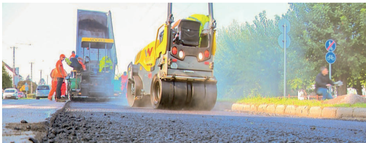
TÖBB UTCA MEGÚJULHAT A 425 MILLIÓS KERETBŐL, A BORDÁS UTCA LEHET AZ ELSŐ. A KÉP ILLUSZTRÁCIÓ

A bevételi és kiadási főösszeg 19 milliárd 500 millió 102 ezer forintra módosult. A költségvetés módosítását, majd ezt követően, a vita után, az önkormányzat vagyongazdálkodását