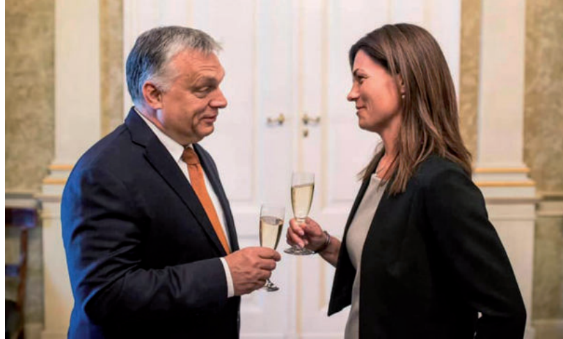
VARGA UTÁN GYORSAN TALÁLT ÚJ MINISZTERT ORBÁN VIKTOR.