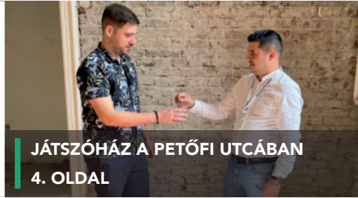
JÁTSZÓHÁZ A PETŐFI UTCÁBAN 4. OLDAL