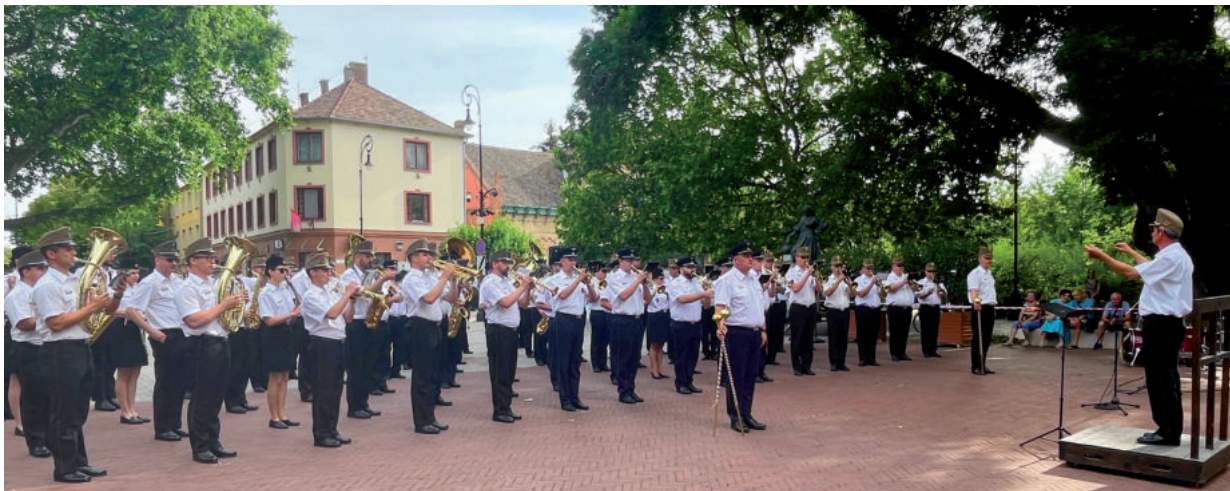
HOSSZÚ IDŐ UTÁN A KATONASÁG ISMÉT EGYÜTTMŰKÖDÖTT AZ ÖNKORMÁNYZATTAL