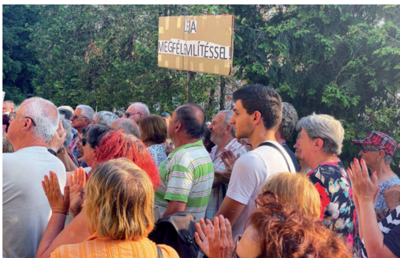
TÖBB MINT KÉTSZÁZAN VETEK RÉSZT A TÜNTETÉSEN

fel Lázárt, mondván: „Aki ilyen zsaroló kijelentést tesz és egy közösséget fenyeget meg, nem maradhat a helyén” A tüntetés közösségi médiában közzétett meghívójában ez volt olvasható: Mostantól nem lehet kérdéses, hogy: - ki miatt nem kaptunk egy fillér rezsitámogatást sem (egyetlen megyei jogú városként), - ki miatt nem kapott a vásárhelyi uszoda támogatást (ahol Lázár úr gyermeke is sportol), - ki miatt nem nyílt meg meg a vásárhelyi McDonald's, - ki miatt állították le a vásárhelyi iskolák fejlesztését, és még sorolhatnánk. Egy valódi jogállamban és demokráciában elképzelhetetlen, hogy csak azért vonjanak el támogatásokat egy város teljes lakosságától, mert nem kormánypárti, hanem egy korrupcióellenes politikust választanak. A hasonló zsarolások miatt esik el Magyarország teljes lakossága az uniós támogatásoktól is – ha valaha is szabad, békés, gazdagodó országban szeretnénk élni, LÁZÁR JÁNOSNAK LE KELL MONDANIA! ■