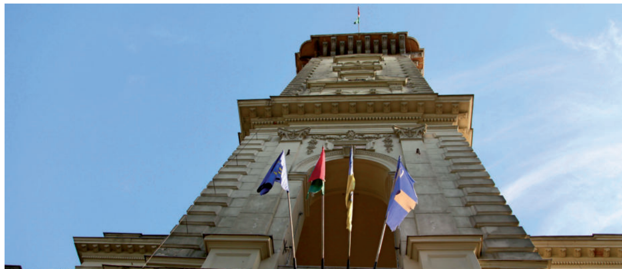
CSÖKKENTIK EZ ELŐDÖK ADÓSSÁGÁT ÉS KÖZBEN FEJLŐDIK A VÁROS

A költségvetés módosításával kapcsolatosan a közgyűlésen elhangzott, hogy a fő változások