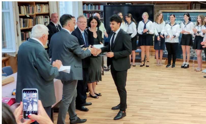
VÁSÁRHELY MINDENKIT VISSZAVÁR