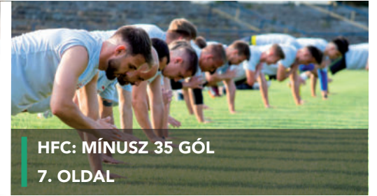
HFC: MÍNUSZ 35 GÓL 7. OLDAL