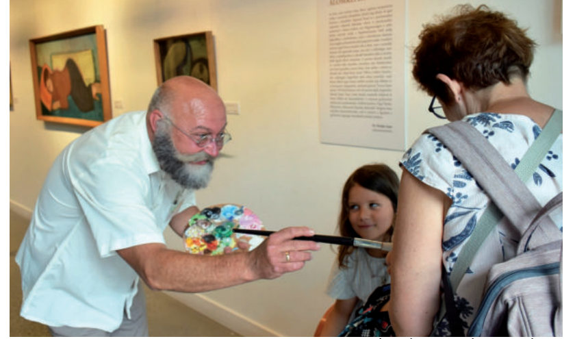
A TORNYAIBAN MAGA BENCZÜR VÁRTA A LÁTOGATÓKAT