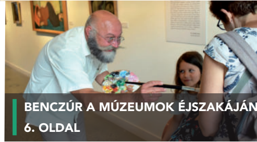
BENCZÚR A MÚZEUMOK ÉJSZAKÁJÁN 6. OLDAL