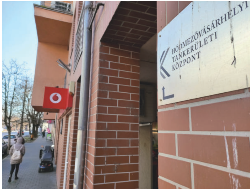
A BÉREN KÍVÜLI JUTTATÁSOKBÓL IS TÖBB JUT A KÖZPONTNAK

A 2022-es költségvetési beszámoló szerint összesen 1230 pedagógus dolgozott a tankerületi fenntartás alá tartozó közoktatási intézményekben. Ehhez képest idén, a 2023. évi elemi költségvetés 1249 pedagógus foglalkoztatásával kalkulál az állami általános iskolákban és gimnáziumokban. A pályakezdő – gyakornok – pedagógusok száma 62-ről 56-ra csökken az idei büdzsé szerint, több lesz viszont a pályán legmagasabban jegy-