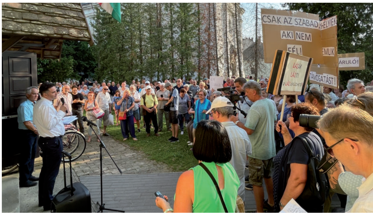
A FIDESZ-IRODA ELŐTT TŰNTETTEK