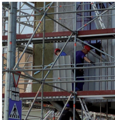
JÚNIUS VÉGÉN ELKEZDŐDTEK A MUNKÁK

A munkához június 22-én kezdtek neki, most az látszik, hogy alumínium lapokkal kezdték el beborítani az új épületrész felületét, erre szerelik majd vissza a fémlemez borítást. ■