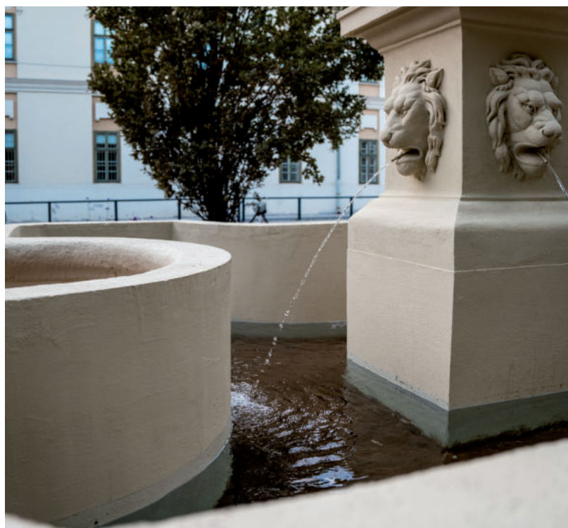
A BELVÁROSBAN AZ ELSŐ ÜTEMBEN A BAKAY KÚT ÉS KÖRNYÉKE ÚJULT MEG

A villamosvonal mellett is zöldítenek majd, és a Sarokház