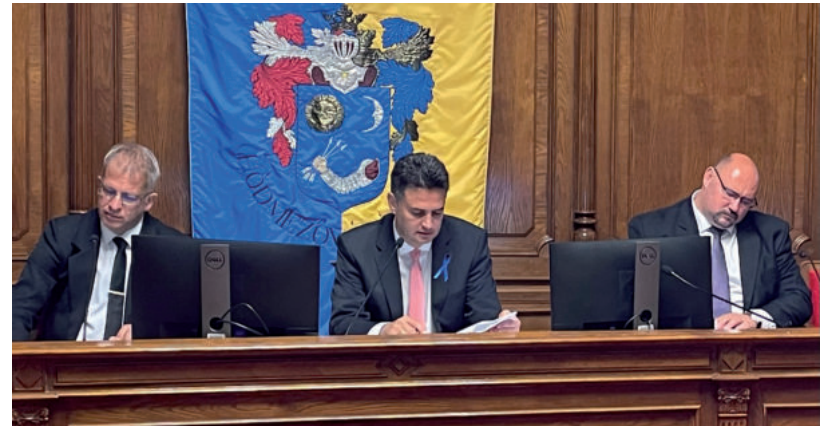
A JÚNIUSI KÖZGYŰLÉSEN DÖNTÖTTEK, A FIDESZESEK IS MEGSZAVAZTÁK

„A döntés értelmében minden hódmezővásárhelyi honvédelmi egységben szolgálatot teljesítő honvéd súlyos, illetve maradandó sérülése, esetlegesen annak kialakuló fogyatékosága esetén a honvéd részére,