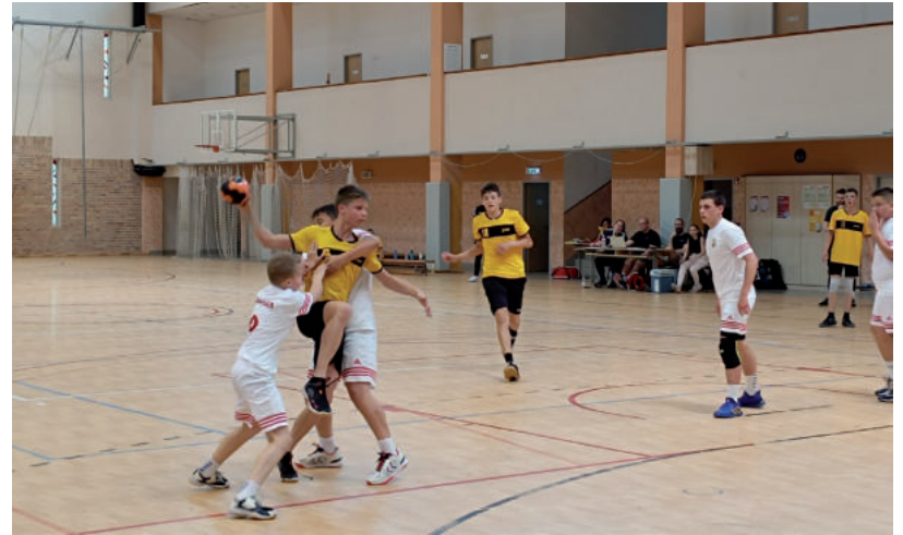
AZ EDZÉSEK BÁRKI SZÁMÁRA MEGTEKINTHETŐEK

„Én először is embert szeretnék nevelni belőlük. A mai társa-