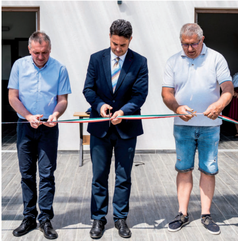
A BERUHÁZÁS MŰSZAKI VEZETŐJE, A POLGÁRMESTER ÉS A HELYI KÖZÖSSÉG KÉPVISELŐJE VÁGTÁK ÁT A NEMZETI SZÍNŰ SZALAGOT