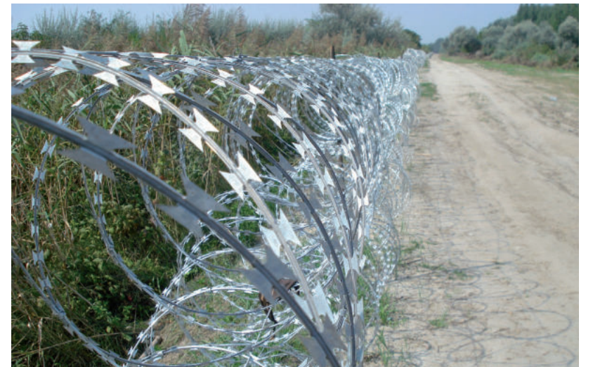
A MIGRÁNSOKKAL KEMÉNYEBBEN BÁNIK A KORMÁNY, MINT AZ EMBERCEMPÉSZEKSEL

Az osztrák külügy magához rendelte a magyar nagykövetet, Schallenberg az EU-s külügyminiszterek brüsszeli csúcstalálkozója előtt újságíróknak azt mondta, a magyar nagykövetnek tisztáznia kell a helyzetet a fennálló vitában. Úgy fogalmazott: „Azt gondoljuk, hogy ennek nagyon rossz üzenete van.” A magyar külügyminiszter, Szijjártó Péter szerint nincs gond azal, hogy Magyarország szélnek ereszt elítélt bűnözőket. Azt nyilatkozta a mintegy 2600 elítélt szabadon engedése kapcsán, hogy „én úgy fogom fel, hogy mi külföldi bűnözőket utasítunk ki az országból és jobb is, hogy-