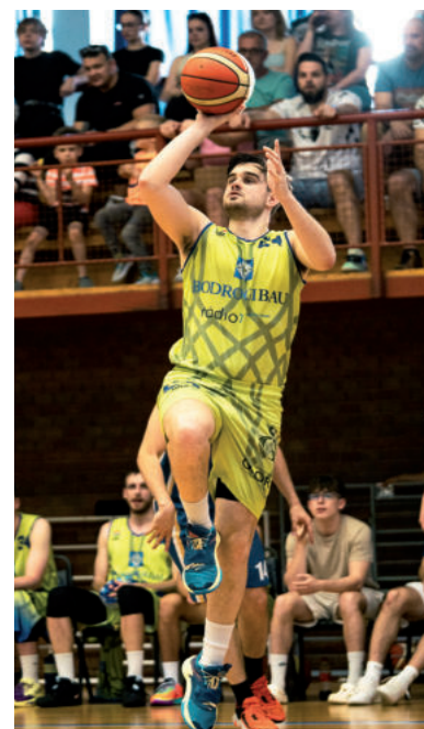
350 NÉZŐ SZURKOLT A HÓDTÓI SPORTCSARNOKBAN A KOSÁRSULINAK