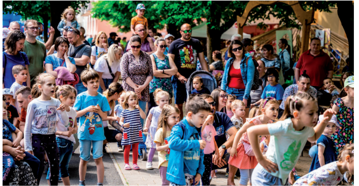
KICSIK ÉS NAGYOK IS EGYARÁNT JÓL SZÓRAKOZTAK A VÁROSI GYEREKNAPON