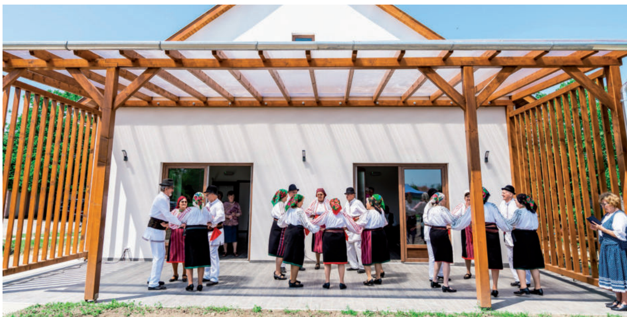
A SZÉPKORÚAK MOLDAVI TÁNCOKAT JÁRTAK AZ ÁTADÓ ÜNNEPSÉGEN