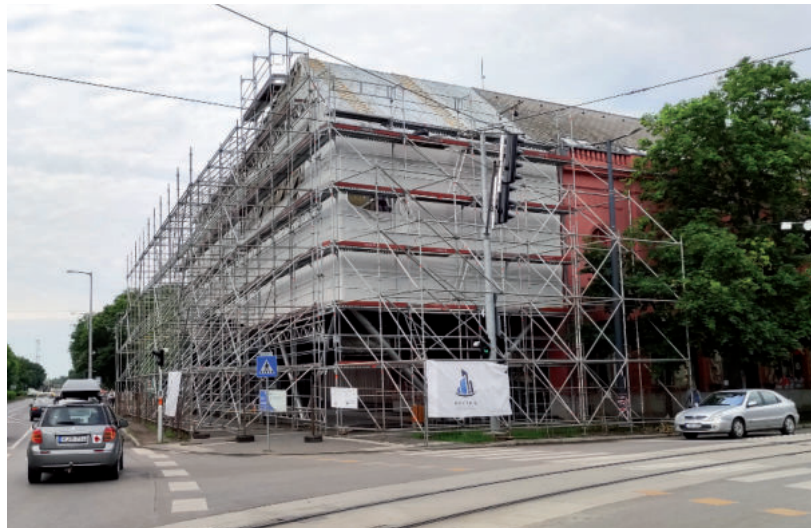
AZ IDEI HARMADIK NEGYEDÉVRE ÍGÉRIK A HELYREÁLLÍTÁST