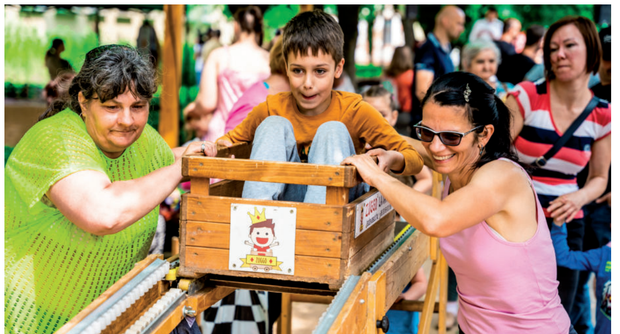
MINDEN JÁTÉK MOSOLYT CSALT A GYEREKEK ARCÁRA.

A gyermekek örömet az ingyenes ugrólóvár és az ajándék vattacukor is fokozta. ■