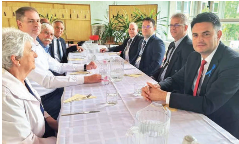
EGYES KÉPVISELŐK MEGKÖSTOLNI NEM, CSAK KRITIZÁLNI HAJLANDÓAK