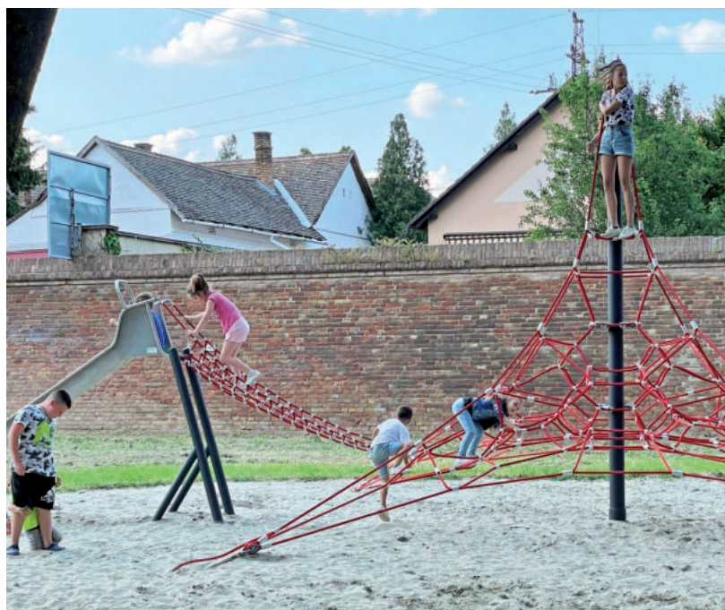
AZ ÚJ KÖTÉLPYRAMIS NAGY SIKERNEK ÖRVEND

A mintegy 15 millió forintos beruházás nyomán elbontották a régi, művészek által készített hinták és átalakításra került a „János Vitéz” fantázia névre hallgató csúszdás játszóeszköz. Mindkét játék egyedileg gyártott művészi alkotás volt, de nem felelt meg a most hatályban lévő jogszabályi előírásoknak. A vár része felújításra került, a csúszdalapot leszereltették róla, és különleges funkciót álmodtak meg neki. A vár belsejébe polcokat szereltek, ebben lehet tárolni azokat az apróbb játékokat, amiket a játszótéren játszó gyermekek közösen használhatnak. Ezt az ötletet egy lakos javasolta, a javaslatot pedig éppen a polgármester felesége továbbította a hivatal munkatársainak.