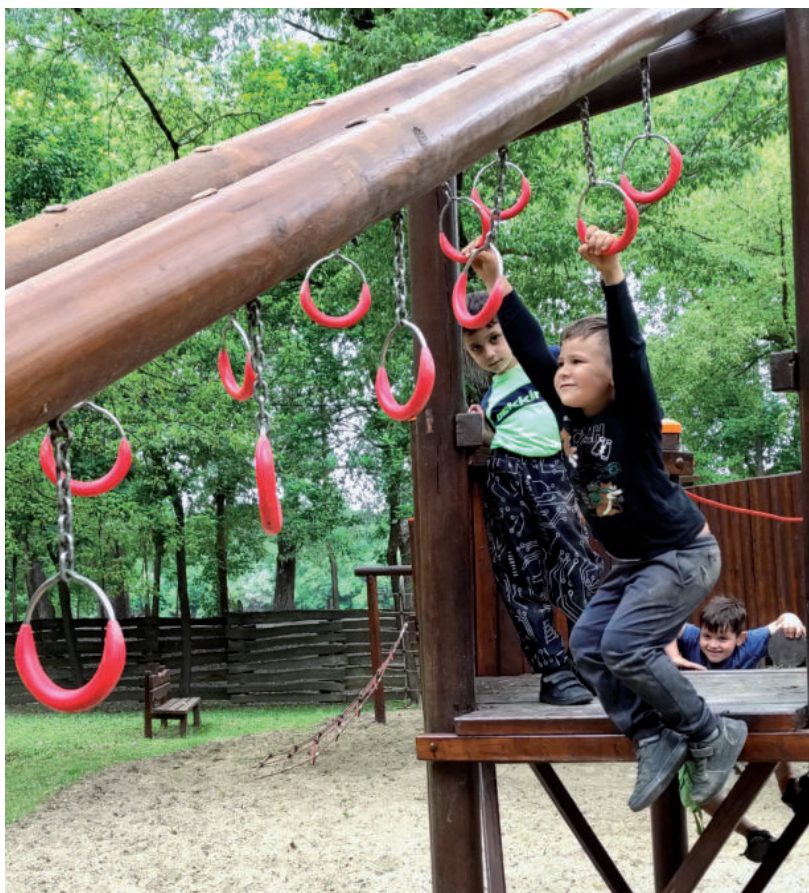
VÁSÁRHELYI ÓVODÁSOK VOLTAK AZ ELSŐ LÁTOGATÓI

A szúnyoggyérítést folyamatosan végzi a város, a szúnyogok mennyiségétől függően hetente-kéthetente. A kémiai és biológiai gyérítést összehangoltan Mártély önkormányzatával, azonos időpontokban végzik. ■