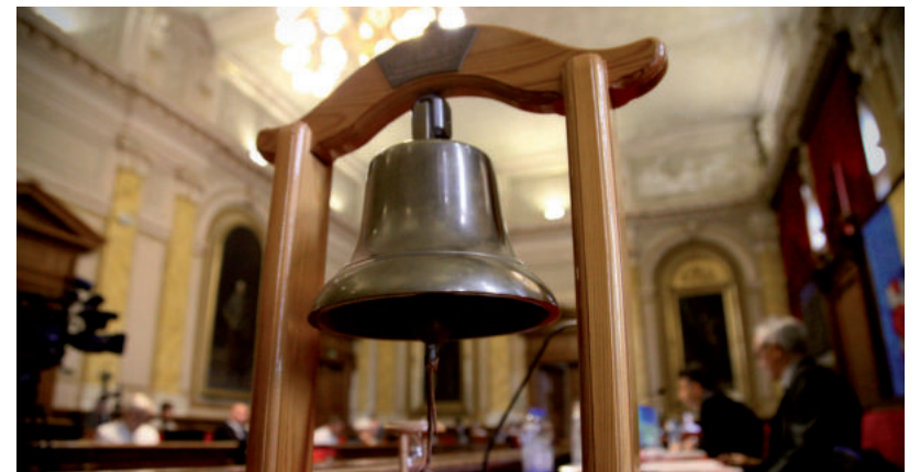
A POLGÁRMESTER NYITOTT ARRA, HOGY MINDEN INCIDENSRŐL BESZÉLJENEK A KÖZGYŰLÉSEN