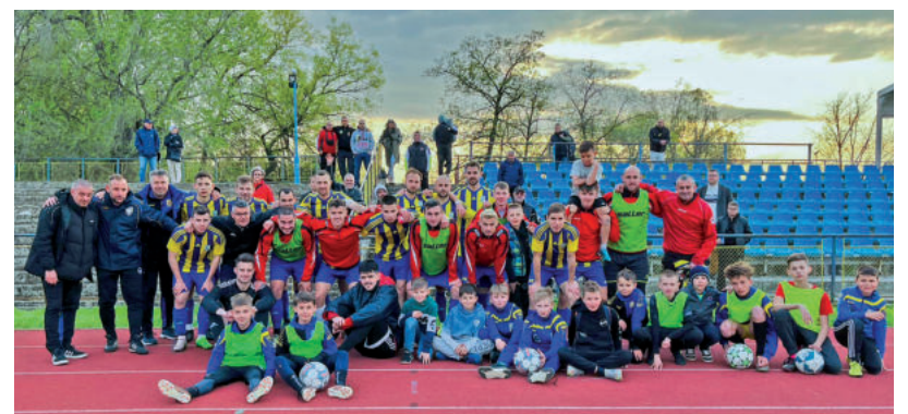
AZ EZÜSTÉREM MÁR BIZTOSAN MEGVAN, DE MÉG ARANYÉRMESEK IS LEHETNEK A VÁSÁRHELYIEK