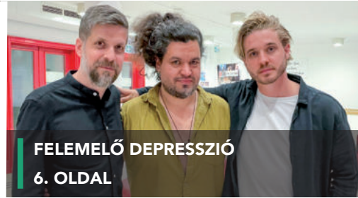
FELEMELŐ DEPRESSZIÓ 6. OLDAL