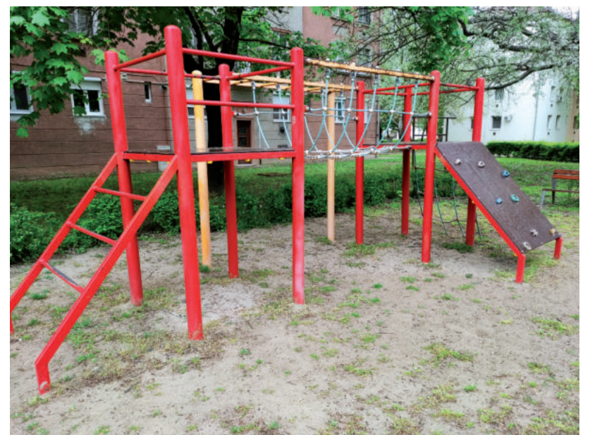
A JÁTSZÓTÉREN EDDIG SEM VOLTAK, DE MÁR A KÖRNYÉKÉN SINCSENEK RÁGCSÁLÓK