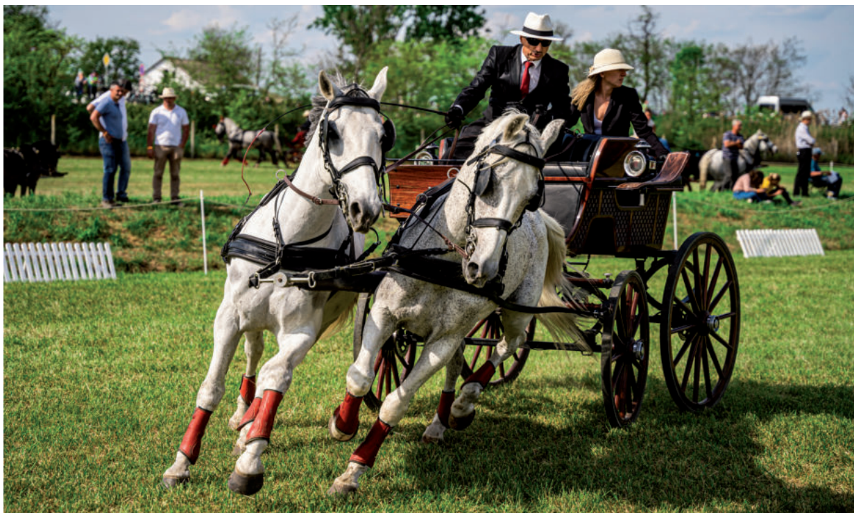
A FOGATHAJTÓ VERSENY VOLT A RENDEZVÉNY TALÁN LEGLÁTÁVNYOSABB PROGRAMJA