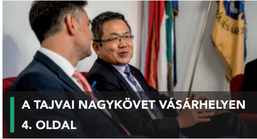
A TAJVAI NAGYKÖVET VÁSÁRHELYEN 4. OLDAL