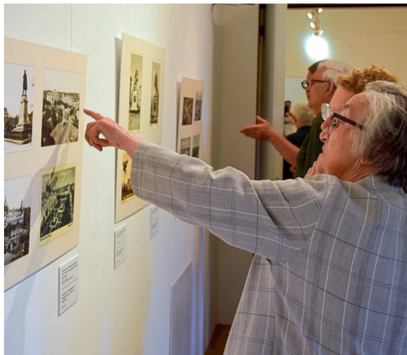
A KÉPESLAPOKON VÁROSUNK MÚLTJA FEDEZHETŐ FEL

Üdvözlöt Vásárhelyről címmel nyílt meg Máyer Jenő hagyatékából az a kiállítás, amely megmutatja, hogyan változott a város 1898 és 1944 között. A vásárhelyi születésű nyomdász szenvedélyesen gyűjtött mindent, ami Hódmezővásárhely történeti emlékei közé tartozik, így a képeslapokat is, amelyekből az adott időszakban több mint 1000 féle készült. Ezekből láthat az érdeklődő válogatást a Tornyai János Múzeum emeleti termeiben.