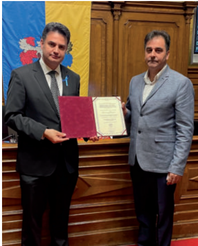
AZ ELISMERÉST MÁSODIK ALKALOMMAL ADTA ÁT A POLGÁRMESTER

Épületasztalos szakoktatóként dolgozott öt éven keresztül az egykori 602. számú Ipari Szakmunkásképző Intézetben, kamatoztatva hozzáértését, átadva tudását a fiataloknak. 2012 óta vállal közéleti szerepet közösségében, azóta a helyi Cigány Nemzetiségi Önkormányzat képviselője. Munkájával – a Hódmezővásárhely Megyei Jogú Város Cigány Nemzetiségi Önkormányzatának delegáltjaként – segíti a Szociálpolitikai Kerekasztalt. Az egyetlen roma származású tagja a szociális bérlakások odaítéléséről is döntő Lakásügyi Tanácsadó Testületnek. A közgyűlés szociális és egészségügyi bizottsága külső bizottsági tagja, s a Cigány Nemzetiségi Tanács tagja. A családi háttér meghatározó az életében. A legjobb tudása szerint, aktívan képviseli a vásárhelyi cigánység érdekeit.