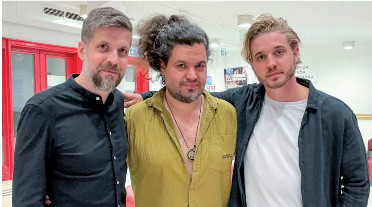
A HÁROM MŰVÉSZ, AKI FELIDÉZTE CSEH TAMÁST

elmondta, hogy nem emlékműsort csináltak, hanem egy olyan darabot, ami szeretne szólni valamiről, ami nem csak Cseh Tamás és Bereményi Géza, és az ő témáik, hanem amelyek most is aktuálisak.