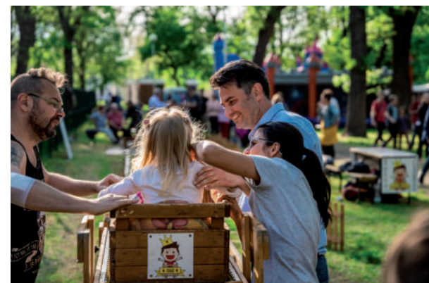
A LÁDÁK INDÍTÁSÁNÁL A FELNŐTTEK SEGÉDKEZTEK