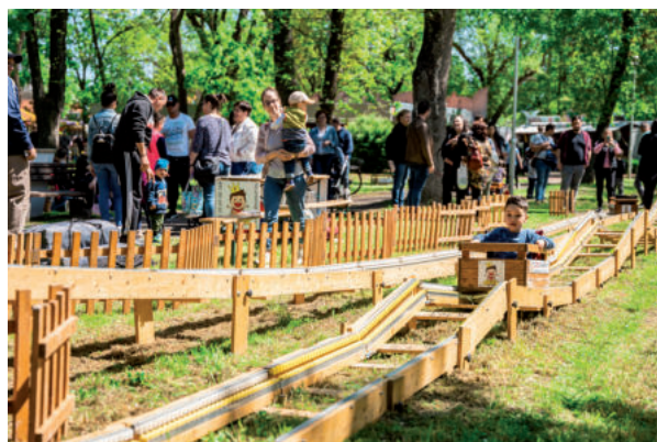
A LÁDAVASÚT NAGY SIKERT ARATOTT VÁSÁRHELYEN IS