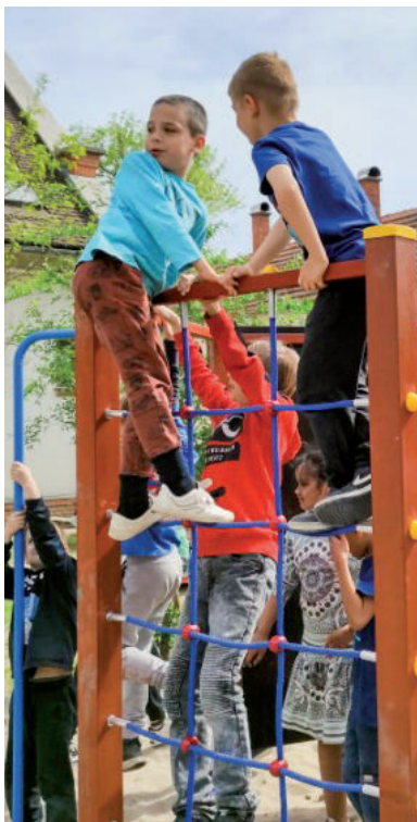
A LEGKISEBBEK AZ AVATÓ UTÁN AZONNAL KI IS PRÓBÁLTÁK A MÁSZÓKÁT

– Évek óta a báli bevételekből próbáltunk meg spórolni, gyűjteni a pénzt az új játékokra, ugyanis a régi játszóeszközök elavultak – tette hozzá az igazga-