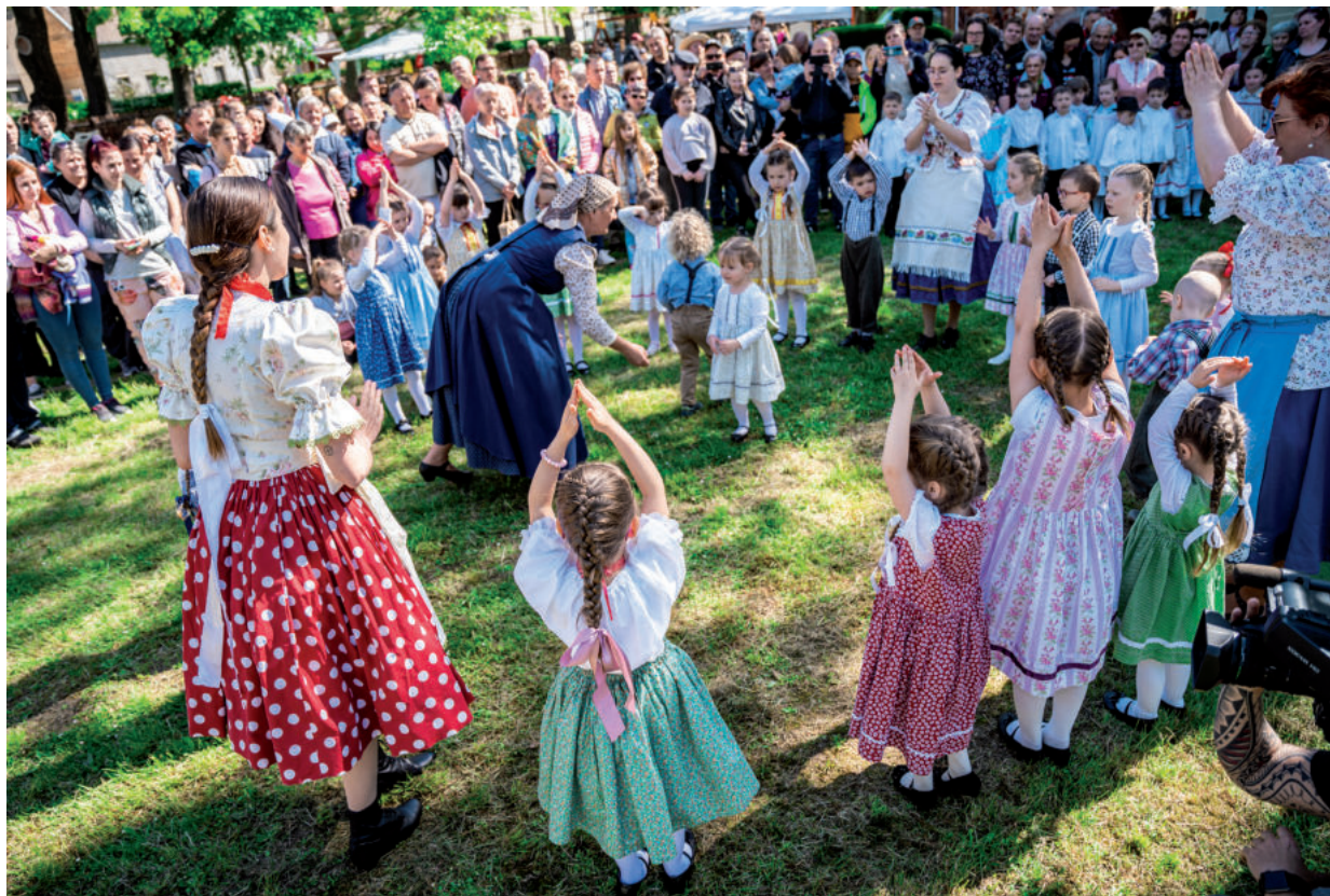
RAGYOGÓ IDŐBEN SOKAN VETTEK RÉSZT A NÉPKERTI PROGRAMOKON