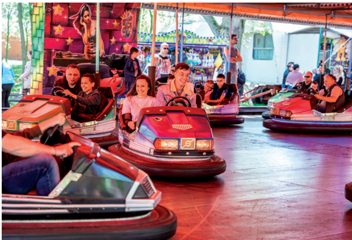
A DODGEM ÉVTIZEDEK ÓTA ELENGEDHETETLEN RÉSE A MAJÁLISNAK