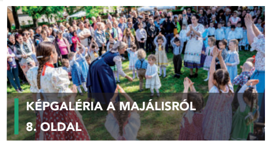
KÉPGALÉRIA A MAJÁLISRÓL 8. OLDAL