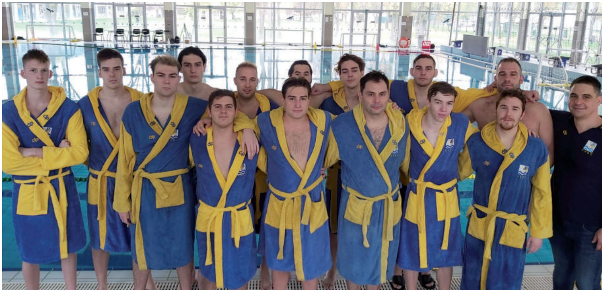
ÖSSZE MEG HETEDIK VOLT, AZ IDÉNY VÉGÉRE VISSZAESETT A GÁRDA

– Egyrészt hálával tartozom a HVSC-nek, mivel elsősorban nekik köszönhetem, hogy elkezdtem 2014-ben edzősködni,