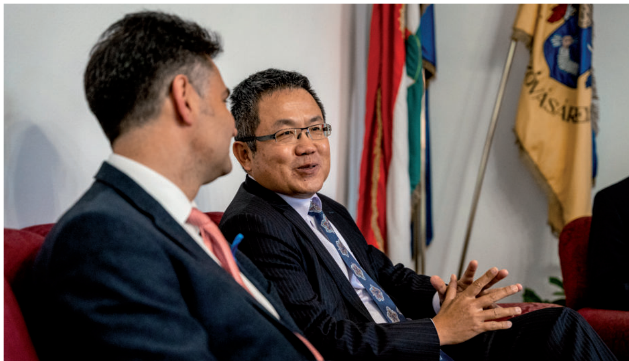
A POLGÁRMESTER FELVÁZOLTA, MIÉRT JÓ BEFEKTETNI VÁSÁRHELYEN

A tajvani delegációt is – mint minden más nagyköveti küldöttséget – a városházán fogadták, körbevezették az épületben, a díszteremben és az egykori polgármesterek portréit őrző „kis-tárgyaló”-ban. Ezután a mindenkori polgármester szobájában foglalnak helyet a vendégek, itt folytatják a megbeszéléseiket. Liu nagykövettel (akinek a Shih-chung a keresztnéve) a polgár-