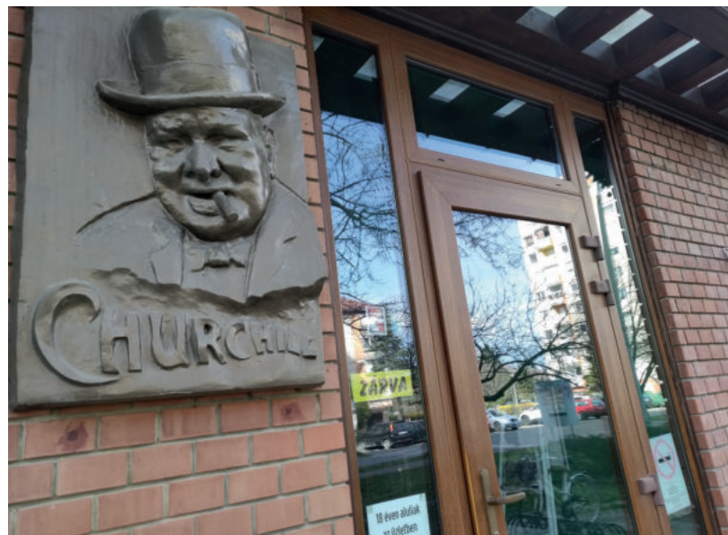
A POLITIKA SEGÍTETTE MEGNYITNI, DE NEM A POLITIKA MIATT ZÁRT BE VÉGLEG A CHURCHILL DOHÁNYBOLT