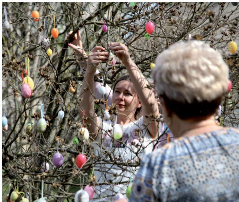
IDÉN A TOJÁSFA IS DRÁGÁBB LEHET

Húsvét mindig is egy rendkívül fontos ünnep volt Magyarországon, ezért hatását a kultúrában, a gasztronómiában és természetesen a gazdaságban is érzékeljük. Minden családnak megvannak a maga hagyományai, hogy mit esznek ilyenkor, ezek közül jó eséllyel a legtöbb