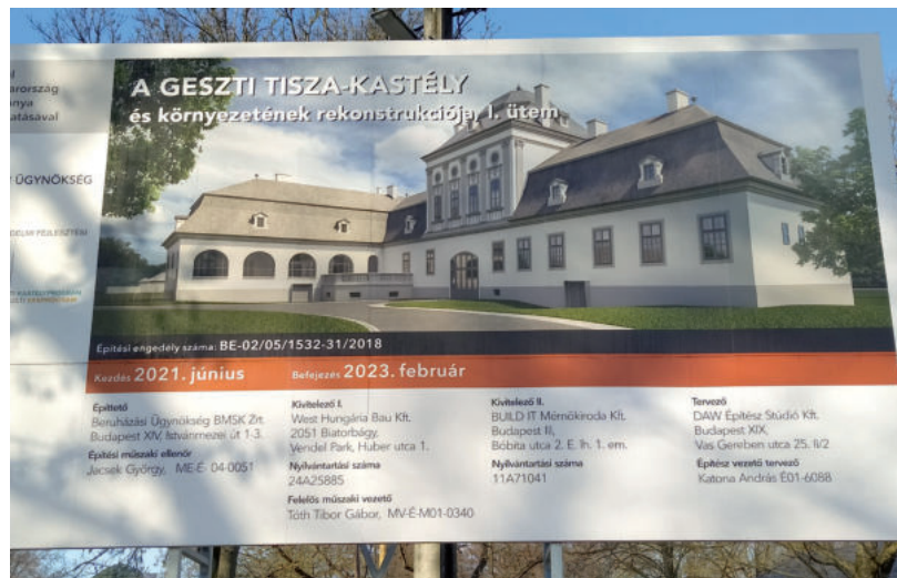
A GESZTI TISZA-KASTÉLY NEMHOGY 2020-RA, DE 2023. FEBRUÁRJÁRA SEM KÉSZÜLT EL.

A kormányfüggetlen sajtóban kiverte a biztosítékot, hogy 12 db közpénzből és uniós forrásból megmentett kastélyt egyszerűen ingyen odaadnak magánjogi szereplőknek. A HVG újságalmazott, Lázár János hívbérként osztogatná azokat. Közben egy másik kastély-ügy is szerepel a sajtóban, az Élet és Irodalom és korábban a Magyar Narancs írt arról, hogy a Békés megyében található geszti Tisza-kastély felújítása, amelynek 2019-ben lett kormánybiztos Lázár, folyamatosan csúszott és drágult a projekt a Fideszes politikus felügyelete alatt. Biztosi kinevezése után nem sokkal, 2019 októberének végén bejelentette, hogy a Tisza-kastélynak és parkjának felújítása 2020-ra elkészül. Nem így lett. A felújítási munkákat 6-6,5 milliárd forintba becsülték, de mire elbírálták a közbeszerzési pályázatot, már 7 milliárd forintot szántak rá. Az Orbán-kabinet aztán tavaly ősszel a geszti Tisza-kastély felújításának I. ütemére szánt forrásokat 6,9-ről közel 11 milliárd forintba növelte. Az ÉS ellenpéldát is hoz, szintén Békés megyé-