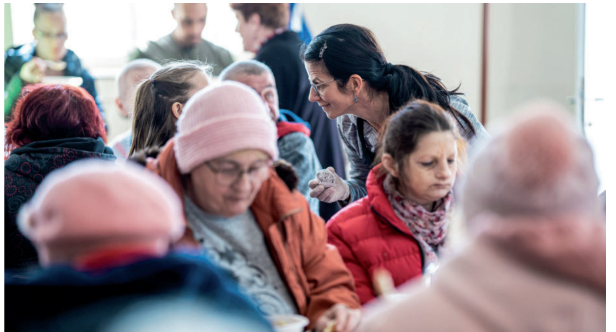
A POLGÁRMESTER FELESÉGE IS ÖNKÉNTESKEDIK

Az utolsó két alkalommal már süteményt is tudtak adni az egytálétel mellé, sőt, egyszer