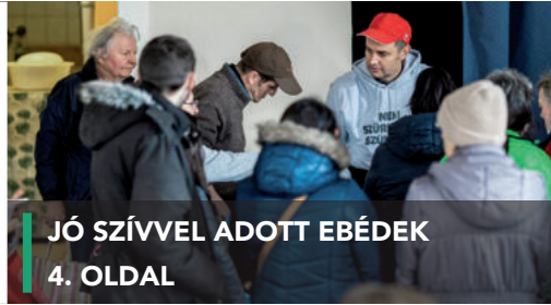
JÓ SZÍVVEL ADOTT EBÉDEK 4. OLDAL