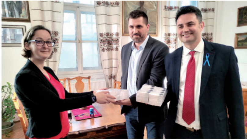
SASVÁRI KRISZTINA MÁRKI-ZAY PÉTERTŐL ÉS KATONA ZSOLTTÓL VEHETTE ÁT A BELÉPŐKET.