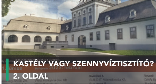
KASTÉLY VAGY SZENNYVÍZTISZTÍTÓ? 2. OLDAL