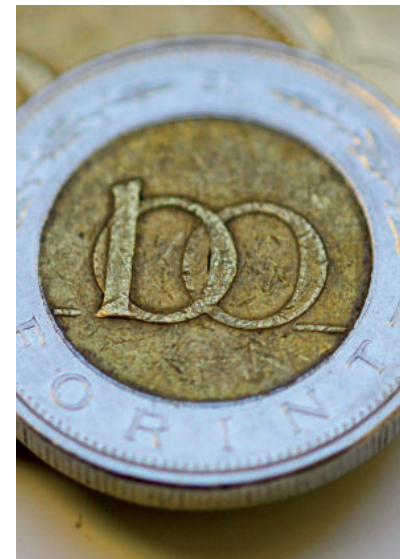
MÁR CSAK A FÉMPÉNZEKRE MONDHATJUK, HOGY „KEMÉNY FORINT”

Noha a bruttó átlagkereset 16,1, a nettó átlagkereset 16,0 százalékkal magasabb volt, mint egy évvel korábban, a bérnövekedés messze elmarad a 25 százalékos körüli inflációtól. Ráadásul az élelmiszerek esetében 44 százalékos volt a drágulás, ami kifejezetten érzékenyen érinti a magyar háztartások többségét. A bérek vásárlóereje drasztikusan csökkent, így a fogyasztás