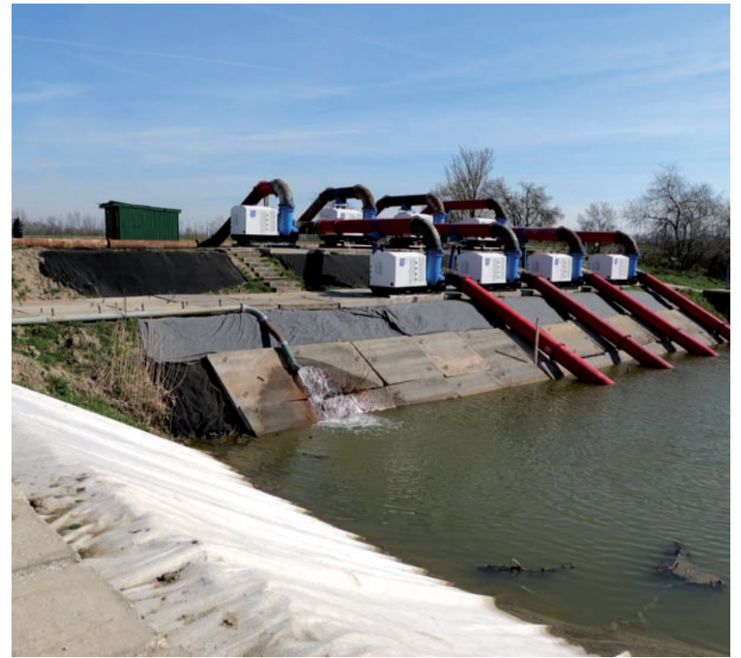
ÉV VÉGÉIG ELKÉSZÜL AZ ÚJ SZIVATTYÚTELEP

A beruházás fő célja a vízszatartott és hasznosítható vízkészlet növelése a rendszerben, a vízgazdálkodási állapotok javítása. A korszerű telep üzembeállításával biztosíthatóvá válik a mentett oldali vízviszatarítás növelése, a vízkészletek helyben tartása, illetve megőrzése. Ezzel együtt az ár- és belvízbiztonság javítása, valamint energiahatékonyság és üzembiztonság növelése is megvalósul a közel 60 éves szivattyútelep átépítésével, mely intézkedések hatására csökken az ár- és belvízi kockázat Hódmezővásárhely környékén. Lábdy Jenő, az Országos Vízügyi Főigazgatóság műszaki főigazgató-helyettese a projekttel kapcsolatban a Vásárhelyi Televízióknak elmondta, a 2006-os nagy árvíz idején már látzott, a régi szivattyútelep nagy