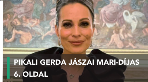
PIKALI GERDA JÁSZAI MARI-DÍJAS 6. OLDAL