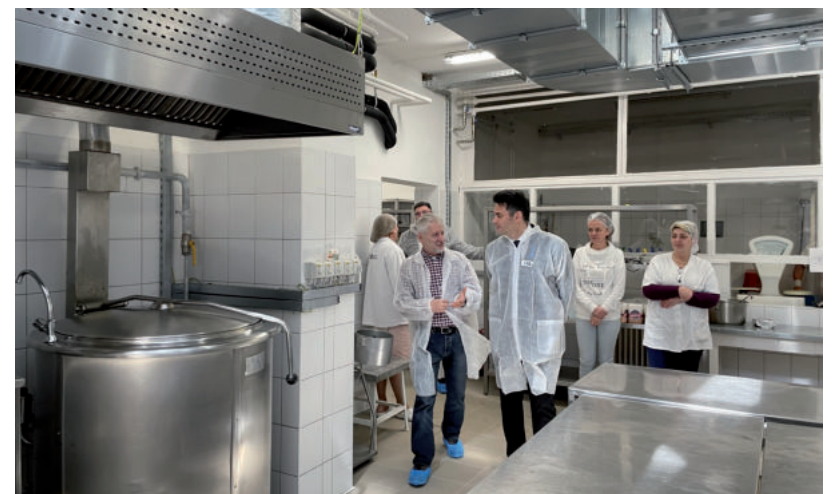
A PRIZMA FOOD KFT. 200 MILLIÓÉRT ÚJÍTOTTA FEL A KÉT KONYHÁT

jellegzetesebb vásárhelyi ízek kialakítására is lesz lehetőség - mondta a polgármester a beszámoló után. A szülők továbbra is a január elsejétől érvényes árat fizetik, most a város által a szolgáltató felé fizetendő összeget növelik. Az emelés mértéke közel 30 százalékos, ami országosan átlagosnak mondható. Beszámolót tartott Szabó Zsolt városi rendőrkapitány is, aki elmondta, hogy a bűnügyek tekintetében a 2019. óta csökkenő tendencia megakadt, így már tavaly is nőtt a bűncselekmények száma. Ennek részben az az oka, hogy korábban elkövetett bűncselekményeket most derítettek fel. Rablás, kifosztás szerencsére egyáltalán nem történt, lopás viszont volt bőven, hiszen kétszeresére emelkedett a számuk. A garázda cselekmények száma szerencsére némileg csökkent, a testi sértések pedig lényegében ugyanazon a szinten maradtak, mint amilyeneken tavaly álltak. Sajnos voltak súlyos közlekedési balesetek is, melyek okait fokozottan vizsgálják, de a gyorsjavítás, és az elsőbbség meg nem adása a legfőbb probléma. 3200 alkalommal ellenőrizték a vásárhelyi rendőrök az ittas vezetést, így a zéró tolerancia elve továbbra is alapvető a városban. Szabó Zsolt megköszönte a városnak, hogy fejlesztette a közterületi kamerarendszert, így jóval könnyebb a bűncselekmények felderítése a rendőrség számára. ■