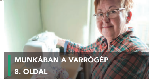
MUNKÁBAN A VARRÓGÉP 8. OLDAL