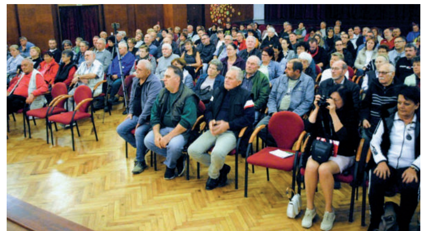
A TAVALY ŐSZI MINDSZENTI FÓRUMON SOKAN KIÁLLTAK AZ IDŐSOTHONÉRT

Mivel az ügy végül gyorsan és megnyugtatóan zárult, nem történt közösségi gyűjtés az otthon megmentése érdekében.