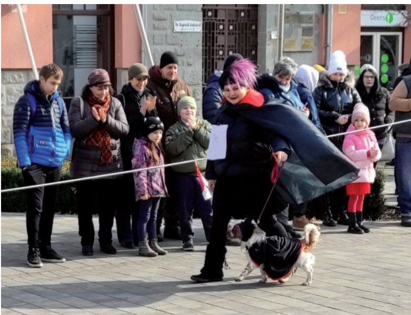
A KUTYÁK ÉS GAZDÁIK IS ELÜZTÉK A TELET

A rönkhúzás után a kiszebáb is rákerült a tűzre, a vásárhelyiek gondjaival-bajokkal együtt. ■