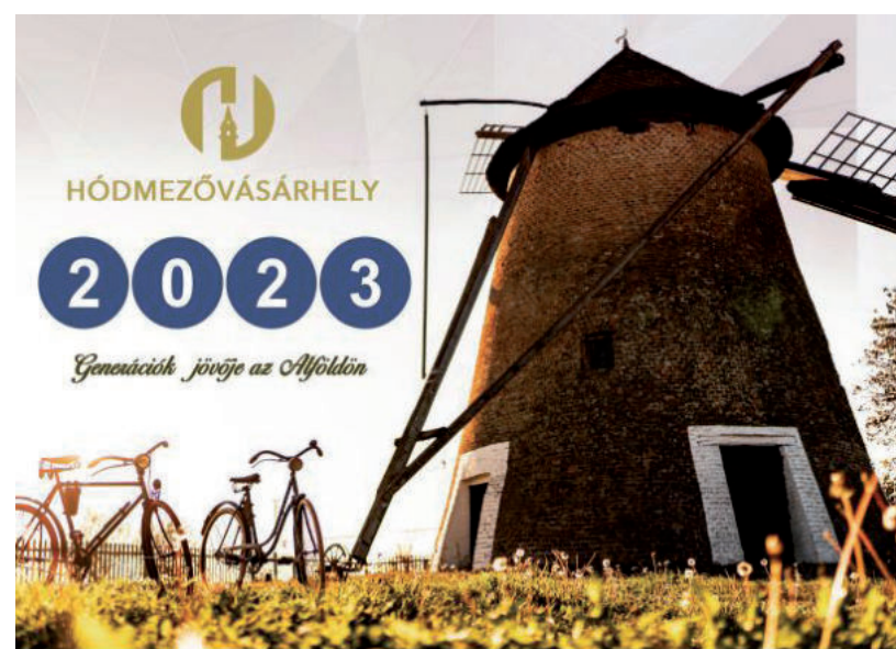
A VÁROS EREDMÉNYEIT EGY ÉVERTÉKELŐ KIADVÁNYBÓL IS MEGISMERHETJÜNK

A polgármester az éwertékelő sajtótájékoztatón hosszasan sorolta azokat a megvalósításokat, amelyeket az elmúlt évben tettek azért, hogy Hódmezővásárhely még élhetőbb, gyerekbártaabb, zöldebb és biztonságosabb város legyen.