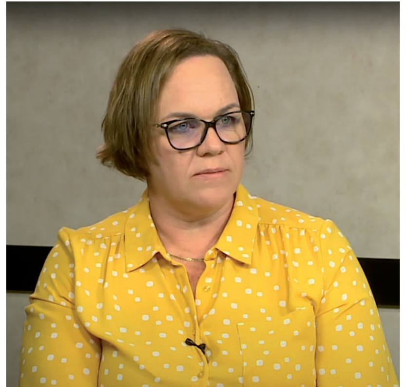
A KÖZGYŰLÉS ELŐTT IS CSAK TAVALY ÁPRILISIG SZÁMOLT BE ALPOLGÁRMESTERI MUNKÁJÁRÓL