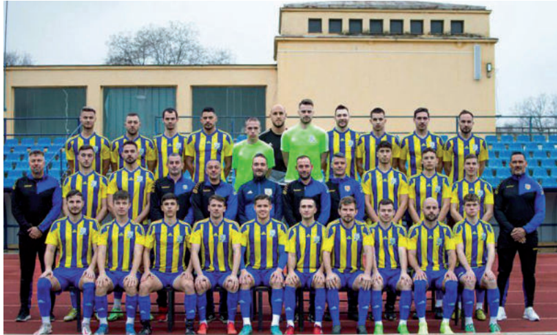
AZ ÁTALAKULT VÁSÁRHELYI KERET OTT FOLYTATTA, AHOL ŐSSZEL ABBAHAGYTA