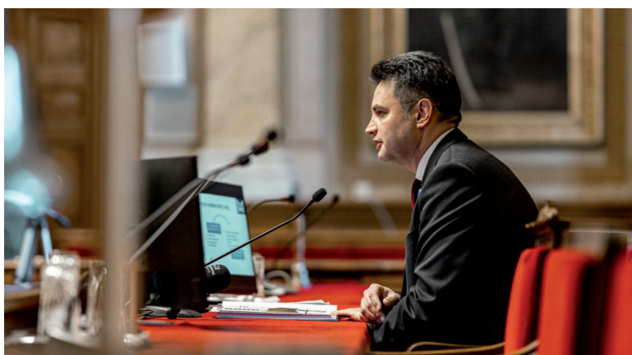
GONDOLATKÍSÉRLET, MEGOLDÁSOK ÉS SZÁMOS EREDMÉNY HANGZOTT EL A SAJTÓTÁJÉKOZTATÓN.