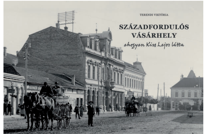
PLOHN JÓZSEF FÉNYKÉPÉSZ FELVÉTELEI MA MÁR NEM LÉTEZŐ HELYSZÍNEKET IS BEMUTATNAK.