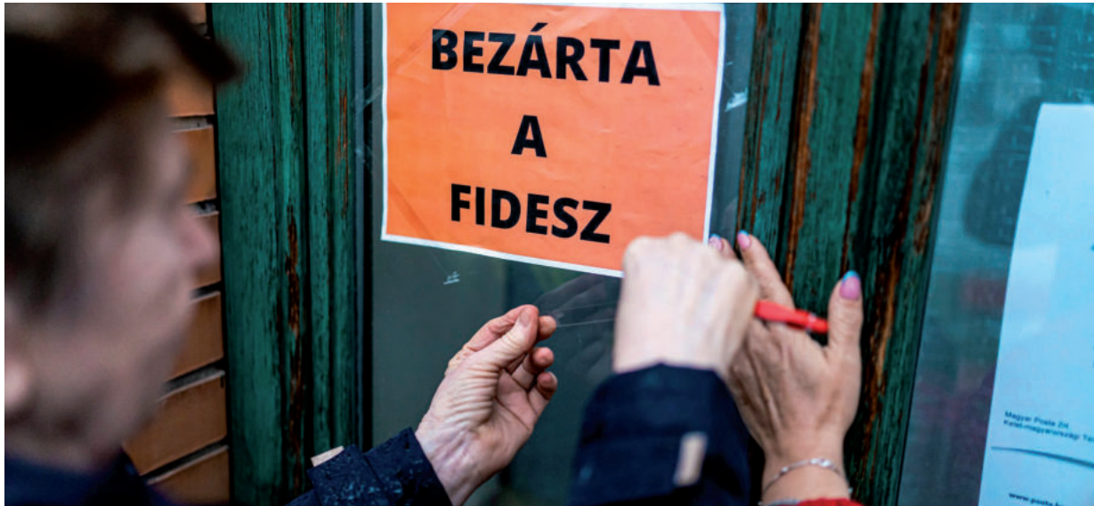
A DÖNTÉSHOZÓK MÁR TAVALY ÖSSZEL TUDHATTÁK, VÉGLEGES LESZ A BEZÁRÁS