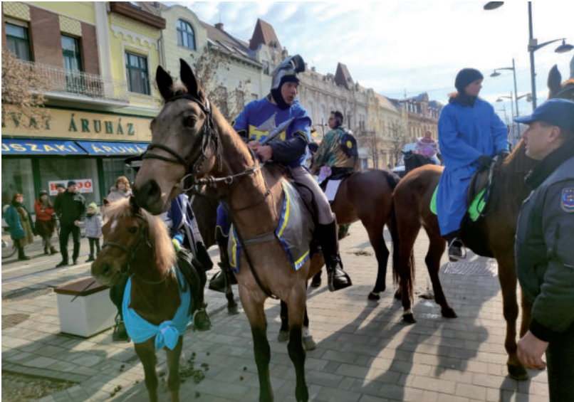
PARÁDÉS LOVAS FELVONULÁSNAK LEHETTÜNK SZEMTANÚI