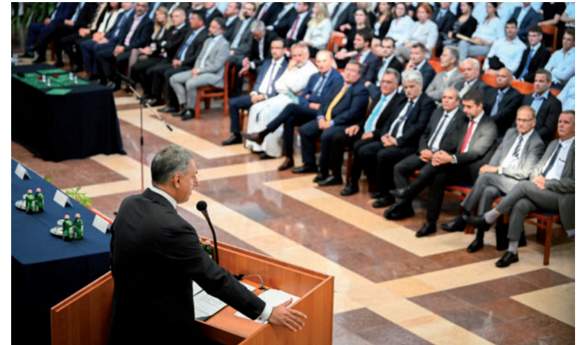
ITT MÉG TAGJA VOLT A KURATÓRIUMNAK.