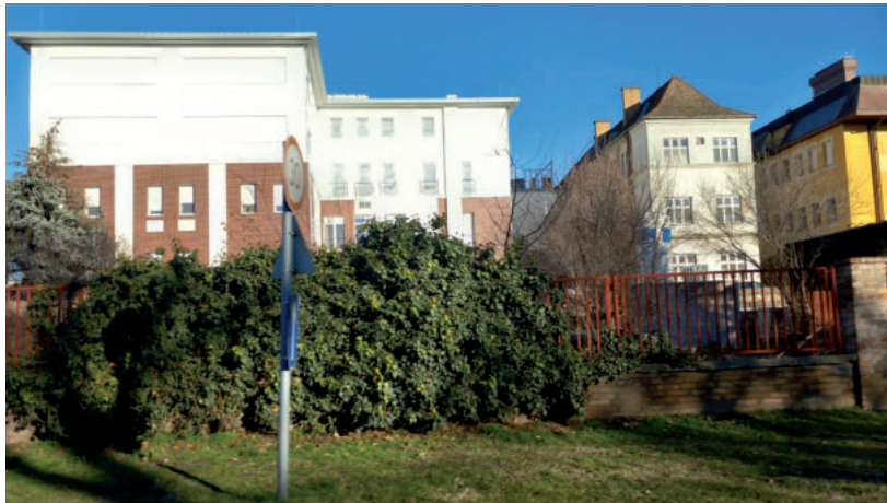
MONDVACSINÁLT OKOKKAL ÉRVÉNYTELENÍTETTEK EGY TERVEZŐI AJÁNLATOT