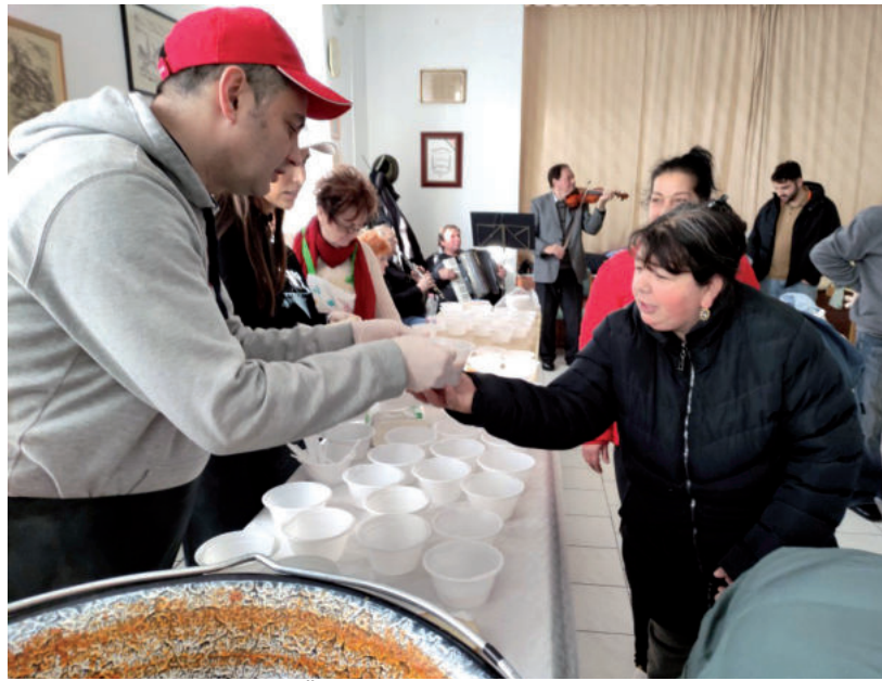
ELŐSZÖR 100, MAJD 150 ADAG ÉTELT OSZTOTTAK SZÉT