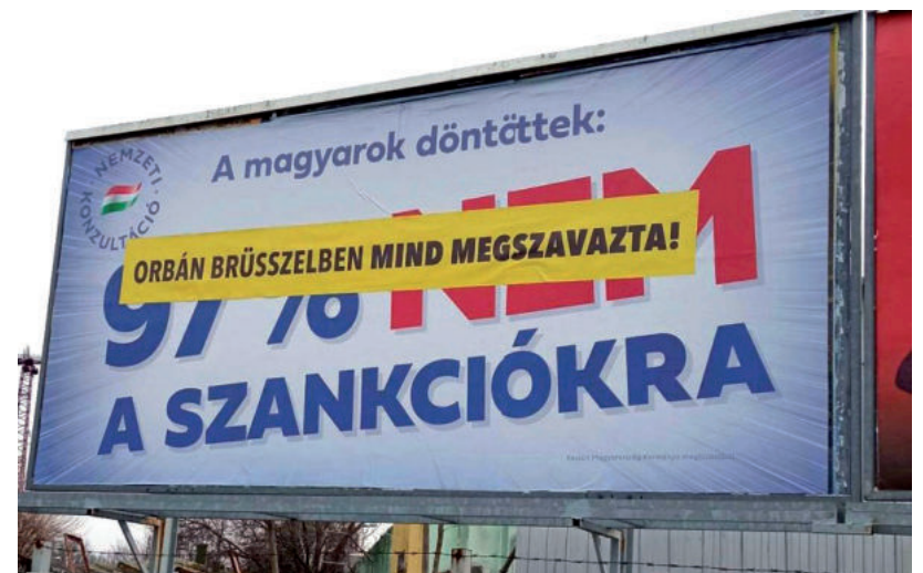
VÁSÁRHELYEN ÁTRAGASZTOTTÁK AZ ÓRIÁSPAKÁTOKAT

úgy, hogy egyetlen cég nyújt csak be pályázatot. ■