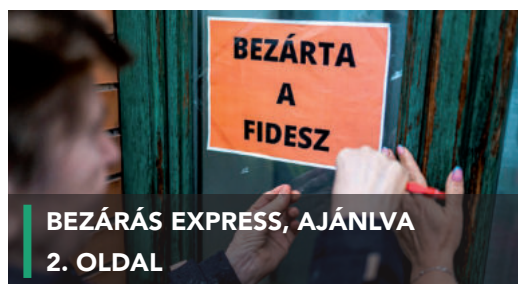
BEZÁRÁS EXPRESS, AJÁNLVA 2. OLDAL