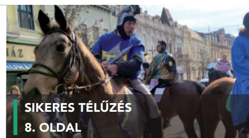
SIKERES TÉLÚZÉS 8. OLDAL