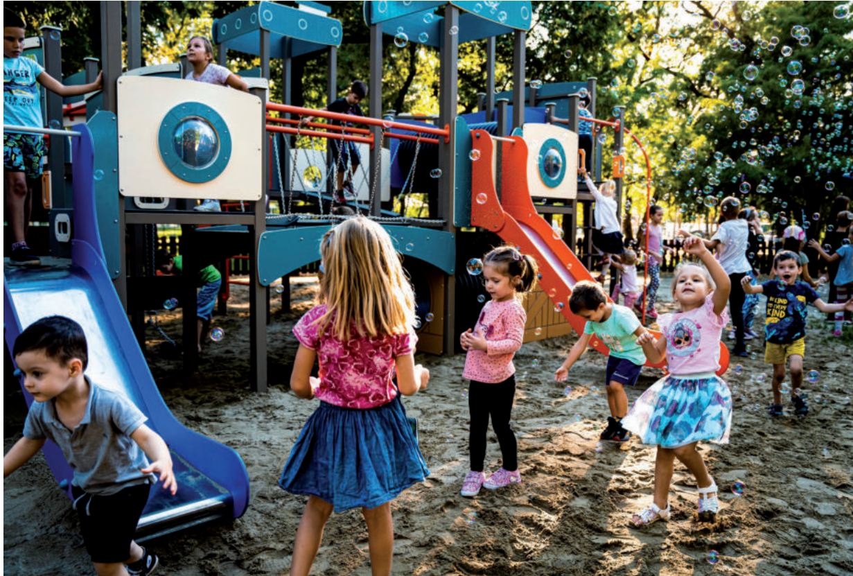
AZ ÁTADÁSKOR KÉSZÜLT KÉP LÁTTÁN NEM KELL BIZONYGATNI, MENNYIRE ÖRÜLTEK A GYEREKEK

Az önkormányzat 100 milliós játszótér felújítási programjának legnagyobb eleme a Népkerthben készült el. A beruházás azzal a céllal valósították meg, hogy a vásárhelyi családok életkörülményeit javítsák, hangsúlyozta az