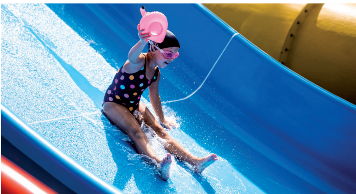
A LEGKISEBBEK VOLTAK A LEGBÁTRABBAK A CSÚSZDÁK MEGNYITÁSA UTÁN

Már a 4 teszt nap alatt több ezren próbálták ki az 55, 17 és 9 méteres