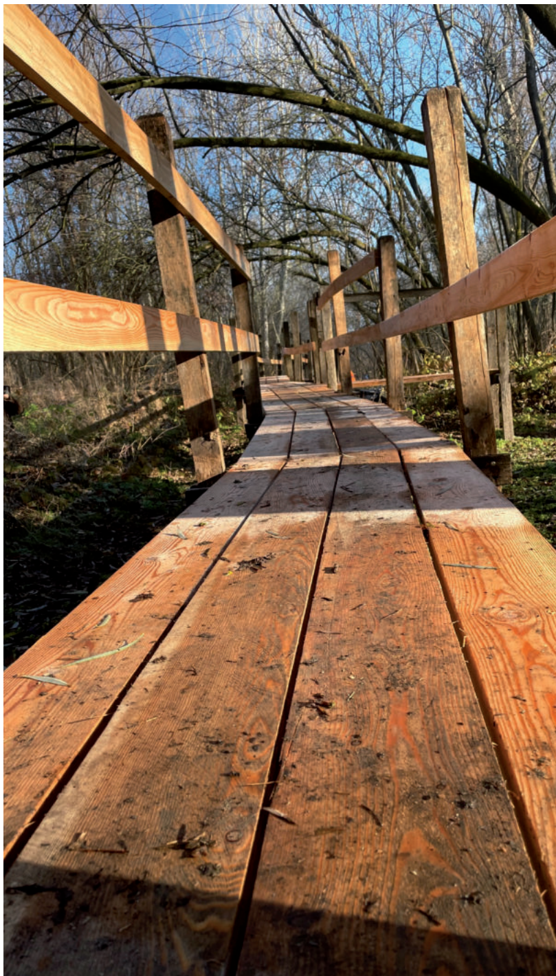
A MÁRTÉLYI TANÖSVÉNYT IS ÖNERŐBŐL ÚJÍJTJA MEG A VÁROS

A városháza épületébe költözött a HMSZ és a HVSZ adminisztrációja a Várház és a Bajcsy-Zsilinszky utcákról, ez 58 főt érintett, ezért az épület nem használt részeit a cégek rendelkezésére bocsájtották. Vannak intézmények, amelyeket fűtésszezonra lezártak, illetve egyfajta előremenekülés is történik. Több épületet is bekötnek a távfűtési rendszerbe, hiszen a geotermikus fűtés energia-takarékosabb, mint a gázzal való fűtés. A Balogh Imsi sportcsarnok, az Oldalkosár utcai bölcsőde rácsatlakozik a geotermikus távhő-rendszerre, és a Hóvirág utcai bölcsőde épületének fűtését is korszerűsítik majd talajszondás hőszivattyúval és az azt működtető napelemekkel. 250 millió forint értékben napelemekkel látják el az önkormányzati épületeket. A kulturális intézményeket a Tornyai és a könyvtár kivételével lezárták, a BFMK közösségi programjai az Ifjúsági Klubban folytatódnak. A dolgozói létszám is változik, munkaköröket vontak össze, illetve nem töltötték fel az idő közben távozó munkatársak helyét. Azoknak a dolgozóknak, akiknek a munkahelye bezár, a covid-időszakban már tesztelt választási lehetőségeket kínálják. Mindeközben a kormány részéről történt egy felmérés, hogy mennyi támogatásra van szüksége a városnak, hogy a drasztikus energiaár-emelést túlélje, ígéretek is elhangzottak, ám segítség eddig még nem érkezett.