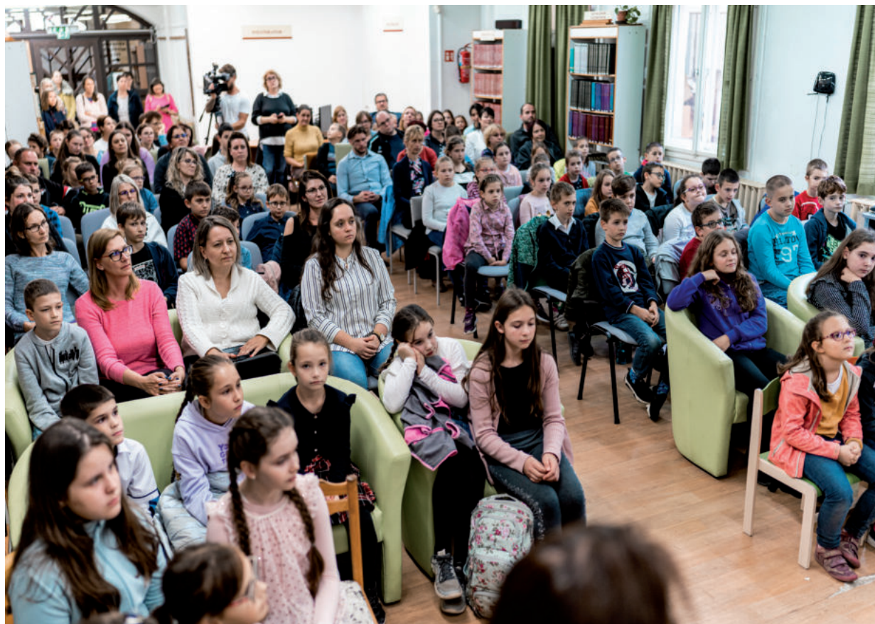
A CSAK VÁSÁRHELYEN MŰKÖDŐ KULCS-PROGRAMBAN TÖBB MINT 500 GYERMEK VETT RÉSZT IDÉN

Hódmezővásárhelyen egy olyan kulturális/szemléletbeli változás történt az utóbbi pár évben, aminek egyre kézzelfoghatóbb jeleit tapasztalhatjuk. Önkéntesek teljesítik rászoruló ovisok karácsonyi vágyait, de ugyanígy önkéntesek bevonásával sikerült egy olyan menekült-ellátó rendszert kiépíteni, amit a Nemzetközi Vöröskereszt és az ENSZ is elismert. Városunk ugyanis befogadott olyan ukrán menekülteket, akik az orosz bombáktól és rakétáktól veszélyeztetett városaikat kényszerültek elhagyni. Vásárhely teljes lakossága megmozdult, különböző egyházak képviselői és tagjai, civil szervezetek és cégek segítettek. Lehet, hogy tudtuk nélkül, de tagjai lettek annak a szeretet-közösségnek, ami csak Vásárhelyre jellemző.