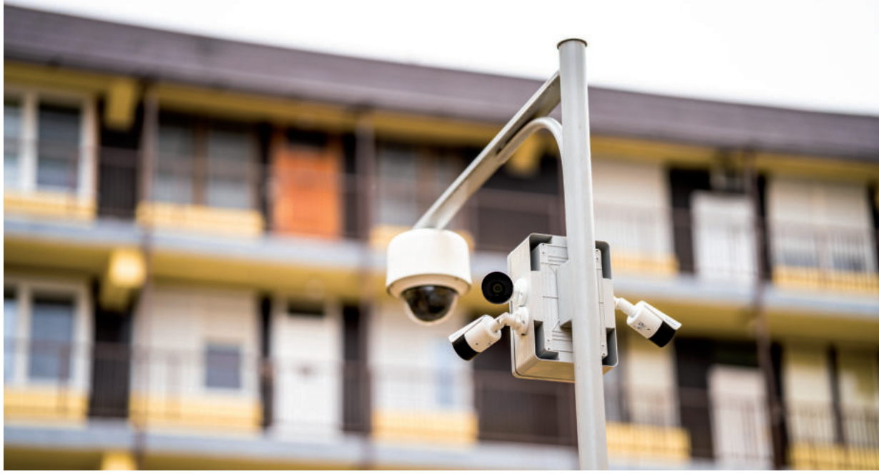
A KAMERÁK MIATT SEM KAPCSOLJÁK LE A KÖZVILÁGÍTÁST

Átfogó kamerarendszer-fejlesztés kezdődött Hódmezővásárhelyen, idén mintegy 80 új térfigyelő kamerát telepítenek városzerte. A beruházás az önkormányzat és a rendőrkapitányság együttműködésében valósul meg annak érdekében, hogy a közbiztonságban továbbra is élen járjon Vásárhely.