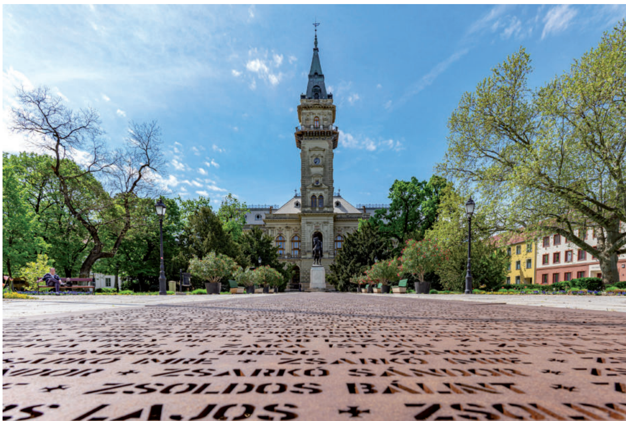
KUCSORA GÁBOR FOTÓJA A REJTETT VÁSÁRHELY FOTÓPÁLYÁZATRA ÉRKEZETT

korszerűsítette Vásárhely játszótéereit, átadott 3 csúszdát a strandfürdőben, újra megnyitja a Teleki utcai bölcsődét; az óvodások új iPadeket