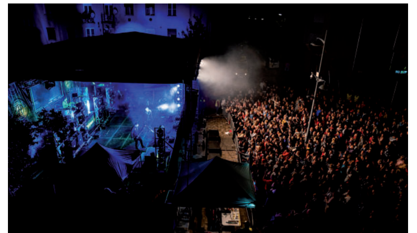
A HOOLIGANS EGY HÓNAP CSÚSZÁSSAL BEPÓTOLT KONCERTJE IS NAGY SIKERT ARATOTT

Augusztus 18-án 20 éves pályafutása első koncertjét adta a Kowalsky meg a Vega Hódmezővásárhelyen és rögtön meg is töltötte rajongókkal a Kossuth teret. A helyiek mellett sokan érkeztek a környező városokból is, a fiúk pedig nem okoztak csalódást, nagy bulit csepegtettek.