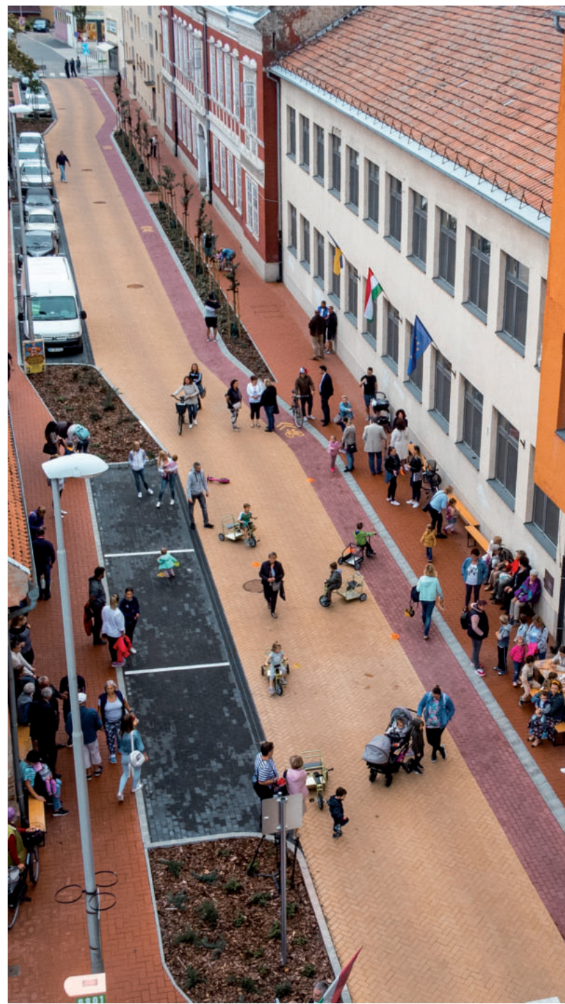
SÉTÁLHATÓ BELVÁROS A CÉL ÉS AHOVÁ CSAK LEHET, NÖVÉNYEKET, FÁKAT TELEPÍTENEK