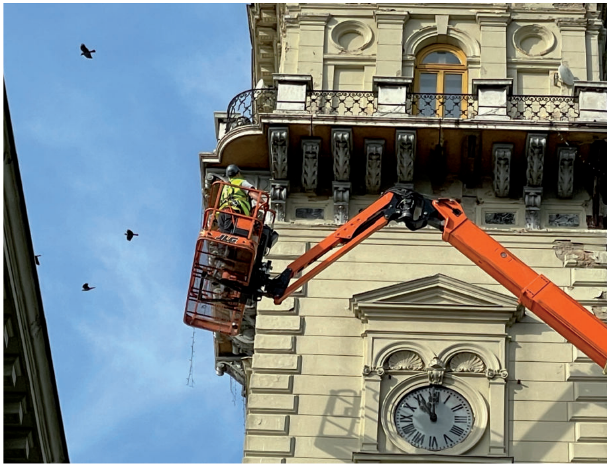
A FELELŐS GAZDÁLKODÁSNAK KÖSZÖNHETŐEN VAN FORRÁS A VÁROSHÁZA TORNYÁNAK FELÚJÍTÁSÁRA

Még tavaly megszüntették az önkormányzat devizatartozását és egy kiszámíthatóbb, forint alapú hitelre váltották át. Az ügylet fontosságát jól szemlélteti, hogy amennyiben ezt nem hajtották volna végre, akkor az árfolyam nagymértékű gyengülése következtében, még a közel 253