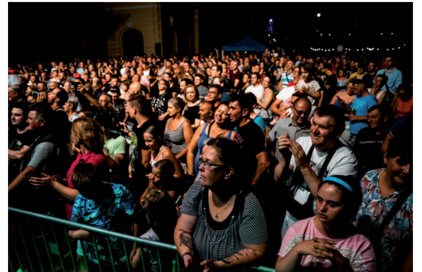
EZREK BULIZTAK A KOWALSKY MEG A VEGA KONCERTEN

17 év után augusztus első hétvégéjén rendezte meg újra a vásárhelyi a közönség önkormányzatával közösen a Mártélyi Kavalkádot. Az üdülőterület három napra igazi fesztiválhelyszínévé változott, ahol a legkülönbözőbb programok gondoskodtak az érdeklődők szórakoztatásáról. Már a nyitó nap, több ezer látogatót vonzott, hiszen több mint 40 év után visszatért az újjáalakult Piramis együttes, valamint hazalátogató St. Martin is, hogy a lampionos csónakokkal a háttérben az egyik mólóról játsszon a közönségnek.