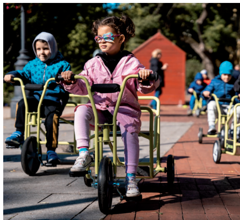
A MAI ÓVODÁSOK IS KERKEZHETNEK MAJD EZEKEN AZ UTAKON

Az önkormányzat a kerékpárosokra e beruházástól függetlenül is nagy figyelmet fordít. Az öreg-kishomoki lakosok régi kérése teljesült azzal, hogy a 47-es úttal párhuzamosan futó kerékpárút közvilágítást kapott. Az új, napelemmel működő világítótesteket és akkumulátorokat 5 méter magasra szerelték, így remélhetőleg senki nem tesz kárt ezekben. 14 új kandelábert telepítettek, így újabb 1,2 kilométer kerékpárút kapott világitást.