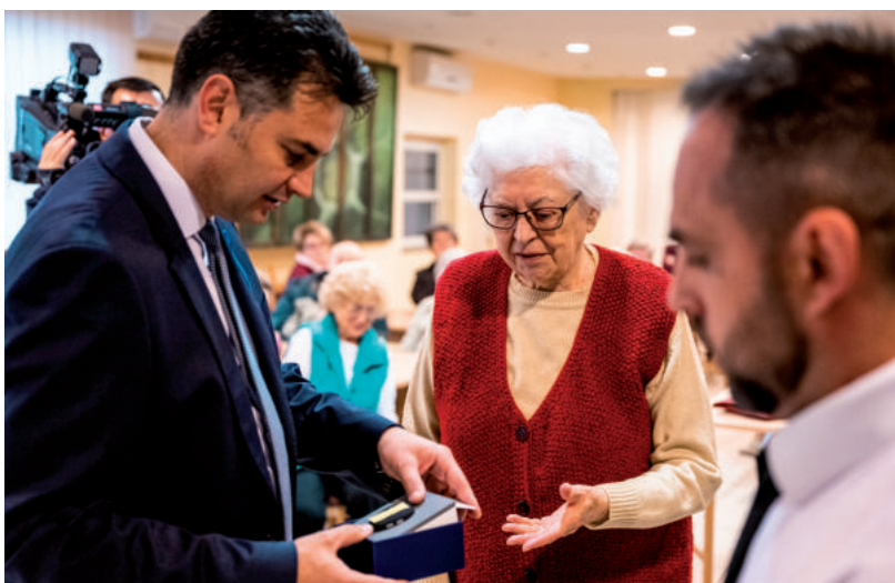
SOS SEGÉLYHÍVÓK ÁTADÁSA A NYUGDÍJAS LAKÓPARKBAN

Városkártyával ingyenes helyi buszjárataink egyre népszerűbbek, idén már pótlóbuszokat és nagyobb járműveket kellett beállítanunk, különösen az ipari park, a Béke-telep, és Kishomok vonatkozásában. A nyugdíjas lakópark és a kora reggeli járat menetrend változással is járt, igazodva az utasoktól kért visszajelzésekhez. Szintén egyedülálló a védett épületeinkre elhelyezett QR-kódos online emléktábla, mely akár naponta frissíthető új fényképekkel, emlékekkel, érdekes tartalommal, például az ott lakók által. A városüzemeltetésben a vidéki Magyarországon először mi vezettük be a QTA-applikációt a kukák irtására, kátyúk és illegális személtelrakás bejelentésére, zöldfelületeink gondozására – az applikáció hamarosan minden vásárhelyinek elérhető lesz, de már eddig is láthatóan javította a szolgáltatások színvonalát és csökkentette költségeinket. Milliókat spórolt a város a megörökölt devizahitelek átváltásával, a korábbi szabálytalanságok miatti büntetések és elődeink adósságainak, kifizetetlen