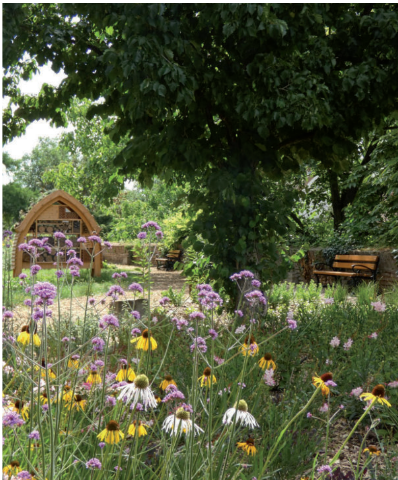
A BIOLÓGIAI SOKFÉLESÉGET TÁMOGATJA A SÉTÁNY, A ROVARHETELEKTŐL A MADÁRÓDÚKIG, MADÁRETETŐKIG

A Szőnyi utcától a Szentkirályi utcáig tartó Rotary-sétányon támogatók által felajánlott 11 pad várja a látogatókat. Az önfenntartó sétányon információs táblákat helyeztek el, amelyen számos hasznos és érdekes információt találhatunk a flóráról, a faunáról és a környezetvédelemről.