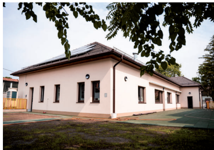
AZ ÉPÜLET FELÚJÍTÁSÁNÁL FONTOS SZEMPONT VOLT AZ ENERGIAHATÉKONYSÁG

Itt gáz egyáltalán nincs, tehát a hét-szeresére emelkedő gázszámlától megmenekül az épület - mondta a