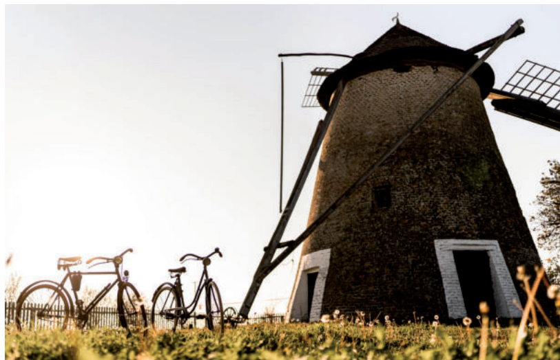
A PAPI-FÉLE SZÉLMALOMHOZ IS BIZTONSÁGOS KERÉKPÁRÚTON BICIKLIZHETÜNK MAJD KI

Hódmezővásárhely külterületén, mind a négy égtáj irányában jelentős kerékpárút fejlesztések valósulhatnak meg. 16 nyomvonalon elkészültek a tervek, folynak a kisajátítási eljárások, hogy 3 új kerékpárút és 13 vegyesforgalmú út épülhessen, összesen 117 km hosszúságban.