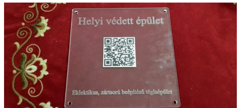
A QR-KÓDOK A VÉDETT ÉPÜLETEK FALÁRA KERÜLNEK

Hódmezővásárhely településképe, sok durva beavatkozás ellenére, a mai napig makacsul őrzi a tradicionális, csak az alföldi tájra jellemző mezővárosi települési kultúra páratlan emlékeit. Ez az örökség ugyan nem túl régi - legidősebb rétegei is csak a XVIII. századból erednek - de jelen van a város területének nagyobb részén, alapvetően meghatározva a „vásárhelyiséget”. Erre az épített örökségre vigyáz a város. Éppen ezért nemrégiben megduplázták a helyi védett épületek számát.