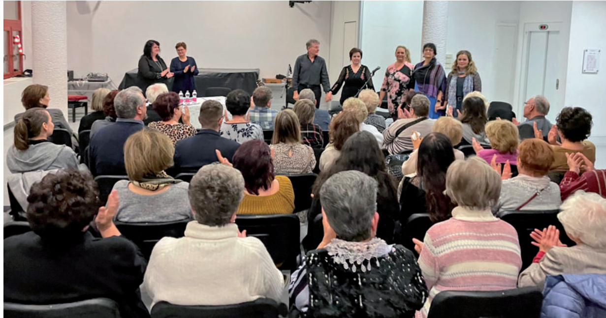
A BESSENYEI SZÍNKÖR TAGJAINAK ELŐADÁSÁBAN MEGHATÓK VOLTAK AZ ALKOTÁSOK