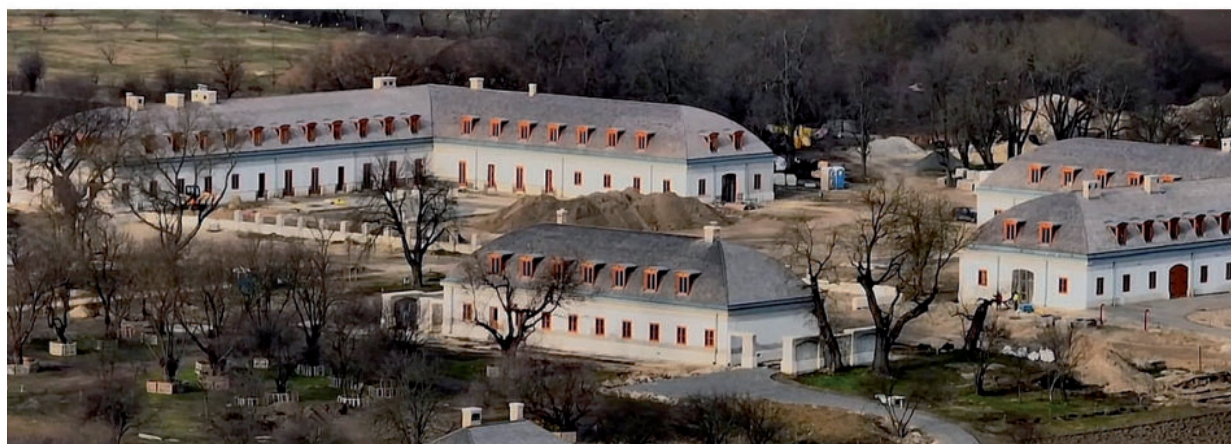
A SPANYOL SAJTÓ FIGYELME IS MAGYARORSZÁGRA IRÁNYULT

Las sospechas y las conexiones millonarias en torno a la propiedad ilustran un sistema que ha recibido un castigo sin precedentes en la UE