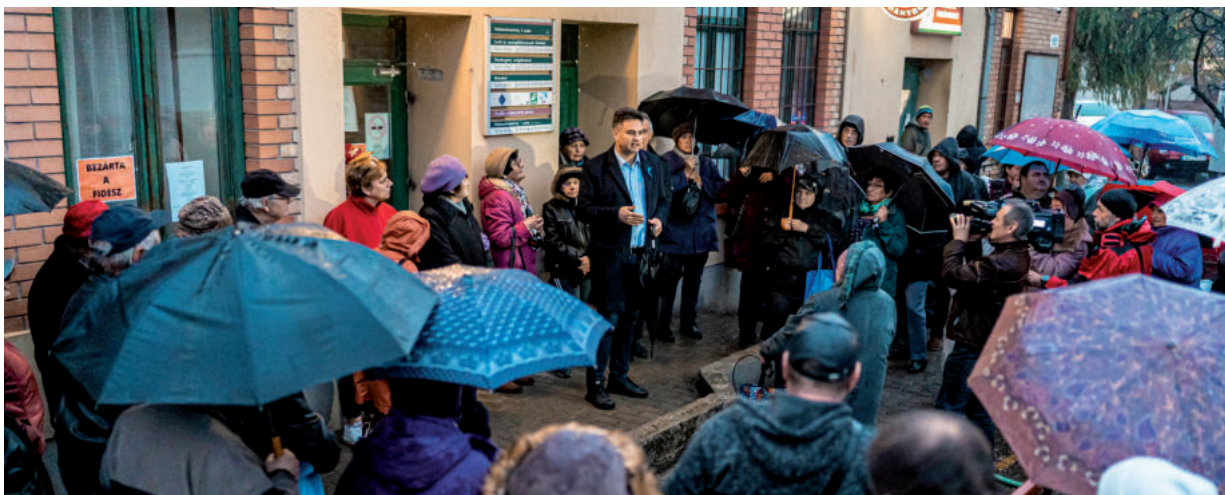
A POSTÁK NYITVA TARTÁSÁÉRT TARTÓ DEMONSTRÁCIÓKON „BEZÁRTA A FIDESZ” FELIRATOKAT HELYEZTEK EL A TŰNTETŐK

A csúcsiak nagyon ragaszkodnak a postájukhoz, amit jelez az is, hogy