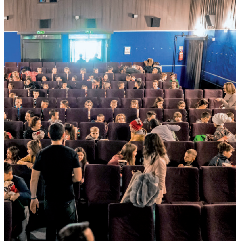
150 GYEREK NÉZHETTE MEG A NEVELETLEN HERCEGNŐT

– Az idén decemberben nagyon sok jótékonyági eseményt szerveztünk mi magunk is. Most három iskola elsősei nézhetik meg a mesefilmet, anyagi