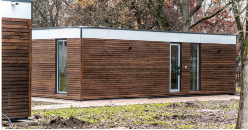
A KEMPINGBEN A LAKÓHÁZAK NEM CSAK SZÉPEK, DE NAGYON KÉNYELMESEK IS