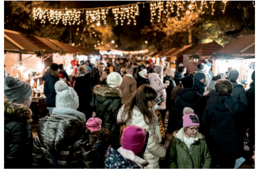
AZ ORSZÁGOS ÁTLAGNÁL KÉTSZER GYORSABBAN CSÖKKEN A NÉPESSÉG

A kutatók alapmodelljében a népességszám 2050-re 8,5 millióra csökken, ami 2020-hoz képest 13 százalékos csökkenést jelent, több mint kétszeresét az elmúlt 30 évnek. A magas termékenységi forgatókönyv megvalósulása esetén szűk 30 év múlva 8,8 millióan leszünk,