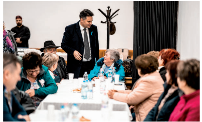
AZ AZ IGAZI, HA AZ EMBEREK LEÜLNEK EGY ASZTALHOZ, KÖRBE ÜLİK AZT ÉS BESZÉLGETNEK – MONDTA A POLGÁRMESTER.