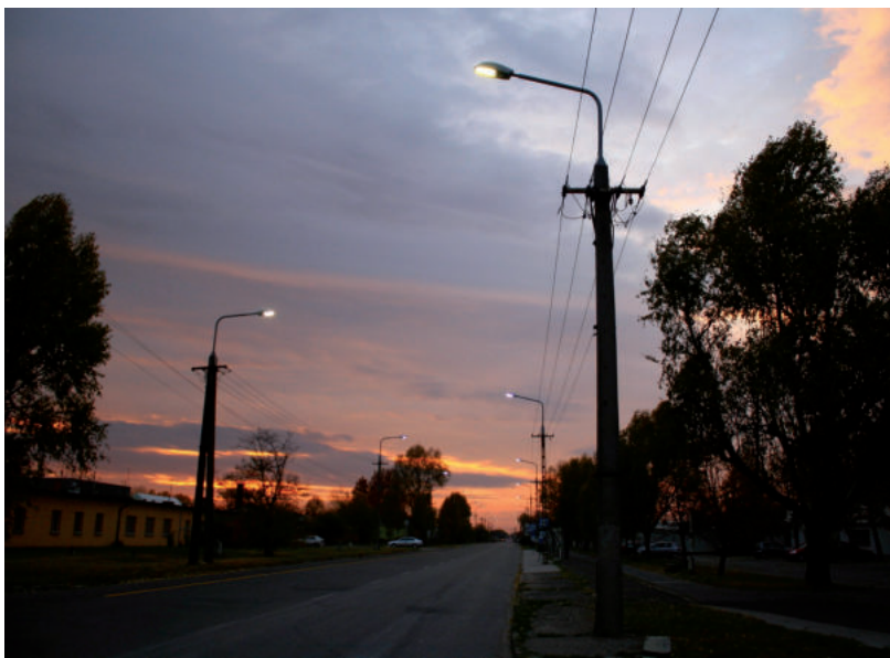
A KÖZVILÁGÍTÁS IS EGY VAGYONBA FOG KERÜLNI JÖVŐRE

4 millió 967 ezer kWh-ra tartana igényt jövőre Vásárhely, s ezért közel 922 millió forintot számlázhat az MVM leánycége, ha létrejön az ügylet. Ez az összeg megközelítőleg harmada annak, amire a vásárhelyi önkormányzat helyi adók, díjak és