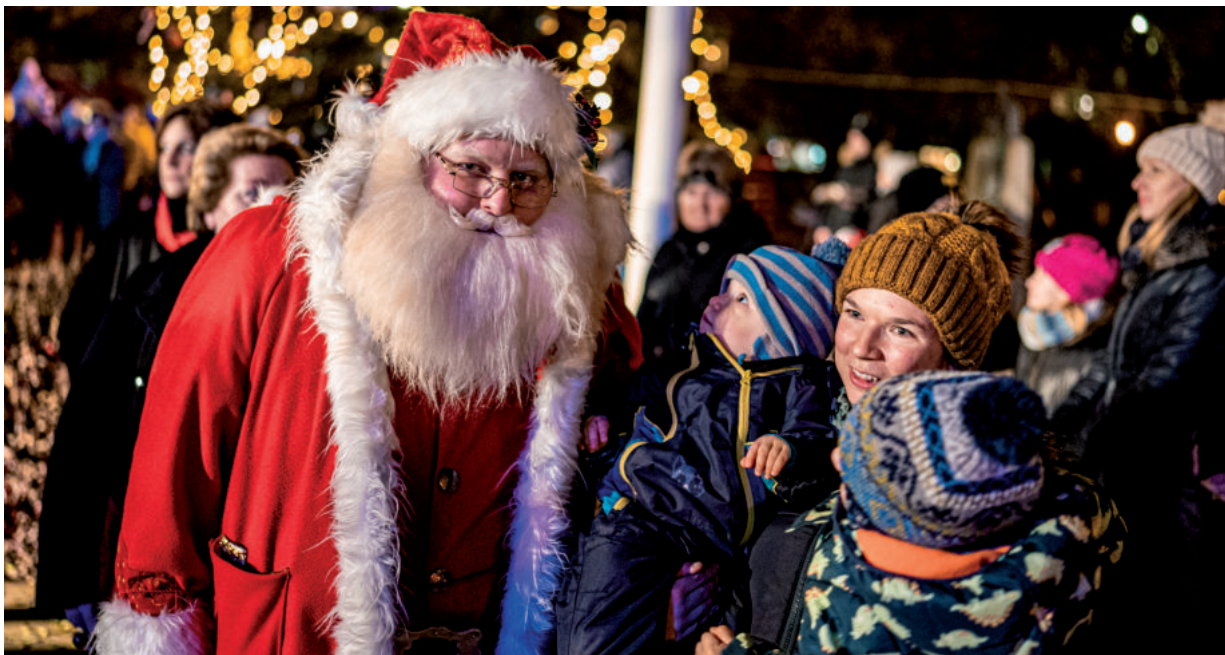
A KICSIK NAGY ÖRÖMÉRE AZ ADVENTI VÁSÁRT IS MEGLÁTOGATTA A MIKULÁS

A karácsonyra hangulódást segíti a város adventi koszorúján lévő gyertyák ünnepélyes meggyújtása vásár-