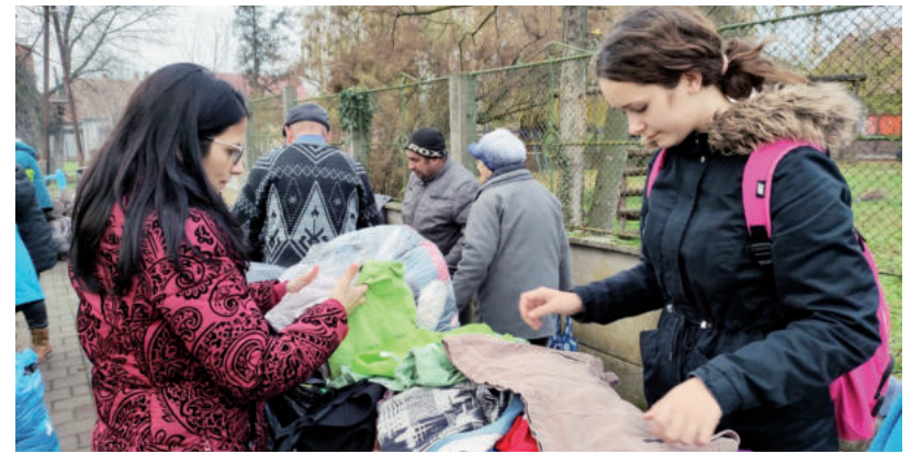
MOST RUHÁT, KARÁCSONYKOR JÁTÉKOT AJÁNDÉKOZNAK MAJD