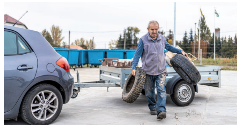
A 104 TONNA ÖSSZEGYŰJTÖTT HULLADÉK 11%-A GUMIABRONCS

Az első hónapban a hulladékudvarban összesen már 104 tonna hulladékot vettek át, ennek 19 százaléka lom (azaz a háztartásokból származó, veszélyes hulladékot nem tartalmazó, hulladékká vált eszközök, berendezések, tárgyak (bútorfélék, textil, ruhafélék stb.) 15 százaléka elektronikai hulladék, gumiabroncs és 44 százaléka kevert építési-bontási törmelék – tájékoztatta lapunkat a hulladékudvart üzemeltető FBH-NP Nonprofit Kft. ■