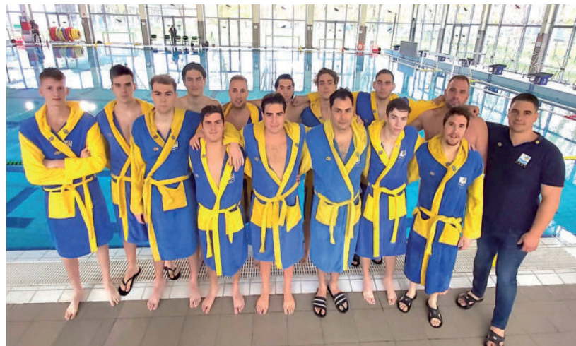
JELENLÉG 7. A 14. CSAPATOS TABELLÁN A GÁRDA