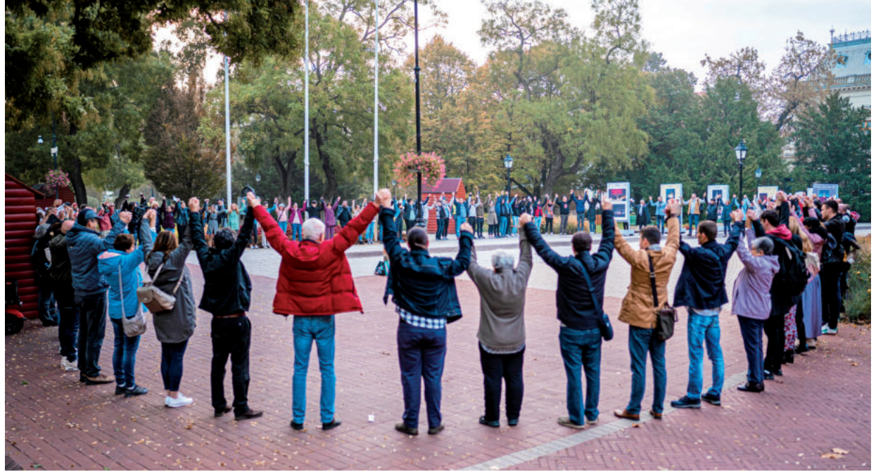
A TANÁROK MEGMOZDULÁSAIT TÁMADÓK A LÉNYEGET NEM ÉRTIK: HA NEM LESZ VÁLTOZÁS, NEM LESZ TANÁR