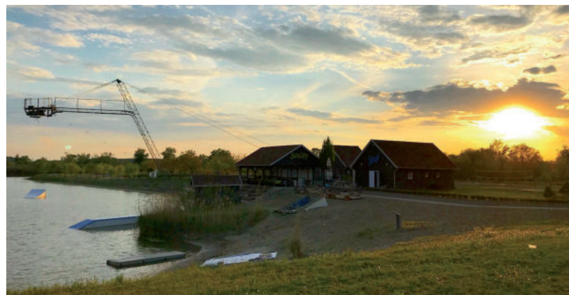
A SUN CITY TAVALY VESZTESÉGES VOLT, DE A TULAJDONOSOK ÚTÉPÍTŐ CÉGE MILLIÁRDOS PROFITOT TERMELT

A leendő bérleti díj összegében – a szerződéskötést követő 30 napon belül – kifizetné a bruttó 25,4 milliós bérleti díjat. Az ügylet 2022. december 7-től 2024. december 31-ig szólna, és a vállalkozás 38 ezer négyzetméter hasznosítana. A területen turisztikai fejlesztéseket tervez, de ezeket nem részletezték az előterjesztésben. ■