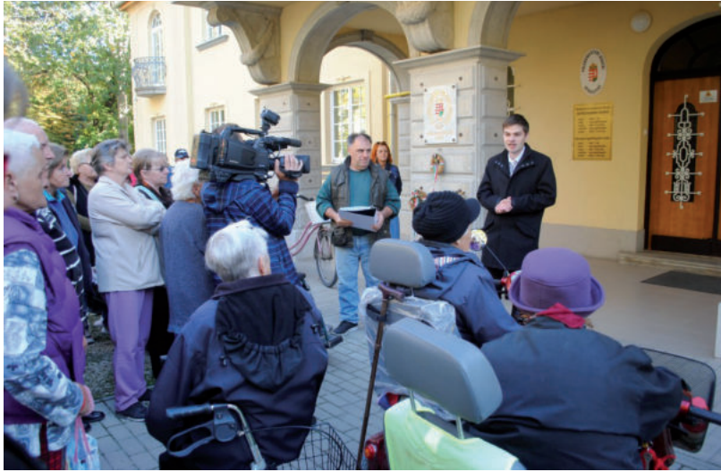
ÉLŐLÁNCOT VONTAK A TÜNTETŐK AZ IDŐSEK OTTHONA ELÉ, TILTAKOZÁSUL A LAKÓK TERVEZETT ELKÖLTÖZTETÉSE ELLEN.