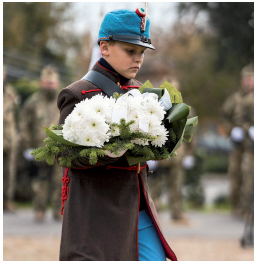
TISZTELGÉS A HŐSÖK ELŐTT