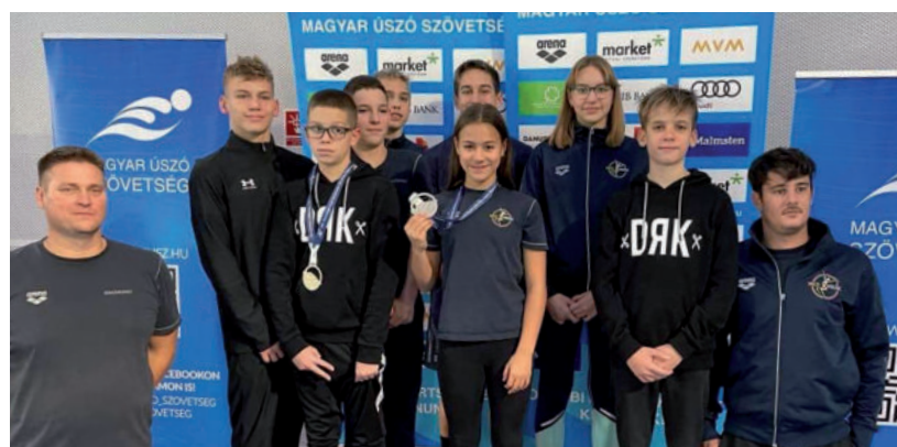
KITETT MAGÁÉRT A CSAPAT