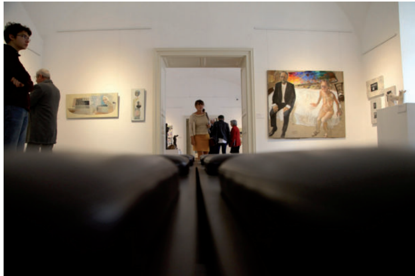
SOKAN VOLTAK KÍVÁNCSIAK A MEGNYITÓRA

A művekről szólva azt mondta: a szépség kortól független, ennek ábrázolása most is megjelent, de a humanitás és a dehumanizáció is központi kérdést kapott, például a