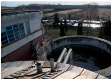
2016 MÉG 1,6 MILLIÁRD, 2022-BEN MÁR 16 MILLIÁRD

A hat éve elstartolt modernizációs terv kapcsán több ízben megírtuk, hogy a múlt évtized derekán annyira alultervezték a kiadásokat, hogy a támogatási döntés megszületése után másfél évvel az elnyert összeg már csak a ráfordítások 4,0 százalékára futotta volna. Újabb közbeszerzés következett, de ahogy fent már írtuk, 2020-ban sem járt eredményre a versenyeztetés, mert nem volt elég a pénz. Az állam végül 2021 augusztusában döntött úgy, hogy