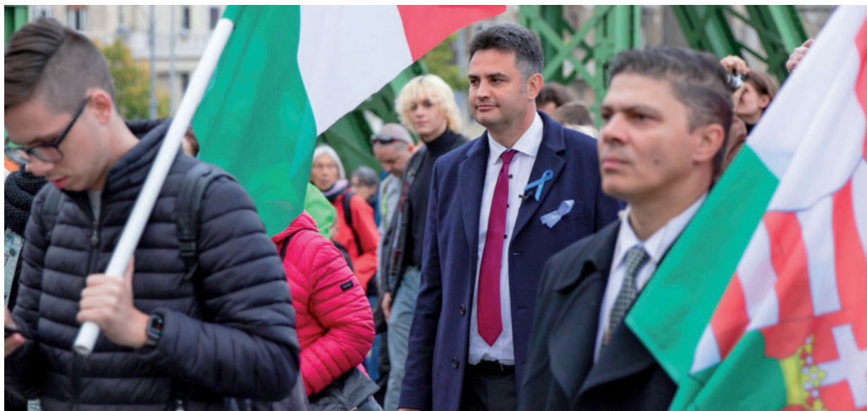
OKTÓBER 23-ÁN MÁRKI-ZAY PÉTER IS OTT VOLT A SZABADSÁG HÍDON ÁTVONULÓ TÖMEGBEN

„A pályaelhagyók száma úgy nő, mint Mészáros Lőrinc vagyona. (...) Milyen oktatás az, ahol a kémiát tesitanár tartja? (...) Ha kirúgják a