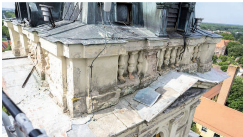
ÉLETVESZÉLYES ÁLLAPOTOT KELL ELHÁRÍTANI A KIVITELEZŐKNEK

A terület műszaki átadására október 11-én került sor. A városházi egyez-