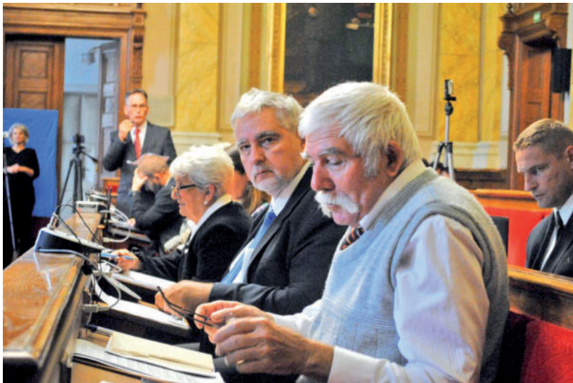
SOKAT VITÁZTAK A KÉPVISELŐK AZ ENERGIA FÜGGŐSÉGRŐL

ugyanis napirend előtt elmondta, hogy reménykednek az enyhe télen, ugyanis az áram- és a gázár növekedést a város önerőből nem tudja kigazdálkodni, kormányzati segítség nélkül nem megy. Ahogy nem megy a fideszes vezetésű városoknak sem – utalt azok polgármestereinek az országos sajtóban megjelent nyilatkozataira. Vásárhely polgármestere hozzátette: ha enyhe lesz a tél, akkor is 280 millió forint értékben kell majd gázzal rásegíteni a panelházak esetében is a termálvízre. A kormánynak pedig az infláció, azaz az áremelkedések