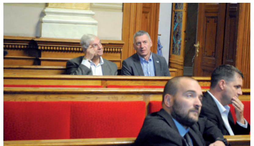
MÁRTÉLYNAK RÉSZLETFIZETÉST ENGEDÉLYEZTEK

bálok mindenkivel egyezkedni, hogy a tartozás Mártyély számára feldolgozható legyen – hangsúlyozta.