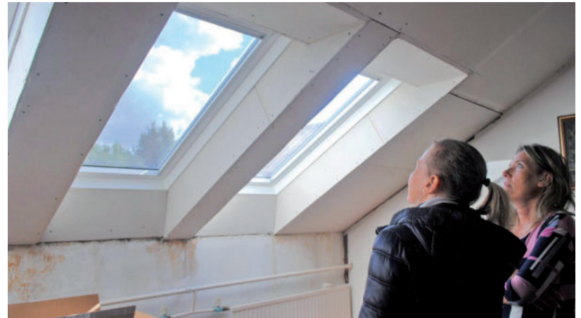
ÚJ ABLAKOK IS KERÜLTEK A TETŐTÉRBE