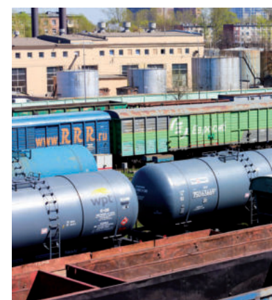
AZ OLAJRA CSAK KORLÁTOZOTT A TILALOM

A cikk rámutat arra, hogy az inflációnak semmi köze a háborúhoz, ugyanis az inflációs folyamatok már tavaly elkezdődtek és az év végéig komoly pénzromlást láthatunk, pedig akkor még ugye sehol sem volt a „háborús infláció”. A háború kitörésével ráadásul a magyar kormány nem fogta vissza a választások előtti osztogatásokat, írja az Mfor. Ennek oka lehetett az is, hogy Orbán gyorsabb és gazdaságilag is kisebb hatású háborúval számolt.