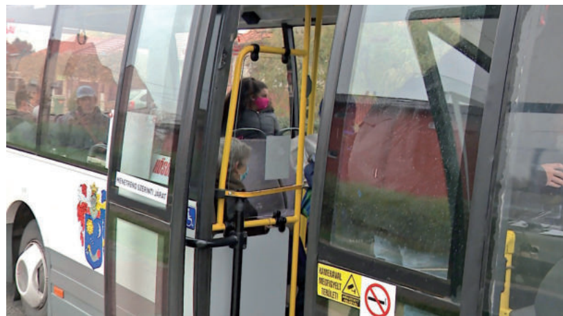
HÁROM ÚJ MEGÁLLÓ LESZ NOVEMBERTŐL

A városkártya kiváltásával, az országban szinte egyedülállóan, továbbra is ingyenes vehető igénybe a helyi tömegközlekedés. ■