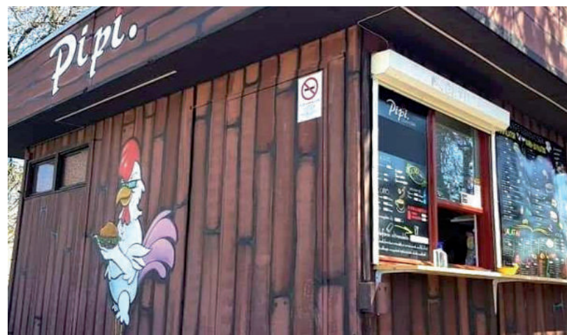
A HÁLÓZAT KÉT ÉTTERMÉT ŐK IS BEZÁRTÁK AZ ENERGIA- ÉS ALAPANYAGÁRAK MIATT

VÁLSÁG • Mindszenten is a „brüsszeli szankciókra fogják a bezárást, 19 idős gondozott kerül Vásárhelyre