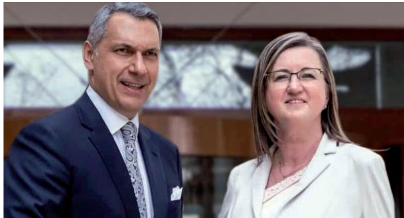
LÁZÁR SZERINT HELYES DÖNTÉS A MAKÓI INTÉZMÉNYEK BEZÁRÁSA