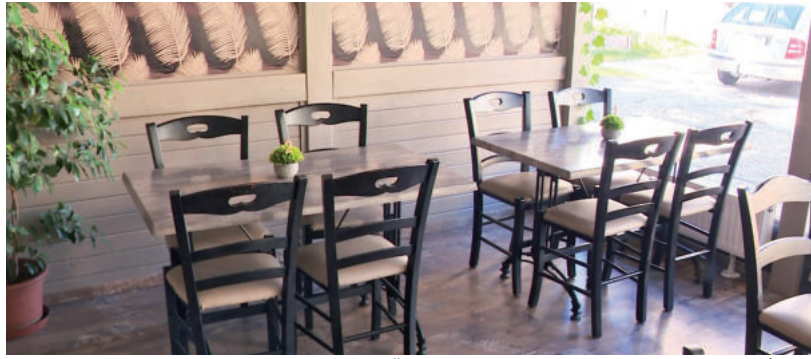
EGYRE TÖBB HELY ADJA FEL, IDEIGLENESEN VAGY VÉGLEG