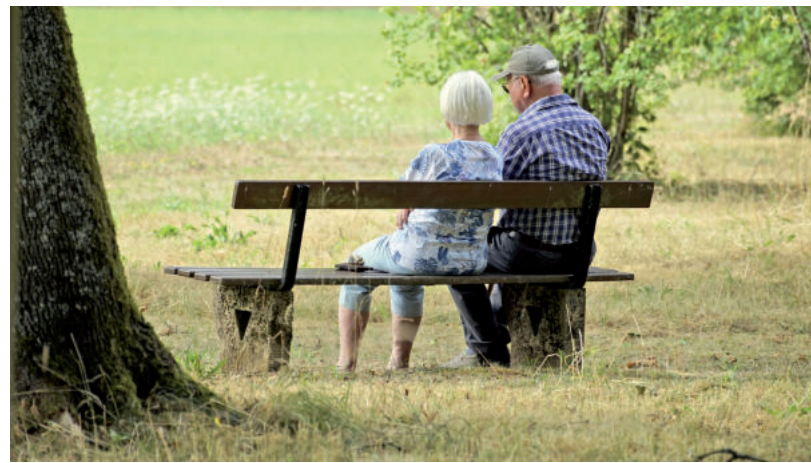
A NYOMTATVÁNY A

A kérelmező lakcímkártyájára és személyi igazolványára is szükség lesz. ■