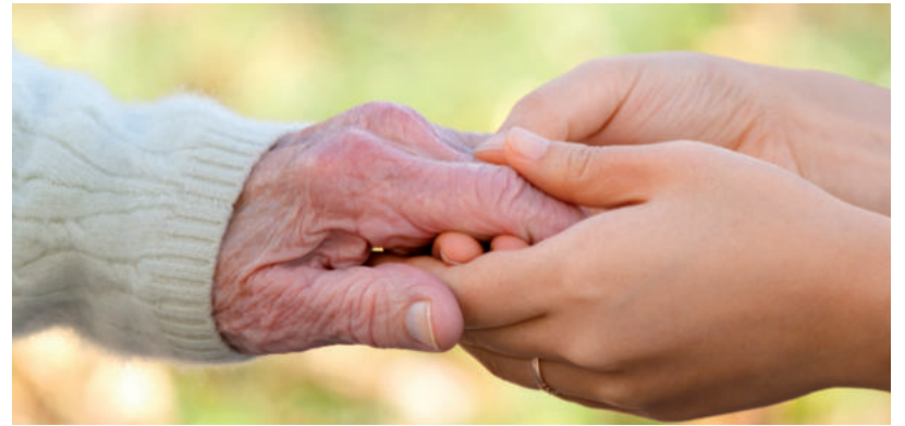
IDÉN IS IGÉNYELHETNEK 10 EZER FORINTOT A KISNYUGDÍJASOK

A támogatás megállapítása iránti kérelmet formanyomtatványon az október 3. és november 15. közötti