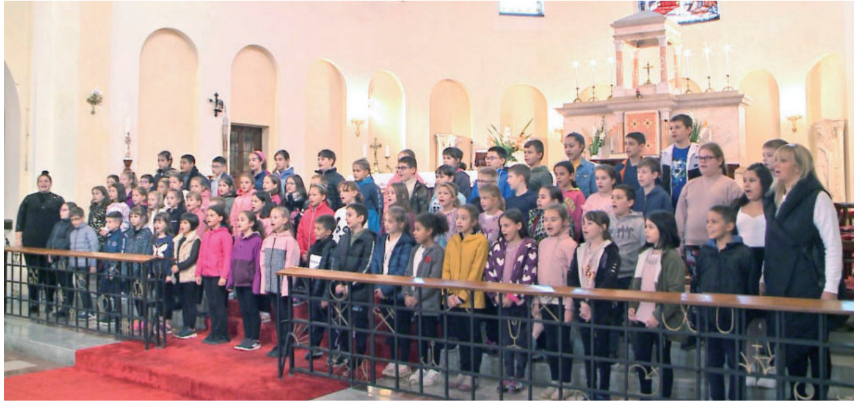
MÉLTÓN ÜNNEPELTÉK A ZENE VILÁGNAPJÁT