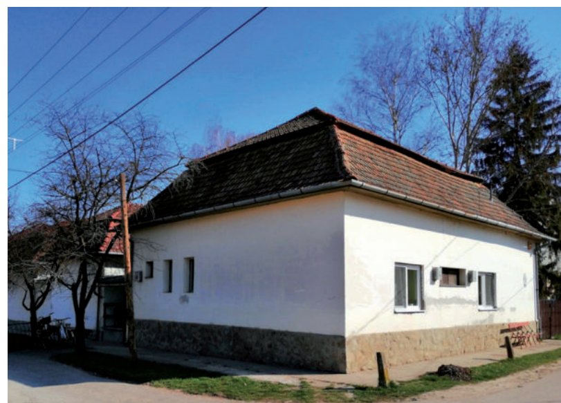
19 LAKÓ KÖLTÖZIK ÁT VÁSÁRHELYRE