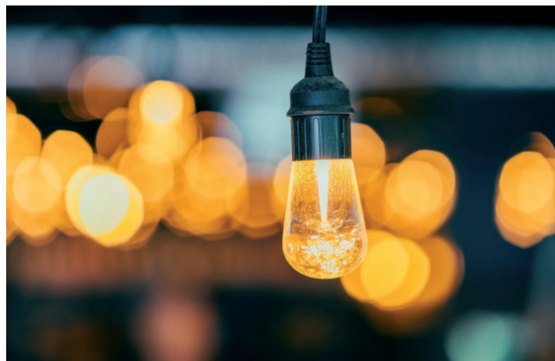
A SEGÍTSÉG MÉG NEM MINDEN RÉSZLETE ISMERT HAZÁNKBAN

Június 25.: Szlovákia: Személyenként 500 eurót ajánl fel a kormány egyszeri támogatásként mintegy 400 ezer állami és közalkalmazottnak, köztük a tanároknak – ez összesen 200 millió euróba fog kerülni az államnak – olvasható a pozsonyi (Szlovákia) Új Szóban.