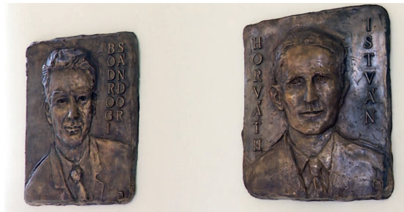
ADOMÁNYOKBÓL JÖTT ÖSSZE A KÉT DOMBORMŰ

Általuk számos diák ismerhette meg a természettudományok, a fizika, a kémia és a matematikai szépségeit, mondta visszaemlékezésében Hódi-