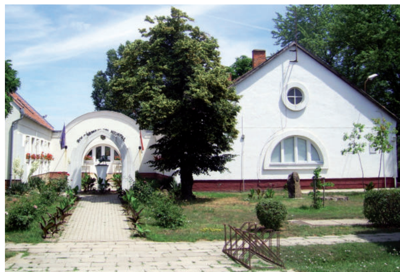
RÉSZLETEKBE FIZETHETIK KI AZ ADÓSSÁGOT

JÁTSZÓTEREK • Ismét birtokba vehettek egy helyszínt