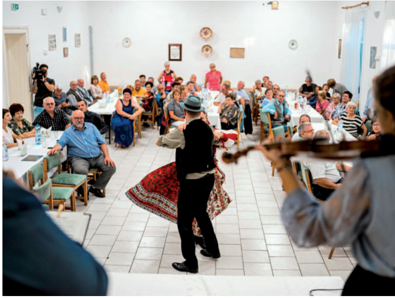
ZENÉVEL, TÁNCVALÓKORRAL ÜNNEPELTÉK AZ ÚJVÁROSI ÉS A CSÚCSI OLVASÓKÖR FELÚJÍTÁSÁT