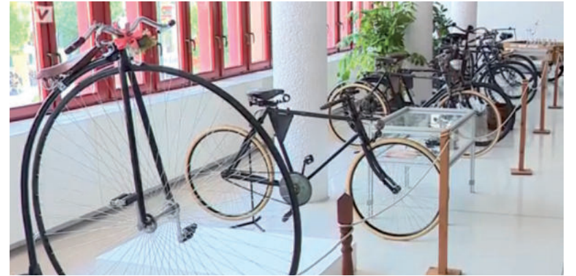
ISMÉT KÜLÖNLEGES KERÉKPÁROKAT TEKINTHETNEK MEG