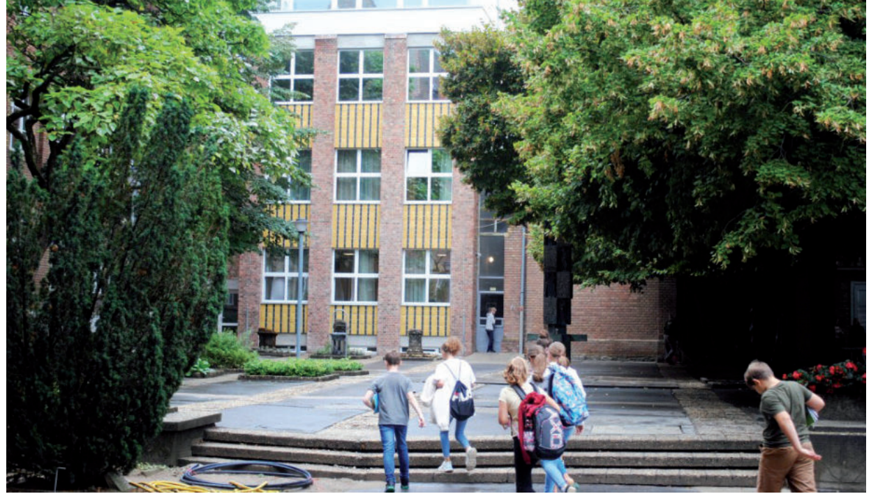
500 MILLIÓ FORINTBÓL KÍVÜL-BELÜL MEGÚJULT AZ ÉPÜLET