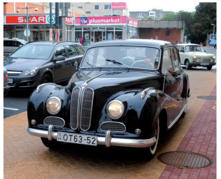
EGY OLDTIMER BMW IS VÉGIG GURULT A SÁRGA ÚTON