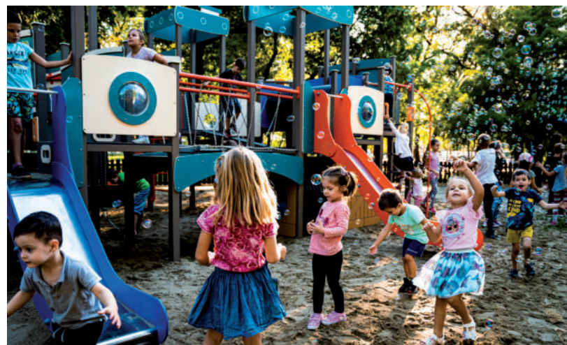
ÖNFELEDTEN VETTÉK BIRTOKBA A JÁTSZÓHAJÓT A GYEREKEK

Márki-Zay Péter az átadón figyelmükbe ajánlotta a városkártyát, amivel a Jovány buszok által az iskolába járás ingyenes. Hódmezővásárhely zölddebb, nyugodtabb település és a legbiztonságosabb megyei jogú város, ennek ellenére kamerafelújítási program indul. Tavaly 50 millió forintot költöttek óvodai eszközök felújítására és hamarosan elkészül a Teleki utcai bölcsőde. ■