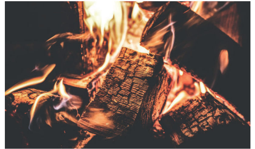
KI TUDJA, MIT HOZ A TÉL

800 ezres bruttó átlagbért ígért Gulyás Gergely a tanároknak, feltéve, ha meg tudnak egyezni az Európai Unióval, mely támogatásából származna ez az összeg. Ezzel párhuzamosan 400 ezres fizetéssel