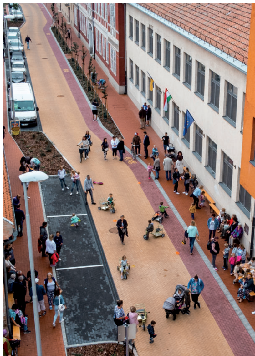
ILYEN MADÁRTÁVLATBÓL A SZENT ANTAL UTCA