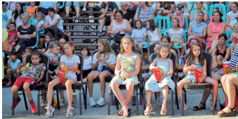
RENGETEGEN VOLTAK KÍVÁNCSIAK A FILMEKRE

KÉPZŐMŰVÉSZET • Idén is siker volt a Mártélyi Szabadiskola