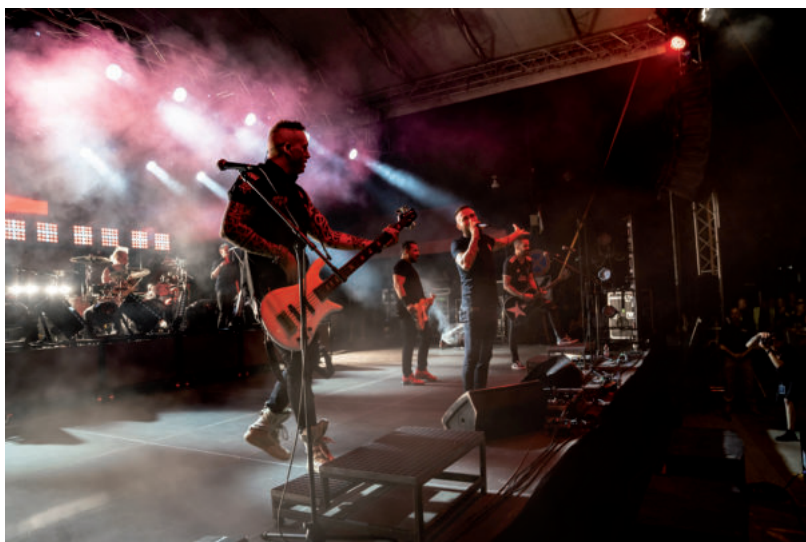
A KOWALSKY MEG A VEGA ELŐSZÖR JÁRT VÁSÁRHELYEN, ÉS SZERETTÉK ÖKET