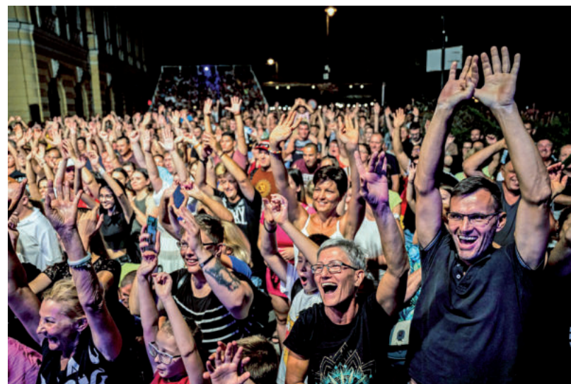
EZREK BULIZTAK A KONCERTEN

STRAND • Kész a családi, a kamikáze és az anakonda