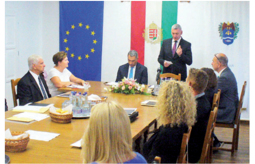
MEGALKULT AZ ÚJ KÉPVISELŐ-TESTÜLET

Lázár emlékeztetett arra, hogy a települések három forrásból juthatnak pénzhez. Az első a saját bevétel, ami sajnos Mártély esetében elenyésző, a másik a kormányzati támogatás, és ott vannak még az uniós pályázatok. A miniszteri posztot betöltő képviselő szerint az utóbbi két csatornán érkező pénz Mártélyra. Azonban azt is hozzátette, hogy a döntéshozókkal jőben kell lenni ahhoz, hogy megnyíljanak a pénzcsapok. Végül