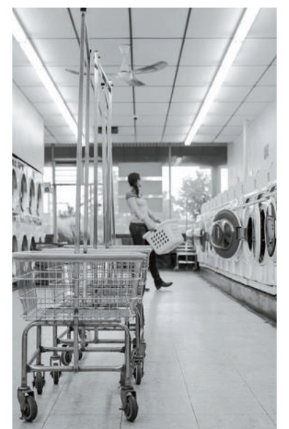
A MOSODÁK IS NEHÉZ HELYZETBE KERÜLHETNEK (A KÉP ILLUSZTRÁCIÓ)