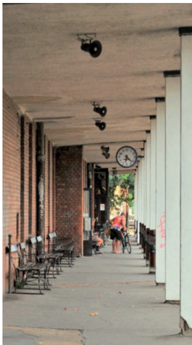
A MOSTANI ÉPÜLET HELYETT ÚJAT ÉPÍTHETNEK, HA FELÚJÍTJÁK A SZEGED-BÉKÉSCSABA VASÚTVONALAT

A tervezett munkálatok egyébként a Szeged-Békéscsaba vasútvonal csak azon szakaszát érintik majd, ha ténylegesen megindulnak, melyet a tram-train miatt nem újítottak fel, azaz a Szeged-Nagyállomás és Szeged-Rókus, illetve a Vásárhelyi Népkert állomástól Békés megye