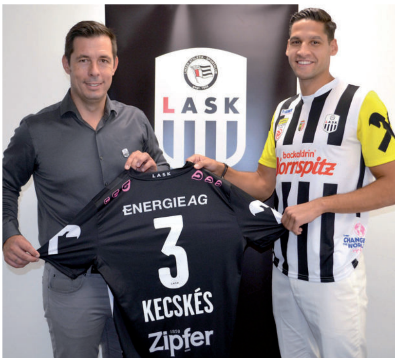
MÁR TÉTMECCSEN IS VISELHETTE A MEZT KECSKÉS ÁKOS