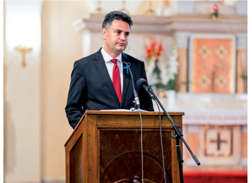
SZENT ISTVÁN INTELMEI MA IS AKTUÁLISAK

A városi ünnepségen közreműködött a Fandante Kamarakórus. ■