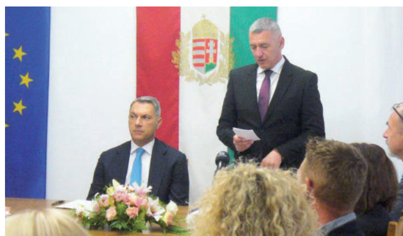
A JÓ VISZONY ELÉG A PÁLYÁZATOK MEGNYERÉSÉHEZ?