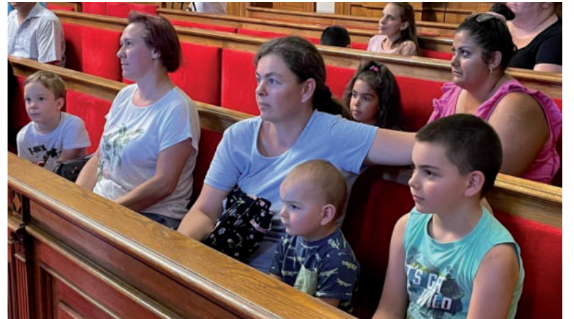
18 TEHETSÉGES GYERMEK ÉS SZÜLŐI KAPTAK INGYEN VÁROSKÁRTYÁT

85 család vett részt a Petra Modellprogramban, augusztus 18-án pedig 18 kiválóan teljesítő gyermek és szülője vehetett át városkártyát. Ezeket Márki-Zay Péter polgármester és Berényi Károly alpolgármester, mint az ajándékot finanszírozó alapítvány alapítója adta át. Tóth István, a Petra Modellprogram koordinátora a Vásárhelyi Televízió elmondta: az önkormányzat részéről ösztönzőleg szerettek volna a családok, jó tanuló gyermekek részére ingyen városkártyát biztosítani, azért, hogy a csúszdapark