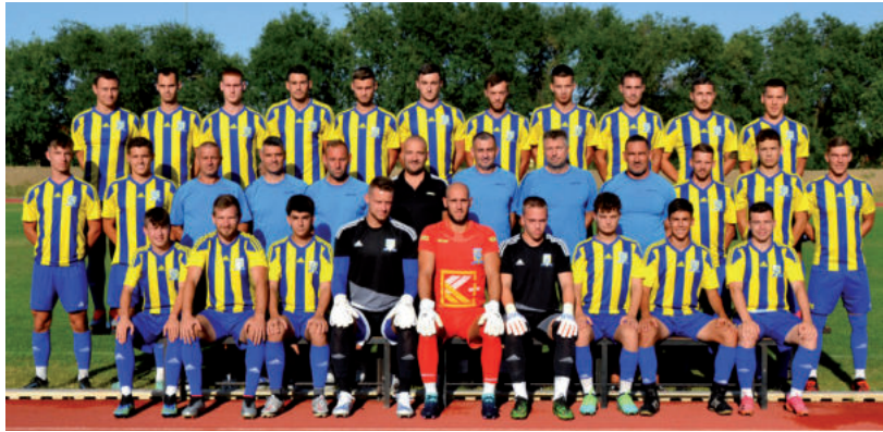
NAGYON EGYÜTT VAN A CSAPAT