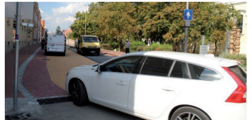
ISMÉT TELJES HOSSZÁBAN JÁRTHATÓ A MEGÚJULT SZENT ANTAL UTCA

118 millió forintért újította fel a Dél-Konstruktív Kft. a Vásárhely belvárosában lévő Szent Antal utcát, mely teljesen új járdát, kerékpárutat és úttestet kapott, ráadásul növényeket, az iskola oldalára pedig fákat telepítettek. Fát ezen az oldalon itt utoljára azok láttak, akik a késő hetvenes években jártak erre felé. A munkálatokat tavaly karácsony előtt, az ott lévő üzletek kérésének megfelelően felfüggesztették, hogy azt az idén januárban folytassák.