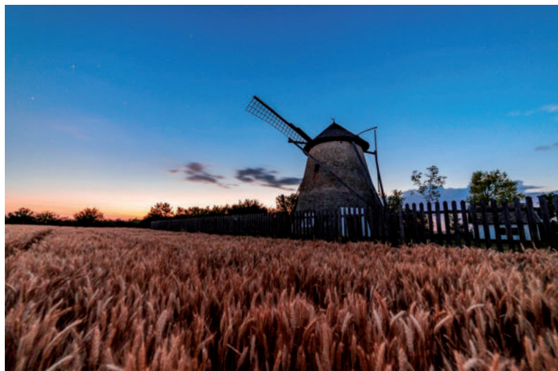
TÍMÁR BENEC: PAPI-FÉLE SZÉLMALOM; I. HELYEZÉS