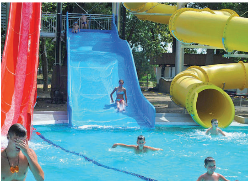
ÖRÖMMEL PRÓBÁLTÁK KI A GYEREKEK A CSÚSZDÁKAT

Az elmúlt évek egyik legnagyobb fejlesztése ez a három csúszdából álló csúszdapark. A strandot 2018-ban kezdtük el fejleszteni, ez a csúszdaelem ennek a leglátványosabb, de nem az egyetlen eleme – hangsúlyozta az átadón Márki-Zay Péter.