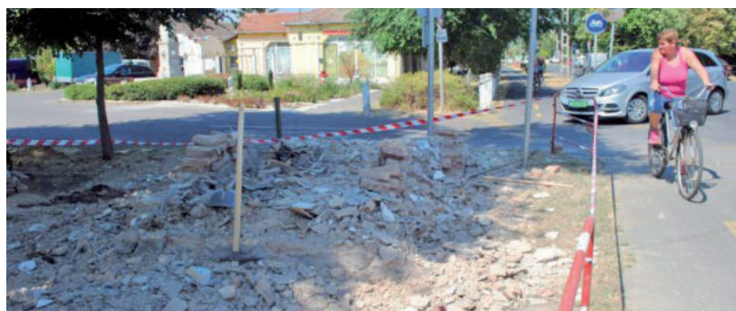
BELÁTHATÓBB LETT A KERESZTEZŐDÉS