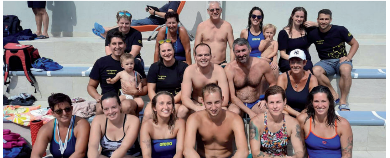
NÉGY ÚJ ORSZÁGOS CSÚCS SZÜLETETT A HÓD-TRIATLON ÚSZÓITÓL