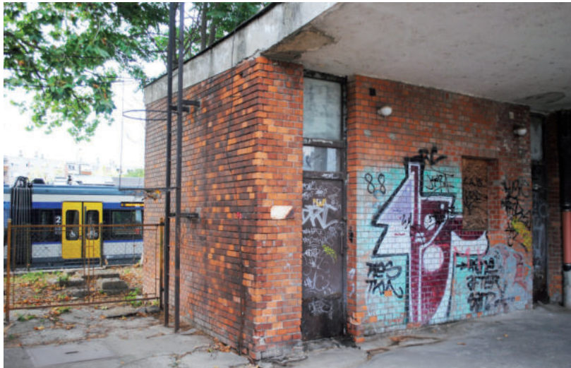
A FELÚJÍTÁS MIATT ELBONTHATJÁK AZ ÉPÜLETET