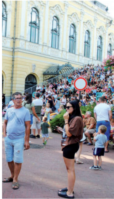
NEM MINDIG VOLT ELÉG A NÉZŐKNEK A SZÉKEK SZÁMA