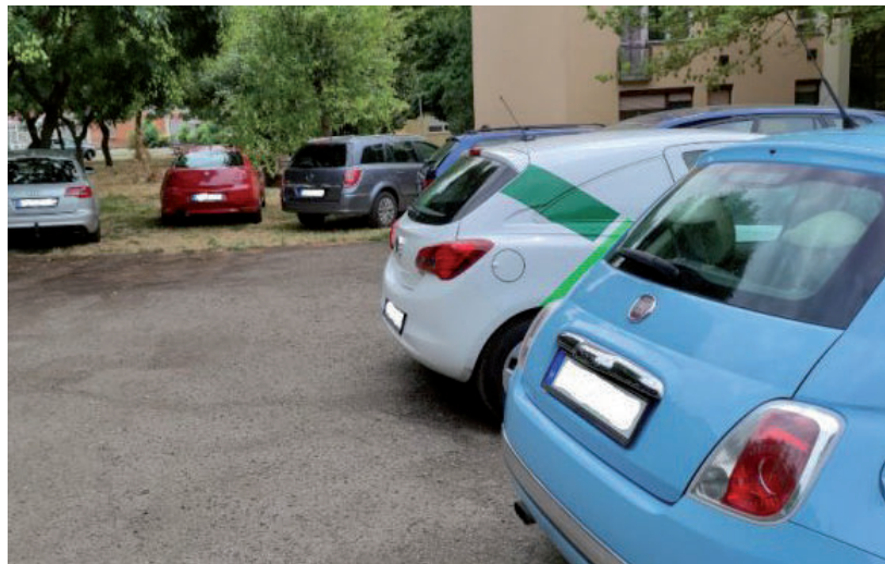
NEHÉZ A FELSZÍNEEN SZABAD HELYET TALÁLNI HÉTKÖZNAP