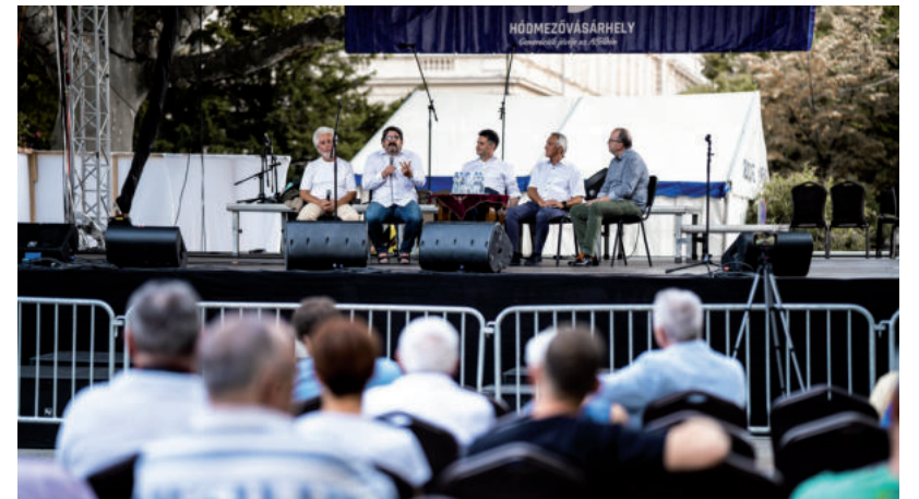
TANULSÁGOS KÖZLETTI BESZÉLGETÉST HALLGATHATTAK AZ ÉRDEKLŐDŐK

Gáspárik azt is hozzátette, hogy még a legstótebb Ceausescu-időkb