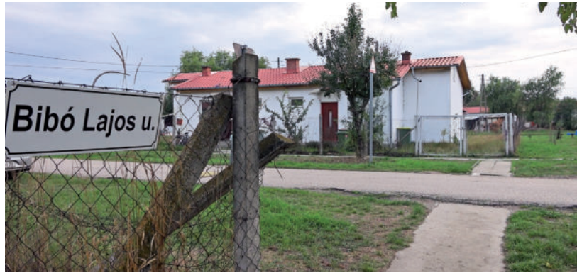
A MEGEMELKEDETT ÁRAK MIATT KELLETT A PLUSZ TÁMOGATÁS (A KÉP ILLUSZTRÁCIÓ)