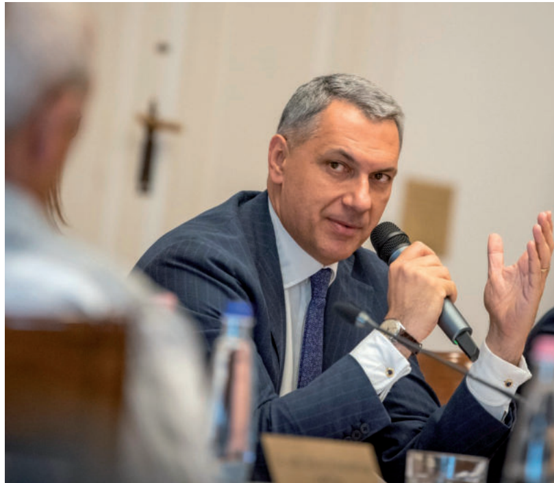
LÁZÁR JÁNOS SEMMI JÓVAL NEM BIZTATTA A MAKÓI KÉPVISELŐ-TESTÜLETET

„Arra kell felkészülni, hogy a helyi adóbevételeket ilyen típusú működési költségekre kell fordítani, a fejlesztéseket pedig valószínűleg el kell halasztani, át kell ütemezni” – idézte Lázárt a Promenad24-gyel egy kiadóhoz