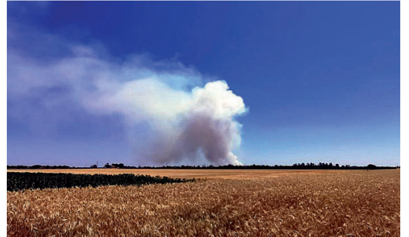
SOK A TŰZESÉT MOSTANÁBAN A MEGYÉBEN

Június 20-án Makó külterületén és Kübekházán égett a gabona, és ősgyep is lángra kapott Békéssámszon mellett. Ezek előtt és ezek után is többször lángolt a gabona vagy éppen száraz fű a megyében. Ennek is a következtében a Belügyminisztérium Országos Katasztrófavédelmi Főigazgatósága tűzgyújtási tilalmat rendelt el június 22-étől Csongrád-Csanád, Bács-Kiskun,