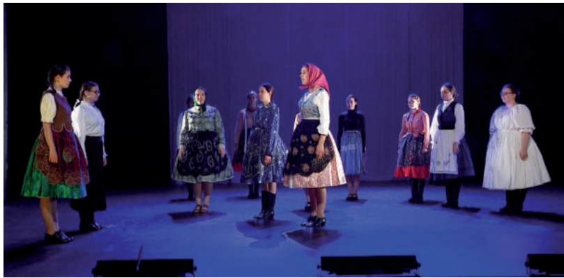
LÁTVÁNYOS MŰSORT ADOTT A KANKALIN NÉPTÁNCGYŰTTES

Nem ez volt az egyetlen évfordulós rendezvény. Június 23-án mutatták be azt a fotókiállítást, valamint a Vásárhelyi Televízió által készített dokumentumfilmet, amely a helyi értéktár kincseként is jegyzett, Bessenyei-díjas néptáncgyűttes történetét mutatta be, majd szombaton egy Viseletes bállal zárták a nagyszerrű három napot. ■