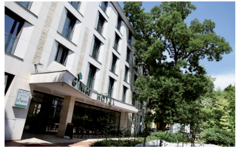
NÉPSZERŰEK VOLTAK A VÁSÁRHELYI SZÁLLÁSHELYEK