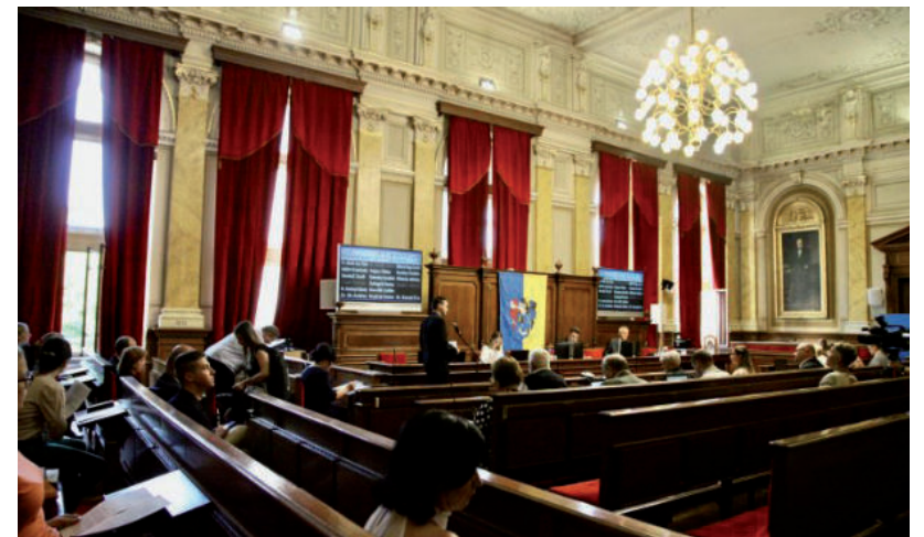
MÓDOSÍTOTTÁK A KORÁBBI DÖNTÉST, 2023 VÉGÉN SZŰNIK MEG A TÁRSULÁS

A június 28-i hódmezővásárhelyi közgyűlésen elhangzott, hogy a mindszei önkormányzat több mint 35 millió forinttal tartozik a társulásnak. Hogy a szolgáltatások biztosítva legyenek, a többi önkormányzat kérését figyelembe véve úgy döntöttek Vásárhelyen, hogy a jövő év végén szűntetik meg a kistérségi társulást. ■