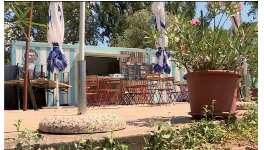
A VENDÉGLÁTÓK IS VÁRJÁK A FŐSZEZONT

hintá, és a mászóvár. Néhány napja a kalandpark is megnyitott. Hepp Diána, a városüzemeltetési csoport ügyintézője elárulta, hogy felújították a játszóeszközöket, kicserélték a tartóoszlopokat. Átfestették őket, valamint a csavarok javítása is megtörtént, illetve az ütőcsillapító felületet is feltöltötték homokkal. A legbalesetveszélyesebb fákat kivágták, a nemzeti parkkal konzultálva.