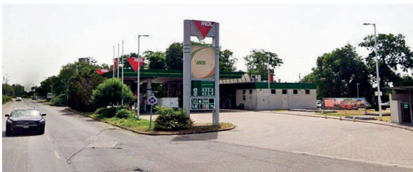
A MOL KEZDTE A KORLÁTOZÁSOKAT

Június 16-án jelentette be Facebook oldalán Orbán Viktor, hogy október elsejéig meghosszabbította a kormány az élelmiszerárstopot, és az üzemanyagok hatósági ára is 480 forint marad. A hitelmoratóriumot és a kamatstopot is hosszabbításra került, december 31-ig, mondta a miniszterelnök.