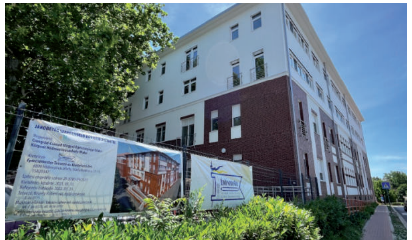
ŐSZTŐL MÁR JÖHETNEK A BETEGEK

Még egy keveset várni kell, hogy a legmodernebb körülmények fogadják a vásárhelyi kórház belgyógyászati és gyermekosztályának betegeit. Az eredeti határidőhöz képest két hónap csúszásban van a kórházbővítés építészeti munkáinak befejezése, ami azt jelenti, hogy július első napjaiban kell végleg levonulnia a kivitelező Építésmester Zrt.-nek. Ezzel még nem ér véget a beruházás, a Csongrád-Csanád Megyei Egészségügyi Ellátó Központ ugyanis június 7-én hirdette meg azt a versenylejárást, melynek révén eszközökkel rendeznék be az új szárnyat. A felhívás szerint lapzártánk utáni, július elsejéig kell benyújtani az árajánlatokat, a nyer-