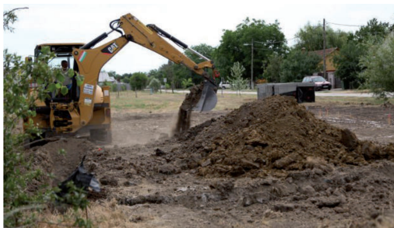
A MARKOLÓK MÁR DOLGOZNAK