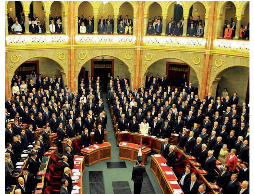
MÉG FELESLEGESEBB LENNE A VAGYONNYILATKOZAT