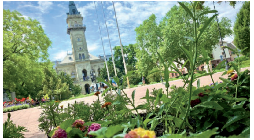
HATÉKONYABB LEHET AZ ÖNTÖZÉS MAJD A KOSSUTH TÉREN

A virágágyások köré csepegtető rendszer kerül kiépítésre, a többi helyen pedig a fűvet öntözőfejekkel fogják öntözni, így gazdaságosabban tudják üzemeltetni az