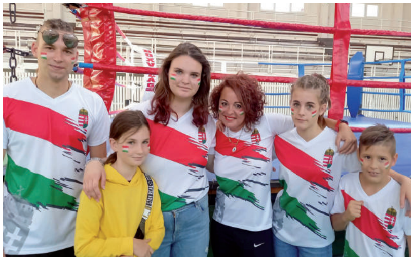
A HÓDMEZŐVÁSÁRHELYI BOX CLUB IS EGYRE SIKERESEBB

A fizikai állapota mellett, lelkiileg is jól érzi magát a vásárhelyi csapatban, és minden fiatalnak azt ajánlja, hogy mozogjanak, és tartozzanak valahová. ■