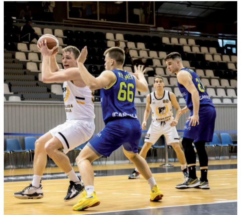
JÓL SZEREPELTÉK A FELNŐTTEK IS

Nagyon büszkéek arra, amit idén elértek fiataljaik a bajnokságokban. Az U20-as csapatuk épphogy lemaradt a dobogóról, az U18-as és U16-os együtteseik régiós bajnokként szerepeltek a regionális bajnokok tornáján, ahol mindkét csapat hajszál híján maradt le az első helyről. Az U14-es korosztályban egy lány és két fiú csapattal indultak. Míg egy másik, az U14-es korosztályban