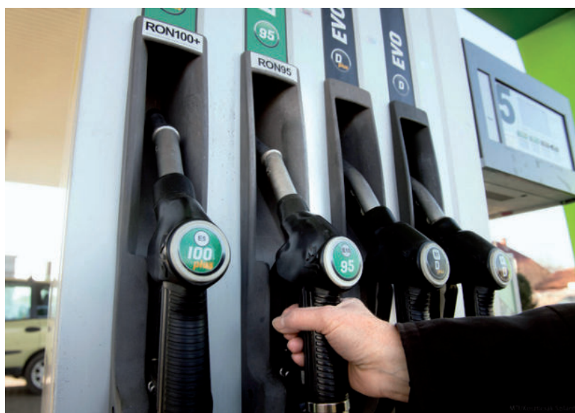
TÖBB KÚT IS KORLÁTOZÁST JELENTETT BE

Később a 79 magyarországi Lukoil töltőállomást üzemeltető Normbenz Magyarország Kft. a Telex megke-