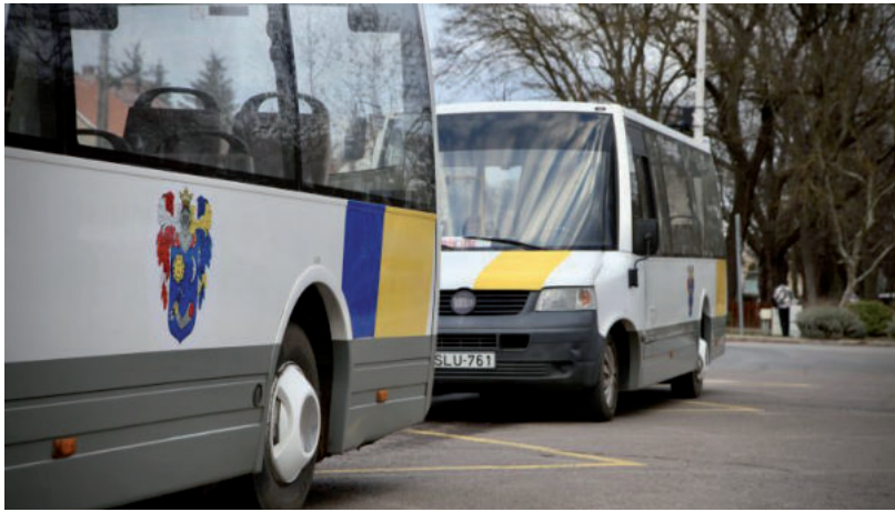
ÚJ FRONTON DÚL A BUSZHÁBORÚ VÁSÁRHELYEN

Az önkormányzati közleményből a bírság részletei is kiderülnek: A Közbeszerzési Hatóság Közbeszer-