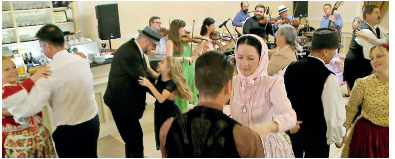
A SZOMBATI NAPON EGY VISELETES BÁLAL ZÁRTÁK AZ ÜNNEPNAPOKAT

A verseket nagyon szépen és úgy válogatták az esthez, hogy azok