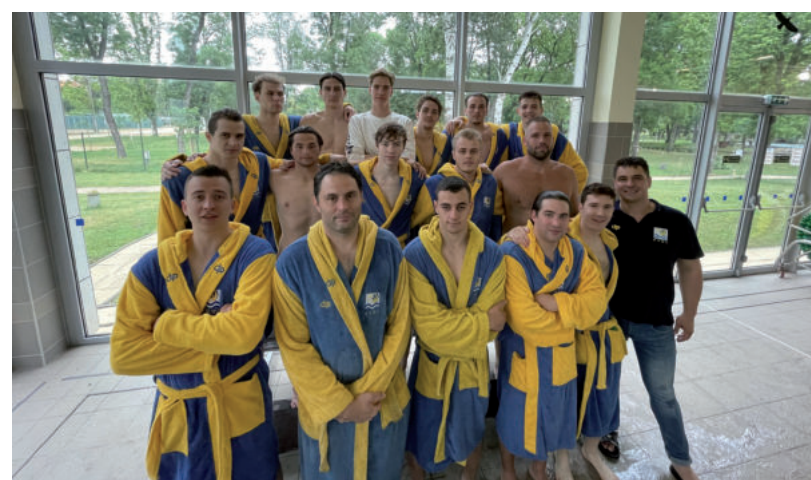
A VÉGÉN NAGY SKALPOT GYÚJTOTTEK BE A VÍZILABDÁSOK IS

először 3-1-re kikapott a debreceni DEAC U23-as csapatától, az 5-8. helyért utána először összesítésben legyőzte a Kecskeméti, majd kikapott a MEAFC-Miskolc együttesétől. A Bodrogi Bau Vásárhelyi Kosársuli összesen 17 győzelemmel, 1 döntetlennel és 16 vereséggel búcsúzott a szezontól.