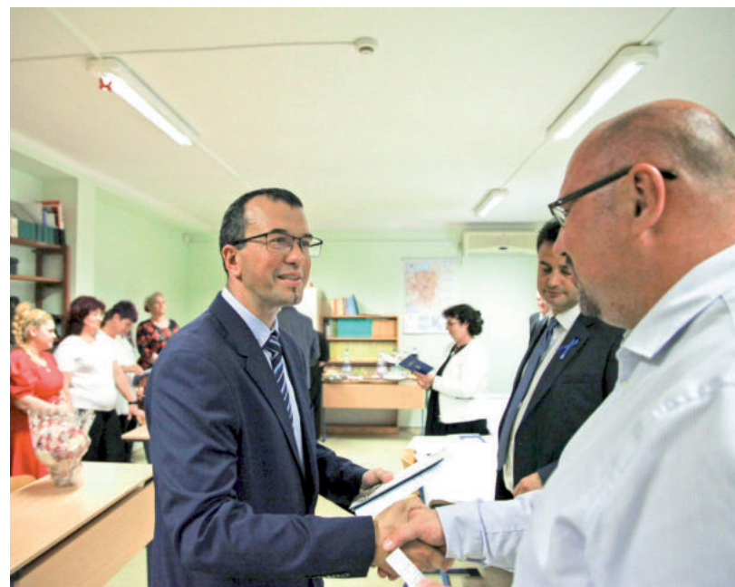
A BIZOTTSÁG TAGJAIN KÍVÜL AZ ÖNKORMÁNYZAT IS KÖSZÖNTÖTTE A VIZSGÁZOTTAKAT

lyozta, az érettségi sok szakma felé nyithat új utakat, és reméli, hogy a legtöbben Hódmezővásárhelyen találják meg a boldogulásukat és a boldogságukat. ■