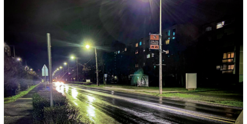
7695 LÁMPATESTET KELL FELÜGYELNI

Az elektronikus közbeszerzési rendszerben közzétett bírálati dokumentum szerint felhívásra két ajánlat érkezett: a legjobbat a