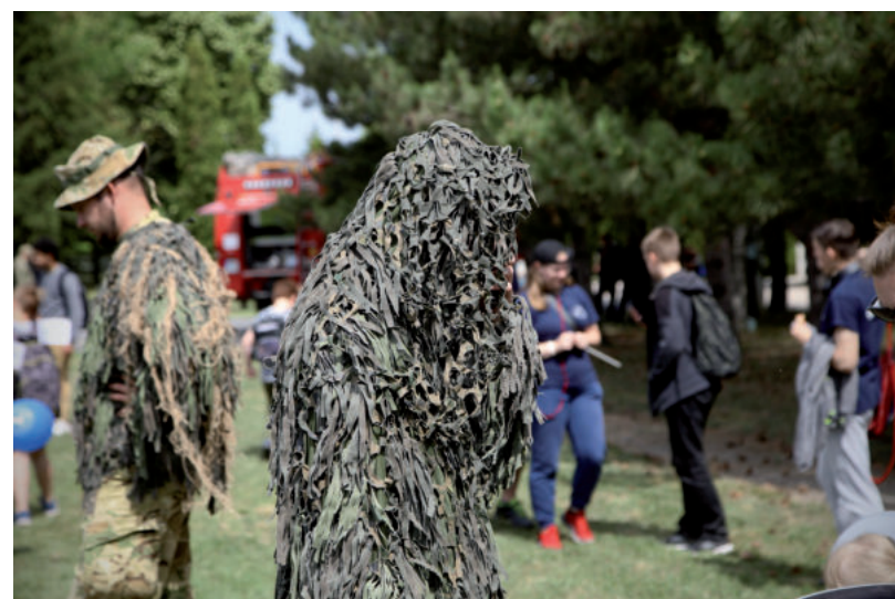
KATONAI FORTÉLYOKAT LEHETTEK EL

A világban zajló események megmutatták, hogy a honvédelem fontos. Ez nem csak a katonák, hanem az ország ügye. Ezért fontos a kapcsolat a lakossággal és olyan programok szervezése, ami azt vonzóvá teszi. Egy ügyességi pályán, fegyverrel a kezben is kipróbálhatták magukat a látogatók, de megnézhettek a rendőrség bombakereső kutya bemutatóját és a katonák alakí bemutatóját is. ■