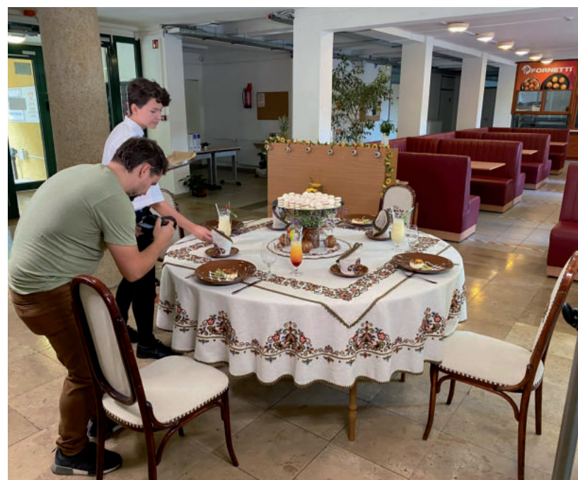
KÜLÖNBÖZŐ MESTERSÉGEKET LEHET TANULNI.

Az elnök hozzátette, a kamarának saját tábora is lesz. Régóta foglalkoznak az informatika térnyerésével, a robotika fejlődésével. Így támogatják azokat az iskolákat, ahol ilyen képzés van, másrészt belefogtak egy robotika-sarok építésébe, ami már elkészült. Idén nyáron indítanak egy programot, ahol az alsó- és felső tagozatosoknak lesz tábor. ■