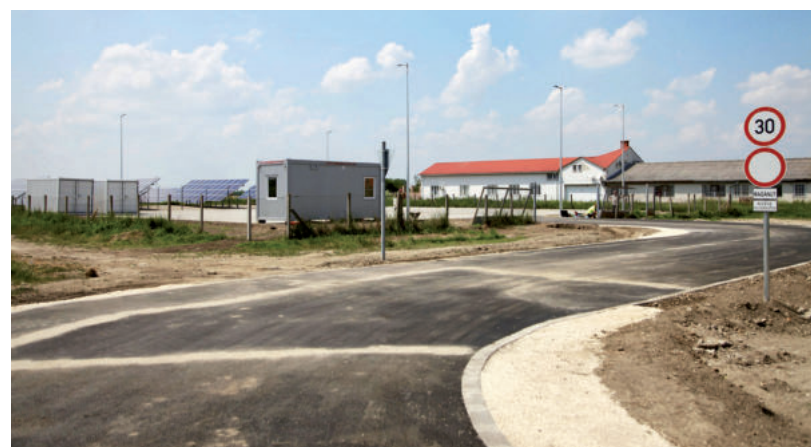
A SZENTESI ÚTON MÁR MAJDNEM KÉSZEN VAN AZ ELSŐ VÁSÁRHELYI HULLADÉKUDVAR

A hulladékudvarok főként európai uniós forrásokból épülnek ország-