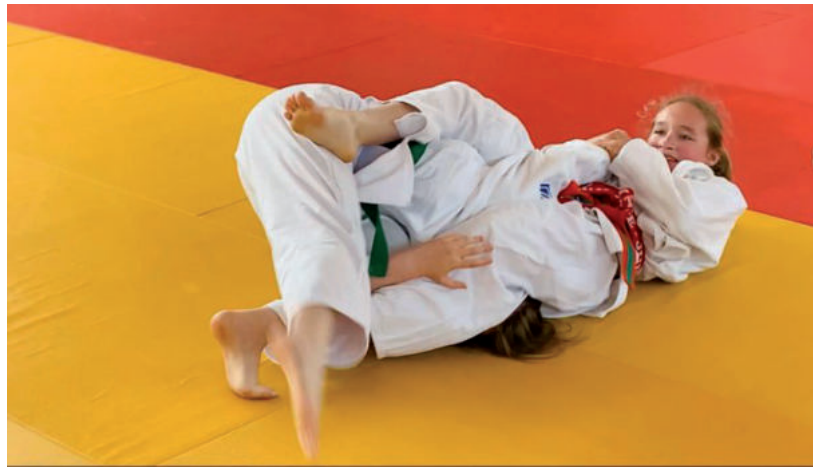
SOK ÖSSZECSAPÁST NYERTEK A HÓD JUDO SE VERSENYZŐI