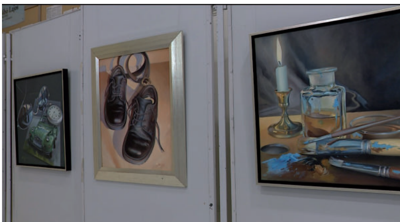
MESTER ÉS TANÍTVÁNYÁNAK KIÁLLÍTÁSA EGÉSZ NYÁRON LÁTHATÓ A VÁROSI KÖNYVTÁRBAN