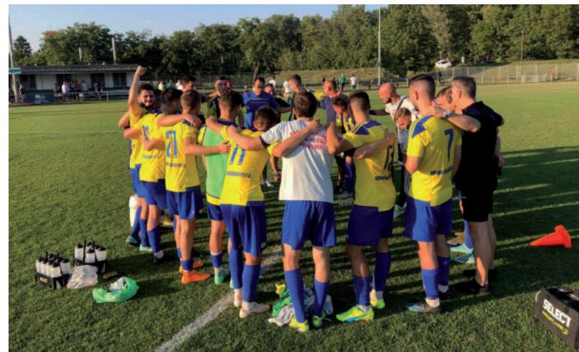
VAN OK A BOLDOGSÁGRA A LABDARÚGÓKNÁL IS