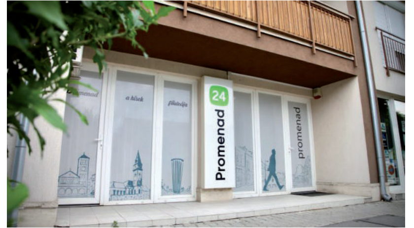
DRASZTIKUSAN LECSÖKKENT A SZERKESZTŐSÉG LÉTSZÁMA, EGYES INFORMÁCIÓK SZERINT KETTEN MARADTAK