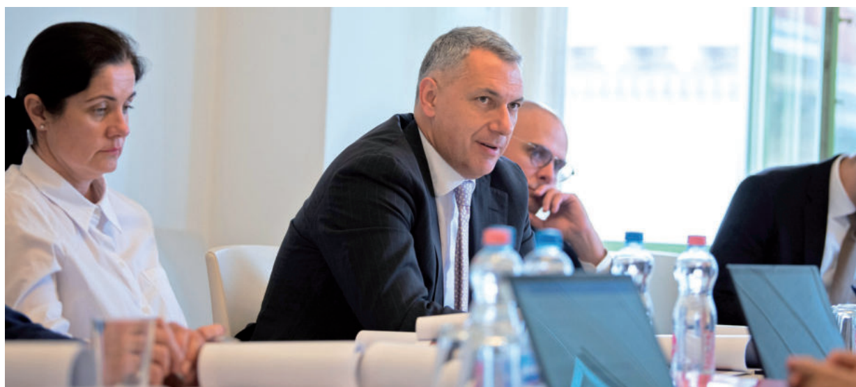
TÖBB EZER ÁLLAMI BERUHÁZÁS ÁTTEKINTÉSÉRŐL ÍRT A MINISZTER ÉS ELKÉSZÜLÉSÜKET A KÖVETKEZŐ ÉVEKRE TETTE

Emlékeztet, a miniszter a két héttel korábbi parlamenti meghallgatásán már jelezte, hogy az első és legfontosabb feladatai között szerepel, hogy áttekintsék az állam beruházásait. Adott esetben felül kell