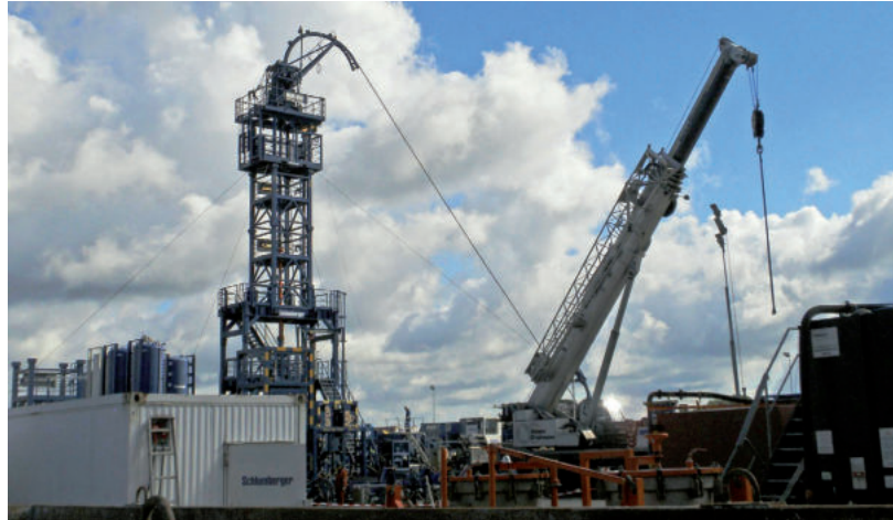
JELENLEG NEM REÁLIS, HOGY ILYEN KÉP LEGYEN MAKÓ MELLETT (ILLUSZTRÁCIÓ)

„Az energiaszektor egy nagyon robusztus ágazat, nem lehet egyik pillanatról a másikra nagyon drasztikus technológiai váltásokat kivitelezni,