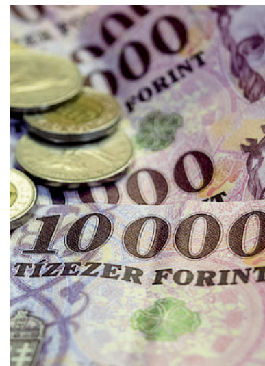
GYORSAN VÁLTOZIK A PÉNZ ÉRTÉKE

háború és az energiaválság mellett hatással lehetnek az amerikai inflációs adatok is. ■