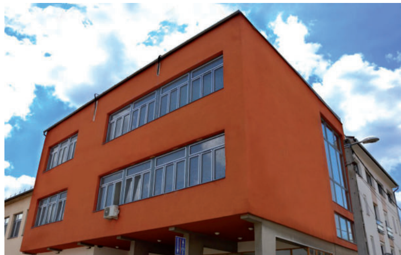
SAJÁT PROFILJUK ALAPJÁN SZERVEZNEK TÁBOROKAT AZ ISKOLÁK