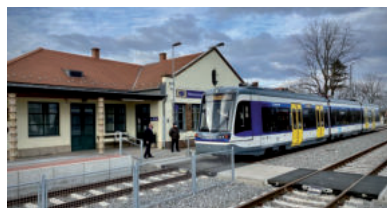
BÉKÉSCSABA FELÉ IS MEHETNE

telephelye(i) közötti közlekedésre alkalmas legrövidebb és kerülő vonalszakaszok, ha a fenti vonalszakaszokkal az nem esik egybe, továbbá