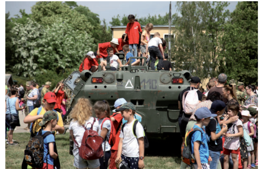
RENGETEG GYERMEK ÉRDEKLŐDÖTT

hattak a kezükbe gránátvetőt, vagy ülhetek be egy-egy páncélozott jármű vezetőülésébe. Voltak, akiknél személyes szál is felfedezhető volt, hiszen apja itt szolgált és ő is ezt a hivatást választaná.