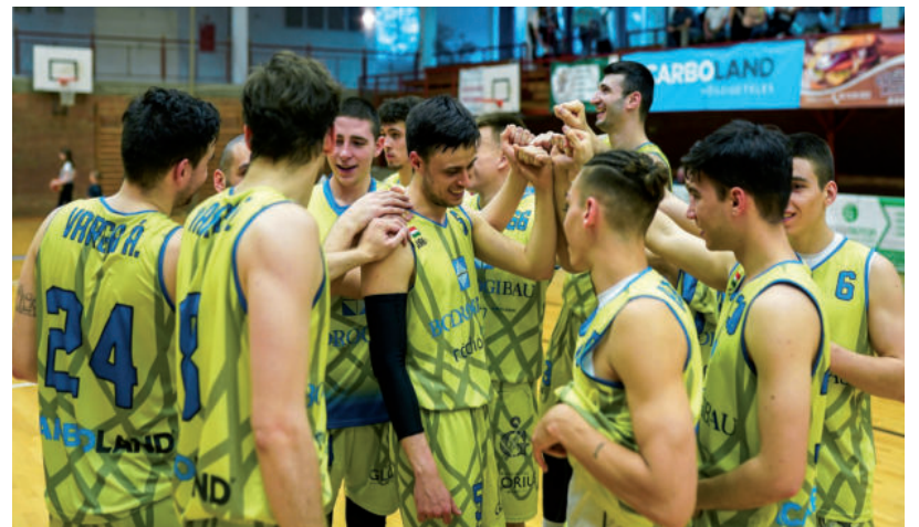
ELÉGEDETT LEHET A KOSÁRSULI