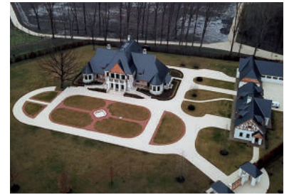
2018-BAN MÉG AZT MONDTA, NINCS KÖZE AZ ÉPÜLETHEZ

„Ez a 2 lehetőségem van: Vagy az erdőt adom el, vagy a vállalkozásból, ennek a vendéglátóipari vállalkozásnak a részvényeiből próbálok lehetőségekhez mérten valamennyit megvásárolni. Mérlegelni fogom még ezt az irányt, mind a kettőt. Nincs az épület-