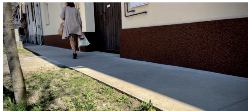
MOST IS SOKAN SZERETNÉNEK JAVÍTANI

A rendelkezésre álló 15 millió forint elosztásáról azt követően döntenek a városházán, hogy beérkeznek az árajánlatok a beszállítóktól. Várhatóan július elején születik arról, kik, mekkora támogatásban részesülnek, és ezt követően el is kezdődik az építőanyagok kiszállítása. A pályázók között vannak külterületen élők és lakóközösségek is. ■