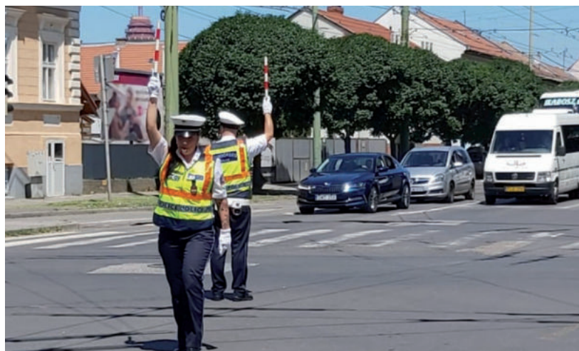
A FORGALOM JÓL HALADT A VERSENY MIATT IS