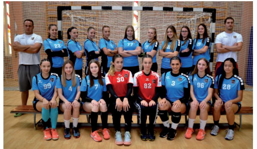
A VÉGÉRE NAGYON BELELENDÜLTEK A HLKC-S LÁNYOK

A 6. helyen zárta az NBI/B. Zöld csoportját a Bodrogi Bau Vásárhelyi Kosársuli. A szezon előtt a cél a playoffba kerülés volt, és ezt teljesítették is a fiúk, így a vezetőség elégedett lehetett. A rájátszásban