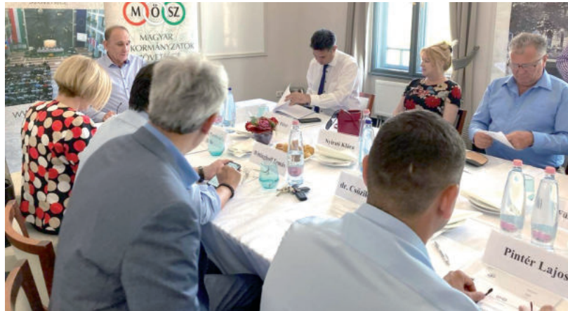
NEHÉZ HELYZETBE KERÜLNEK AZ ÖNKORMÁNYZATOK

Gémesi szerint pedig a következő költségvetési év során padlóra kerülnek az önkormányzatok. Ennek