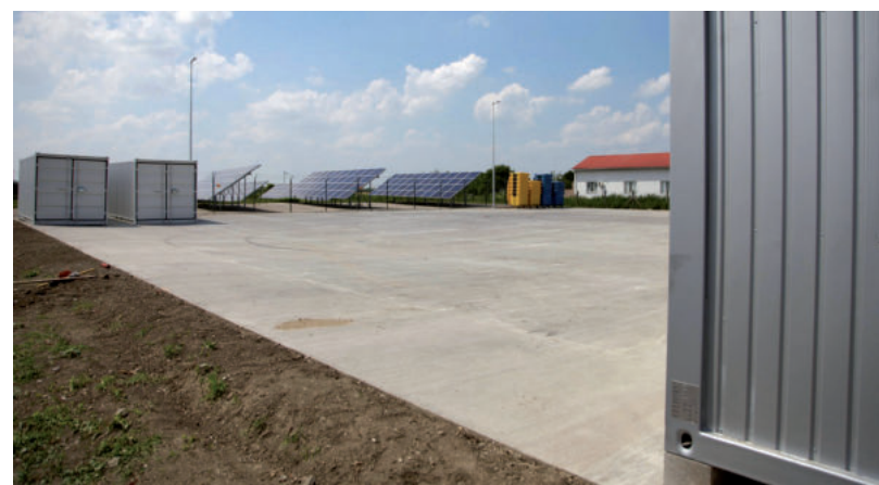
MÁS VÁROSBAN IS JÓL MŰKÖDIK EZ A SZOLGÁLTATÁS

Ezekbe a konténerekbe lehet belehelyezni a nagyobb lomot, a zöldhulladékot, az építési törmelékot, de a hulladékudvarban lehet elhelyezni az autógumit is például, vagy a háztartásokban keletkező hulladékot, az elemeket, akkumulátorokat, fénycsöveket, elektronikai hulladékokat. ■