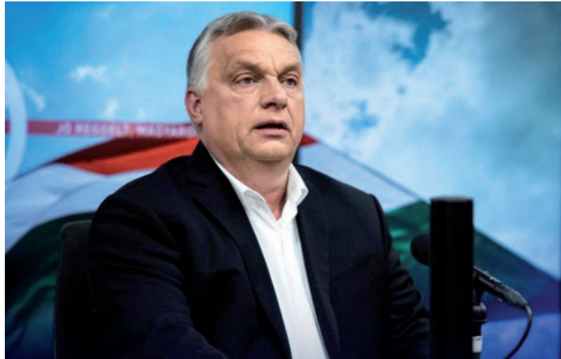
ORBÁN VIKTOR AZ ELSŐ NAPOKBAN TÖBB BEJELENTÉST IS TETT

„A ma esküt tett kormány azonnal megkezdte a munkáját. Egyetlen percet sem vesztegettünk, mert a szomszédunkban háború zajlik. Egy olyan háborút, amelynek még senki sem látja a végét” – fogalmazott a kormányfő. Orbán Viktor hangsúlyozta: ez a háború folyamatos veszélyt jelent Magyarországra, kockára teszi a fizikai biztonságunkat és veszélyezteti a gazdaság és a családok energiaellátását és anyagi biztonságát is. Orbán Viktor szerint ehhez mozgástérre és azonnali cselekvőképességre van szükség, a kormány ezért az alaptörvényben biztosított jogával élve ma éjjeltől kihirdeti a háborús veszélyhelyzetet. A járvány elleni védekezés alatt bevezetett veszélyhelyzethez hasonlóan ez is lehetővé teszi a kormánynak, hogy azonnal reagáljon és minden lehetséges eszközzel megvédje Magyarországot és a magyar családokat. Holnap tájékoztató fogam önéket az első döntéseinkről – zárta videóját a miniszterelnök. Emellett rezsvédelmi-, és honvédelmi alap létrehozását jelentette be május 25-én Orbán Viktor miniszterelnök.