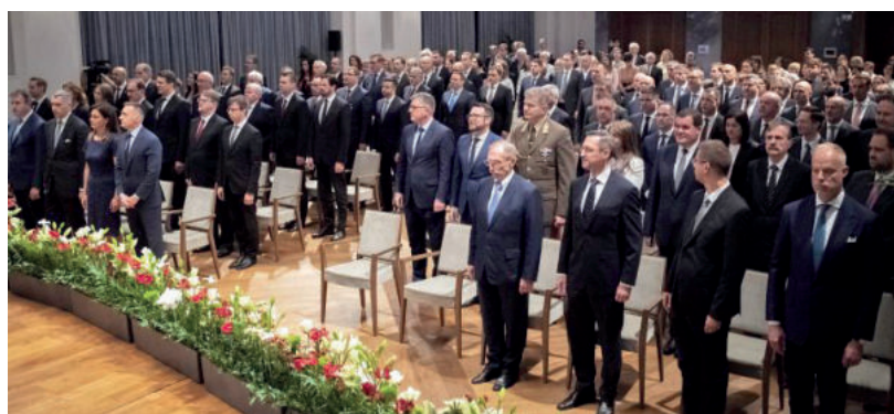
AZ ÚJ ÁLLAMTITKÁROK KINEVEZÉSI OKIRATAINAK ÁTADÁSA A KARMELETA KOLOSTORBAN 2022. MÁJUS 25-ÉN.