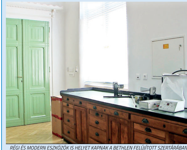
REGI ÉS MODERN ESZKÖZÖK IS HELYET KAPNAK A BETHLEN FELÚJÍTOTT SZERTÁRÁBAN

A fizika szertárat így tetőtől-talpig sikerült felújítani. Eredetileg a kiviteli terv a Modern Városok Programjához kapcsolódott, volna, de most ezt használták fel a munkálatok során. A szintén muzeális jellegű fizikai eszközöket a szertárba augusztus 15-ig pakolják vissza.