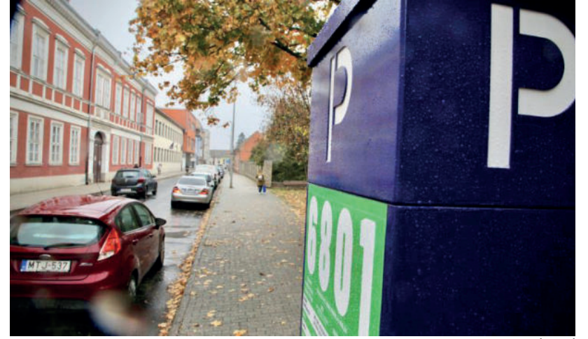
250 FT LESZ AZ ÓRADÍJ