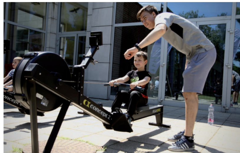
NÉPSZERŰ VOLT AZ EVEZŐSPAD IS