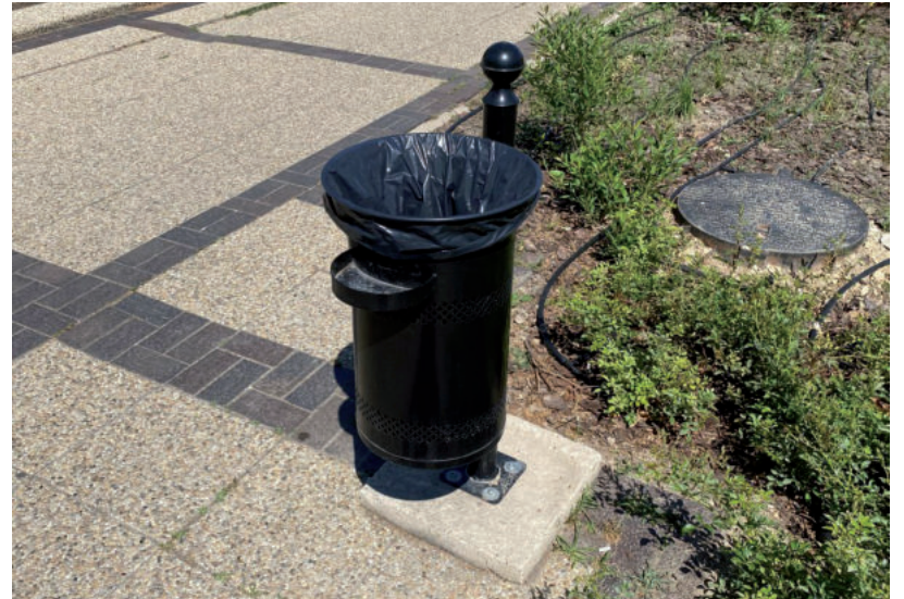
EZER HULLADÉKGYŪJTÓ VAN A VÁROSBAN

A városi közbeszerzések átláthatóságát segíti elő az a módosítás, amely a beszerzési tanács által ellenőrzött szerződések értékhatárát félmillió forintra csökkenti. Márki-Zay Péter szerint ez egy jól működő kontroll volt eddig is, hiszen a beszerzési tanács rendszeresen vizsgálta ezeket a pályázatokat, de eddig a felső határ egymillió forint volt. A polgármester azt várja ettől a rendelkezéstől, hogy még inkább átláthatóak lesznek a beszerzési folyamatok az önkormányzatnál, a tanács pedig hasznos javaslatokat tesz majd le az asztalra. Az is egy fontos változás, hogy eddig 3 millió forintig kellett nyílt eljárással beszerezni eszközöket, de ez az értékhatár mostantól 1 millió forint