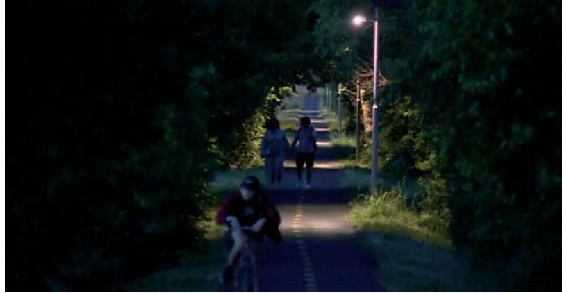
NAGYOBB BIZTONSÁGBAN LEHET MÁR BICIKLIZNI

Korábban egy közel 700 méteres szakaszon már kiépült a közvilágítás, ám vandálok megrongálták a kandalábereket. Ezért az új, napemmel működő világítótesteket és akkumulátorokat most 5 méter magasra szerelték, így remélhetőleg senki nem tesz kárt ezekben. Ezúttal 14 új kandalábert telepítettek, így újabb 1,2 kilométer kerékpárút kapott világítást. Ezek vandálbiztosak, nagyon haték-