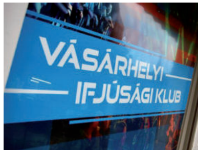
AZ IFI KLUBBAN TUDNAK A GYERMEKEKRE FELÜGYELNI

Az ellátásra azon gyermek jogosult, akinek szülője, vagy törvényes