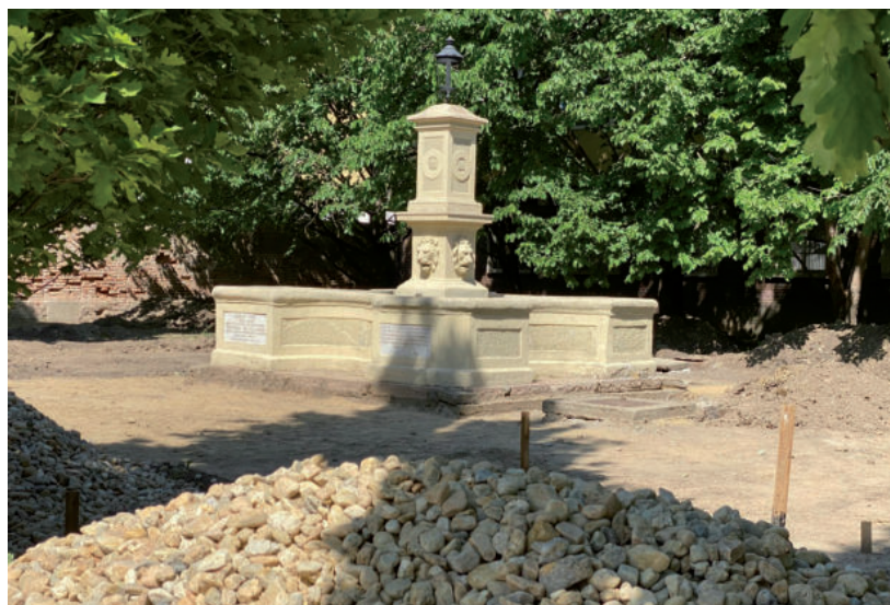
ÚJÍTJÁK A BAKAY-KÚT KÖRNYÉKÉT, AZ OROSZLÁNOK IS VIZET „KÖPNEK” MAJD

A Bakay-kút felújítása is zajlik, amely a körülötte lévő park teljes rehabilitációjának részeként szintén vízzel telik meg a vízforgató berendezés kiépítése után. ■