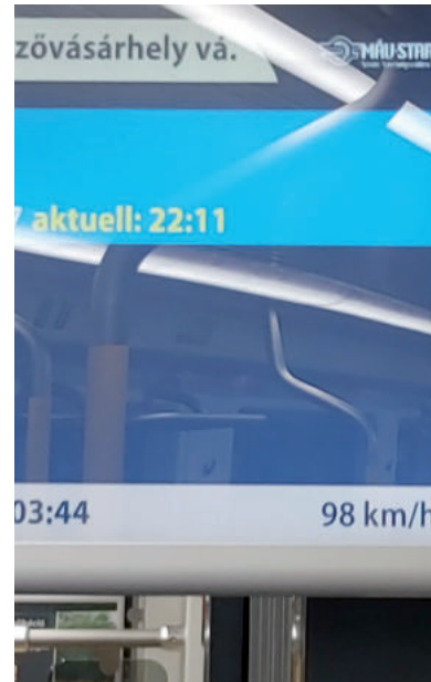
98 KM/H MÁR VAN, VÉGLEGES MENETREND MÉG NINCS

A lap konkrét választ nem kapott hogy mikortól, mennyit kell majd fizetni a vasútvillamoson. Ám azt a Technológiai és Ipari Minisztérium (TIM) közölte, hogy a hibák javításával még nem végeztek. A vonatok lengéscsillapítóinak cseréje folyamatban van, „a vasúti hatóság folyamatosan adja ki az engedélyeket a 100 km/órás sebességre, azokat mostanra már nyolcból hét jármű megkapta”. A pályahibával kapcsolatosan azt írták: „A hiba garanciális javítását a NIF Zrt. csak a vágány lezárása mellett végeztetheti el. A forgalom lehető legkisebb zavartatása érdekében a munkálatokat a jövő hét elejére, hétfőre virradó éjszakára időzíthetik. Ezt követően szüntetheti majd meg az üzemeltető a sebességkorlátozást.” A tárcsa pontos időpont meghatározása helyett csak annyit írt: „A tram-train használatát a tervezett teljes menetrendi struktúra életbe lépéséig ingyenes az utasok számára.” Menetközben már az utasok szá-