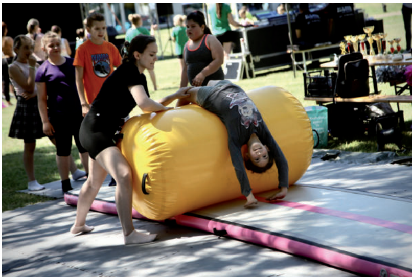
SOK GYERMEK KIPRÓBÁLTA A RUGANYOSSÁGOT IGÉNYLŐ SPORTÁGAKAT

A megnyitó eseményen Márki-Zay Péter polgármester azt emelte ki, hogy Hódmezővásárhelynek rendkívül gazdag a sportélete. A mai napon 30 egyesület mutatkozhatott be, és nemcsak Hódmezővásárhelyről, hanem a környező településekről is érkeztek diákok, akadtak akik kísérőikkel, mások szüleikkel jöttek,