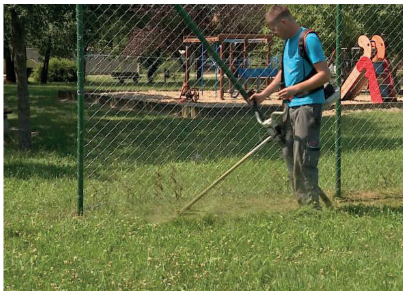
VÁLTOZNAK A MUNKASZERVEZÉSI MÓDSZEREK (A KÉP ILLUSZTRÁCIÓ)

Márki-Zay Péter jogosnak nevezte a kritikát, bár ő maga azért más városokban is látott problémákat. Fel is volt háborodva, hogy minden tavasszal ez téma kell, hogy legyen.