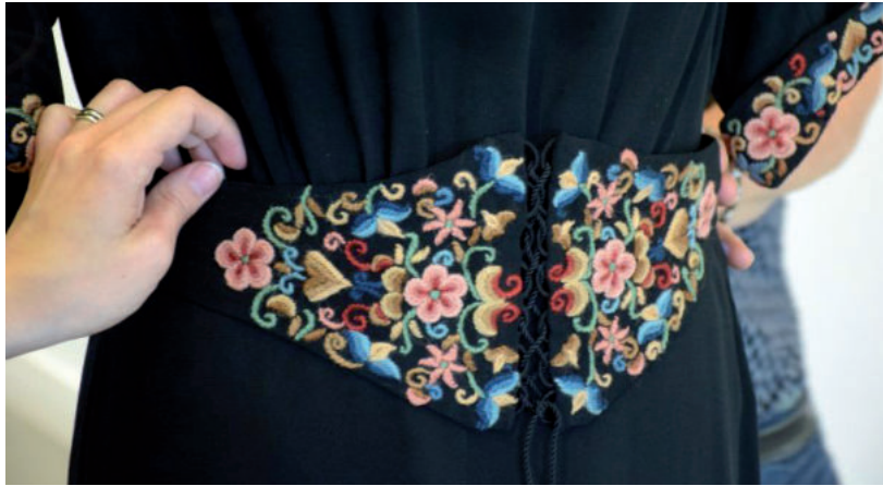
A BERLINI OPERÁBAN IS KIÁLLÍTOTTÁK A KÜLÖNLEGES HÍMZÉST