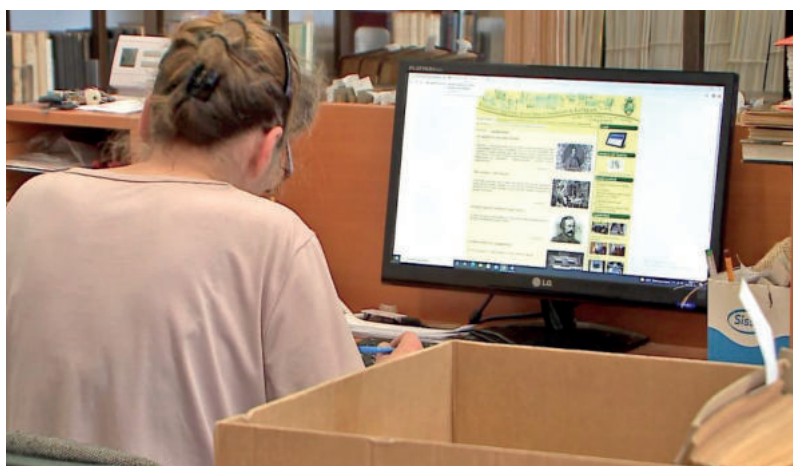
SOKAN SEGÉDKEZNEK AZ ANYAGOK FELDOLGOZÁSÁBAN