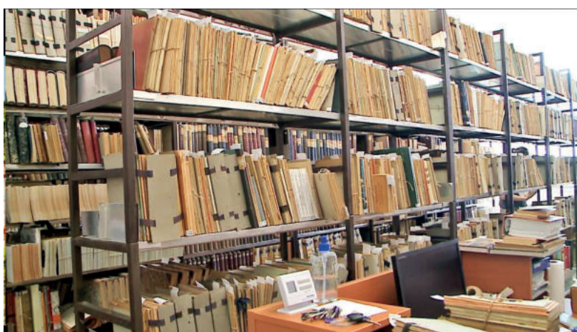
FONTOS SZEREPE LESZ A KÖNYVTÁRI ÉS LEVÉLTÁRI ANYAGNAK IS