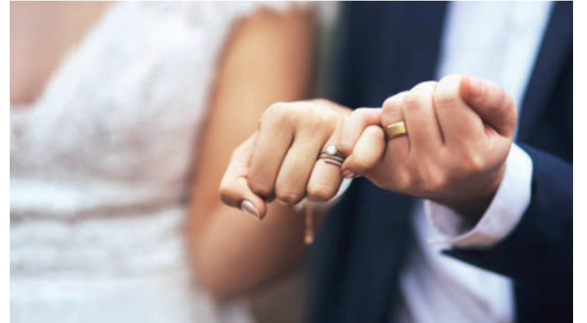
300 FELETTI ESKÜVŐ VÁRHATÓ IDÉN IS VÁSÁRHELYEN