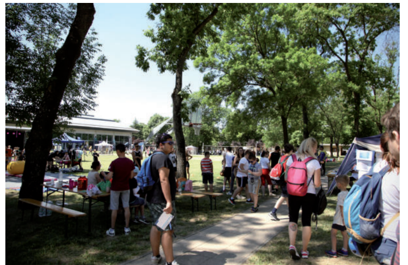
MEGTELT GYERMEKKEK A STRANDFÜRDŐ

mezővásárhelyi Kézilabda Egyesület csapatának utánpótlás edzője is azt emelte ki, hogy bár nagyon népszerű a kézilabda Magyarországon, a megyében, és ezen belül Hódmezővásárhelyen is, de mivel egyébként is rendkívül gazdag Hódmezővásár-