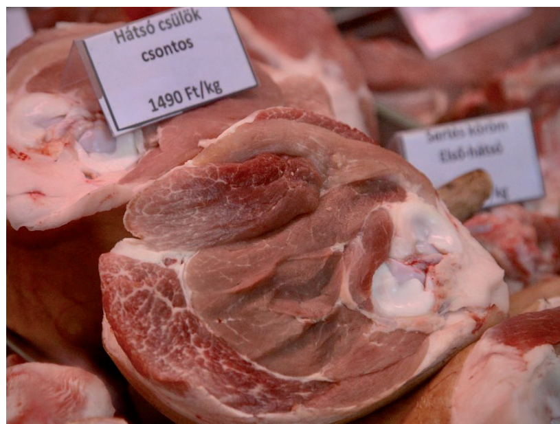
ÁLTALÁNOS LESZ A DRÁGULÁS A HÚSOKNÁL IS

Pont úgy, mint az év végi ünnepeknél, húsvét előtt szűk egy hónappal sem tolonganak az emberek a sonkáért, általában az a tapasztalat, hogy az utolsó héten szeretnének bevásárolni. A jó házi májas, hurka-kolbász sem megy ki a divatból, és ahogy jön a jó idő előkerülnek majd a grillkolbászok is, mindenki öröme. ■