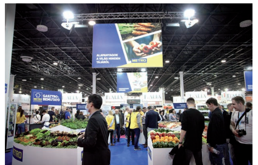
A KÖLTSÉGEK EMELKEDÉSÉT A PÉNZTÁRCÁNK IS MEGÉRZI.

A rendezvényre kilátogatott Papp Zsolt György, az Agrárminisztérium vidékfejlesztésért felelős helyettes államtitkára is, aki a Magyarországon termelt élelmiszert hazánk önrendelkezésében kulcskérdésként látja. Nyilatkozatában azt mondta, nagy a potenciál a mezőgazdaságban, annak a célnak az érdekében, hogy saját magunknak tudjunk megbízható, jó minőségű élelmiszert előállítani. Ezt a célt tűzte maga elé