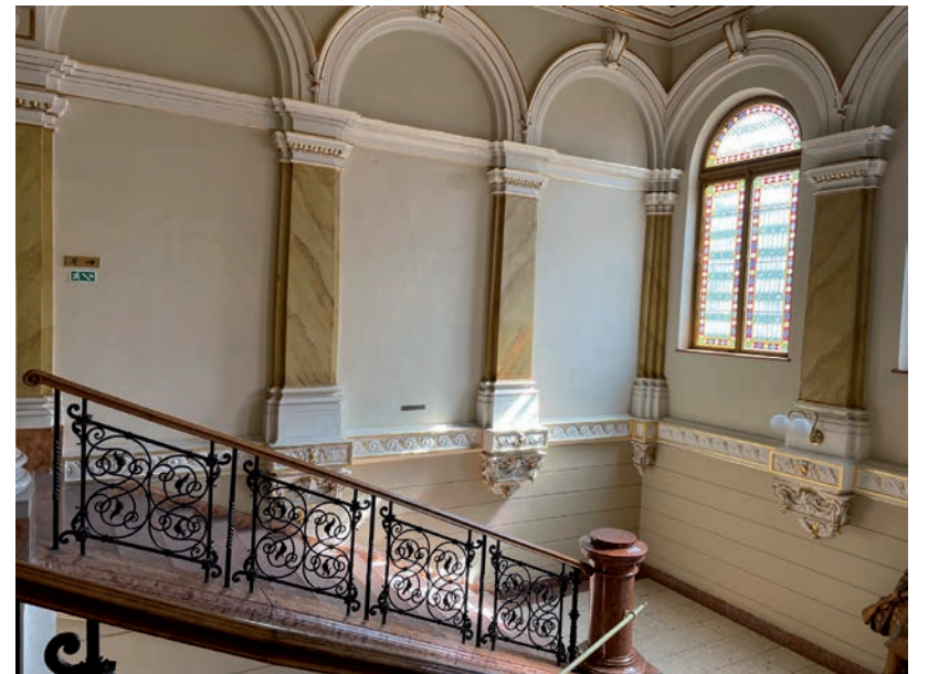
A HÓDMEZŐVÁSÁRHELYI REFORMÁTUS EGYHÁZ GYŰJTEMÉNYÉBE KERÜLTEK A KÉPEK