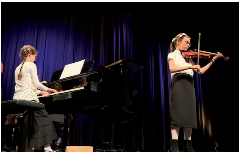
ZENEI TÉREN TÖBB HANGSZEREN MEGMUTATTÁK MAGUKAT A DIÁKOK

Általános Iskola intézményvezetője azt mesélte, hogy amikor a zene világnapján ünnepségüket a tornateremben rendezték meg, akkor gondolták, hogy ezt a nagy közönség elé kellene vinni, mert annyira tehetséges gyerekek vannak, hogy ezt meg kell mutatniuk országnak-világnak. Úgy elvárásolták őket, mondta, hogy egyből azt mondták, ezt a varázslatot nem hagyják az iskola falai között, hanem elhozzák a BFMK-ba.