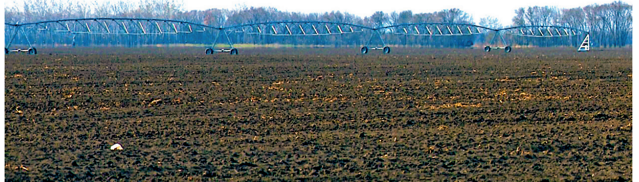
AZ ÖNTÖZÉS NEM PÓTOLHATJA TELJESEN A CSAPADÉKOT