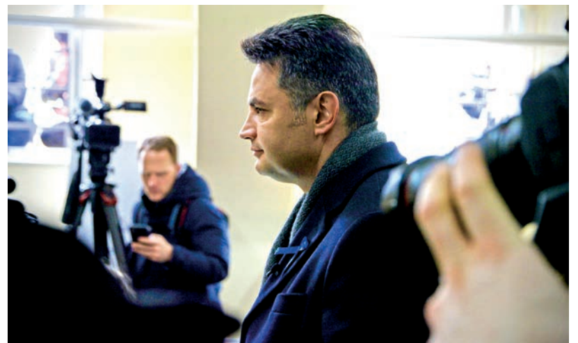
PÁRTJELVÉNYNEK TEKINTETTÉK A KORRUPCIÓ ELLENES KÉK SZALAGOT

Több bejelentés is érkezett az országgyűlési választás napján a helyi választási bizottsághoz. Az egyik állampolgár azt sérelmezte, hogy – noha személyes adatai politikai tartalmú üzenetek továbbítására történő felhasználásához korábban nem járult hozzá – sms-t kapott azazal a szöveggel: „...a bátrak változást hoznak április 3-án. Légy egyike azoknak”. A kifogást elutasították. Volt, aki név nélkül tett bejelentés arról, hogy szerinte „undorító és felháborító”, hogy Márki-Zay Péter kampánybusza a Cseresnyés kollégiumban felállított 3. számú szavazókörrel szemben parkolt. Ennek a kifogásnak a vizsgálatát is elutasította a bizottság, mivel a bejelentő