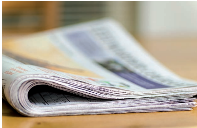
HIÁBA KÉTHARMADOS FELHATALMAZÁS, A NEMZETKÖZI SAJTÓ NEM KÍMÉLI ORBÁNT

hogy a Bizottság végre járjon el Magyarországgal szemben, miután a választás megghiúsított egy sor reményt. Ráadásul a két oldal messze nem egyenlő feltételekkel vívta meg a versenyt. Orbán ugyanakkor semmibe veszi a demokratikus értékeket, amit jól mutatott az ukrainai háború is. Egyben Putyini kijárója az EU-ban, de most már Varsóval is szembekerült az oroszok miatt. Am az unió nem hagyhatja ennyiben. Mert még az első győzelem sem jogosítja fel a miniszterelnököt a liberális demokrácia felszámolására. Ehhez a pénz jelenti a leghatásosabb ellenszert. A Nyugat nem teheti meg, hogy a válság miatt szemet hunyjon a jogsértések felett, saját értékeit elárulva vegye meg az egységet.