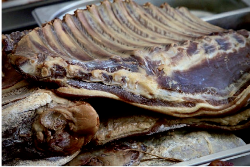
MINDENKI KÉSZÜL A HÚSVÉTRA