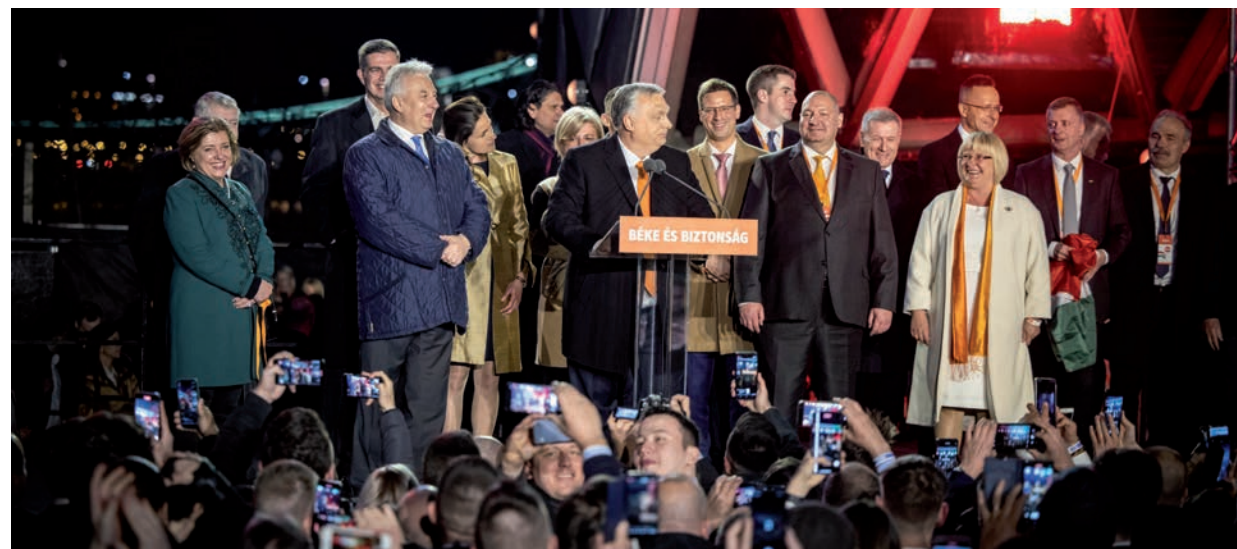
ORBÁN VIKTOR KÉSZÜLHET ÖTÖDIK CIKLUSÁRA