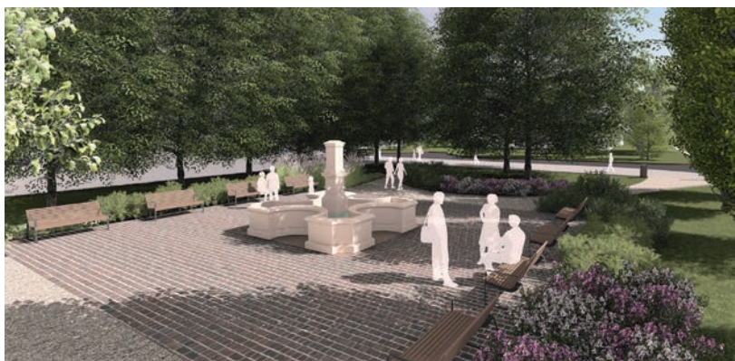
MEGÚJUL A BAKAY-KÚT KÖRNYÉKE

Az átépítés hivatalos célkitűzése, hogy „visszahozza a tram-train beruházással eltűnt zöldfelületet, frissítse a belváros nyári forrását és nem utolsó sorban megoldja az Andrássy útról eltűnt parkolóhelyek problémáját.” 925 m 2 zöldfelület újul meg a legkorszerűbb elvárásoknak megfelelően: csapadékvíz-megtartás, vízáteresztő burkolatok alkalmazása, meglévő értékes növényállomány védelme, biodiverzitás növelése, természetes, helyi építőanyagok alkalmazása, talajjavítás. ■