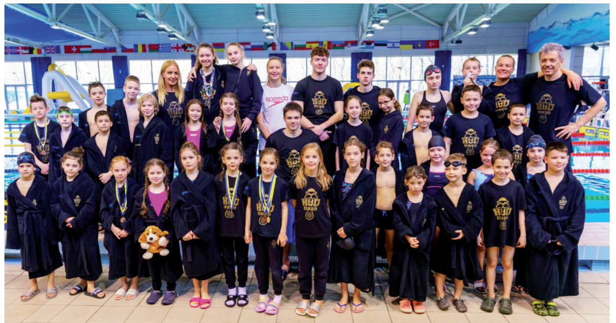
NAGYON SIKERESEK VOLTAK A NICS-HSÚVC ÚSZÓI