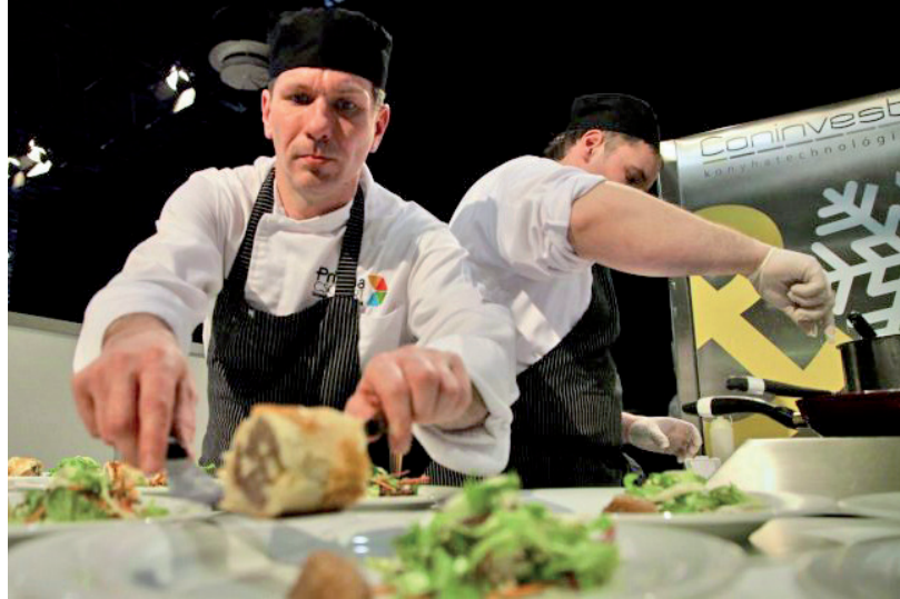
SIKERÜLT IDŐBEN ELKÉSZÜLNI A VÁSÁRHELYI BETYÁROKNAK

A 3+1 fős szakácscsapatoknak 3 óra alatt, 10 adag legfeljebb (nettó!) 650 forintos nyersanyagköltségből tökéletesen elkészített 3 fogásos