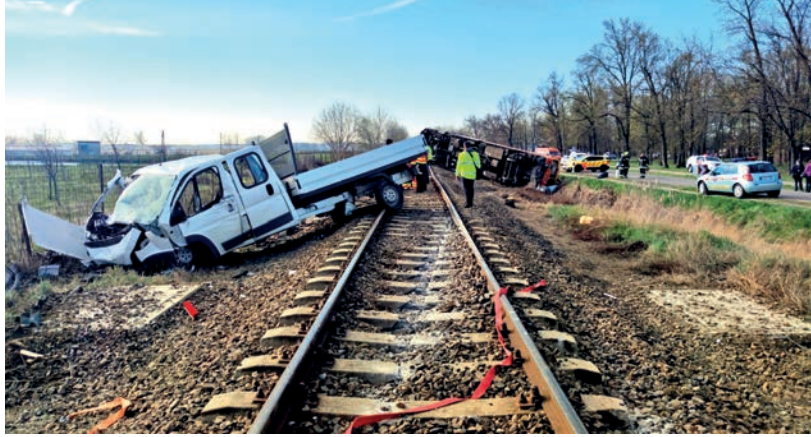
A TEHERGÉPKOCSI VEZETŐJE FIGYELMEN KÍVÜL HAGYTA A FÉNYSOROMPÓ TILOS JELZÉSÉT