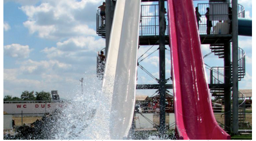
A SZEZON VÉGÉN MÁR VÁSÁRHELYEN IS LEHETNEK CSÚSZDÁK (A KÉP ILLUSZTRÁCIÓ)

Az 55 méter hosszú „Anaconda”, a 17 méteres „Családi” és a kö-