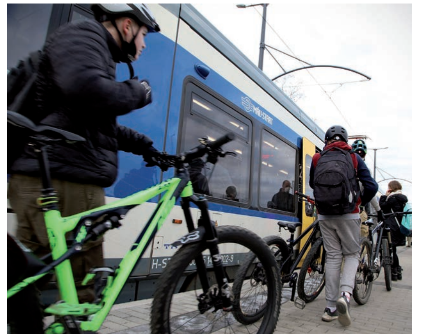
SOKAN PRÓBÁLJÁK KI, HOGY KERÉKPÁRT IS LEHET RAJTA VINNI