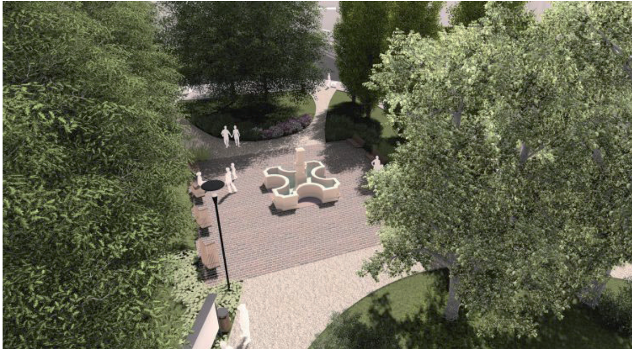
ZÖLDEBB LEHET A BELVÁROS