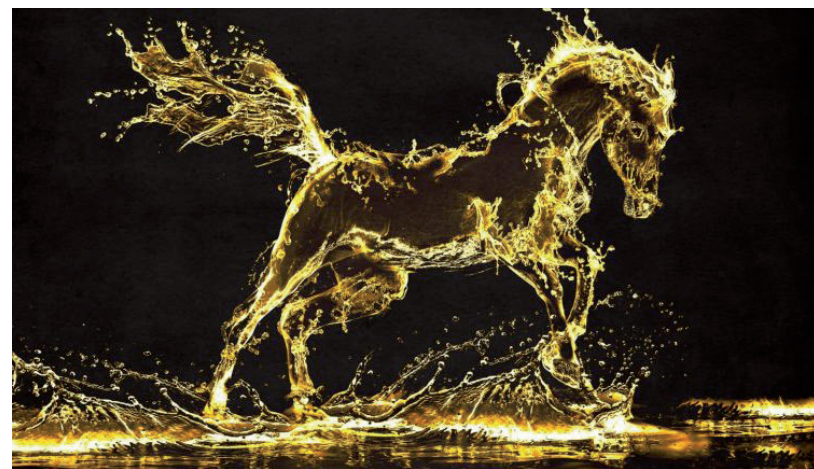
MINTHA FESTVE LENNE