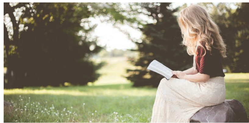
2 MŰVEL LEHET PÁLYÁZANI

A nevezéseket 2022. március 31-ig kérjük leadni Hódmezővásárhelyen, a Németh László Városi Könyvtárban, vagy elektronikus levélben a was-salbertkor.hmv@gmail.com címen. A nevezés tartalmazza az előadó nevét, korát, (18 év alattiaknál: iskoláját, a felkészítő szülő/ tanár nevét), az előadni kívánt két irodalmi alkotás szerzőjét, pontos címét, esetleg leelőhelyét. ■