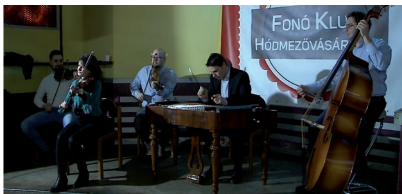
KIVÁLÓ VOLT A HANGULAT

Fantasztikus a mi magyar zenei anyanyelvünk, minden életérzésre, öröme, bánatra, taradációra, valamilyen hagyományra, tehát a legkü-