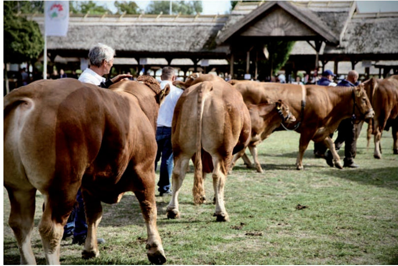
VÁSÁRHELYI ÁLLATTARTÓK IS NYERTEK FEJLESZTÉSRE (A KÉP ILLUSZTRÁCIÓ)

Hódmezővásárhelyen négy vállalkozás nyert nagyobb támogatást a Vidékfejlesztési program forrásaiból az elmúlt évben. Lapunk megkérdezte a kedvezményezett cégeket, hol tartanak az összességében közel 7,5 milliárdos fejlesztésekkel, melyek megvalósítására több mint 3,5 milliárd forint támogatást kaptak. Már a finisben van a Hód-Mezőgazda Zrt. sertéslepteli beruházása, az utómunkálatok folynak. Ugyanaz a vásárhelyi építőipari cég, a Bodrogi Bau Kft. végzi a kivitelezést, amelyik több mint 10 évvel ezelőtt a többi épületet is építette. A ser-