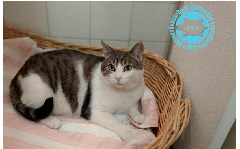
MERÉSZ CICA, A BETEG VÉDENCŰK

A szervezetet csak adományból tartják fent, ezekből látják el az állatokat, fizetik az orvosi költségeket, fűtési számlákat, támogatók nélkül ezt nem tudják végezni – ezért fordulnak minden hónapban az állatbarátokhoz. Balogh elárulta, az egyesület tagjai nem csak a szabadidejüket áldozzák az állatvédelemre, hanem anyagilag is tesznek bele az egyesületbe. Ha egy új projektet találnak