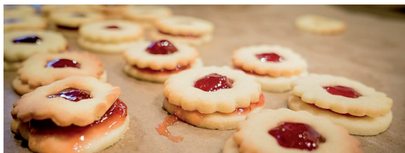
GYERMEKEK, DE FELNŐTTEK IS ÖRÖMMEL FOGADJÁK EZT AZ APRÓ SEGÍTSÉGET

sütemény típusának meghatározásánál fontos szempont volt. Ezért esett a választás a linzere, ami hosszú ideig eláll, és megtartja a formáját a hosszú utazásnál, mondta.