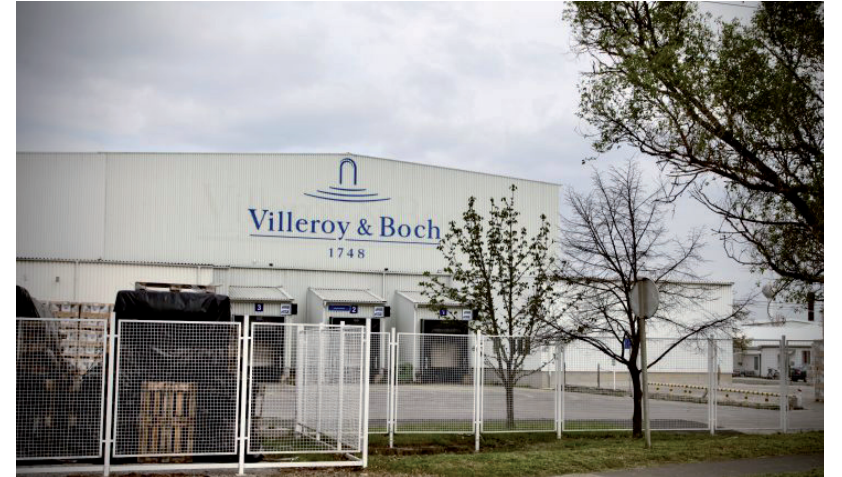
A VILLEROY 2021-BEN NYÚJTOTT BE KÉRELMEZT