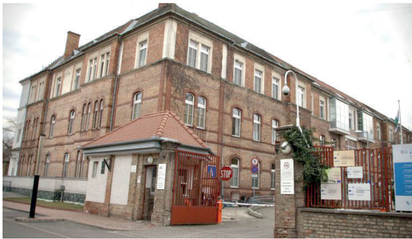
MARADTAK BETARTANDÓ SZABÁLYOK, DE JÓVAL KEVESEBB

A beteg vallásgyakorlás céljából jogosult a kapcsolattartásra COVID-19 fertőzöttsége esetén is. ■