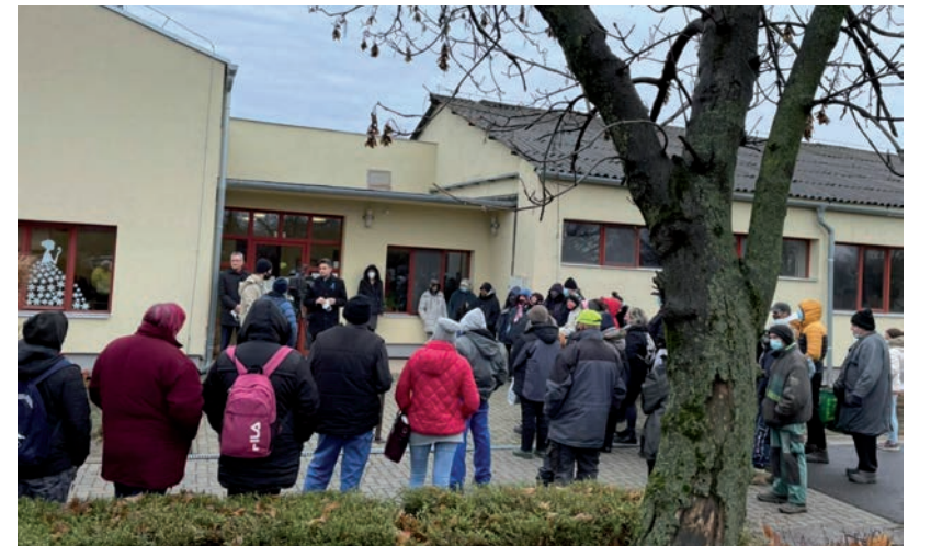
A POLGÁRMESTER BUZDÍTOTTA AZ EMBEREKET A TOVÁBBI ÁLLÁSKERESÉSRE IS

Volt aki, miután megkapta az élelmiszer-csomagot, a Vásárhelyi Televízióknak elmondta, hogy édesapja néhány éve karácsonykor sztrókot kapott, ezért is fontos számukra a segítség. Egy másik közfoglalkoztatott azt emelte ki, hogy családjukban sok a rászoruló kisgyerek. Akadt olyan is, aki nem csak hasznos segítségként tekintett az élelmiszer-csomagra, hanem munkájuk elismeréseként is. ■