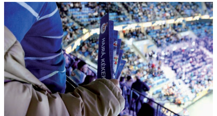
MINDEN SZURKOLÓNAK KÉK VOLT A SZÍVE AZON AZ ESTÉN

December 9-én hivatalosan is felavatták a Pick Szeged új csarnokát, amely több mint 8100 nézőt tud befogadni, és amely eredetileg a jövő januári magyar-szlovák közös rendezésű Európa-bajnokságra épült, melynek egyik helyszíne lesz Szeged. Az avatóünnepség, mind a megnyitó, mind a Pick Szeged-THW Kiel Bajnokok Ligája nyitómeccs grandiózusra sikeredett, utóbbi viszonylag magabiztos szegedi győzelemmel, a világsztárokkal felálló német együttes ellen (30-26). Folytatás februárban. A Vásárhelyi Média centrum is a helyszínen volt, tekintsenek meg néhányat a helyszínen készített fotink közül. ■