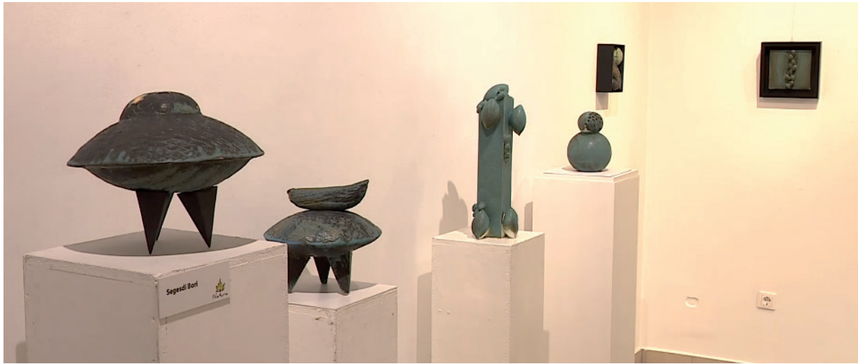
JANUÁR KÖZEPÉIG LÁTOGATHATÓ A KIÁLLÍTÁS