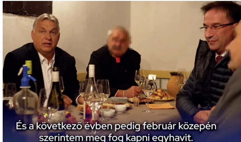
És a következő évben pedig február közepén szerintem meg fog kapni egyhavt.

A nyomozás természetesen az elnök ellen is folyamatban van, állítólag hozzá kapcsolódó ingatlanokat is