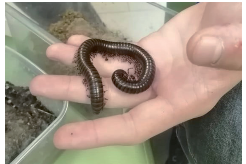
KÜLÖNLEGES ÉLMÉNY VOLT ILYEN ÉLŐLÉNYEKEL TALÁLKOZNI