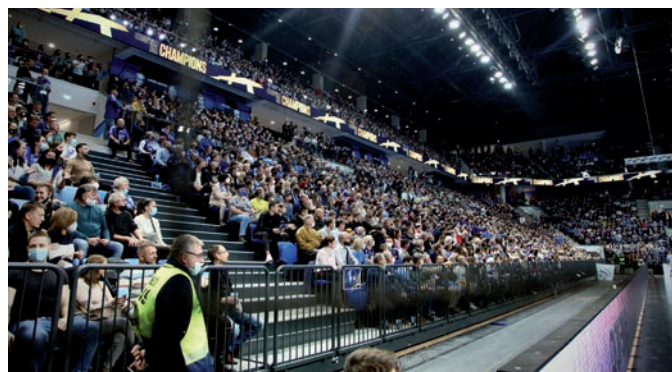
MEGTELT A CSARNOK A NYITÓMECCSRE