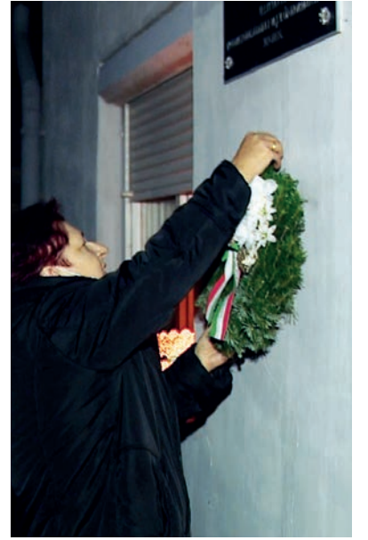
BESSENYEI FERENC SZÜLŐHÁZÁN MA EGY TÁBLA ŐRZI A NEMZET SZÍNÉSZNÉK EMLÉKÉT