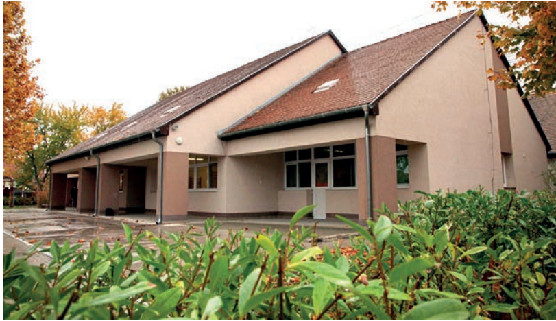
A MAGVETŐ UTCAI ÓVODÁBAN 12 MILLIÓ FORINTOS FELÚJÍTÁST VÉGEZTEK