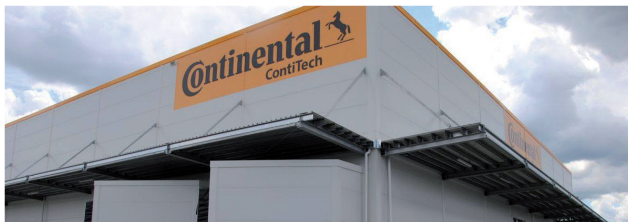
A CONTINENTAL 2013 ÓTA AZ ÁLLAM STRATÉGIAI PARTNERE

kapcsán a vezetés végig az ágazat 2018 óta tartó válságát kommunikálta kiváltó okként. Munkavállalói és érdekképviseleti oldalról viszont gyakran mutattak rá a sztrájk és az elbocsátások közötti, véleményük szerint fennálló összefüggésekre. Az őszi elbocsátások (részben kölcsönzött munkaerő, részben saját