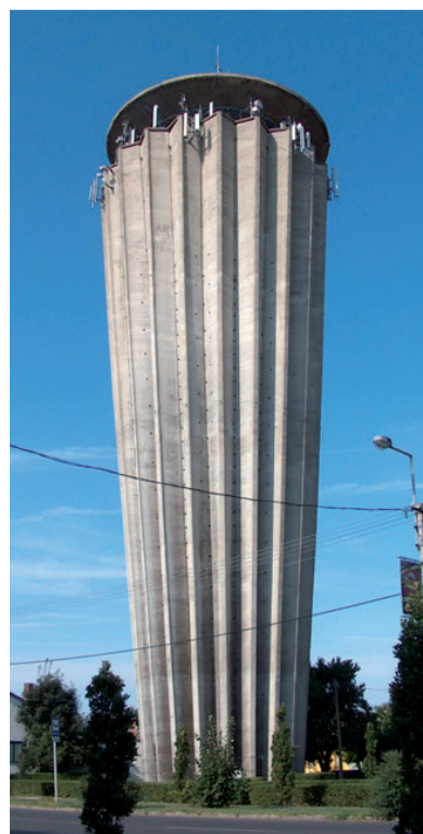
A HÓDMEZŐVÁSÁRHELYI VÍZTORONY

A mostani uniós költségvetési ciklus végéig az ágazatban több mint 1100 milliárd forint jut környezet- és