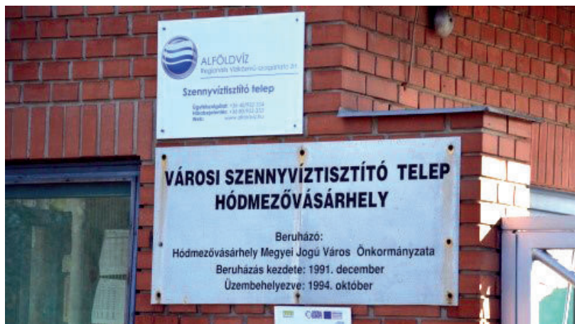
2025-RE FEJLESZTHETIK A SZENNYVÍZTISZTÍTÓMŰVET

2025-re lehet minden – lakossági és környezetvédelmi – igény kielégítő tisztítóműje Hódmezővásárhelynek – 10 évvel azután, hogy a szükséges korszerűsítési és bővítési munkák igénye felmerült a városban. A projekt vakvágányra került, miután a fejlesztésre igényelt és elnyert pályázati forrás 2017-ben már a költségek felére sem volt már elegendő. Újabb fejleményre idén augusztusig kellett várni, mikor a kormányzat több más meghíúsult szennyvízberuházással egyetemben jelentősen megemelte az erre a célra fordítható pénzügyi keretet: a vásárhelyi modernizációra elkölthető összeget másfélről 6 milliárd forintra növelték. Utóbbi döntést azért sem lehetett tovább halogatni, mert egy belügyminisztériumi vizsgálat szerint a település által kibocsátott