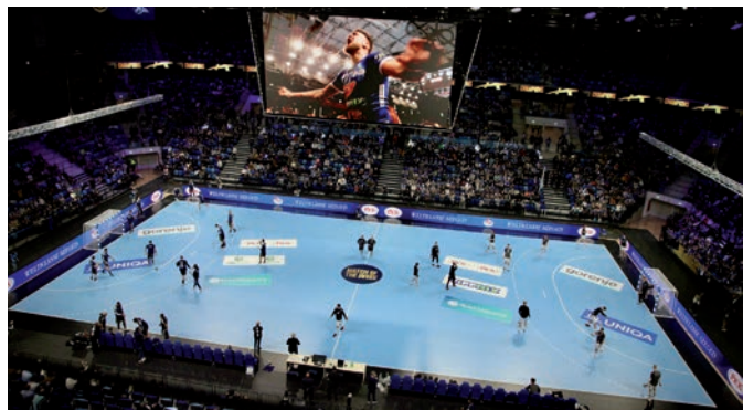
A HANGULAT MÁR A MÉRKŐZÉS ELŐTT NAGYSZERŰ VOLT