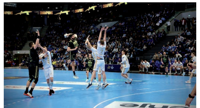
A SZEGEDNEK VÉGÜL SIKERÜLT A KIEL FÖLÉ EMELKEDNIE