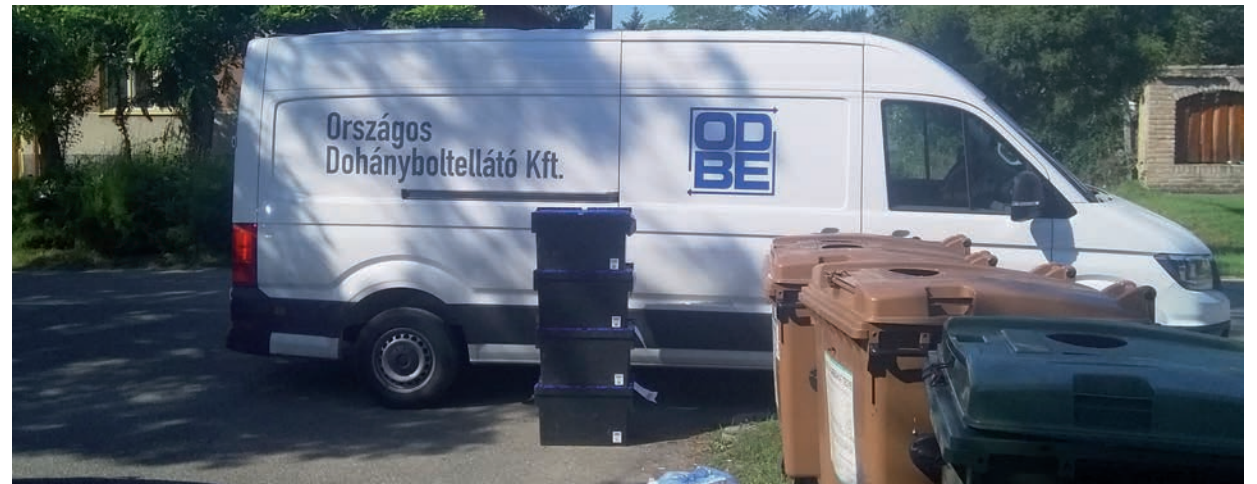
AZ ORSZÁGOS DOHÁNYBOLTPELLÁTÓ KFT. 179. A LISTÁN