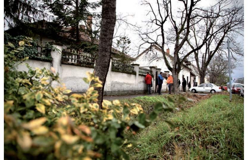
A MUNKATERÜLETET MÁR ÁTADTÁK, NYÁRRA KÉSZÜL EL A BÖLCSŐDE

A kivitelezésre, amelynek része az energetikai felújítás, korszerű hűtő-fűtő rendszer kialakítása és parkolók építése is, 6 hónap áll a győztes pályázó rendelkezésére. Az udvart, valamint a melléképületeket