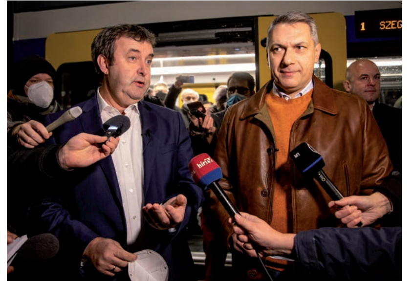
PALKOVICS LÁSZLÓ MINISZTER ÉS LÁZÁR JÁNOS KORMÁNYBIZTOS 2021. NOVEMBER 29-ÉN