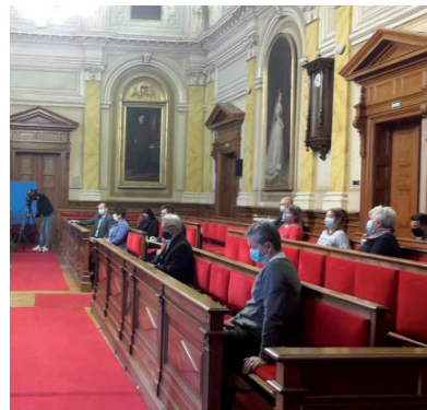
EZÜTTAL JOBB HÍREKET OSZTOTTAK MEG AZ OPERATÍV STÁBBAL

A hivatalban és az önkormányzati cégeknél szerencsére minden covidos dolgozó meggyógyult. Minden intézmény vezetője hangsúlyozta, hogy a fokozott fertőtlenítést, a távolságtartást és a maszkviselést kiemelten fontosnak tartják. Az eddig, saját hatáskörben bevezetett óvintézkedések érvényben ma-