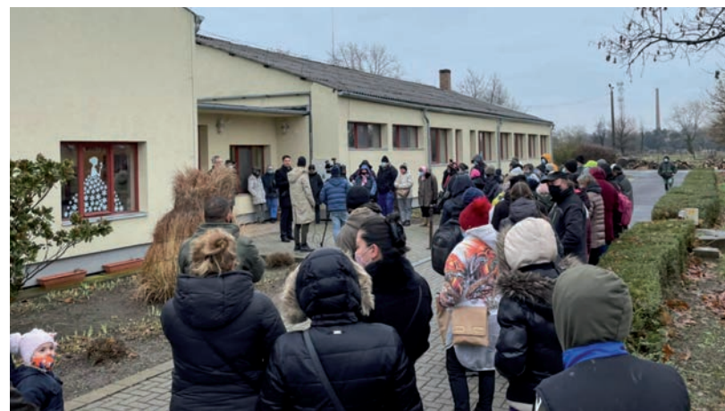
80 KÖZFOGLALKOZTATOTT KAPOTT TARTÓS ÉLELMISZEREKBŐL ÖSSZEÁLLÍTOTT CSOMAGOT

ALÁÍRÁSGYŪJTÉS • Legyen 270 nap az álláskeresői járadék, ne kapjon magyar vagyont a kínai egyetem