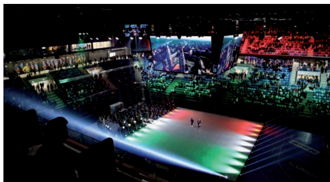
RENDKÍVÜL LÁTVÁNYOS VOLT A MECCS ELŐTTI MEGNYITÓ IS