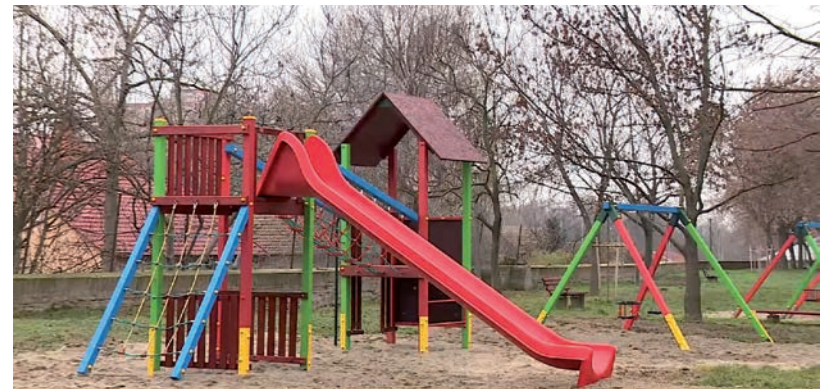
A KASZAP UTCAI JÁTSZÓTÉR

Elkészült a játszótérek felújítása a Kaszap utcában és az Európa Parkban is. Hódmezővásárhely közigazgatási területén júniusban a 42 játszótérből 20-at záratott le az illetékes hatóság, mára azonban 4 kivétellel újra használhatóak a kültéri létesítmények. Új hinták, csúszdák, mászóókák és a hozzájuk tartozó ütőcsillapító felületeket is kialakították, így már a korábban veszélyesnek ítélt játszótérek is