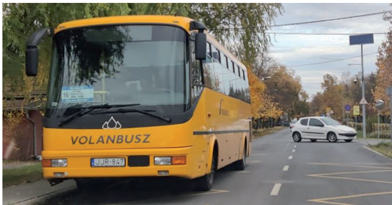
A TÉT AZ IS, HOGY KI SZOLGÁLTATHAT ÉS MENNYIÉRT A JÖVŐBEN A VÁROSBAN.