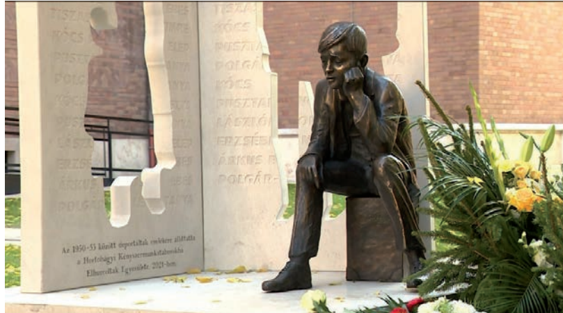
EZ A SZOBOR A SZENVEDŐKRE EMLÉKEZTET

Csongrád megyéből 11 településről hurcolták el 1950. június 23-án családokat. Ez egy olyan tett volt, amit azt hiszem, soha nem lehet megbocsátani. A gyerekek is pont olyan körülmények közé kerültek, mint a felnőttek. Azt gondolom, hogy ennél borzalmasabb nincs. A családokat szétzilálták, tönkretették, nagyon sok ember földönfutó lett, nyilat-