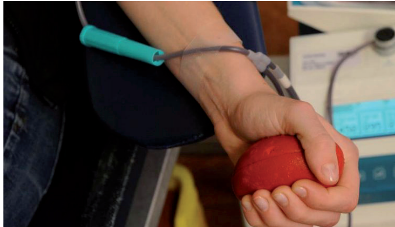
FONTOS, HOGY NE ESSEN VISSZA A VÉRADÁSI KEDV

„Sokan keresnek meg minket személyesen, telefonon ez ügyben. Én azt szoktam javasolni, hogy olyan portálokat olvassanak, amelyek hitelesek,