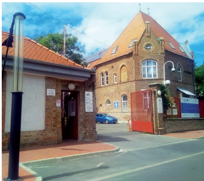
AZ A KÉRÉS, HOGY EGY HOZZÁTARTÓZÓ NAPI EGYSZER TELEFONÁLJON CSAK

A táblázat szerint a makói-vásárhelyi kórházban 118 ágyat kell szabadá tenni. Ebből 12-nek intenzív osztályon kell lennie.