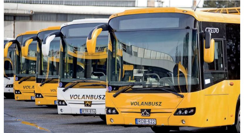
MÉG AZ IDÉN ÍTÉLETET HIRDETNEK ELSŐ FOKON

Arról korábban mi is írtunk, hogy polgári peres eljárást indított a Volánbusz Hódmezővásárhely (és Szombathely) ellen. A per alapja az volt, hogy a Volánbusz meglátása szerint amikor a vásárhelyi önkormányzat új szolgáltatót bízott meg a helyi személyszállítási feladatok március 1-től történő biztosítására, a helyi közszolgáltatási szerződést a városvezetés nem mondta fel jogszzerűen és a közös megegyezéssel történő megszüntetésben sem állapodtak meg a felek. A Volánbusz egyébként a helyijáratok üzemeltetésének feladatait az önkormányzati döntéstől függetlenül azóta is változatlanul ellátja és továbbra is a 2018-ban pályázat útján elnyert,