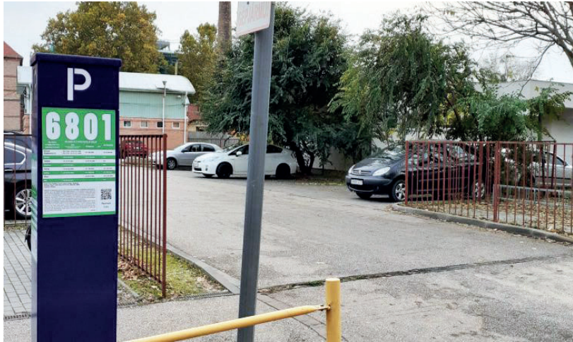
KORÁBBAN IS FIZETŐS VOLT A PARKOLÁS