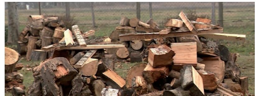
ELKEZDŐDÖTT A RAKÁSOK KIALAKÍTÁSA