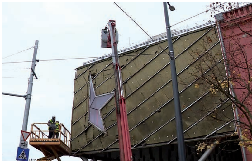
NOVEMBER VÉGÉIG TARTANAK A MUNKÁLATOK AZ EMLÉKPONTNÁL

Mint ismeretes, az épületet még nyáron körbezárták, mert a borítás-képp funkcionáló 16 kilogrammos fémlemezok elkezdtek lepotyogni róla. Ez természetesen baleset-, és életveszélyes, ugyanis osb lapokhoz vannak rögzítve a fémlemezok, mindenféle szigetelés vagy vízelvezetési megoldás nélkül. Belülről tehát ráfolyt a lapokra a víz, azonnali intézkedésre volt szükség, mondta Szabó János alpolgármester.