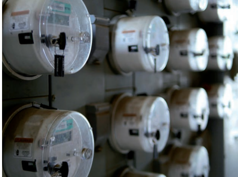
A GÁZ ÉS A VILLAMOS ENERGIA BESZERZÉSE IS NEHÉZ LESZ