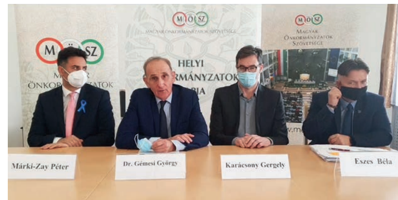
MINDENKINEK LETTEK VOLNA KÉRDÉSEI A KORMÁNYZAT FELÉ

Megígérte, hogy ha új kormány lesz jövőre, akkor politikamentesen támogat minden önkormányzatot, és nem csak egyes témákban működik együtt velük, hanem rendszeres partnerként tekint majd rájuk. A sajtótájékoztató fő gondolati váza a kormányzat és az önkormányzatok közötti egészséges egyensúly megteremtése volt. Gémesi György ehhez hozzáfűzte, megszületett az önkormányzatok napján készített vitaanyag első része is. Ebből egy olyan anyagot szeretnének készíteni, amely elindíthatja ezt az egész-