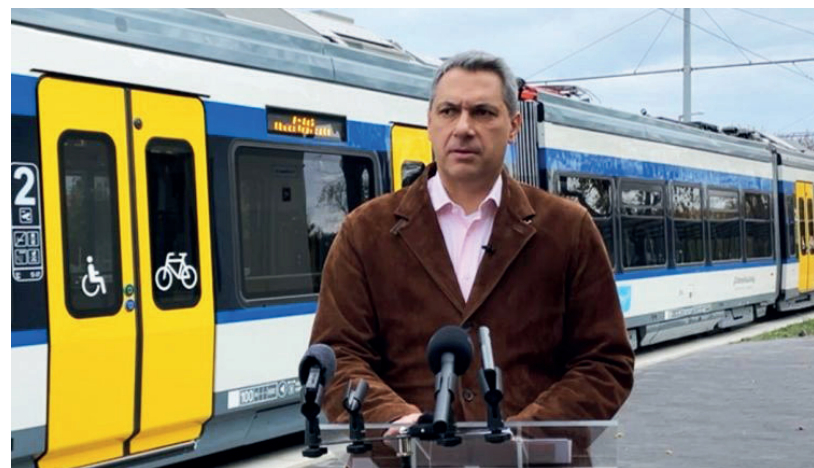
NOVEMBER 29-TŐL LEHET UTAZNI A JÁRATOKON