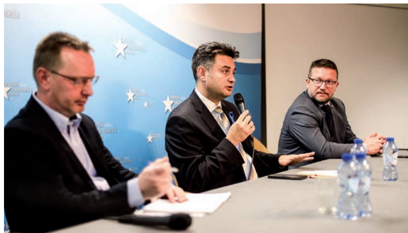
SAJTÓTÁJÉKOZTATÓK, 20 TALÁLKOZÓ, TÁRGYALÁSOK 6 EURÓPAI BIZTOSSAL, EZ A LÁTOGATÁS MÉRLEGE.