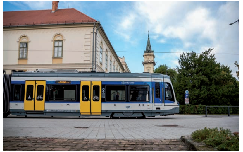
ÁPRILIS 15-IG NEM KELL FIZETNÜNK AZ UTAZÁSÉRT

Lázár pár nappal később egy facebook bejegyzésben közölte, hogy november 29. és január 15. között óránként; január 15-től március 15-ig csúcsidőszakban 20 percenként, ezen kívül hétfőn éjszaka is; március 15-től pedig végleges menetrend szerint közlekednek, csúcsidőszakban 10-15 percenként a járatok.