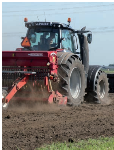
HÉTFŐN KEZDTÉK AZ ÖSSZEÍRÁST (A KÉP ILLUSZTRÁCIÓ)

A válaszadók november 25-ig online, december 15-ig pedig összeírók segítségével személyesen vagy telefonon válaszolhatnak a kérdésekre. Az adatgyűjtés célja, hogy naprakész információval rendelkezzen a KSH, eleget téve ezzel az uniós adatszolgáltatási kötelezettségeknek. ■