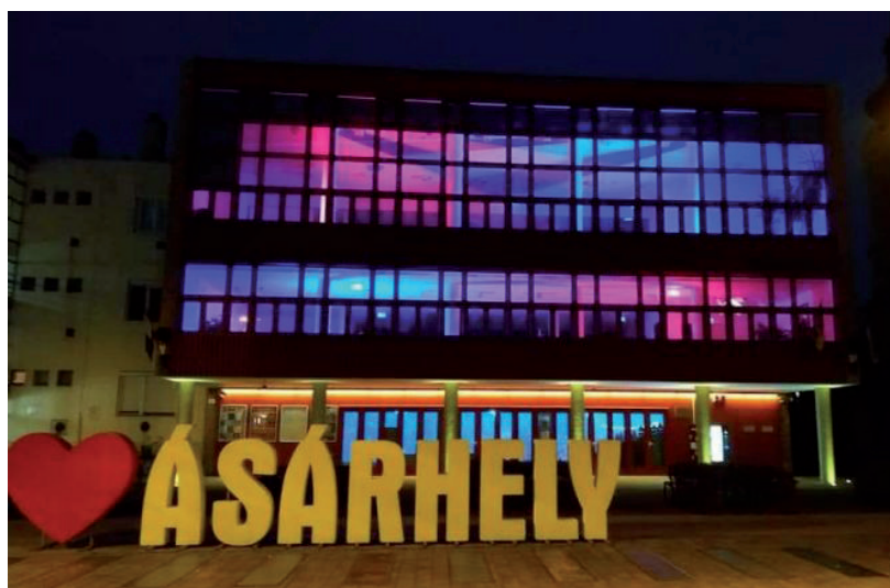
EGYES SZAKKÖRÖK FOLYTATÓDNAK, MÁSONK ELKEZDŐDNEK A BFMK-BAN

Emellett pedig várnak mindenkit meglévő szakköreikre is. A Foltmozai szakköreik keretében varrhatnak, a Hímző - szövő szakkör keretében megtanulhatják a vásárhelyi hímzést, a tűzzománc szakkör kere-