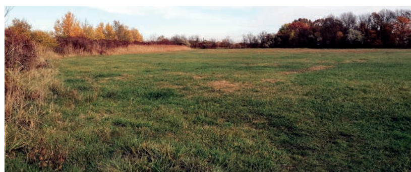
LESZ MÉG MUNKA A TERÜLETTEL

Hozzátette, egy 4 hektáros területről van szó, amely sok lehetőséget kínál a későbbiekben egy kerékpáros park kialakításában, úgy mint