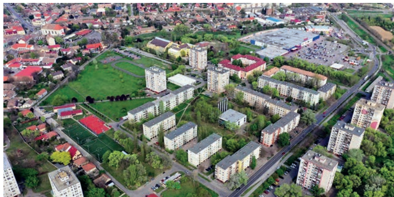
A TELEPÜLÉSEK LAKOSSÁGSZÁMÁT TELJESEN FIGYELMEN KÍVÜL HAGYTA A KORMÁNY