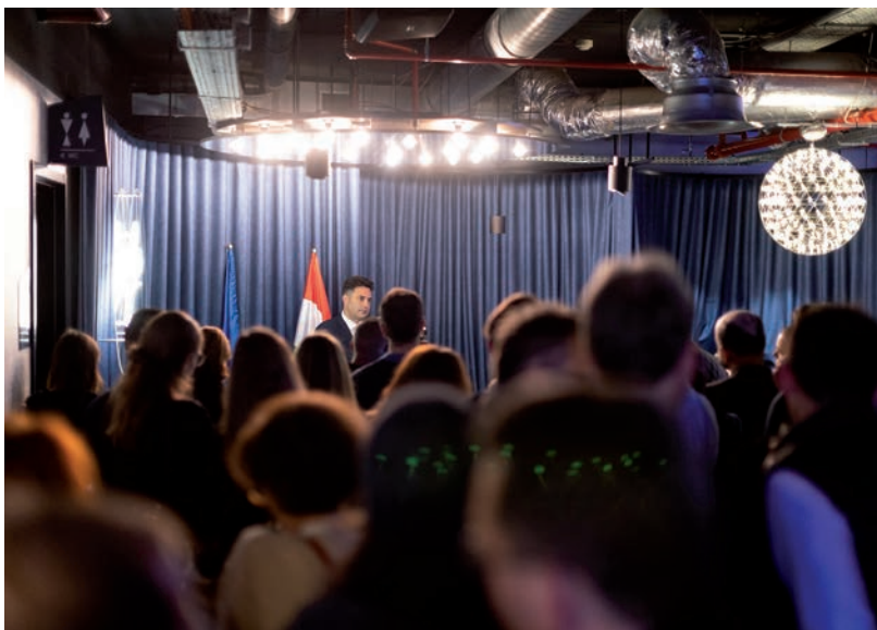
KINT ÉLŐ MAGYAROKKAL IS TALÁLKOZOTT BRÜSSZELBEN MÁRKI-ZAY PÉTER

Másodikként az Európai Uniónak a következő időszakban, a kampány alatti kommunikációját emelte ki. – Az európai újjáépítési források kapcsán kértük azt, hogy ne engedjék, hogy az Orbán-család és baráti köre ellophassa ezt az uniós pénzt. A Fidesz ne oszthassa ezt politikai alapon, ne használhassa kampánycélokra, ne hagyhassa ki belőle az ellenzéki önkormányzatokat. Minden magyar település egyforma támogatásért