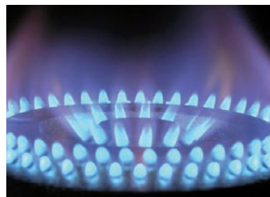
KORMÁNYZATI SEGÍTSÉGRE LENNE SZÜKSÉG

Hiába volt a következő évre lehívási opciója a hódmezővásárhelyi önkormányzatnak, azt már nem vállalta a korábbi árakon az eddigi beszállító. Nemcsak a polgármesteri hivatal, hanem a különböző városi intézmények számára is az önkormányzat vásárolja, a gázt a