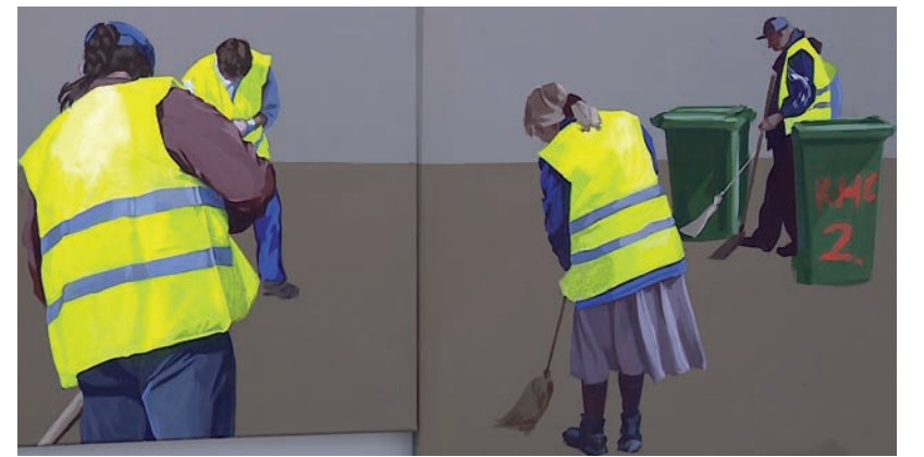
A FESTŐMŰVÉSZ SAJTÓFOTÓKAT VETT ALAPUL