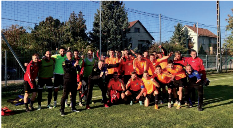
VOLT OK AZ ÖRÖMRE A MECCS UTÁN (KÉP: HFC FACEBOOK)