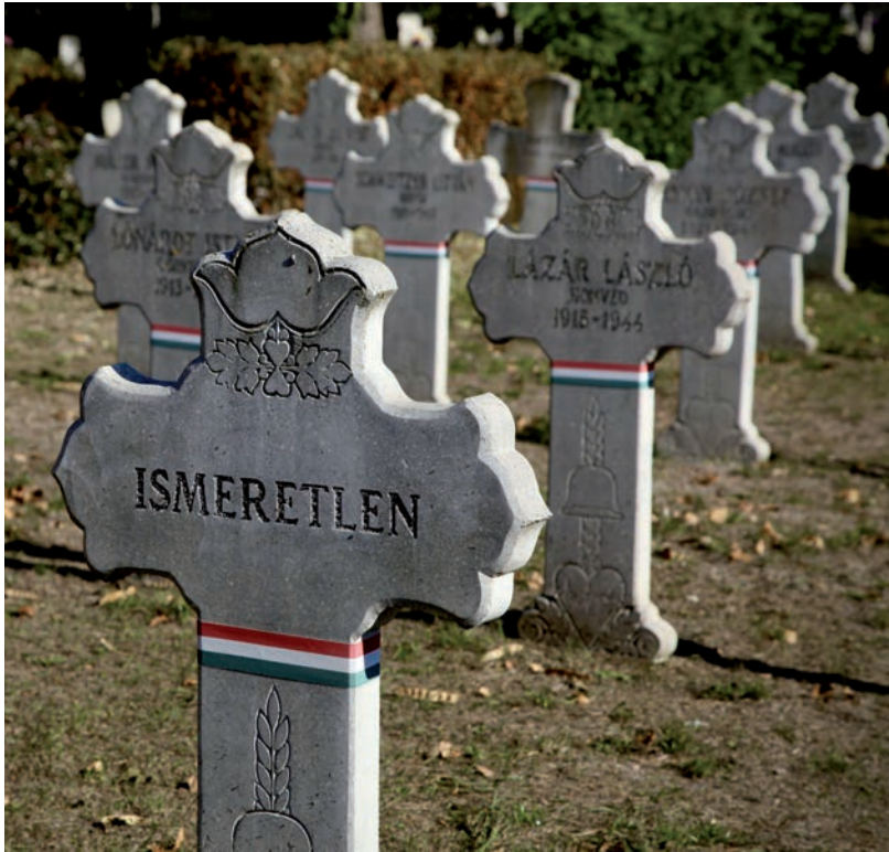
AZ ÖNKORMÁNYZAT IS MEGEMLEKEZETT AZ ELHUNYTAKRÓL

A hősök életéből mi is példát meríthetünk, mondta a polgármester. Ezek a hősök nem csak a kanonizált szentek, nem csak a háborúban részt vett és elesett katonák, közülünk bárki lehet hős a mindennapokban. Sőt, ez az önzetlenség a szüleinekre is jellemző, akik szintén adtak a gyer-