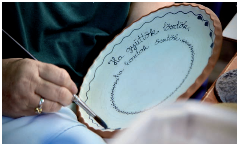
EZÚTTAL ÖLÉG LÖSZ PAPIRRA TÖNNI, VAGY FÖLMONDANI

Újra pályázatot hirdetett Wass Albert Irodalom-pártoló Egyesület, élő ö-zó nyelvjárású hang- és videó-anyagok gyűjtésére, vagy létrehozására. Bizonyára mindenkinek van olyan ismerőse, aki még szépen beszéli a vásárhelyi anyanyelvöt. Őket lehetne beszélgetésre bírni, oszt fölvenni hangrögzítőre.