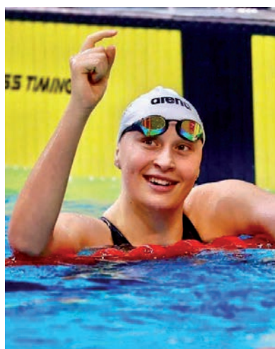
7 VERSENYSZÁMBAN NEVEZTÉK AZ EB-N A HÓD ÚSZÓ SE VERSENYSZÓJÁT

A Hód Úszó SE 17 éves sportolója – aki az ideai római junior Eb-n nyújtott szereplésével szolgált rá az indulási jogra – élete első rövidpályás kontinensviadalán gyűjthet tapasztalatokat. A Magyar Úszó Szövetség 13 sportolót indított a kedden rajtoló