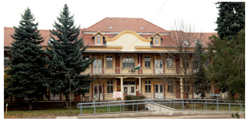
KAKASSZÉKEN IS LÁTOGATÁSI TILALOM VAN