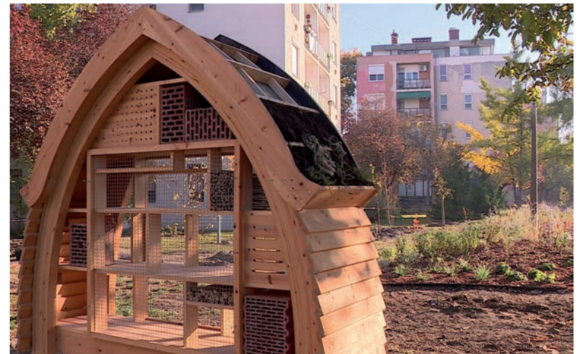
A VIRÁGÁGYÁSOK MELLETT EGY „ROVARHOTEL” IS TELEPÍTETTEK

A tabáni körforgalomhoz hasonlóan itt is az évelő növényeket agroszövetbe ültették bele, így az áteresztje a vizet, viszont a gyomokat nem engedi elterjedni a virággyászokban, amivel hosszú távon minimalizálni lehet a zöld felület fenntartási költségeit, egyúttal a lehulló csapadékot is helyben lehet tartani, ami a modern zöldváros stratégiának az egyik alapja. ■