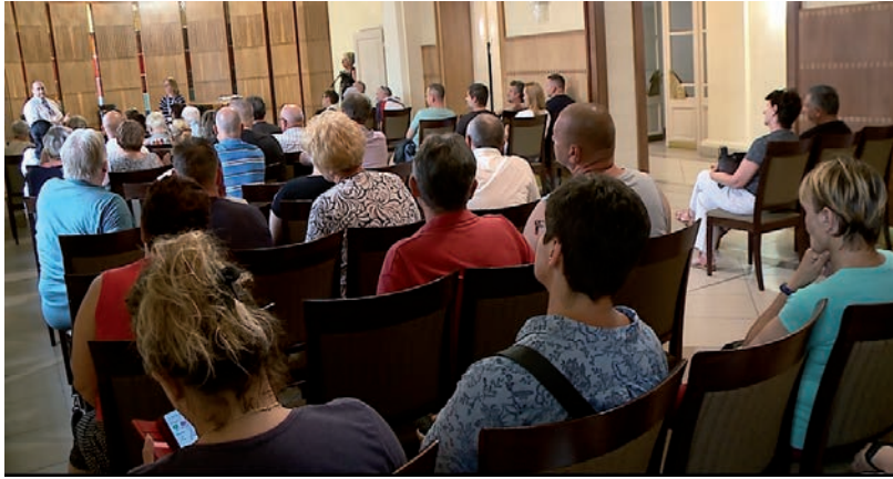
NYÁRON IS NAGY VOLT AZ ÉRDEKLŐDÉS A TRAFÓ MEGHIBÁSODÁSA KAPCSÁN TARTOTT MEGHALLGATÁSON