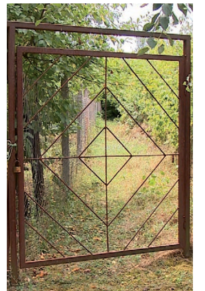
ELKELT A TELEK

A mostani döntés értelmében az ingatlan 510 ezer forintért kelt el. A polgármester egyébként azt mondta, hálások is lehetnek annak a polgárnak, aki felszólalt az ingatlan korábbi, 380 ezer forintos eladása ellen, mert így a város nyert 130 ezer forintot a mostani döntéssel. ■