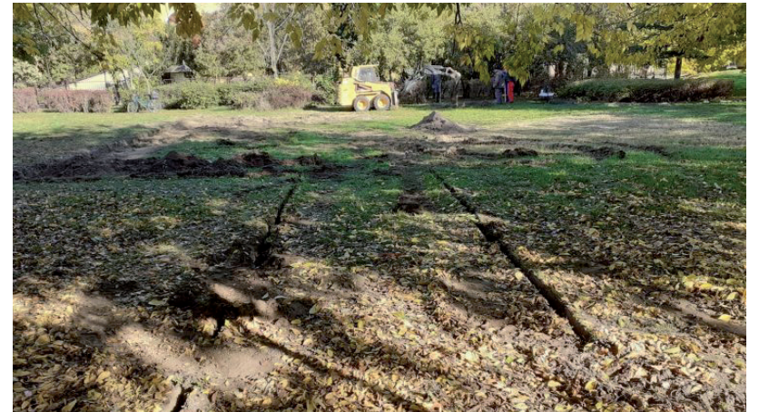
ITT HAMAROSAN RENDEZETT PIHENŐPARK LESZ

Az anyagi keretek szűkösége miatt a pályázó lakosok is részt vesznek majd a munkában, többek között a fák ültetését és a padok összeszerelését is magukra vállalták. A munkálatokat már megkezdtek és szeretnék még idén befejezni. ■