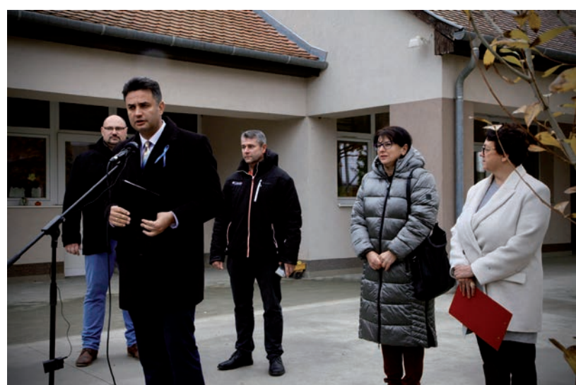
A MEGÚJULT TETŐ ÉS TERASZ ELŐTT TARTOTTAK SAJTÓTÁJÉKOZTATÓT A MAGVETŐ UTCAI ÓVODÁBAN