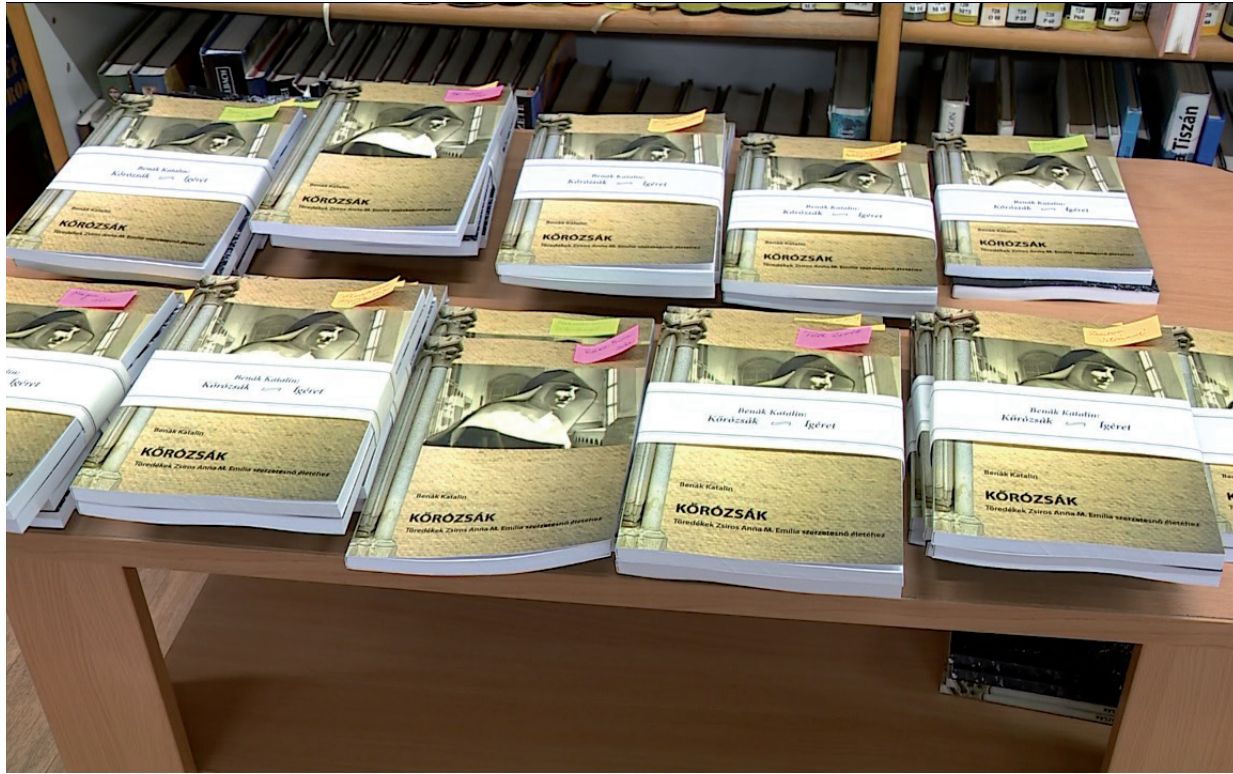
BENÁK KATALIN TELJESÍTETTE ÍGÉRETÉT (KÉP: VÁSÁRHELYI TV)