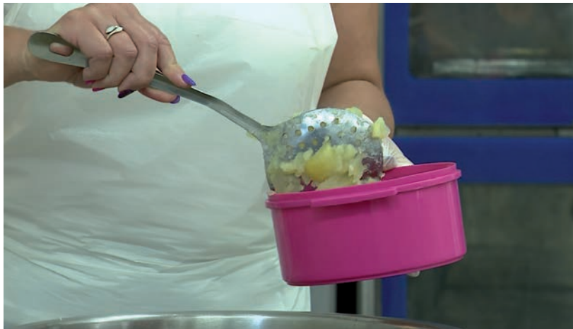
A PRIZMA FOOD KFT. A KOVÁCS-KÜRY FŐZŐKONYHÁJÁT IS KIBÉRELNE