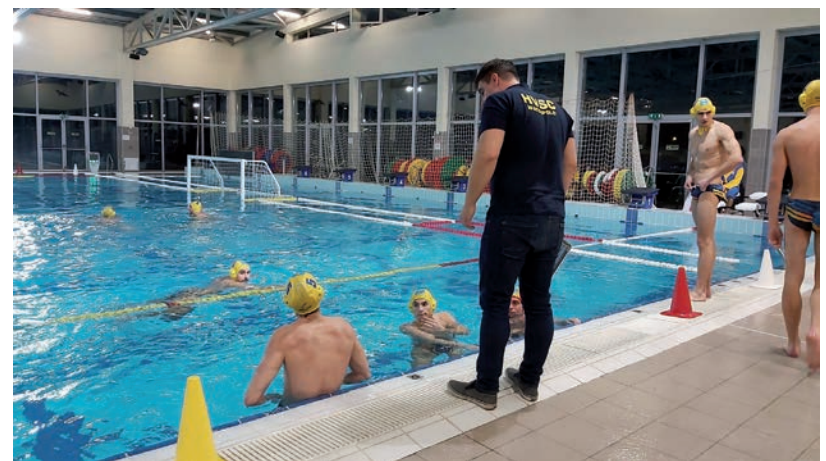
LEGKÖZELEBB A FŐVÁROSBAN JÁTSZIK A CSAPAT