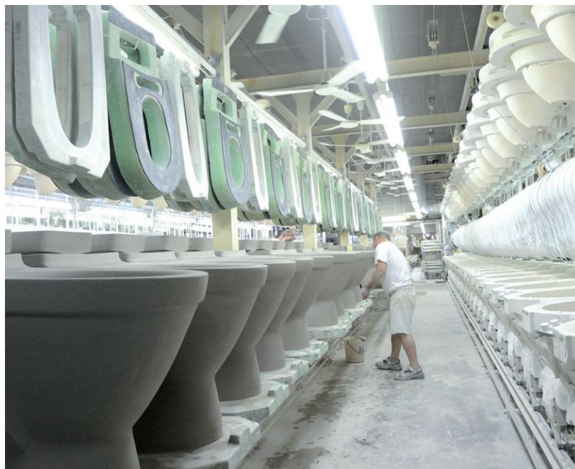
NEM KÖTELEZNEK ÁLTALÁNOSAN A VILLEROY & BOCH-NÁL

LEJÁRATÁS • A feltételezés szerint a DK-n keresztül támadták volna Márki-Zayt