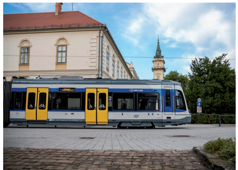
NOVEMBER ELEJÉTŐL MÁR HÁROM VASÚTVILLAMOS FOG KÖZLEKEDNI TESZTÜZEMBEN SZEGED ÉS HÓDMEZŐVÁSÁRHELY KÖZÖTT.

Még mindig kér a tram-train. Eddig hét szerelvény érkezett meg Spanyolországból, és a felröppent hírek szerint november 28-án megindul a közlekedés Hódmezővásárhely és Szeged között. Az elkövetkező hetekben többek között lesz havariahelyzeti szimuláció, utasforgalmi teszt próbautasokkal és menetidőmérés is. November elejétől már három vasútvillamos fog közlekedni tesztüzemben Szeged és Hódmezővásárhely között, végállomástól-végállomásig – közölte MÁV hivatalos közösségi oldalán. A vasútvillamosoknak szánt új vásárhelyi kocsisín építése kapcsán még nincs bejelentés, hogy mely vállalkozás és mennyiért húzhatja fel a 3000 négyzetméteres csarnokot. Az viszont nemrég kiderült, hogy speciális berendezésre lesz szükség