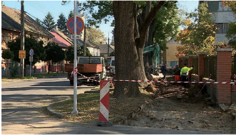
A FÁK GYÖKEREI MIATT DOLGOZTAK A PETŐFI UTCÁN