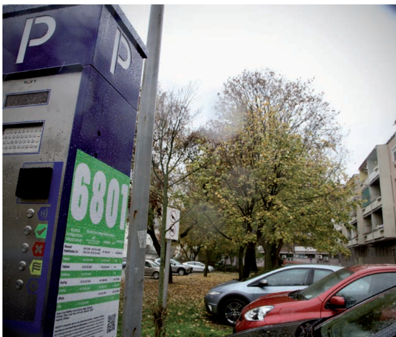
AZ AUTOMATÁK KÖZÜL JÓ NÉHÁNY MÁR HOSSZABB IDEJE NEM MŰKÖDÖTT HÓDMEZŐVÁSÁRHELYEN. AZ ÖNKORMÁNYZAT MOST 10 PARKOLÓÓRÁVAL ÚJÍTOTTA MEG ÉS BŐVÍTETTE A FLOTTÁT. AZ ÚJ ÓRÁK A BELVÁROSBA, AZ ANDRÁSSY ÚT, SZENT ANTAL UTCA, OLDALKOSÁR UTCA KÖRNYÉKÉRE ÉRKEZTEK. A KÉSZÜLÉKEKET ÉRMÉVEL ÉS A KÉSŐBBIEKBE BANKKÁRTYÁVAL IS LEHET HASZNÁLNI.

COVID • Látogatási tilalom Makón és Vásárhelyen