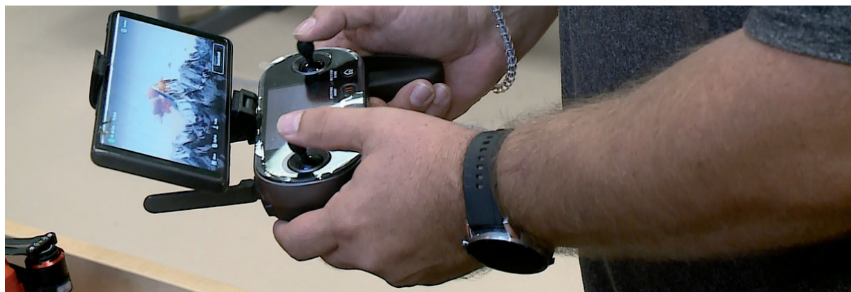
TÖBB TUDOMÁNYTERÜLETTEL ISMERKEDHETEK A KUTATÓK ÉJSZAKÁJÁN IDÉN (KÉP: VÁSÁRHELYI TV)

Szórakoztató, inspiráló előadásokon, laborbejárásokon és játékos programokon keresztül ismerkedhetett meg minden korosztály a tudomány különböző szegmenseivel a Kutatók Éjszakáján, szeptember 24-én. A 2005-ben indított ingyenesen látogatható rendezvény célja, hogy a kutatók és fejlesztők munkája vonzóvá váljon a fiatalok számára, így idén is tanteremről-tanteremre járhatták gyerekek és felnőttek a tudományos élet területeiről szóló bemutatókat, ahol az érdekes témák feltérképezése mellett egy-egy helyszínen kóstolni is lehetett.