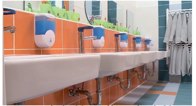
AZ ÓVODÁBAN ÖRÜLNEK A FELÚJÍTOTT MOSDÓNAK

A Villeroy & Boch Magyarország Kft. a fennállásának 50. évfordulója alkalmából óvodai mosdó felújítási programba kezdett Hódmezővásárhelyen, amelynek keretében elsőként a Malom Utcai Óvoda mosdói újultak meg az elmúlt években. Egy egészen más mosdó fogadta a gyerekeket szeptemberben a Szeremlei Sámuel Református Óvodában is. Modern mosdókagyló, csap, WC, új csempe: a többi között a mosdó azon részei, amely a Villeroy&Boch Kft.-nek és a Keramitalia Kft.-nek köszönhetően 8 millió forintból újult meg az intézményben. A két cégnek nagyon fontos az óvodások ilyen irányú segítése, nem ez