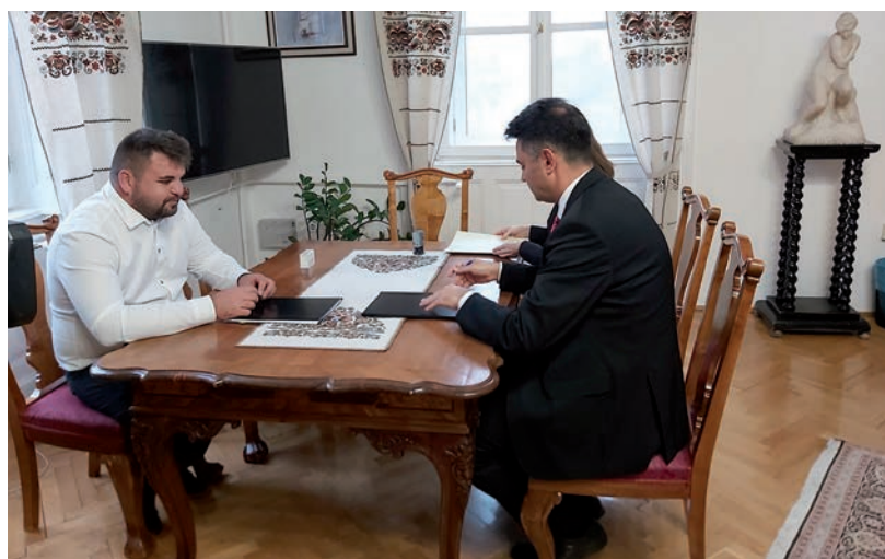
OKTÓBER 1-JÉN ÍRTÁK ALÁ A SZERZŐDÉST A PÜSPÖKI KFT-VEL