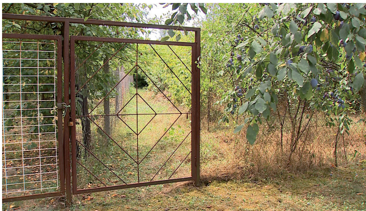
ÁRVERÉS LESZ AZ INGATLANÉRT (KÉP: VÁSÁRHELYI TV)

Kérdésünkre a Polgármesteri Hivatal azt a választ adta, hogy 4 db érvényes pályázat érkezett, így árverés tartására kerül sor, amely lapzártánk pillanatában szervezés alatt van. Már felvették a pályázókkal a kapcsolatot az időpont és helyszín kérdésében. ■