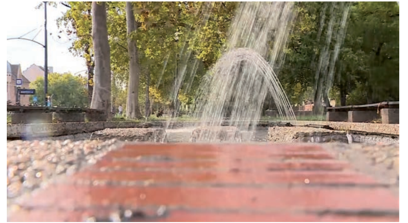
ÚJRA MŰKÖDIK A SZÖKŐKÚT