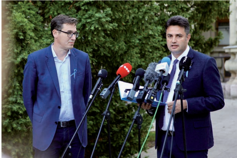
MÁRKI-ZAY PÉTER ÉS KARÁCSONY GERGELY KÖZÖS, HÓDMEZŐVÁSÁRHELYI SAJTÓTÁJÉKOZTATÓJA OKTÓBER 4-ÉN