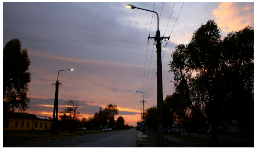
A VILÁGÍTÁST AZÓTA KICSERÉLTÉK HÓDMEZŐVÁSÁRHELYEN

Az Európai Unió Csalás Elleni Hivatala (OLAF) szerint 17 projektben a közbeszerzési csalás és esetenként a szervezett bűnözés gyanúja is felmerült. A magyar hatóságok viszont semmilyen szabálytalanságot nem