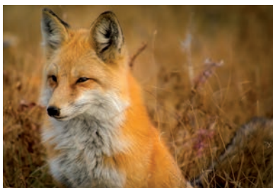
A RÓKÁKTÓL KELL EZEKBE A NAPOKBAN ÖVNI KUTYÁINKAT

A Csongrád-Csanád Megyei Kormányhivatal Agrárügyi Főosztály Élelmiszer-biztonsági és Állategészségügyi Osztálya, mint élelmiszerlánc-biztonsági hatáskörben eljáró hatóság, a rókok vesztség elleni orális immunizálása – 2021. évi őszi kampány keretein belül 2021. október 2. napjától kezdődően 2021. október 22. napjával bezárólag ebzárlatot és legeltetési tilalmat rendel el Csongrád-Csanád megye teljes területére kiterjedően, az alábbiak kivételével: Felgyő,