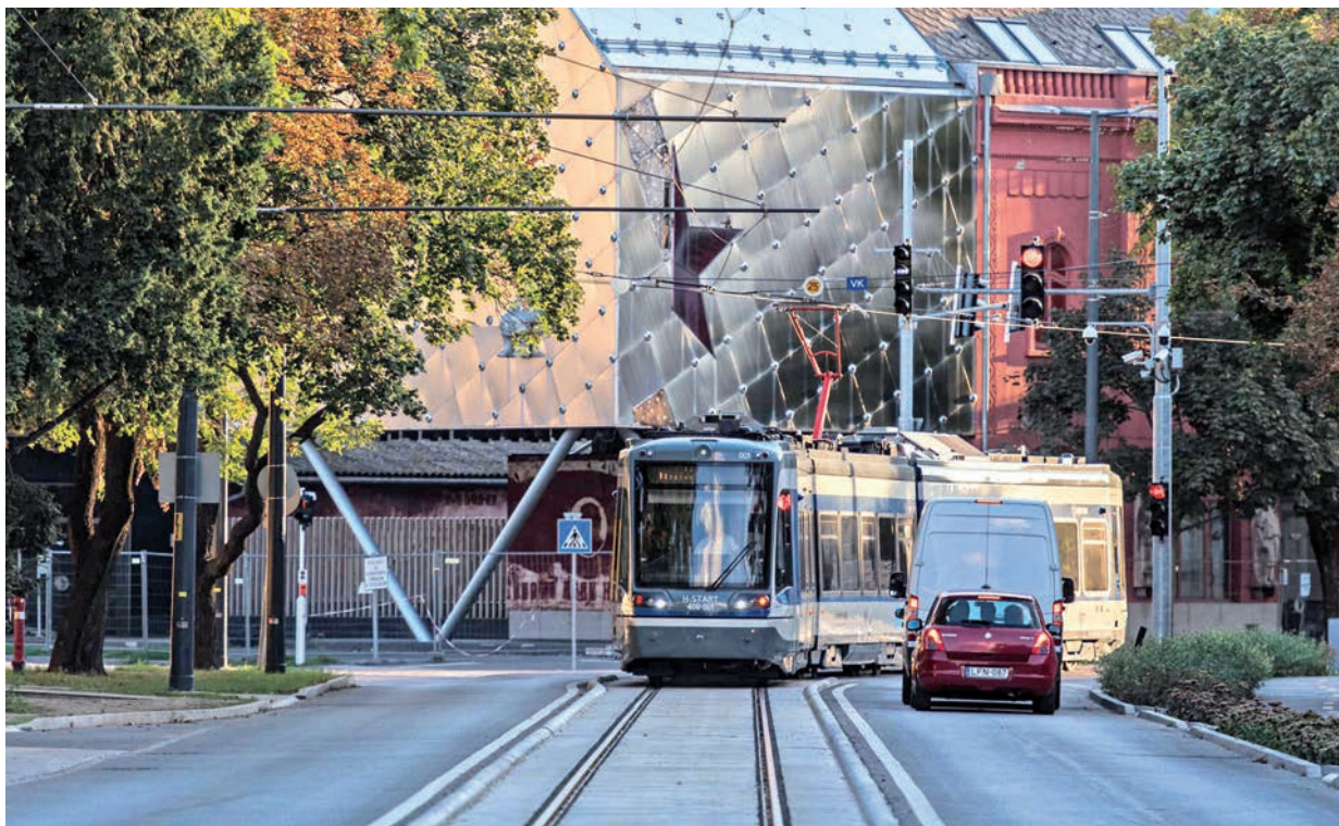
AZ EDDIGI HÍREK ALAPJÁN DECEMBERBEN INDUL EL AZ UTASFORGALOM