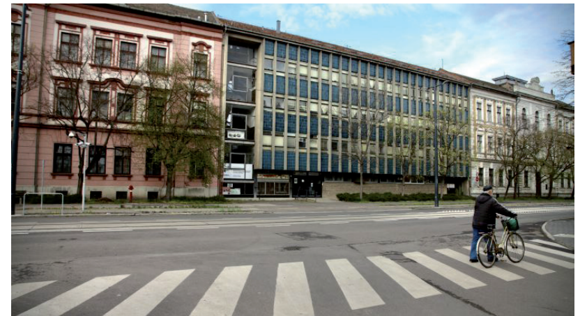
A MEZŐGAZDASÁGI KARON IS KÖTELEZŐ LESZ SZINTE MINDIG VISELNI A MASZKOT