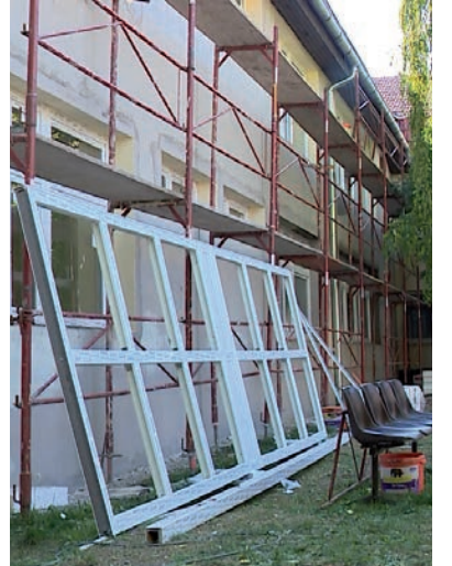
OKTÓBER 22-RE VALÓSZÍNŰLEG KÉSZ LESZNEK

A beruházás nagyságát jól mutatja, hogy csak a padlás és a földem szigetelés több mint 2000 négyzetméte-