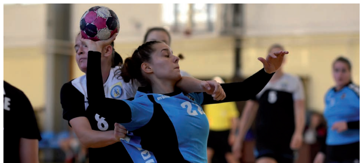
SZEGEDEN MOST NEM SIKERÜLT NYERNI