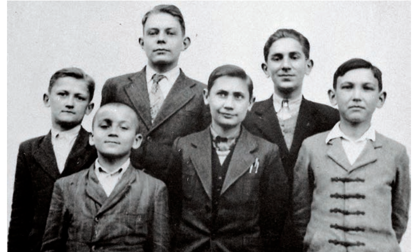
A CSERESNYÉS KOLLÉGIUM (TANYAI TANULÓK OTTHONA) ELSŐ 6 DIÁKJA 1938-BAN