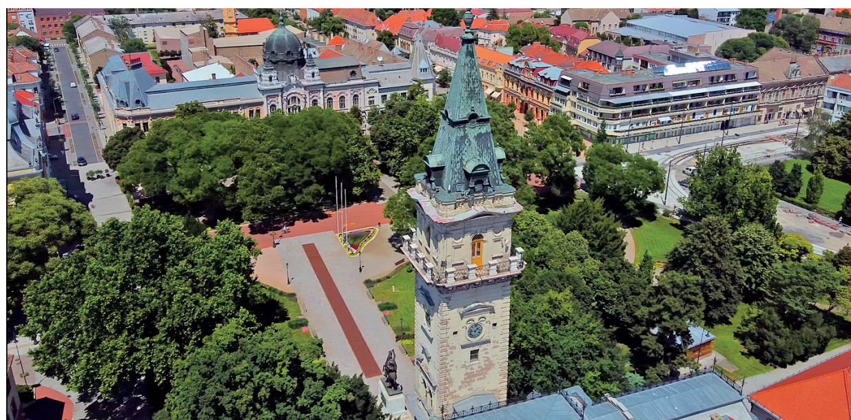
1,4 MILLIÁRDBÓL LETT