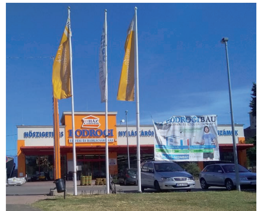
EGYELŐRE MÉG NEM ÉPÜLT MEG A BODROGI BAU KFT. BETONELEM GYÁRTÓ ÜZEM