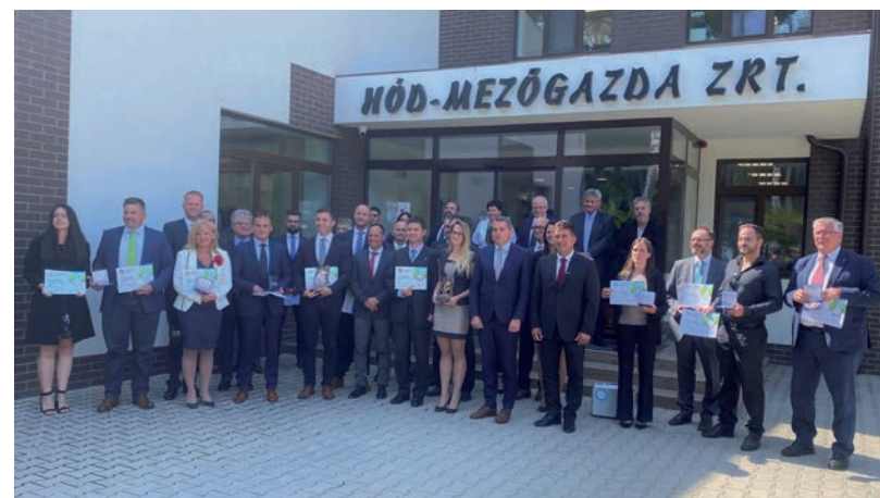
A 28. ALFÖLDI ÁLLATTENYÉSZTÉSI ÉS MEZŐGAZDA NAPOK, AZ OMÉK TÁRSRENDEZÉNYÉNEK KÉPÜNKÖN A TERMÉKDÍJASOK ÉS AZ ÁTADÁS RÉSZTVEVŐI.

ELŐVÁLASZTÁS • Kisebb vita alakult ki a közvetítések körül, öten csatáznak