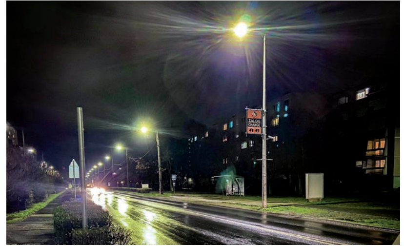
A CÉGEK ÚTON VANNAK A MEGSZŰNÉS FELÉ

A gazdasági portál szerint az még kérdéses, hogy a jelentés pontosan mikor lesz publikus, hiszen a pereszes Bizottság még fellebbezhet, és azt sem lehet tudni, hogy ki fog derülni a dokumentumból olyan