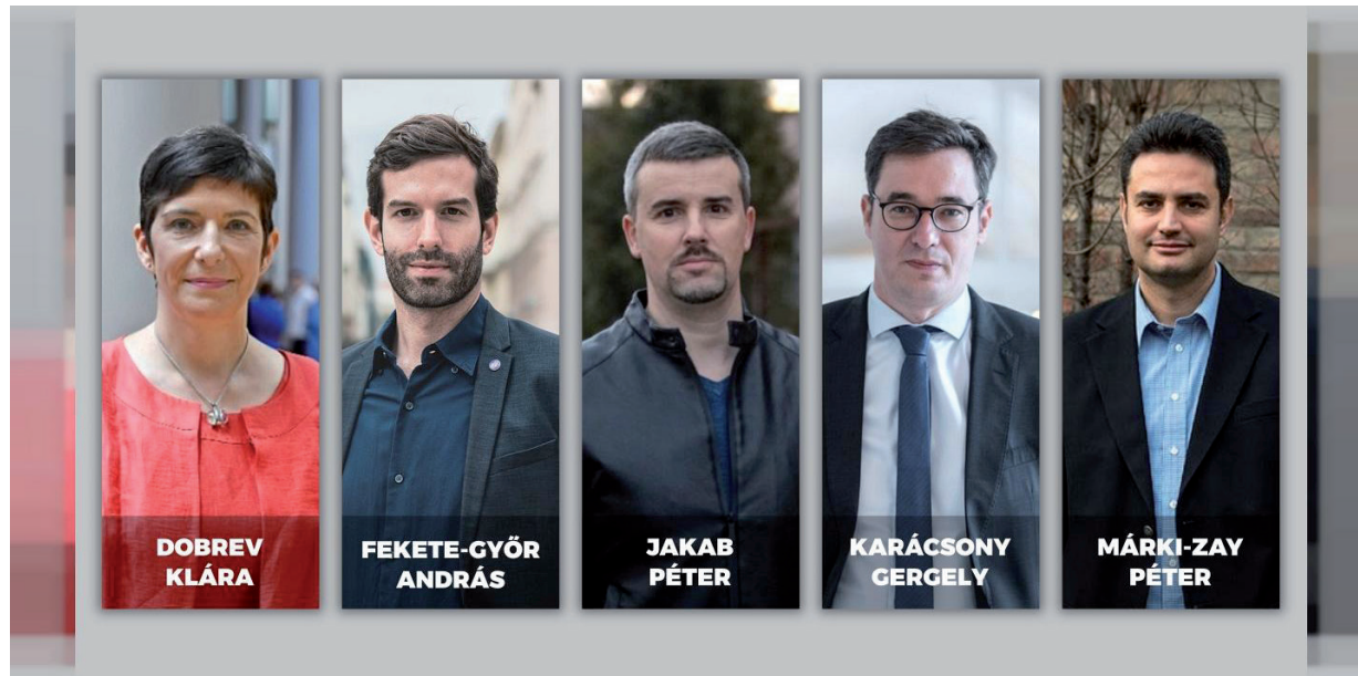
5 JELÖLTNEK GYÚLT ÖSSZE A 20 EZER ALÁÍRÁS (MINISZTERELNÖKI ELŐVÁLASZTÁS 2021 - FACEBOOK-OLDAL)

A pártok közlése szerint több médium és egyéb szervezet jelentkezett a viták lebonyolítására. A pártok ajánlatokat kértek, majd olyan szempontok szerint döntöttek, mint