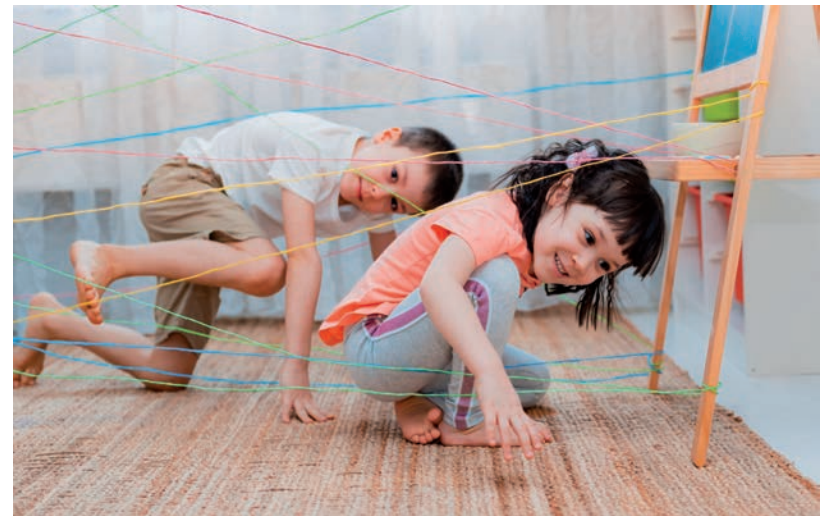
SEGÍTŐ EMBEREK JELENTKEZÉSÉT VÁRJÁK TEHETSÉGGONDOZÁS TERÜLETÉN (A KÉP ILLUSZTRÁCIÓ)