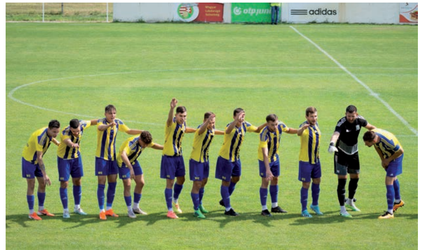
A 2. FORDULÓBAN KIESETT A HFC A MAGYAR KUPÁBÓL

Szeptember 4-én bajnoki mérkőzésen mérte össze tudását a két együttes, amelyen a vendégek végig