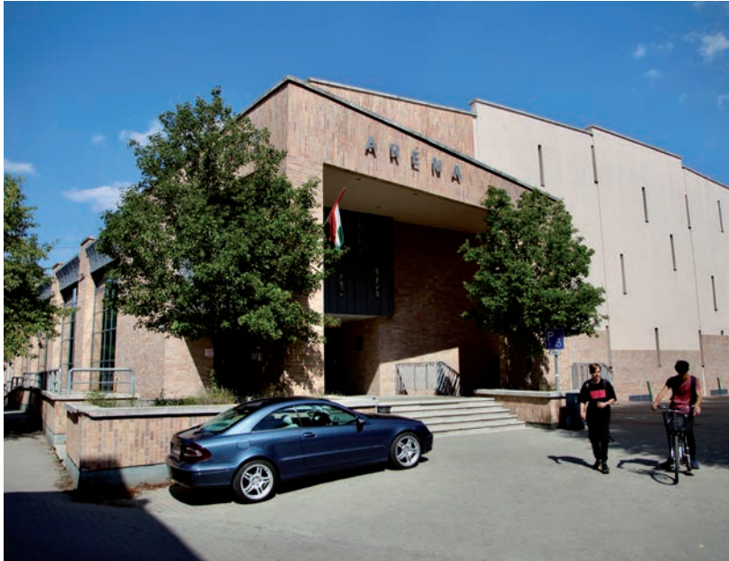
A SPORTCSARNOKOT ÉPÍTŐ CÉG CSÖDJÉRŐL MEGFOGALMAZOTT ÁLLÍTÁS VOLT VALÓTLAN. NEM LÁZÁR, HANEM A TESTÜLET DÖNTÖTT.