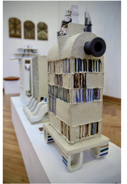
OKTÓBER 10-IG LÁTHATÓ A TÁRLAT