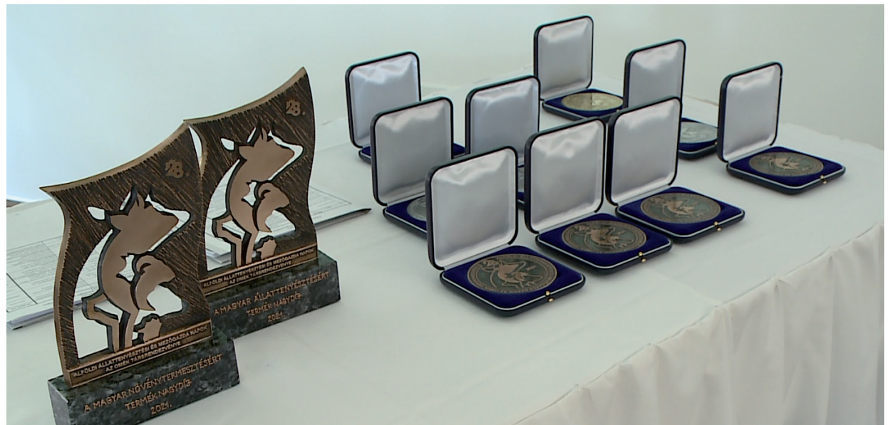
ÁTADTÁK A 2021. ÉVI TERMÉKDÍJAKAT