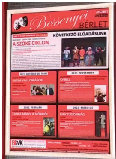
REMÉLJÜK, ZAVARTALANUL VÉGIGMEGY A MOSTANI SZÍNHÁZI ÉVAD A BFMK-BAN

Tavaly a BFMK évadát is átszabta a pandémia, az előadások közül csak egyet, a Pikali Gerda főszereplésével bemutatott, A bolond lányt vitték színre. Az elmaradt előadások, némi változtatással az idei évadban lesz-