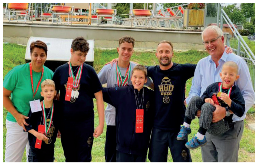
BÜSZKÉK LEHETNEK A TELJESÍTMÉNYÜKRE ÉS AZ EREDMÉNYEIKRE

Az eseményen több olimpiai bajnok is tiszteletét tette. Az úszóknál Darnyi Tamás valamint Wladár Sándor a Magyar Speciális Olimpiai Szövetség nagykövete az éremátadásnál is aktív szerepet vállaltak a dobogós versenyzők nagy örömeire. ■