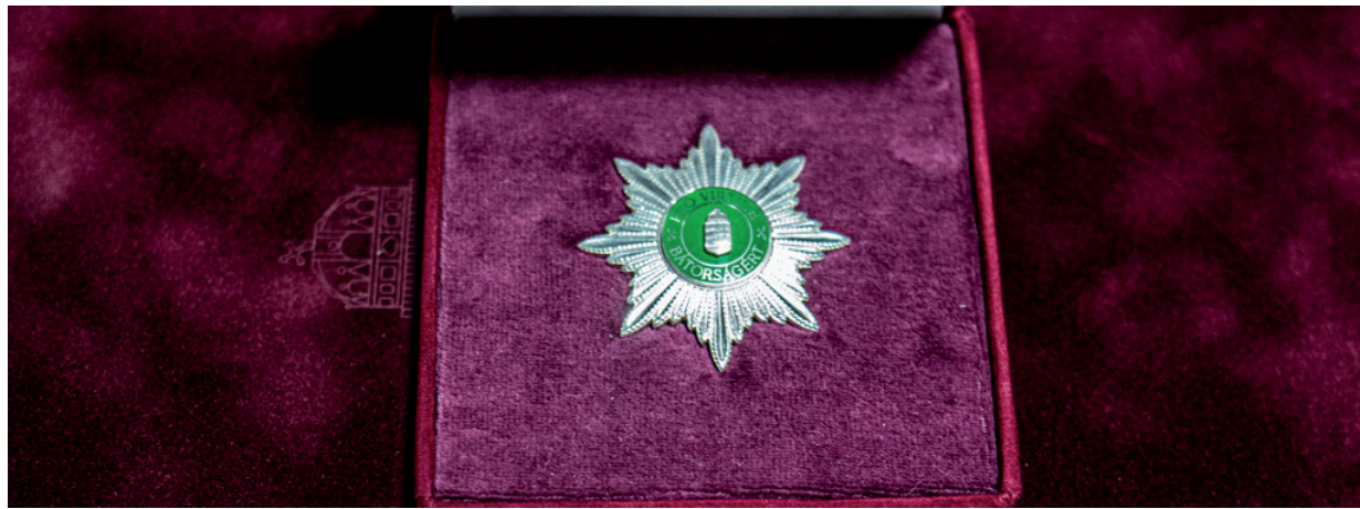
JÓ HELYRE KERÜLTEK AZ ELISMERÉSEK

Ez év február 24-én, reggel nyolc óra után riasztás érkezett a hódmezővásárhelyi tűzoltó-laktanya ügyeletére, írja a Csongrád-Csanád Megyei Katasztrófavédelmi Igazgatóság. Mint kiderült, robbanás történt egy tanya épületében, a lakóház lángokban állt. A külterületi ingatlanban egy idős nő lakott. Több egység is a helyszínre indult, a kiér-