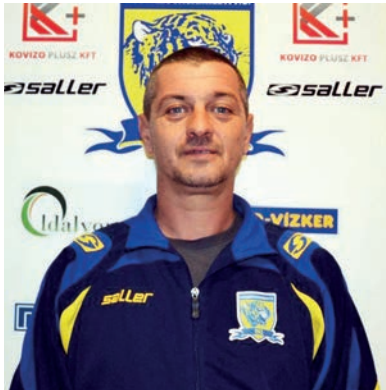
JÁTÉKOS, EDZŐ MAJD SPORTIGAZGATÓ

Az előző kiírásban a Bács-Kiskun megyei bajnokságot a Jánoshal-