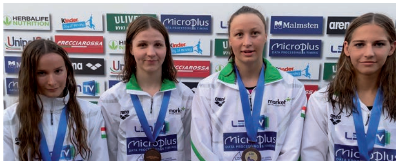
A 4x100-AS LÁNY GYORSVÁLTÓ.