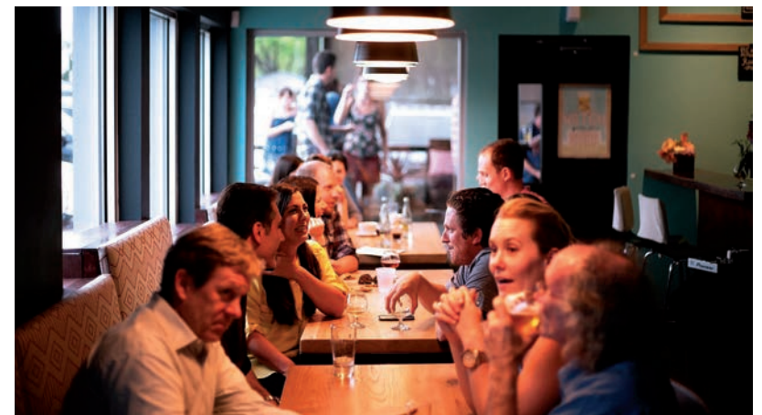
EGYRE SZÍVESEBBEN MEGYÜNK VISSZA ÉTTERMEKBE (A KÉP ILLUSZTRÁCIÓ)