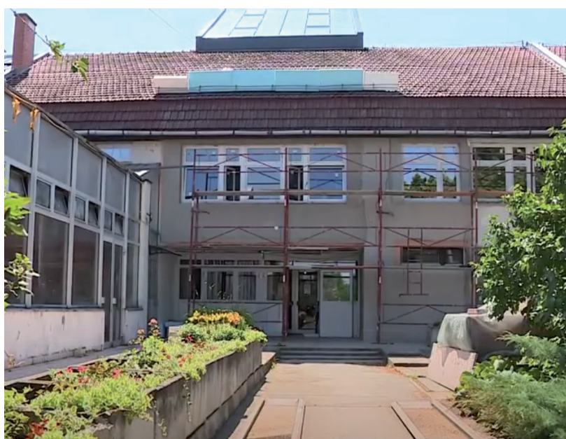
SZEPTEMBERRE KÉSZ LESZNEK A KOVÁCS-KÜRY FELÚJÍTÁSÁVAL

Félidejéhez érkezett a Németh László Városi Könyvtár és Pósa Lajos