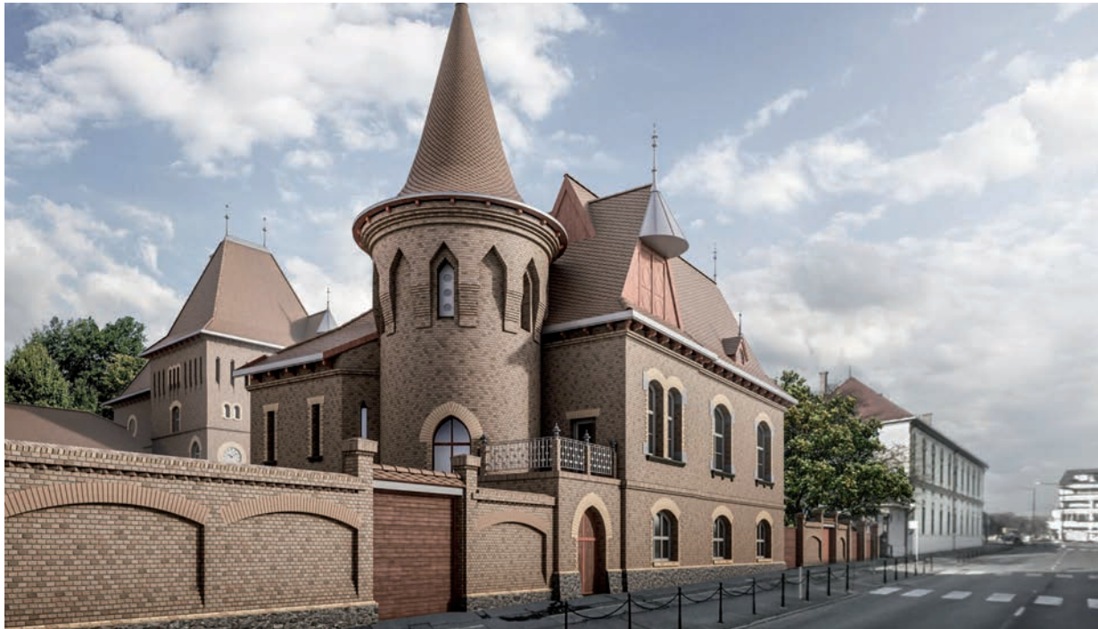
HIVATALOSAN MÉG SEMMIT SEM LEHET TUDNI A BETHLEN ÉS A NÉMETH LÁSZLÓ SORSÁRÓL