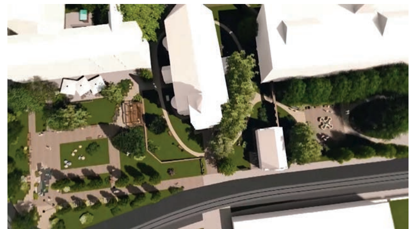
A BELVÁROS REKONSTRUKCIÓJA SORÁN A ZÖLDÍTÉSRE IS FIGYELNEK