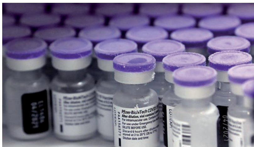
JÚLIUS ELEJÉIG 715 MAGYAR MENT PFIZERÉRT ROMÁNIÁBA, A SZÁMUK FOLYAMATOSAN NŐ

A román hatóságok ellenben megerősítették, ugyanis a Magyar Hang megkeresésére az ottani operatív