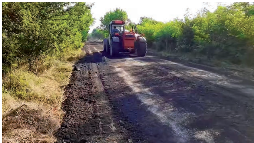
EZÜTTAL A VÁSÁRHELYI RÓNA KFT. SZÁRÍTÓ ÜZEME ÉS A 9-ES KM SZELVÉNY KÖZÖTT DOLGOZTAK

Több mint 20 éve megoldatlan probléma a külső Rárósi út állapota, ami naponta keseríti meg az ott élők, illetve az arra közlekedők életét. Az önkormányzat tavalyelőtt már közel 300 m 3 mart aszfalt szétterítésével igyekezett ideiglenesen járhatóvá tenni az utat, majd ezt a munkát 2020-ban 150 m 3 kijuttatásával megismételte.