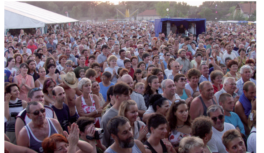
SAJNOS NEM IDÉN FOG FOLYTATÓDNI A NAGYSZERŰ HAGYOMÁNY