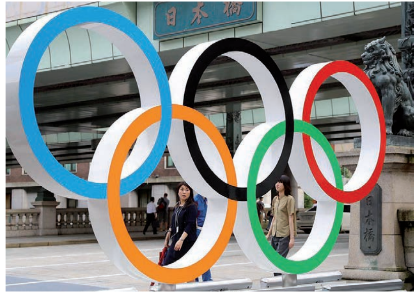
NÉZŐK NÉLKÜL FOGNAK ZAJLANI AZ OLIMPIAI JÁTÉKOK

Az egyik szerb evezős pozitív mintát adott Japánban, majd a vele utazó négy társát is két hétre karanténba helyezték. A MOB orvosi bizottsága ezután tette meg javaslatát, amelyet egyhangúlag elfogadtak.