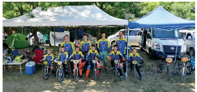
KITETTEK MAGUKÉRT KICSIK ÉS NAGYOK EGYARÁNT