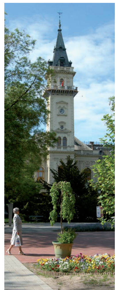
MÁR TERVEZIK A VÁROSHÁZA TORNYÁNAK FELÚJÍTÁSÁT IS.

A műemléképület lemállott, illetve laza részeit a kivitelező szakasszon el távolítja, majd több sorban a vakolatot felépíti és a végén a díszvakolatot kimunkálja, mindezt közel 10 méteres magasságban. A vakolási munkálatok után természetesen utolsó lépésként sor kerül majd a javított részek meglévővel eredeti színre festésére is. A munkálatok augusztus elejére elkészülnek. A munkálatok 4,2 millió forintba kerülnek. ■