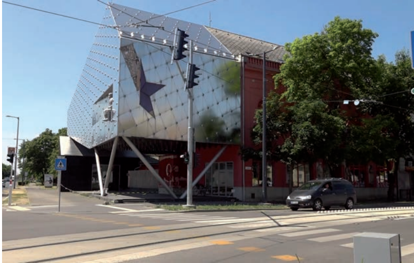
2006. JÚLIUS 7-E ÓTA NYITVA