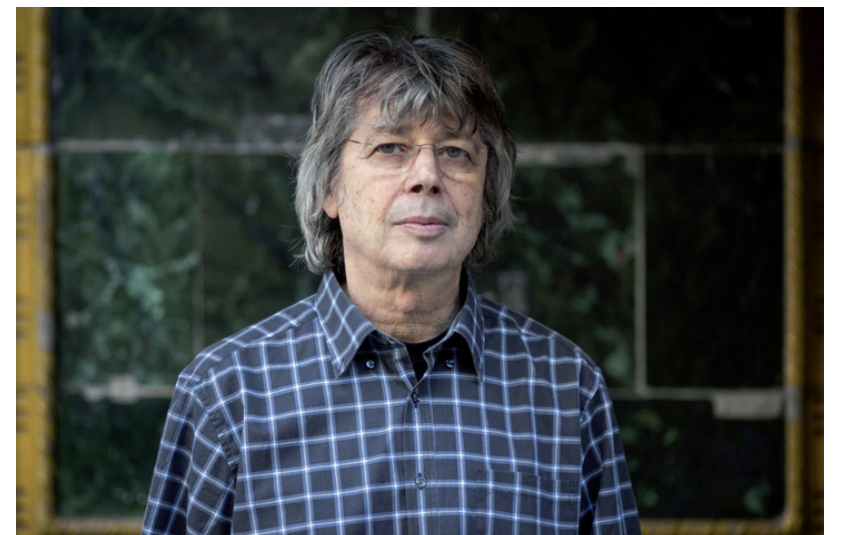
BRÓDY JÁNOS LESZ AZ EGYIK A NEVES FELLÉPŐK KÖZÖTT HÓDMEZŐVÁSÁRHELYEN

Emellett a nemzeti ünnephez kapcsolódó, valamint családi rendezvények várják egész hétfvégén az érdeklődőket. A részletes programokat következő lapszámunkban, augusztus 13-án olvashatják. ■