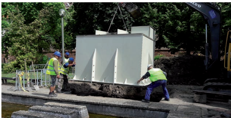
FELAJÁNLÁSOKBÓL ÚJULHAT MEG A KÚT