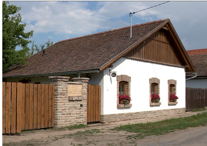
ILYEN LETT

Amikor másfél évvel ezelőtt hazajött Magyarországra, nem tudta, merre tovább, minden benne volt a pakliban. Visszamehetett volna Svájcba is, ahol a turizmusban dolgozott, de máshogy alakult az élete. A nővére mondta neki, hogy eladó a fent látható ingatlan, amivel már régebb óta szemezt, és bár volt, aki le akarta erről beszélni, végül megvette és belevágott a falak, a telek, a bútorok és összességében a belső tér felújításába.