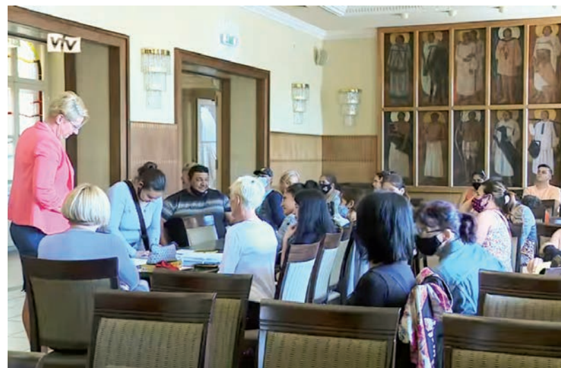
HA A KÖVETKEZŐ HÓNAPOKAT IS SIKERESEN VESZIK, AKKOR VALAMENNYIEN SZAKKÉPESÍTÉST KAPHATNAK