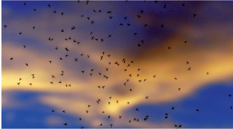
BŐVEN VAN FELADAT A GYÉRÍTÉS SORÁN