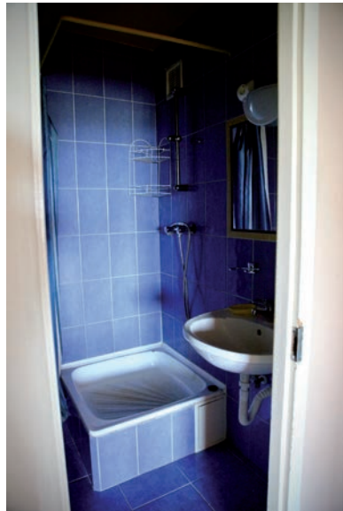
EDDIG 4 LAKÁSBA KÖLTÖZTEK BE A VESZÉLYHELYZET ALATT

A közgyűlés által még 2017-ben elfogadott Minőségi Otthoncsere Program keretében, bár ő az 5. emelet alatt lakik, de neki is felajánlották, hogy beköltözhetne egy családi házba. Ő azonban nem szeretett volna, még akkor sem, hogyha a piaci árnál akkor mintegy 2 millió forint-