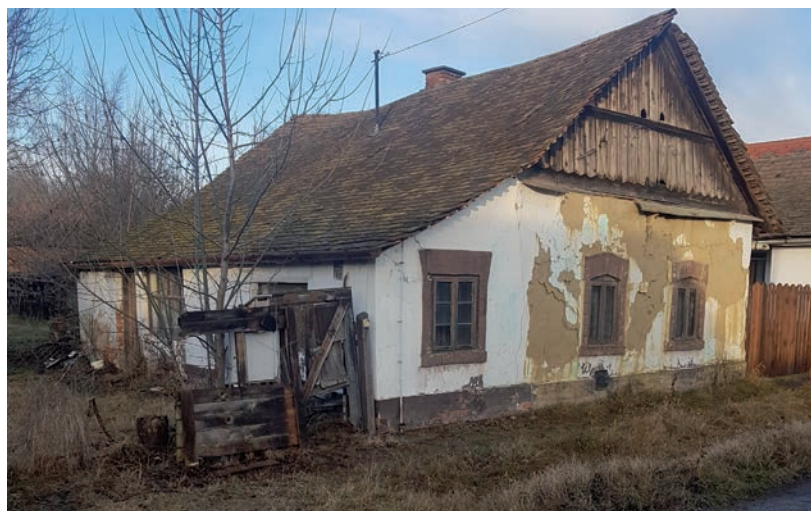
ILYEN VOLT

Még a járvány előtt 2020 januárjában vásárolta meg a régi parasztházat Somodi Ágnes, aki maga is Mártélyról származik, és aki előtte több évig külföldön dolgozott. A távollét ellenére imádja a települést, ezt tekinti otthonának. Többen is mondták neki, hogy a ház inkább lebontásra érett, és bolondság megvásárolni, pláne bútorostul, hiszen akkor így nézett ki a lakatlan, mintegy 120 éves ingatlan.