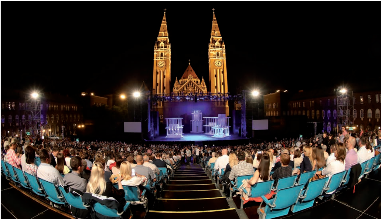
AZ IDEI NYÁR ISMÉT AZ ÉLŐ ELŐADÁSOKRÓL FOG SZÓLNI SZEGEDEN.