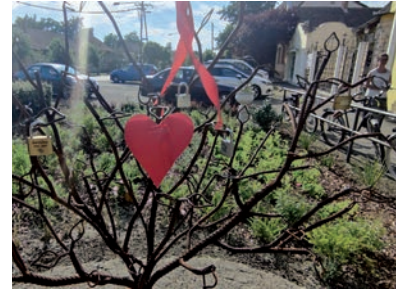
FELKERÜLT AZ ELSŐ LAKAT

Az első szerelmesek már elhelyezték szerelmük "zálogát" a lakatfán. Ez az esemény is azt mutatta, hogy a városba a járvány után, remélhetőleg most már véglegesen, visszatért az élet. Ennek volt a bizonyítéka a Kankalin Néptáncgyűttes előadása, valamint a hangulatos zene is.