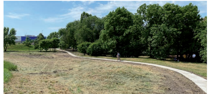
MEGÉPÜLT A JÁRDA A BEVÁSÁRLÓKÖZPONTOKHOZ