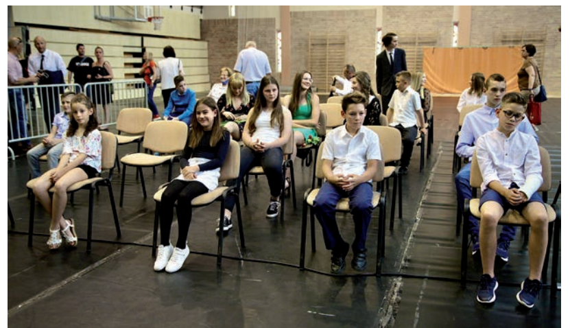
MINDEN KOROSZTÁLYBAN DÍJAZTÁK A JÓ TANULÓKAT, JÓ SPORTOLÓKAT

Én sem úgy kelek fel minden reggel 4:50-kor, hogy szeretnék beugrani