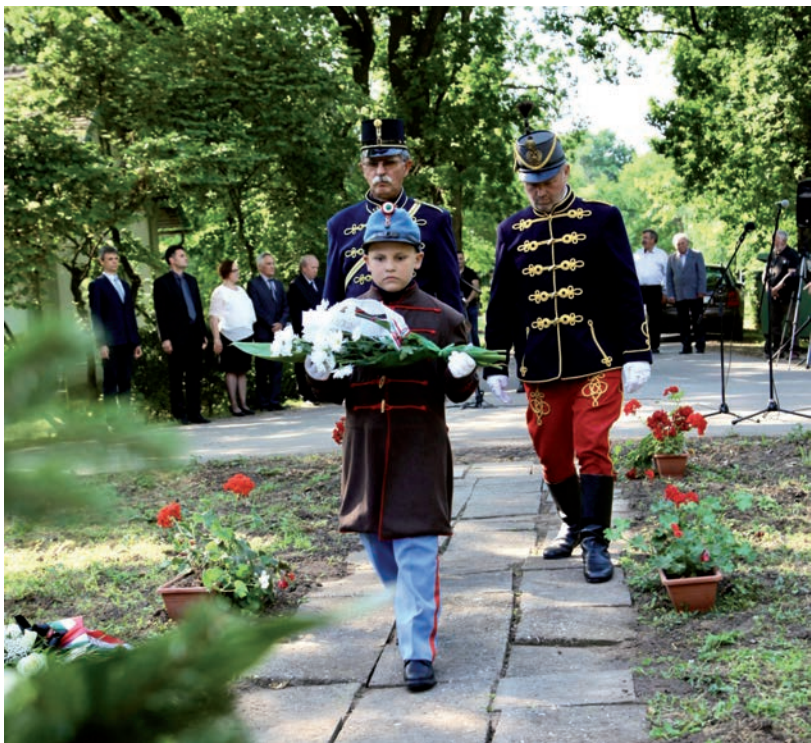
MÉLTÓSÁGTELJES VOLT AZ IDEI MEGEMLEKEZÉS