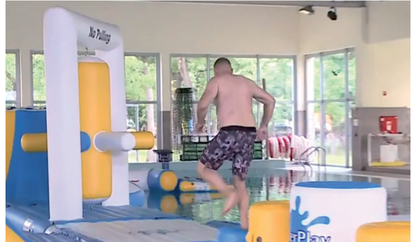
MINDENKI MEGTALÁLTA A KEDVÉRE VALÓ JÁTÉKOT A TÖRÖK SÁNDOR STRANDFÜRDŐBEN

Ez olyan, mint egy gumimatrac, de annál sokkal keményebb, hasonló anyagból van, mint a supok, ezek az evezős vízi eszközök. Ezekon különféle tornagyakorlatokat végeznek a résztvevők, egyensúly gyakorlatokat, azon túl, hogy a főbb izomcsoportokra hat. az egyensúlyozást is megköveteli, tényleg a tartósan résztvevő kórizmok állan-