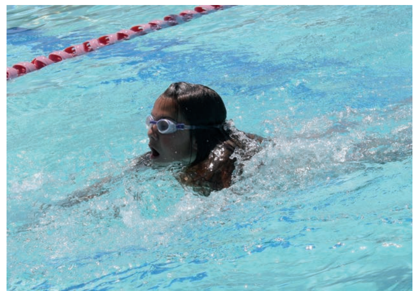
REMEKÜL SZEREPELTEK A HÓD ÚSZÓ SE SPORTOLÓI MONORON (ILLUSZTRÁCIÓ)

gyerekek szerepeltek, akik egyedül is vízbe mernek menni. Az eredmények sem maradtak el: 17 aranyérmes, 5 ezüstérmes, és néhány bronzérmes is hoztak haza.