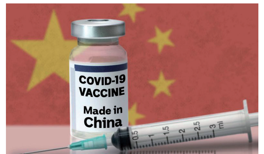
TÖBBEN AGGÓDNAK, HOGY AZ OLTÁS UTÁN NINCS ANTISZTESZTJÜK

A külföldre való utazás sem egyszerű a Sinopharm-al oltottaknak. Akik AstraZenecát, Pfizer, Jansent vagy Modernát kaptak, elvileg szabadon utazhatnak az EU-n belül. Azoknak viszont, akik Szeptnyikkal vagy Sinopharmmal oltottak be, utazás előtt érdemes tájékozódniuk, hogy az adott ország elfogadja-e a vakcinát, vagy feltételekhez köti a beutazást. Az Európai Gyógy-