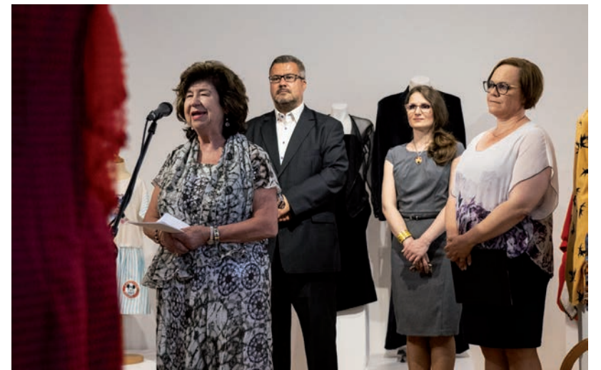
A DIVAT SOHA NEM MEGY KI A DIVATBÓL (FOTÓ: VÁSÁRHELYI MÉDIACENTRUM)

A divatszakember szerint ez a kiállítás fejleszti a közízlést, a szépre és a jóra nevel, ahol rájöhet az érdeklődő, hogy minél egyszerűbb egy öltözet, annál elegánsabb. Erről augusztus végéig, bárki maga is meggyőződhet a Tornyai János Múzeum emeleti termeiben. ■