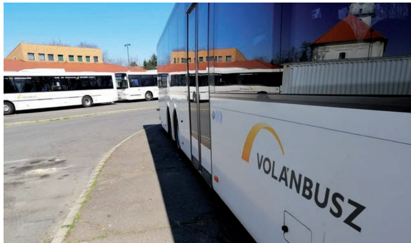
A JÖVŐ TANÉVRE ÚJ PÁLYÁZATOT ÍRUNK KI (A KÉP ILLUSZTRÁCIÓ)