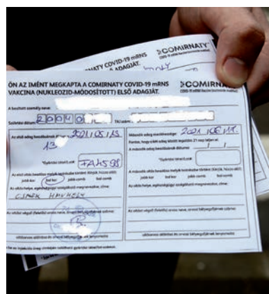
JÚLIUS ELEJÉRE MÁR KIALAKULHAT A VÉDETTSÉG, AZ IGAZOLVÁNY MÉG HAMARABB MEGÉRKEZIK

Én azért jöttem, hogy legyen nyaram. Nem csak bulizni szeretnék, hanem diákunkát vállalni is – mondta érdeklődésünkre egy 16 éves fiú, aki 17 éves testvérével együtt érkezett az oltópontra. Az idősebb fiú hozzátette, ő is a szabad nyár miatt szeretne volna minél hamarabb beolttatni magát, és mert ezt társadalmilag is fontosnak tartja. Mindketten körül-