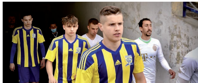
A LEANDRO-VAL FELÁLLÓ FRADI II. ELLEN MÉG GYŐZÖTT A CSAPAT

Sajnos az új seprű sem seprét jól. A HFC május 16-án fogadta a Monor együttesét és megsemmisítő, 7-0-ás vereséget szenvedtek. Ezzel visszacsúsztak a kiesést jelentő 16. helyre, 2 fordulóval a vége előtt. ■