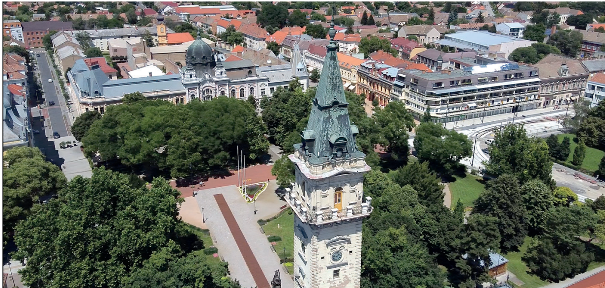
NEM TUDNI, KINEK A MEGBÍZÁSÁBÓL VÉGIK A KÖZVÉLEMÉNY-KUTATÁST HÓDMEZŐVÁSÁRHELYEN