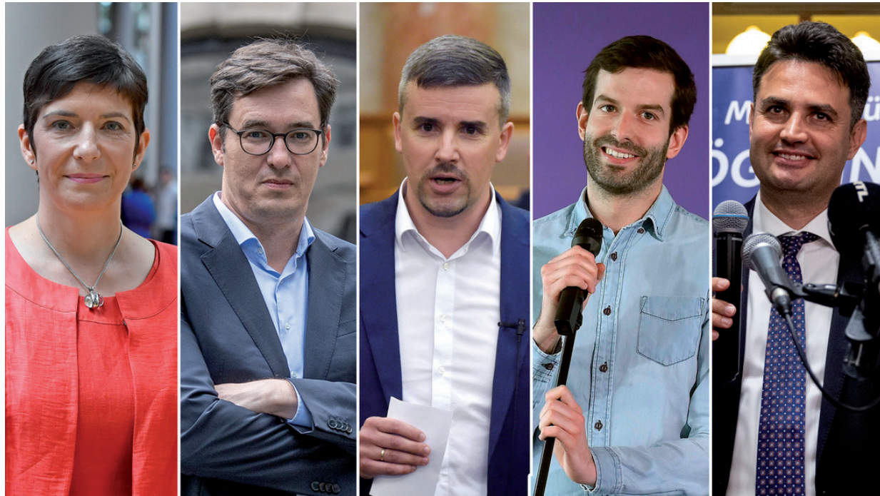
ÚGY TŰNIK, MEGVAN KIK INDULNAK