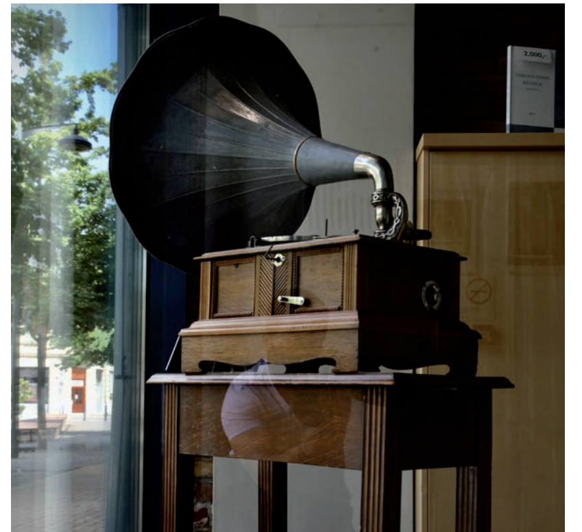
BELÜLRŐL FOTÓZTUK, DE KÍVÜLRŐL IS MEGCSODÁLHATJUK A TÖBB MINT 100 ÉVES GRAMOFONT

A felújított gramofon nemcsak a néprajzi, hanem az egész intézményi gyűjtemény egyik fontos ékköve lett, ezért a következő napokban a Tornyai János Múzeum főbejáratánál lehet megcsodálni a múzeum ablakán át - védettségi igazolvány nélkül is! ■