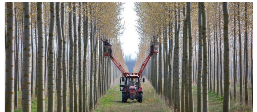
TÖBB MINT FÉLEZER HEKTÁRON KEZDŐDHET ERDŐNEVELÉS

Az erdőtelepítés hektáronkénti költségára hozzávetőlegesen egymillió