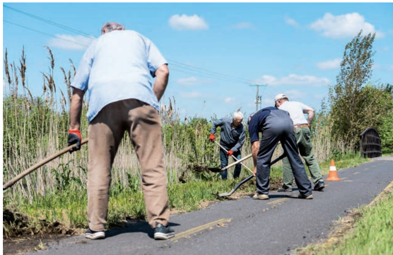
500 MÉTERES SZAKASZT TISZTÍTOTTAK MEG, A 47-ES ELKERÜLŐ KÖRFORGALMÁTÓL A KENYERE-ÉR FELETT ÁTIVÉLŐ FAHÍDIG.

Erdetileg sövényt szerettek volna ültetni a kerékpárút mellé, de ehhez a közútkezelőtől engedélyt kell kapniuk. A sövénynek szánt növények