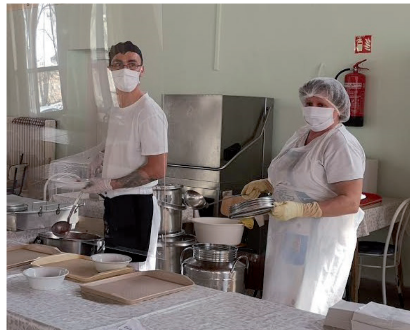
RÁSZORULÓ GYEREKEKEN LEHET SEGÍTENI IDÉN IS

Az ehhez szükséges adomány a K&H Bank Zrt. vezetett 10400559-00032625-00000006 számlaszámra utalható, vagy a Polgármesteri Hivatal pénztárában személyesen is befizethető. ■