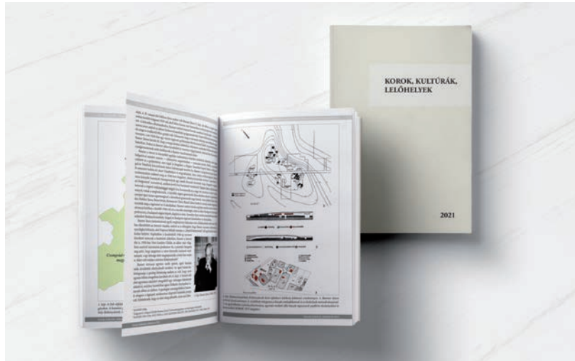
A KIADVÁNY A TORNyaiMUZEUM.HU OLDALON OLVASHATÓ