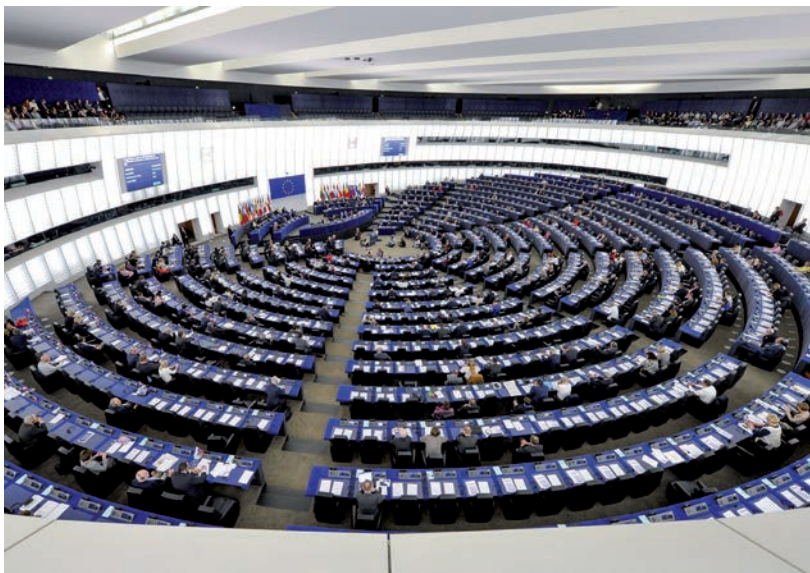
SAKÍTOTT EGYMÁSSAL AZ EPP ÉS A FIDESZ

mány hamarosan az uniós bíróságon támadja meg a tavaly elfogadott jogállamisági rendeletet, és ez már az Európai Néppártban is sokak, többek között a német tagok nemtetszését is kiváltotta. Ahogy írják, sokkal inkább ez, illetve a magyarországi események, mintsem a Néppárt frakciójának alapszabály-módosítása vezetett a szakításhoz. Manfred Weber, az Európai Néppárt frakcióvezetője az osztrák Profilnak adott interjújában azt mondta, az alapvető kérdésekben, jogállamiság, keresztény emberkép, eltávolodott Orbán pártja az Európai Néppártól, és ezen nem lehetett túllépni. Weber hangsúlyozta, hogy nem Deutsch