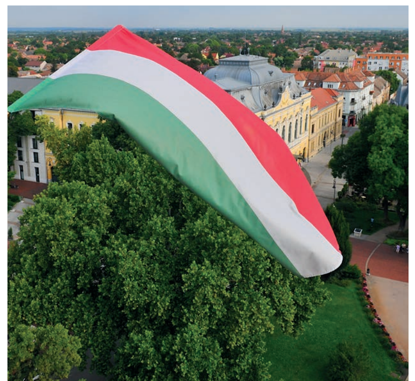
AZ ÉVÉRTÉKELŐ SAJTÓTÁJÉKOZTATÓ UTÁN A MÖGCSINÁLTUK! CÍMŰ KIADVÁNYT MINDEN HÁZTARTÁSBA ELJUTTATJÁK