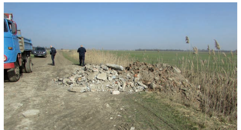
ELŐFORDULT MÁR, HOGY ILLEGÁLIS ÁJTJÁRÓT KÉSZÍTETEK ÉPÍTÉSI TÖRMELÉKBŐL