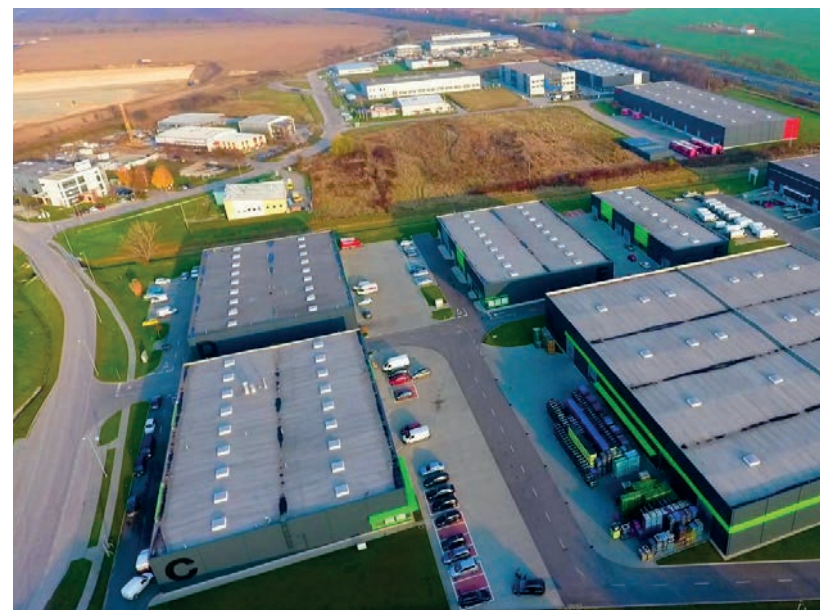
EGYRE TÖBBEN JÖNNEK AZ IPARI PARKBA A KÉP ILLUSZTRÁCIÓ (HÓDMEZŐVÁSÁRHELYI IPARI PARK)

dékszállítás kiszervezése (70 millió forint), bankváltás és hitelkiváltás (20 millió forint), ipari parki ingatlan értékesítés (233 millió forint). A város költségvetésének rendezése érdekében inflációkövető lakbér-emelést folytatnak, de az ebből befojt összegből ingatlan karbantartást végeznek majd és január 1-től 20 családnak havonta 10-10 ezer forint támogatást adnak szociális alapon. A munkabérek és az élelmiszerek áremelkedése miatt a közétkeztetés 7,15%-kal drágult januártól, a diétás étkezésnél az emelkedés 9,81%, de ezek még így sem fedezik a szolgáltatás költségeit. Az elmúlt évben elért vásárhelyi eredményeket Mőgcsináltuk című füzetben, a hozzá tartozó, a körzeti képviselő, a közterület-felügyelő, valamint a városüzemeltetési koordinátor telefonszámát tartalmazó hűtőmágnessel együtt valamennyi vásárhelyi polgár megkapta vagy a közeljövőben megkapja. ■