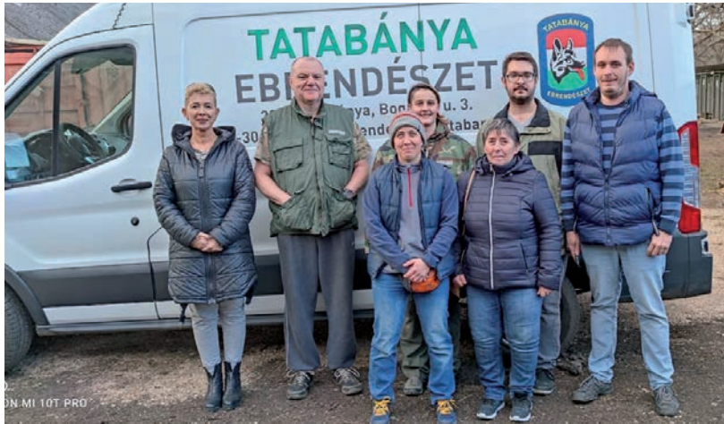
A SZAKMAI KAPCSOLATOKAT ERŐSÍTETTÉK

A tatabányaiak nem engedték el a vásárhelyieket üres kézzel, a védenceik számára küldtek állateledelt. ■