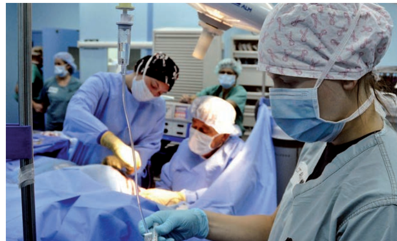
MINDEN EGYES TÁVOZÓ HIÁNYOZNI FOG - KÉPÜNK ILLUSZTRÁCIÓ

Ugyanakkor hírportálunk, a Hódpress cikkét, miszerint Hódmezővásárhelyen a Magyar Orvosi Kamara nem tud olyan egészségügyi dolgozóról, aki ne írta volna alá az új szolgálati jogviszonyokról szóló szerződést, többen kommentálták, ők teljesen mást tudnak. Nekünk is sikerült olyanokkal beszélnünk, akik nem írták alá az új jogviszonyról szóló szerződést. Például 3 olyan emberről van tudomásunk, akik az SBO-ról távoztak, ám ez az értesülésünk nem hivatalos. Megkerestünk több olyan személyt, akik információink szerint távoztak, ám ők nem kívántak nyilatkozni. Akadt olyan távozó, aki elmondta, hogy