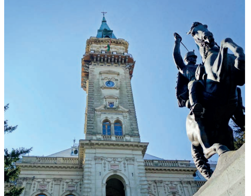
ISMÉT MŰKÖDIK A TORONYÓRA

A javítás azért húzódott sokáig, mert a korábban javításokat végző órásmester sajnos elhunyt és nehezen sikerült olyan szakembert találni, aki a meglehetősen régi óraszerkezet karbantartását elvállalja. ■