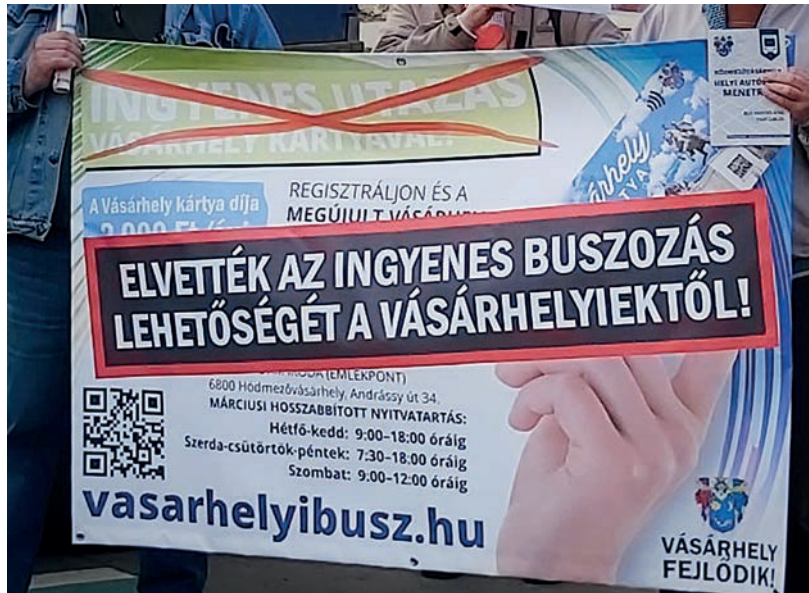
KÉT BUSZ ZAVAROS JOGI HELYZETE MIATT JOVÁNY GYULA EGÉSZ CÉGÉT FELFÜGGESZTETTÉK

A Vásárhelyi Televízió által megkérdezettek között volt, aki úgy látta, hogy a döntés mögött politikai szándék áll, melynek elszenvetői az utasok. Kishomokon régóta várt előrelépést jelentett a tiszavirág életű új szolgáltatás. – Mindenből kirúgják Kishomokot – panaszkodott egy asszony. – Ez tényleg felháborító és tényleg felszállnánk a buszra és ezt is megtiltották nekünk. Amelyik buszok járnak azok nem állnak meg. Egy férfi is panaszkodott, hogy Kishomokon rengeteg ház épült, sok arrafelé a gyermekes család, emiatt még inkább súlyos a probléma, mert nem érintik sem a Volánbuszok, sem a jövőbeni tram-train járatok ezt a településrészt. Volt, aki egyenesen politikai okokat sejt az ügy mögött. – Ha Lázár és Juhász Tünde cselekedeteit veszem, akkor ez egy aljas politikai húzás mert az elszenvetők a város lakosai. – mondta egy asszony. Egy másik békülékenyebb hangon fogalmazott: – Szívet adtunk eddig a sofőröknek. Mi a szeretet mellett vagyunk, nem a gyűlölet mellett. Pedig kapunk belőle eleget, a gyűlöletből. Ugyanezen a napon egy hódmezővásárhelyi csoport a vásárhelyi piactól indulva a Kormányhivatal szegedi épületéhez autózott, hogy tiltakozásukat fejezzék ki a döntés ellen. Délután Márki-Zay Péter egy sajtótájékoztatót is tartott. Elmondta, a leglátogatottabb helyeket el lehet érni az új szolgáltató buszjáratával és a vásárhelyi lakosok a városkártya kiváltásával évente 2 ezer forintért vehetik igénybe bármelyik járatot, bármennyiszor. Mindemel-