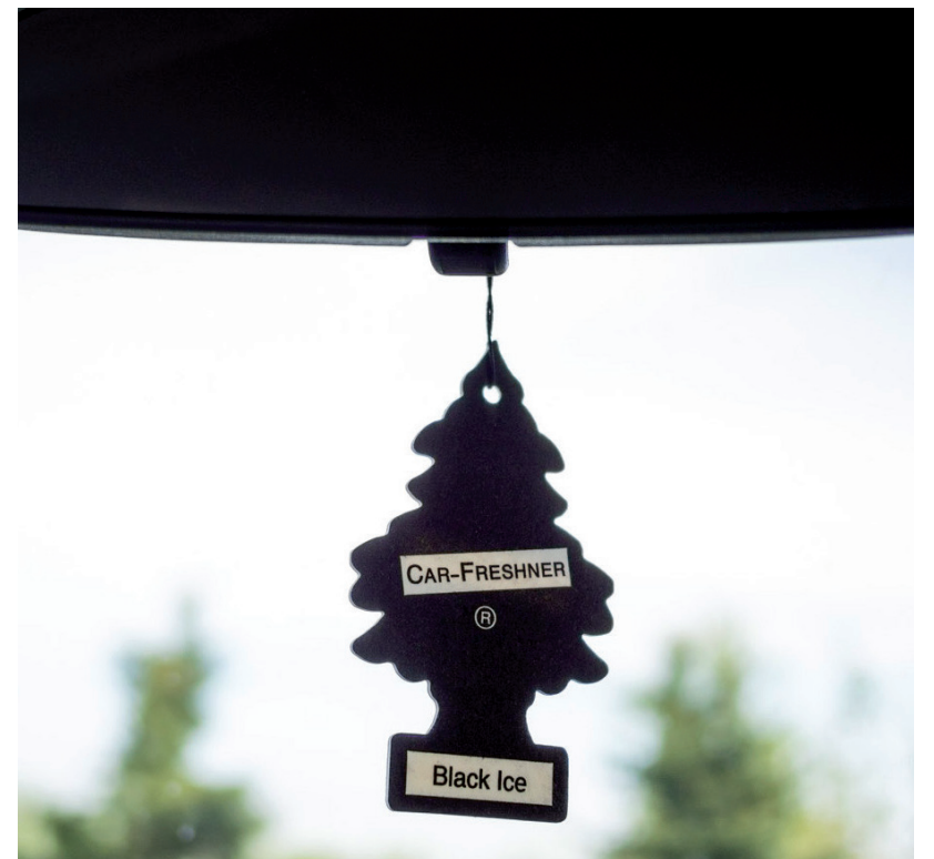
EDDIG AUTÓILLATOSÍTÓKAT CSOMAGOLTAK, MOST BŐVÍTHETIK TEVÉKENYSÉGÜKET. A KÉPILLUSZTRÁCIÓ.

Az uniós projekteket összesítő kormányzati honlap szerint januárban a megítélt támogatás felét már átutalták a szövetkezetnek. ■