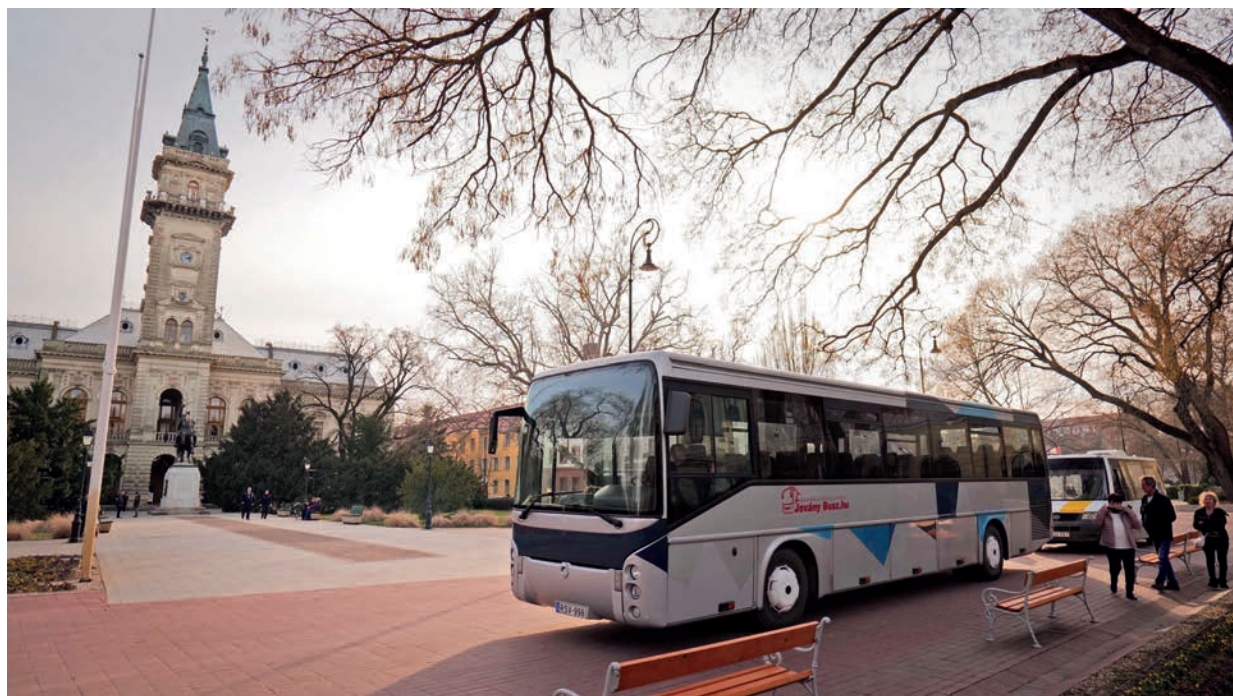
LEÁLLÍTOTTA A KORMÁNYHIVATAL A VÁROSKÁRTYÁVAL INGYENES VÁSÁRHELYI BUSZKÖZLEKEDÉST