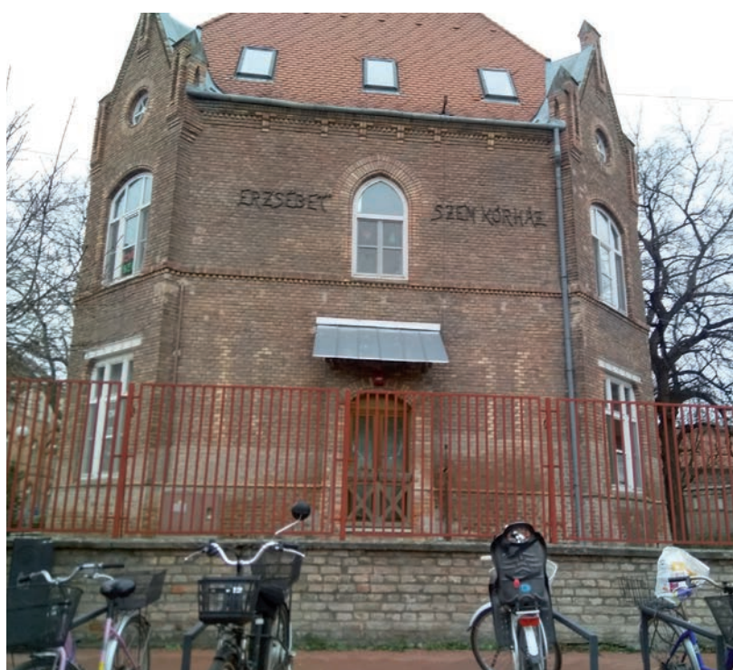
ORSZÁGSZERTE ÖT-TÍZSZERESÉRE NÖTT A VÁRAKOZÁSI IDŐ

Az adatbázisban megkerestük a vásárhelyi kórház tervezett műtéteit. Nőgyógyászati műtetre nem malignus folyamatokban 4 napról 11-re nőtt a várakozási idő és 2 előjegyzett személy van. Szürkehályog műtét várólistája 70 napról 235 napra nőtt,