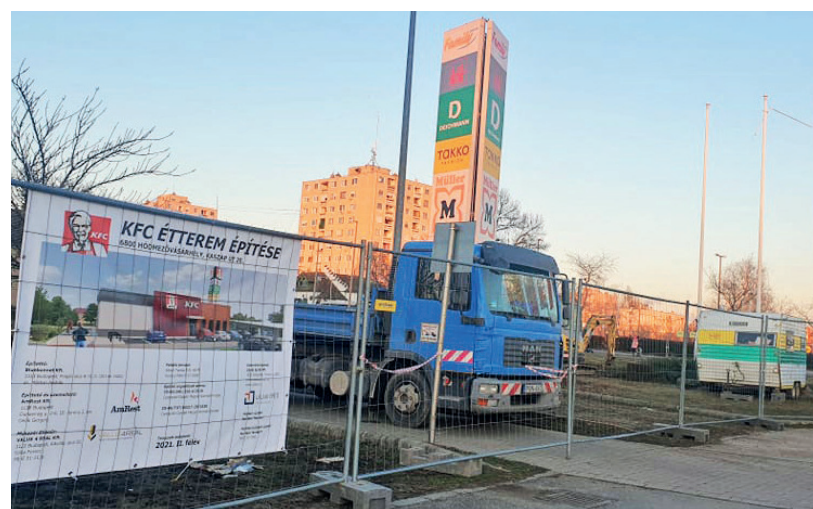
ÚJ MUNKAHELYEKET TEREMTHET HÓDMEZŐVÁSÁRHELYEN A KFC

A magyarországi KFC étteremláncot az Amrest Kft. üzemelteti. A céga adatok szerint a társaság dinamikusan növekszik az utóbbi években: míg 2018-ban 1322 főt foglalkoztatott, idén januárban már 1809 fő volt a dolgozói létszám. Nettó bevétele is