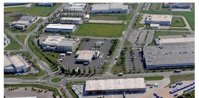
JÖNNEK BEFEKTETŐK AZ IPARI PARKBA

Márki-Zay Péter hozzátette: programokat indítottak a munkaerő helyi képzésére; a korábban országosan is kimagasló építményadót a vállalkozóknak 30%-kal csökkentették; korrupció- és politikamentesen támogattak minden vállalkozást, megnyitották előttük a városi beszerzéseket; naprakészen rendezik a számláikat és törlesztik elődeik milliárdos hátralékát. ■