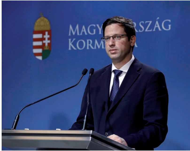
AZT MONDJÁK, NINCS FORRÁS A NEM KORMÁNYPÁRTI MEGYEI JOGÚ VÁROSOK KOMPENZÁLÁSÁRA - EGYELŐRE

let tervezet összeállításakor a cél egy olyan költségvetés összeállítása volt, amely takarékos gazdálkodás megteremtésével – a kieső működési bevételek ellenére – lehetővé teszi a város zökkenőmentes működését, valamint a tervezett beruházások megvalósítását. Amennyiben az év során szigorúan betartják a költségvetési rendeletben elfogadottakat, a város biztonságos működtetése mellett több mint 4,6 milliárd Ft-ot tudnak fejlesztésekre, felújításokra