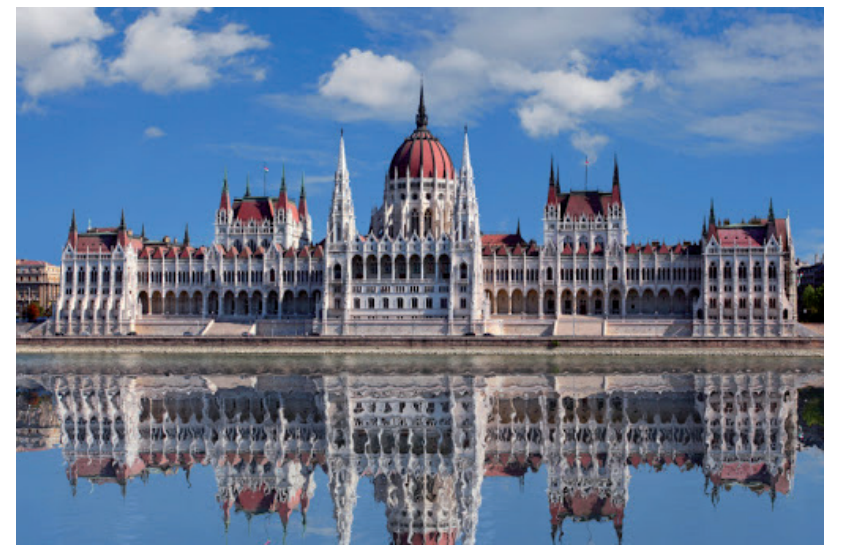
HÁROM HÓNAPIG MÉG BIZTOS MARAD A RENDKÍVÜLI JOGREND

A hétfőn elfogadott jogszabály rendezi az időközi választások és népszavazások kérdését is, kimondva, hogy a veszélyhelyzet megszűnését követő napig időközi választás és népszavazás nem tűzhető ki, a már kitűzött pedig elmaradnak. A ki nem tűzött és az elmaradt választásokat, népszavazásokat a veszélyhelyzet megszűnését követő 15 napon belül kell kitűzni. ■