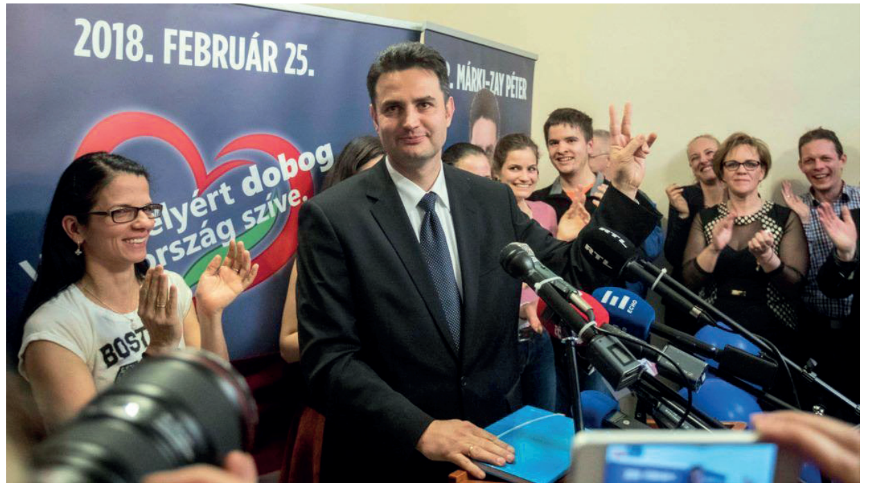
MÁRKI-ZAY PÉTER VÁLASZTÁSI GYŐZELME 2018. FEBRUÁR 25-ÉN