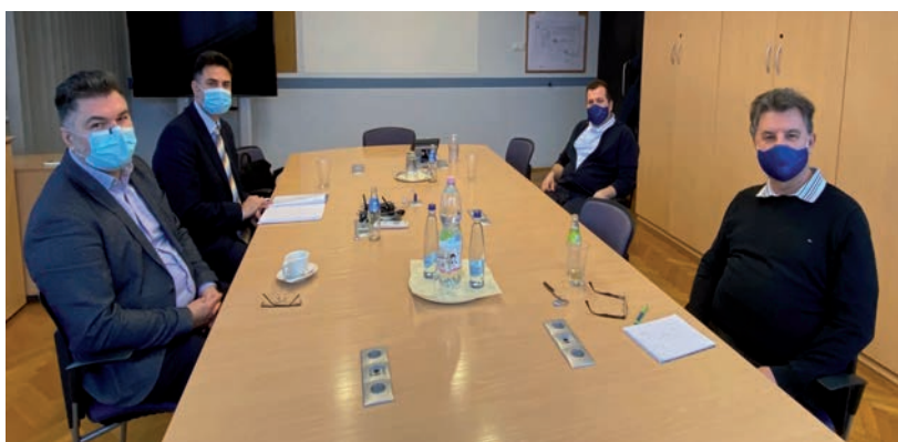
CÉGLÁTOGATÁSON VETT RÉSZT A POLGÁRMESTER