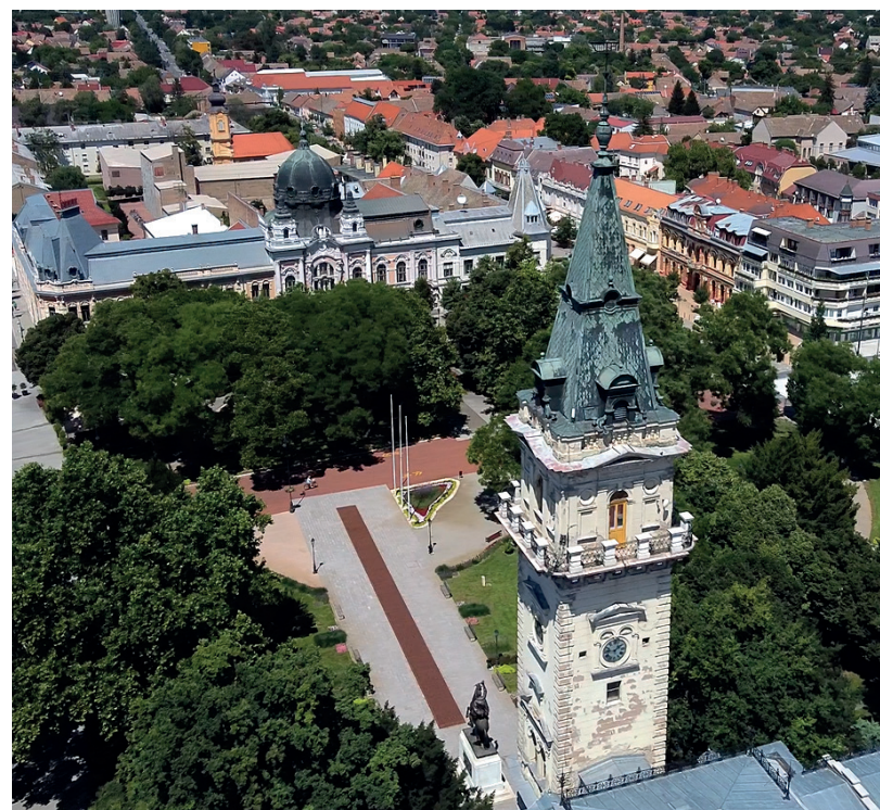
A KOMPENZÁCIÓK HIÁNYA MIATT BIZONYTALAN A JÖVŐ ÉVI KÖLTSÉGVETÉS