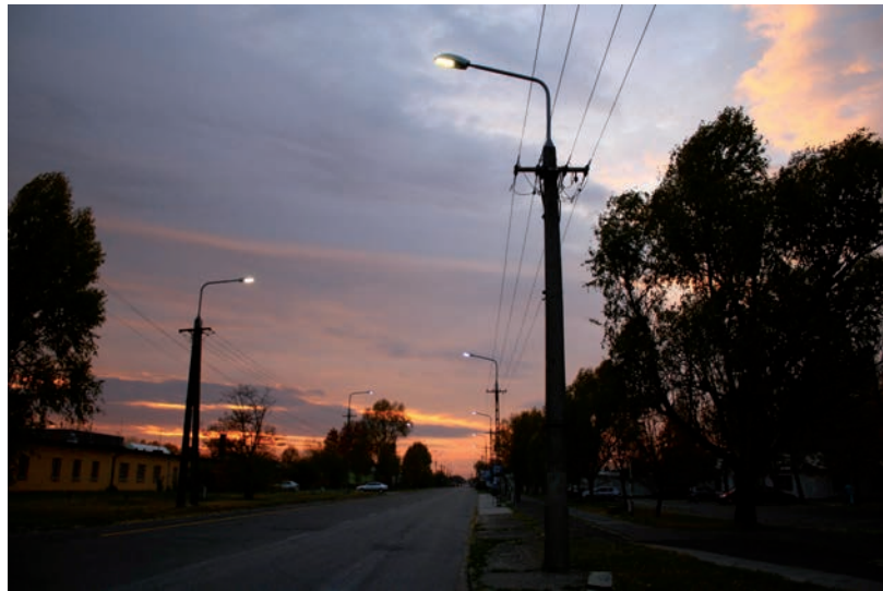
EGY 2011-ES SZERZŐDÉSFELMONDÁS MIATT PERELTE BE AZ ÖNKORMÁNYZATOT EGY CÉG

2011-ben a szerződést azonnali hatállyal az önkormányzat felmondta. Ennek oka, hogy új szereplő érkezett és a városvezetés új üzletet kötött Hódmezővásárhely közvilágításának korszerűsítésére az ES Holding Zrt-vel 721 millió forint értékben. Ez ismertebb nevén az Elios, Tiborcz István cége volt. Szabó tájékoztatása szerint a Zöld F. Kft. és utóda, a KÖZVIL Zrt. jogos követelését nem kapta meg, perre ment és több éves pereskedés után most Lázár János jogszerűtlen szerződésmegmondása következtében Hódmezővásárhely városának azonnali hatállyal meg kell fizetnie: tőketartozásként: 21,4 millió forintot, perköltséggé (eljárás illeték, ügyvédi munkadíj): 2,3 millió forintot, késedelmi kamatként: 22,3 millió forintot. Tárgyalásokkal sikerült elérni, hogy a 4,6 millió forint felét fizessék ki most, a másik felét pedig csak egy év múlva és erre már nem kell további kamatot sem fizetni, ami 4 millió