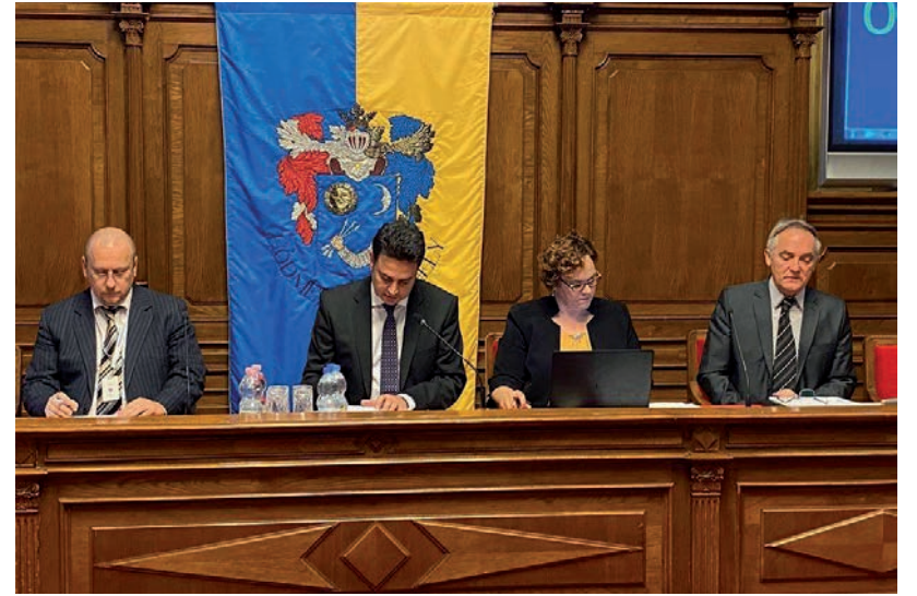
FEBRUÁR 15-IG KELL A KÖLTSÉGVETÉST MEGALKOTNI

A polgármester szerint Cseri Tamásnak és Benkő Zsoltnak nem öt kellene valótlanosságokkal támadnia, hanem a térség országgyűlési képviselőjénél, Lázár Jánosnál elérni, hogy a kormány nyújtson kompenzációt Hódmezővásárhely felé is. Cseri Tamás és Benkő Zsolt a sajtótájékoztatón magas fizetéseket, tanácsadói szerződést is említettek. Erre Márki-Zay elmondta, nem erre, hanem a korábbi városvezetésre volt jellemző a pazarló gazdálkodás, amikor a város javaiból egy szűk réteg részesült csak. Jelenleg, ismételte, valamennyi beszállítónak tudnak fizetni. Példákat is hozott a polgármester a korábbi pazarló gazdálkodásra: