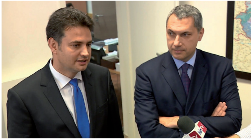
NEM SOK ILYEN KÖZÖS KÉPET LEHET LÁTNI A JELENLEGI ORSZÁGGYŰLÉSI KÉPVISELŐVEL ÉS A POLGÁRMESTERREL