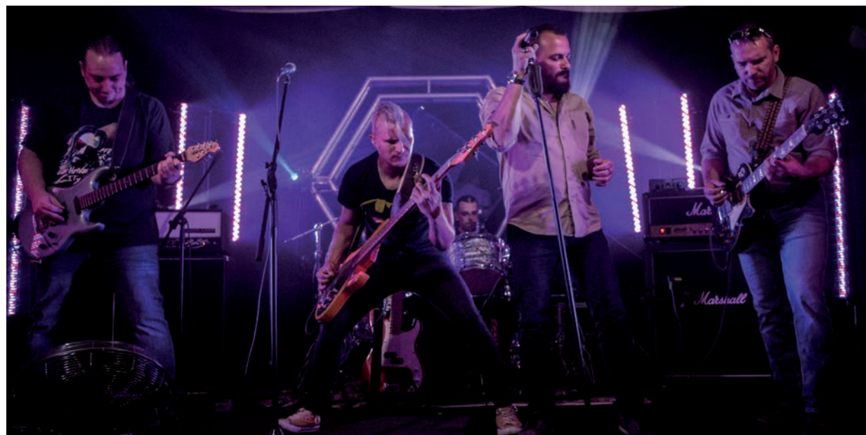
KÜLÖNLLEGES BÚCSÚKONCERTRE KÉSZÜLNEK

A zenekar a búcsúkoncertig sem hagyja magára közönségét. A Végletek 20 éves évfordulóján készült akusztikus koncertanyagot már feltöltötték a legnagyobb videó megosztó portálra. ■