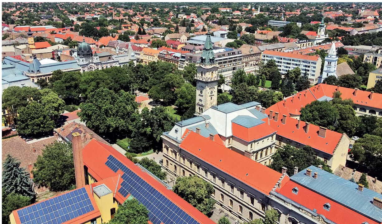
A PROJEKTEK ELŐKÉSZÍTÉSÉIG ELJUTOTT A VÁROS, A KIVITELEZÉSRE NEM JÖTT MÉG PÉNZ

A Gimnázium közbeszerzési eljárását 2019 decemberében indították újra, de 2020-ban le kellett állítani, mert a kormány határozatát nem