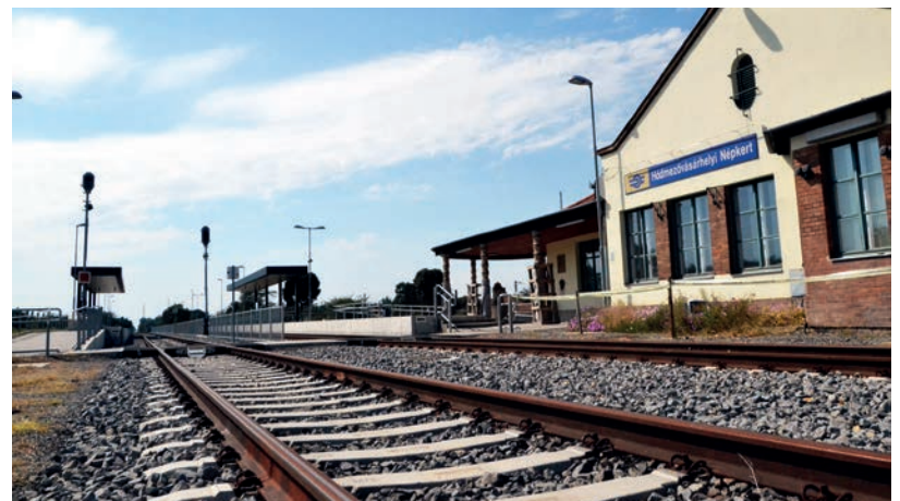
2018 ÁPRILISÁTÓL SZÜNETELT A VONATKÖZLEKEDÉS A KÉT MEGYEI JOGÚ VÁROS KÖZÖTT

fektettek le síneket, ahol a vasút- zem megkövetelte, ott második vágány is épült. Ágyazat- és terep- rendezési munkákat is végeztek, szabályozták a váltókat és a vágány- nyokat, jelenleg pedig folyamatban van még a biztosítóberendezés kiépítésének befejező fázisa. Ez a pályaszakasz 100 km/h-ás megengedett sebességre lesz alkalmas a szükséges hatósági eljárások lefolytatása után – közölte a társaság. ■