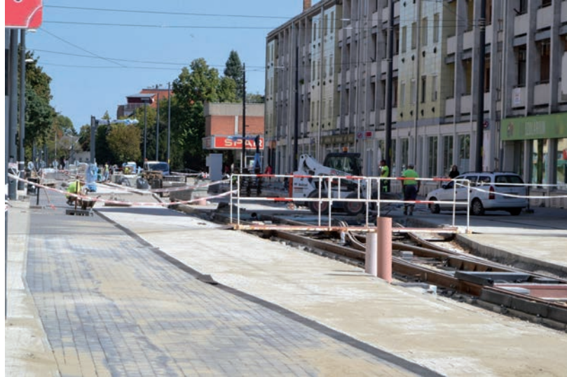
KÁOSZ MÁR NINCS, DRÁGULÁS MÉG VAN

Az összesen 746,5 millió forintos vállalkozói díjnövekedés több tételből adódott össze. Az indoklás szerint például a kakasszéki csatorna kiváltása a közműszolgáltató feladata, aki nem vállalta a munkát, így azt a vállalkozó végezte el. A másik, hogy megrendelő számára nem volt minden tekintetben ismert az