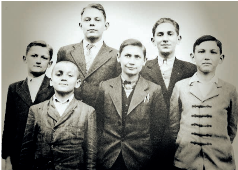
A CSERESNYÉS KOLLÉGIUM (TANYAI TANULÓK OTTHONA) ELSŐ 6 DIÁKJA 1938-BAN

A könyv hitelességét elsősorban a személyes visszaemlékezések hosszú sora és a hozzájuk kapcsolódó korabeli fényképek adják. A lexikonszerű, mintegy 600 oldalas kiadvány hamarosan kikerül a nyomdából és már csak arra vár, hogy bemutassák a nagyközönségnek. A tervek szerint erre várhatóan május közepén, a Református Ótemplomban kerül majd sor. ■