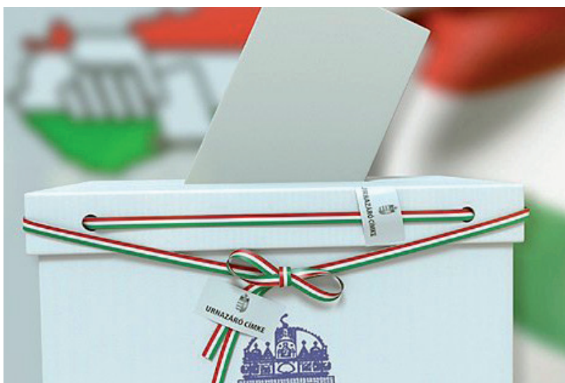
IZGALMAS LEHET A 2022-ES VÁLASZTÁS A CSONGRÁD-CSANÁD MEGYEI 4-ES VÁLASZTÓKERÜLETBEN IS