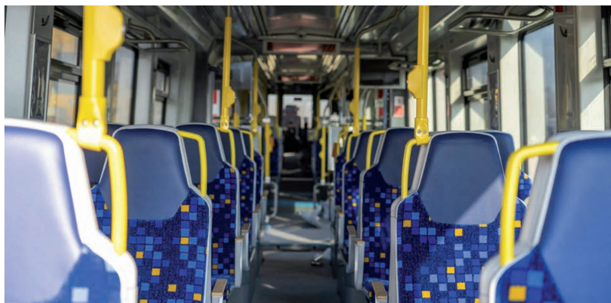
KÉNYELMES LESZ A TRAM-TRAINNEL UTAZNI, DE VAJON ÁTÜLNEK AZ AUTÓSOK?

A tram-train járatok két végállomás – a vásárhelyi vasútállomás és a szegedi nagyállomás – közötti menetideje tervezetten 42 perc, a két belváros között pedig 32 perc lesz. A vasút-villamos mellett, a felújított 135. sz. vasútvonal adottságait kihasználva, a megmaradó Szeged – Békéscsaba személyvonatok menetideje tervezetten 7 perccel fog csökkenni. ■