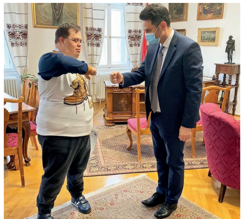
A JÁRVÁNYHELYZETHEZ ÉS A SPORTÁGHOZ IS ILLIK AZ ÜDVÖZLÉS