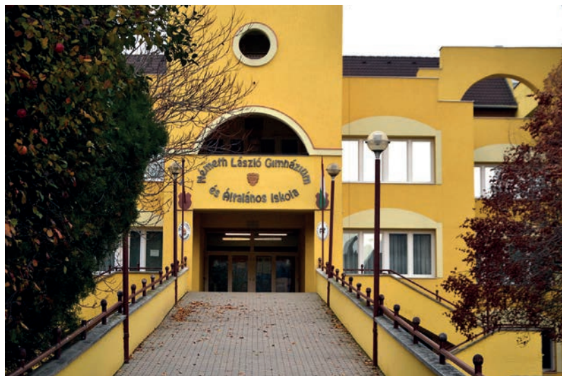
SIKERES KÖZBESZERZÉS UTÁN A KORMÁNY NEM ADTA KI A TÁMOGATÓ OKIRATOT

Vásárhely együttműködne, a kormánybiztos „kommunikál”