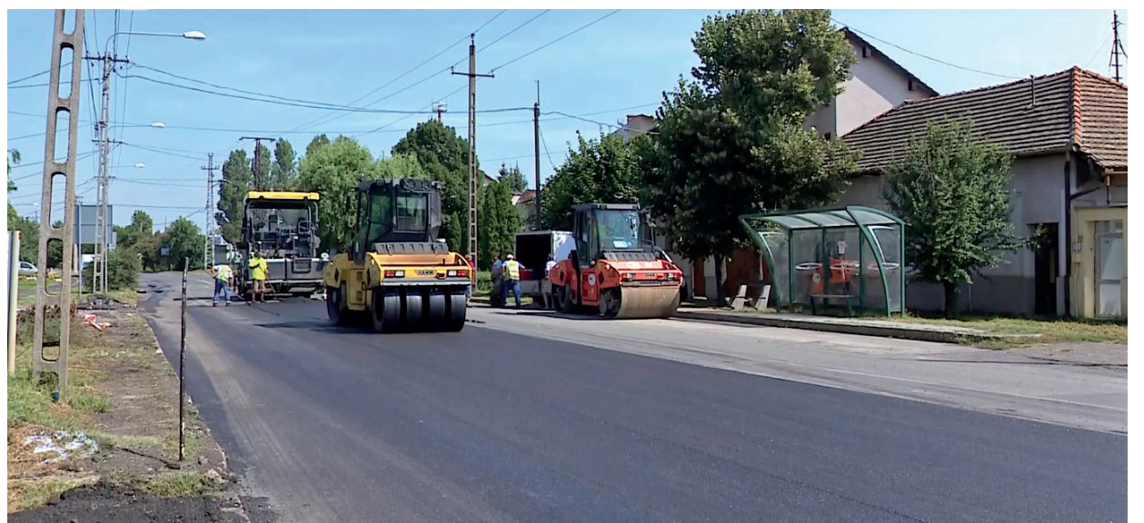
CSAK A KÖTELEZŐ FELADATOK MARADNÁNAK?