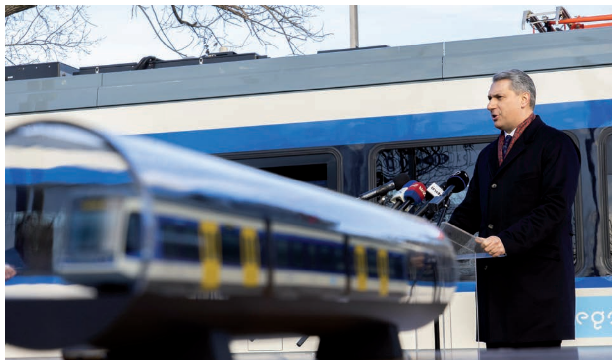
A JÖVŐBE VISZ A VASÚT-VILLAMOS; FOTÓ: BUDAY DÁNIEL/VÁSÁRHELYI MÉDIACENTRUM

Egy 15 éves álom vált valóra – mondta Szentesen Lázár János, a projekt kormánybiztosa. Nem volt könnyű a két város közönségét meggyőzni arról, hogy ez a kötőpályás vasút-villamos mindenki számára előnyt, egy új életet jelent. De Lázár János szerint a vásárhelyiek megfogták az isten lábát, és megkötötték az évszázad üzletét. A 80 milliárd forintos beruházás Lázár elmondása alapján a hódmezővásárhelyieknek nem került egy