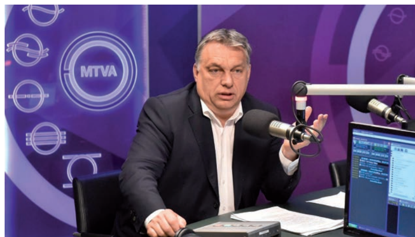
ORBÁN VIKTOR A KOSSUTH RÁDIÓBAN.

célzatú tervnek gondolják a miniszterelnök bejelentését. Egyikük például úgy vélte, mivel az ő generációjuk nem annyira kormánypárti, ezért a szavazóbázis kibővítésének tekinthető az intézkedés. Természetesen a megkérdezettek nem reprezentálják a teljes korosztályt. ■