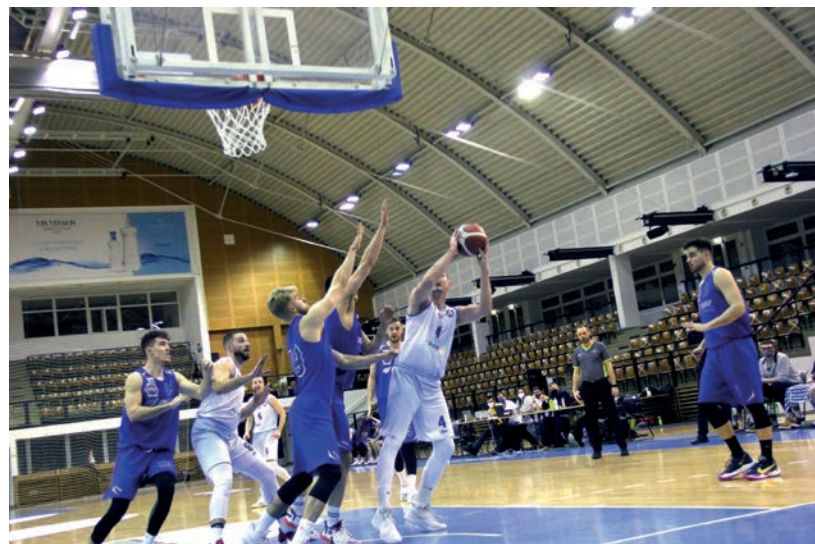
JÓL KEZDŐDÖTT AZ ÉV A VÁSÁRHELYI KOSÁRSULINAK

A bajnokságban azóta a Győr együttesét győzte le a Vásárhelyi Kosársuli 92-80 arányban, idegenben, és az NBI/B Zöld csoportjának 3. helyén állnak. ■