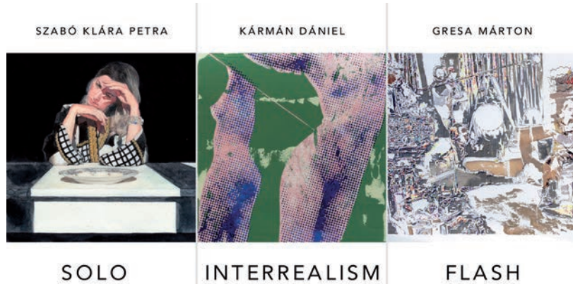
A HÁROM FIATAL ALKOTÓ ÖNÁLLÓ KIÁLLÍTÁSA AZ ONLINE TÉRBEN ÉRHETŐ EL