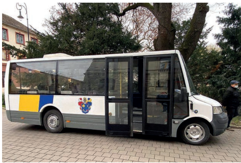
EDDIG 2 BUSZ ÉRKEZETT MEG A HELYIJÁRATOS FLOTTÁBÓL HÓDMEZŐVÁSÁRHELYRE