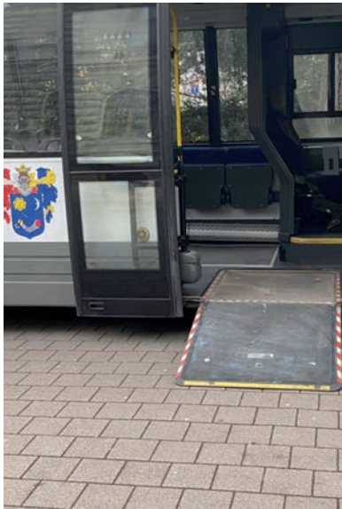
REMÉLJÜK SOKAKNAK SEGÍTSÉG LESZ AZ ÚJ, HELYI KÖZLEKEDÉS