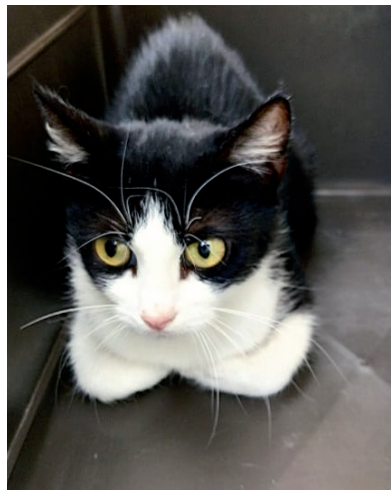
ŐT AZ EÖTVÖS ISKOLA UDVARÁRÓL VITTÉK ORVOSHOZ AZ ÁLLATVÉDŐK