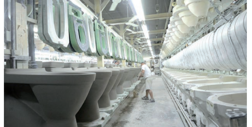
A BERUHÁZÁSOK CÉLJA A MUNKAFOYAMATOK AUTOMATIZÁLÁSA ÉS TERHELTSÉG CSÖKKENTÉSE IS

A szanitergyárban megvalósuló beruházások célja részben a munkaerő automatizálása, ezáltal a munkatársak fizikai terheltségének a csökkentése, részben pedig az egyre népszerűbbé váló új technoló-