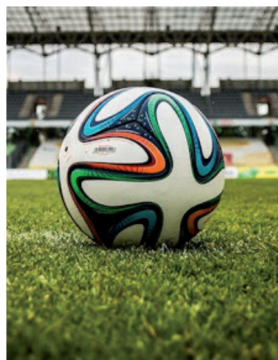
A 16 KÖZÉ JUTHAT A HFC

Ez lesz a HFC első 2021-es tétmeccse. A Puskás Akadémia nagyszerű formában van, a tabella első felében találhatóak rendszeresen, többek között döntetlent játszottak a listavezető és címvédő Ferencvárossal is. A kupamérkőzés győztese a Magyar Kupa legjobb 16 csapata közé jut. ■