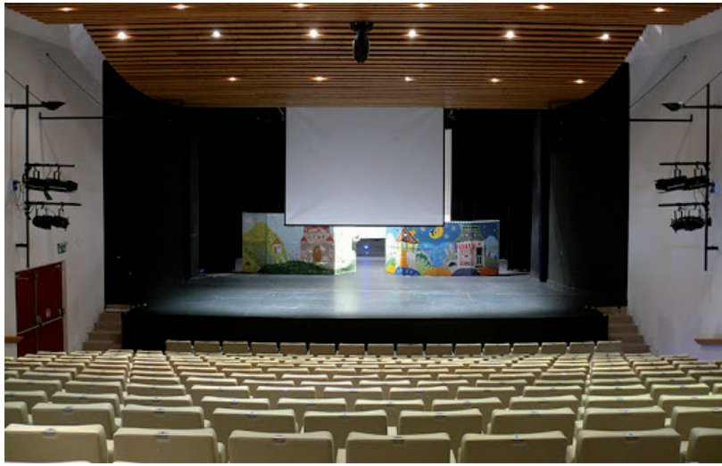
NÉZŐK HÍJÁN IS LESZNEK ESEMÉNYEK A BESSENYEIBEN