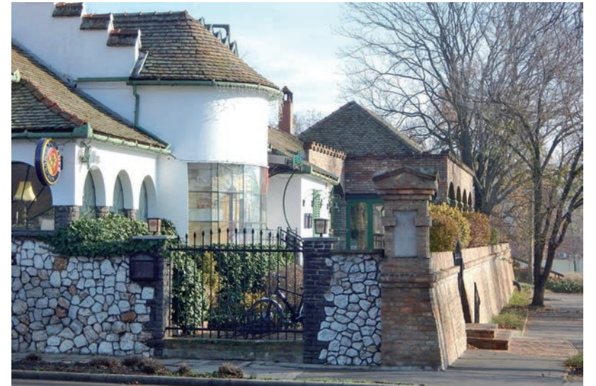
A NÉPSZERŰ VENDÉGLÁTÓHELY BŐVÍTÉSÉT, ESZKÖZPARKJÁNAK MEGÚJULÁSÁT ÉS ENERGETIKAI KORSZERŰSÍTÉSÉT TERVEZIK

A Bodrogi Bau Kft. 15,5 millió forint támogatást nyert a Papere kerti irodájának és vasszerelő csarnokának energetikai fejlesztésére. A támogatási arány itt 55 százalékos, a teljes beruházás értéke 28 millió forint. Ebből a fent említett épületek új hőszigetelést kapnak, továbbá kicserélik a lámpatesteket és a nyílászárókat. A szerződés szerint 2022 augusztusáig kell befejezni a munkákat. ■