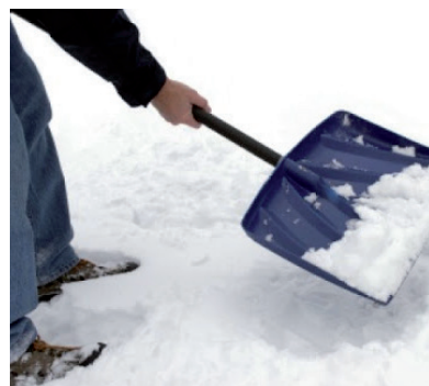
A NYÁRI FÜNYÍRÁS UTÁN MOST A HÓ-LAPÁTÁLÁSNAK VAN SZEZONJA