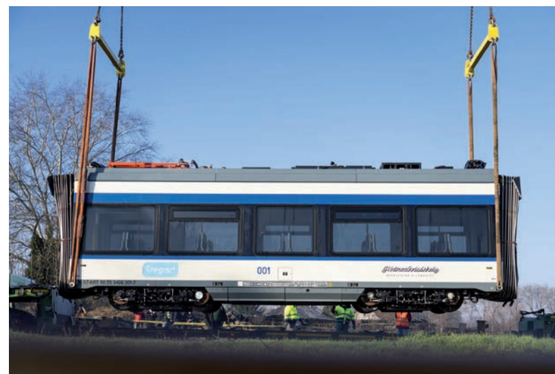
MÁR SZENTESEN VAN AZ ELSŐ SZERELVÉNY

ZÖLD PONT • Új pályázat a társasházak fűtőkorszerűsítésének támogatására