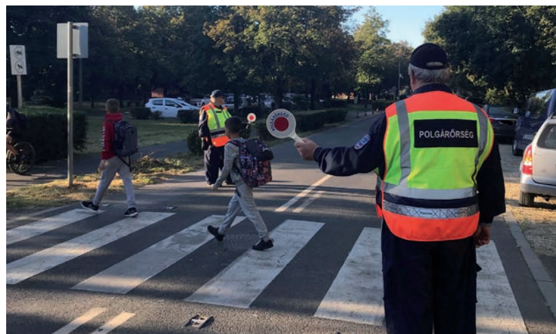
A HÓDMEZŐVÁSÁRHELYI POLGÁRŐR EGYESÜLET SZEPTEMBERBEN SEGÍTETTE AZ ISKOLÁBA IGYEKVŐ DIÁKOKAT.