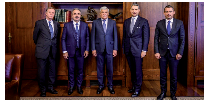
LÁZÁR JÁNOS A MAGYAR AGRÁR- ÉS ÉLETTUDOMÁNYI EGYETEM ALAPÍTVÁNYI KURÁTORIUMÁBAN.

Az új év sem indult rosszul a képviselő számára, ugyanis gödöllői Szent István Egyetem alapítványának kuratóriumába is bekerült, többek között az elnöki tisztséget is betöltő Csányi Sándorral és Nagy István agrárminiszterrel együtt. Az átalakítás új nevet is hozott az egyetemnek: Magyar Agrár- és Élettudományi Egyetemnek hívják innentől. Palkovics László innovációs és technológiai miniszter őket kérte föl, legyenek tagjai az egyetemet működtető alapítvány kuratóriumának.