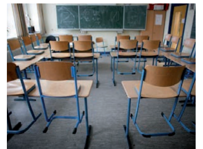
A KÖZÉPISKOLÁK PADSORAI FEBRUÁRIG MÉG BIZTOS ÜRESEN FOGNAK ÁLLNI

Megkezdődött az időszothonok lakóinak oltása is. A lakók 80 százaléka, az ott dolgozók 50 százaléka vállalta az oltást. Orbán mindenkit megnyugtatott, hogy az oltás biztonságos, a miniszterelnök is beoltatja magát, amikor sorra kerül. 80 ezer főre elegendő vakcina érkezett eddig.