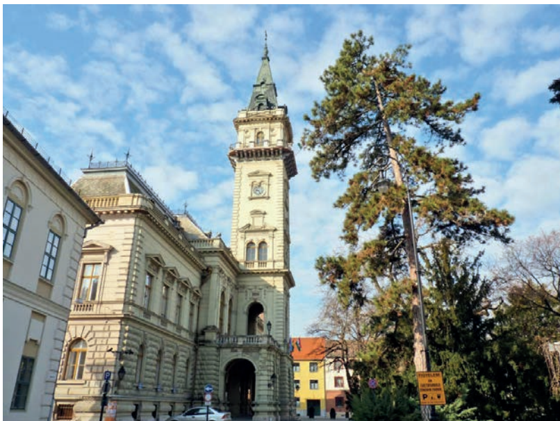
A TAVALYI 200 MILLIÓS ELVONÁS UTÁN IDÉN ÚJABB 600 MILLIÓT VESZ EL A KORMÁNY

„... jött a miniszterelnök úr és elvitte a kátyúzás árát” – mondta erre az intézkedésre Gödöllő polgármestere, a Magyar Önkormányzatok Szövetségének elnöke, Gémesi György. A kátyúzás elmaradásánál azonban sokkal nagyobbak ígérkeznek a veszteség, erről tanúskodik a MÖSZ nyilatkozata is: „A magyar önkormányzatiság kivégzését, számos magyar település elkerülhetetlen csődjét eredményezheti Orbán Viktor mindenféle érdemi egyeztetés nélkül tett bejelentése az iparúzési adó megfeleléséről. Ennek a bejelentésnek vajmi kevés köze a gazdasági válsághoz, sokkal több köze lehet a kormány