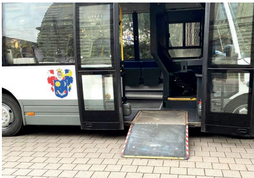
MÁRCIUS 1-TŐL INDULHATNAK A JOVÁNYBUSZ KFT. JÁRATAI

Az átláthatóbb menetrendű és nagyobb járatsűrűségű buszok várhatóan március 1-től indulnak el. ■