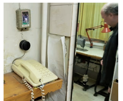
A SZABÓMESTER EGYKORI HÁZA A VÁSÁRHELYI FIATALOKÉRT KÖZALAPÍTVÁNYHOZ KERÜLT