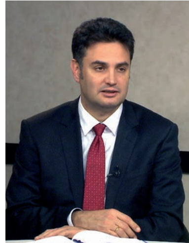
A KORMÁNY NEM TÁMOGATJA AZ ÖNKORMÁNYZATOKAT, MÉG BÜNTETI IS ELVONÁSOKKAL

ezer fő alatti települések esetében kompenzálja a kormány, de az annál nagyobb, többségükben ellenzéki