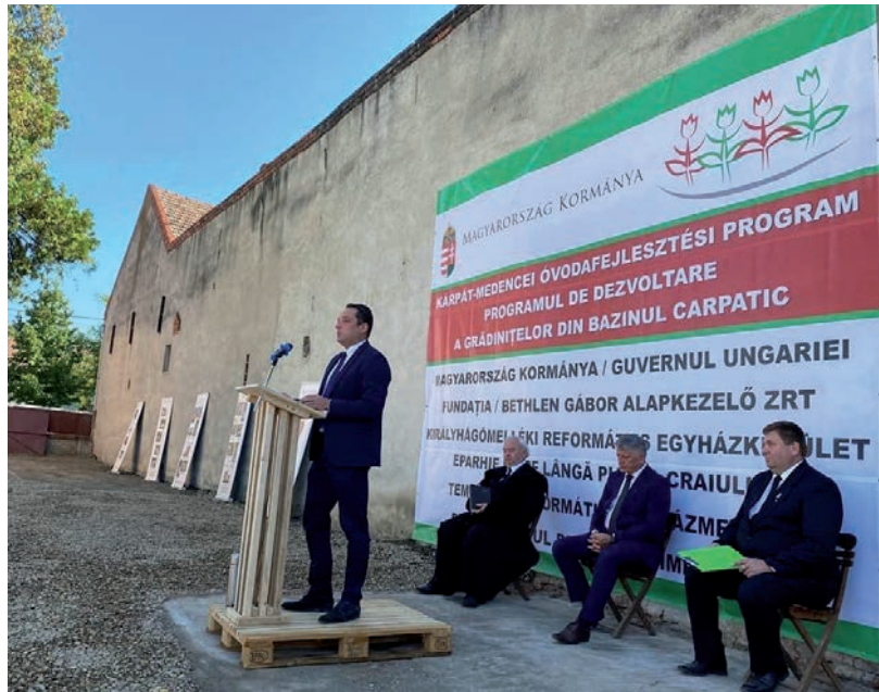
GREZSA ISTVÁN (KÖZÉPEN) ELLEN VÁLASZTÁSI BEAVATKOZÁS GYANÚJA MERÜLT FEL UKRAJNÁBAN

amelyek tiltják, hogy külföldi személy agitációt folytasson bármely ukrán politikai erő (ez esetben a Kárpátaljai Magyar Kulturális Szövetség, KMKSZ) mellett. A külügyi szóvivő szerint a beutazási tilalom kizárólag egy adott állampolgár bűncselekményre utaló cselekedteiről szól, „az elfogadott határozat nem érinti az államközi kapcsolatot”. ■