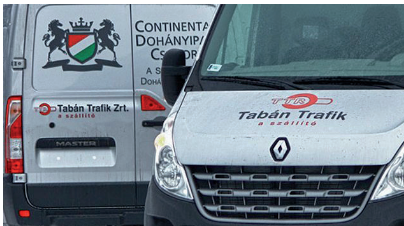
JÓ ÉVET ZÁRTAK A VÁSÁRHELYI VÁLLALKOZÓ CÉGEI