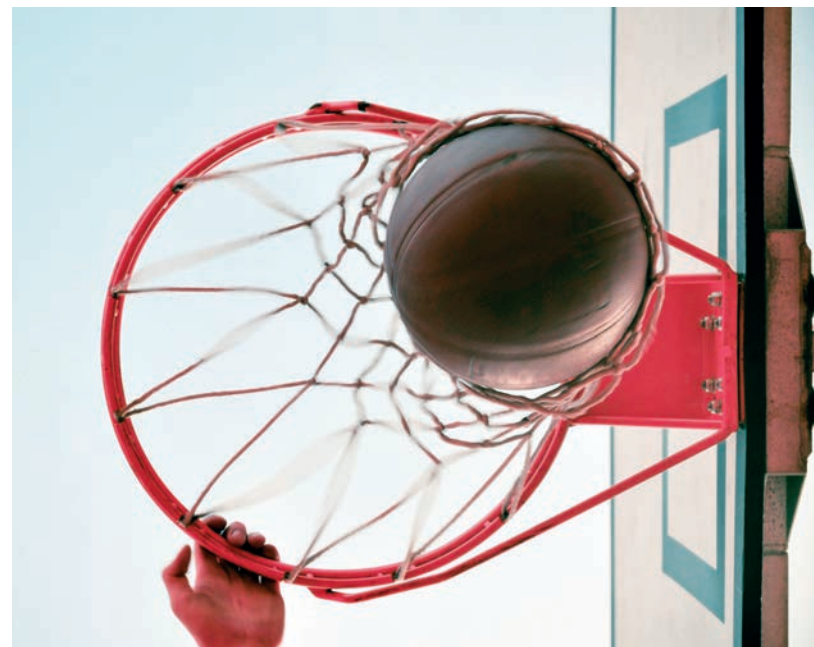
A SPORTOLÓK NYERHETNEK A LEGTÖBBET

Arra a kérdésünkre, hogy mikorra várható bírálati döntés az egyes felhívásoknál, elmondta, a döntések előkészítése folyamatosan zajlik, várhatóan december közepére ér véget az első szakasz elbírálása. Ez toldható, amennyiben a helyi bíráló bizottság a benyújtott anyagok kapcsán tisztázásra visszaküld egyes pályázatokat. Egyelőre nincs pozitívan elbírált pályázat, de a folyósítás a Pénzügyminisztériumból érkező támogatási okirat kiállítása után lehetséges csak, akkor is kizárólag egy 25 százalékos előleg keret mértékéig a pályázat utófinanszírozási mivoltából adódóan. ■