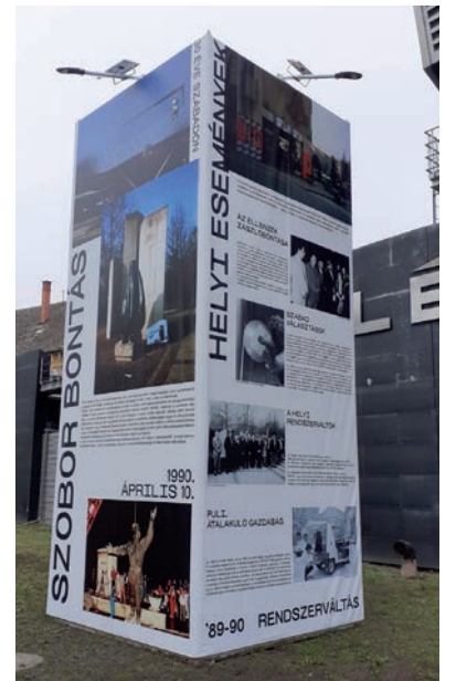
AZ EMLÉKPONTNÁL ÁLLÓ INSTALLÁCIÓ A 30 ÉVVEL EZELŐTTI RENDSZERVÁLTÁS ESEMÉNYEIT IDÉZI

percube installáció a hónap végéig megfelelő távolságtartással megtekinthető. ■