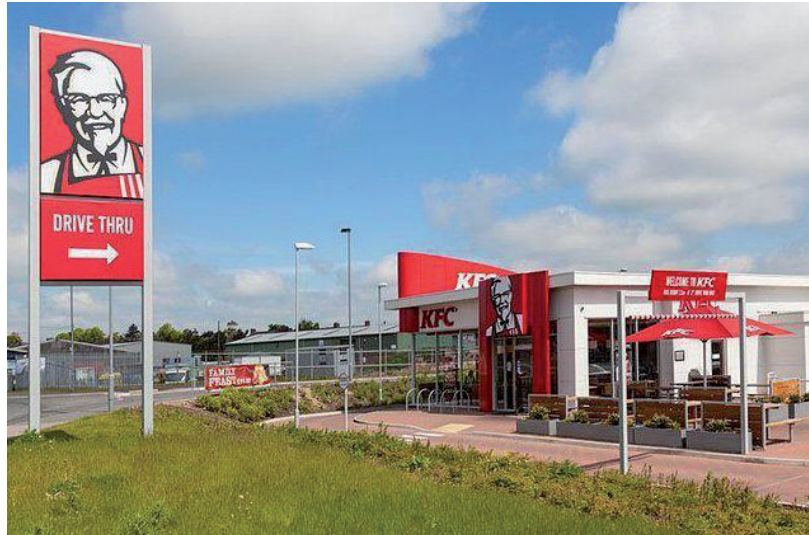
JÖN, JÖN, JÖN A KFC

Ahogy arról beszámoltunk, KFC Drive Thru éttermet létesítenének a Kaszap utcában. Hivatalos levelezési címén kerestük a Family Centert is tulajdonló, engedélykérő Bluebonnet Kft-t, de cikkünk megjelenéséig