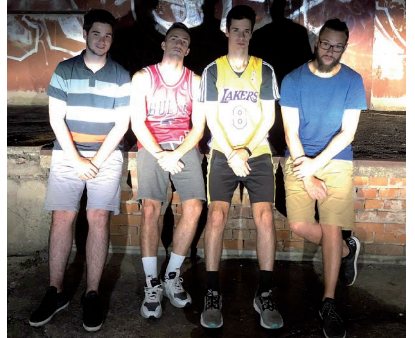
A FIATALOK NAGYSZERŰ KLIPPET FORGATTAK