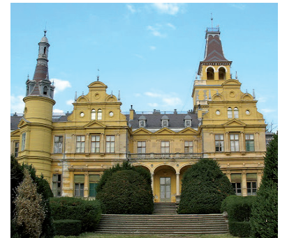
SZABADKÍGYÓS POLGÁRMESTERE IS A SAJTÓBÓL ÉRTESETÜLT

19-ben a kiadások háromszorosára folyt be a kastély turisztikai hasznosításából. Mindemellett munkahelyeket és a településnek bevételt is jelentene, ha az önkormányzat visszakaphatná a felújítás kezdetekor megszüntetett kezelési jogukat. Balogh levelet írt és kéri a település országgyűlési képviselőjének, Herczeg Tamásnak (Fidesz-KDNP) a segítségét és közbenjárását. A javaslatot még a gazdasági bizottság is megtárgyalja, ezután kerül a parlament elé, vélhetően még a jövő héten, tehát még nem dől el végérvényesen a kastély sorsa. ■