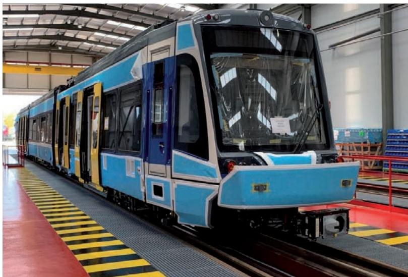
EREDETELEG 20 MILLIÁRDRA BECSÜLTÉK AZ ÖSSZKÖLTSÉGEKET

Szegeden 4 milliárd forintból járműtelep épül, kivitelező a Homlok Építő Zrt., Hódmezővásárhely és Szeged közötti vasúti pálya korszerűsítése és helyenként párhuzamosra bővítése, ennek költsége 24,2 milliárd forint, kivitelezője a Swietelsky. Hódmezővásárhelyen a Strabag a kiegészítő költségekkel együtt 11,5 milliárd forintért 3200 méteres villamospályát épít öt megállóval. A Stadler pedig nyolc darab, 202 fős, kerékpár szállításra is alkalmas villamoskocsit épít, amelyek együttes ára 17,6 milliárd forint. Nyáron jelent meg a Magyar Közlönyben, hogy a MÁV Start Zrt. 12 668 431 eurót, azaz közel 9 milliárd forintot kap a további négy vonat beszerzésére. ■