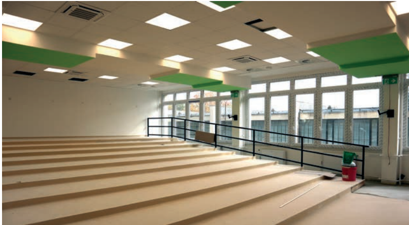
200 MILLIÓ FORINTOS FEJLESZTÉS

A fejlesztések összköltsége eléri a 200 millió forintot, amely európai uniós pályázatokból, saját és külső támogatás igénybevételével valósul meg. Ilyen léptékű beruházás a vásárhelyi campus életében az elmúlt 20 évben nem történt. Az iskola azt reméli a korszerűsítéstől, hogy javulnak a dolgozók munkakörülményei és nő a hallgatók elégedettsége. A fő előadóteremben például csak a belső kialakítás marad, minden más megváltozik. A 120 fő befogadására képes helyiség mostantól a 21. század követelményeinek is megfelel. A műszaki átadás már megtörtént, viszont a diákok csak várhatóan a következő félévben vehetik birtokba.