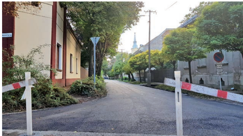
ÖSSZESEN 21 EZER NÉGYZETMÉTER ÚT ÚJULT MEG

A Bajcsy-Zsilinszky Endre utca páros oldalán teljes hosszban és szélességben felújították a járdát, a páratlan oldalán részleges felújítás, aszfaltozás történt. Az Andrássy út 10. számnál a térközburkolatot kiegészítették a lépcsőig, valamint több helyen és szakaszosan felújították a járdát. Járda épült még a Kálvin téren az Antikvárium előtti szakaszon, illetve megerősítették a Kakasszéki csatornát. ■