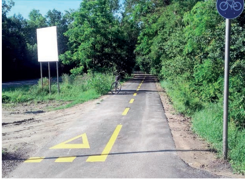
A PROJEKT A MODERN VÁROSOK PROGRAM KERETÉBEN VALÓSUL MEG