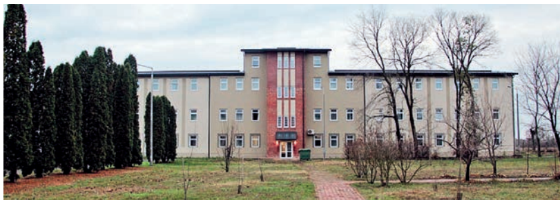
EZ A PROJEKT IS A MODERN VÁROSOK PROGRAM KERETÉBEN VALÓSUL MAJD MEG

Arra is kíváncsiak voltunk, mennyi tanulóval, illetve kollégiumi férőhellyel terveznek. Érdeklődésünkre közölték: a honvéd középiskola és kollégium tervezett létszáma évfolyamonként 50 fő. A kollégium 270 főre van tervezve, mivel a szakképző osztályok esetében már 5 éves a képzés időtartama. A jelenlegi elképzelések szerint az oktatás 2024 szeptember 1-én indul Hódmezővásárhelyen. ■