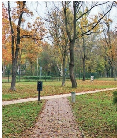
A KEMPING JÖVŐ NYÁRON MÁR VÁRNI FOGJA A NYARALÓKAT

művesített övezetet alakítanak ki, amely a tervek szerint már a 2021-es szezonban fogadhatja a kempingezőket. ■