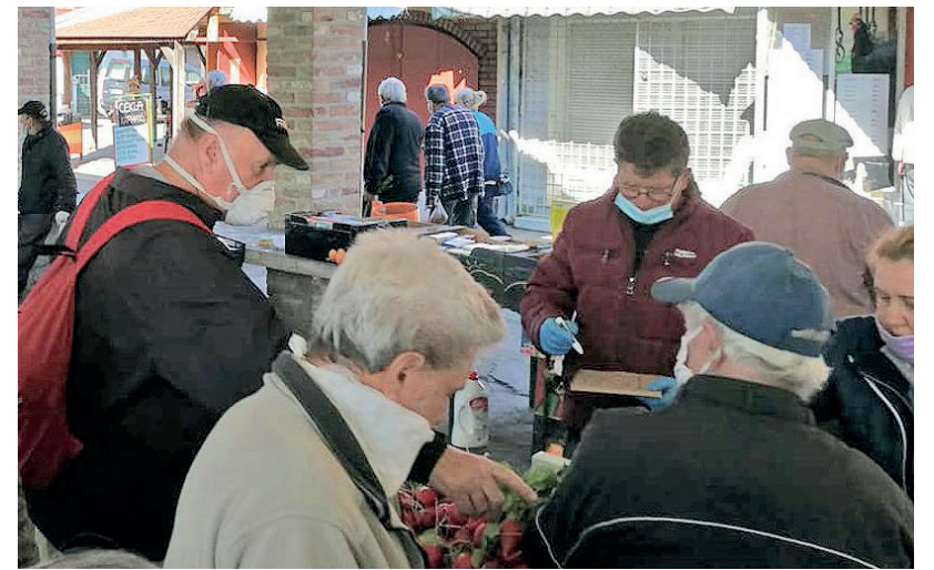
TARTSUNK BE MINDEN ÖVINTÉZKEDÉST!

Ezt követően fordult a város oktatási és alapellátó egészségügyi szolgáltatóihoz önkéntes adatszolgáltatásért. Egy hónapja heti rendszerességgel kap a város járványügyi helyzetét reprezentáló adatokat, melyekről a hodpress.hu-n lehet olvasni. ■