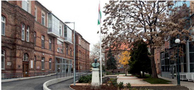
OLVASÓINK JELEZTÉK, HOGY PÉLDÁUL CITOLÓGIAI ESZKÖZÖK HIÁNYOZNAK

A tartozásállományból 41,6 milliárd forint az egészségügyi intézményeknél halmozódott fel – beleértve a járó- és fekvőbeteg szakellátás intézményeit, az egészségügyi ágazati háttérintézményeket, valamint a klinikai központtal rendelkező felsőoktatási intézményeket. ■