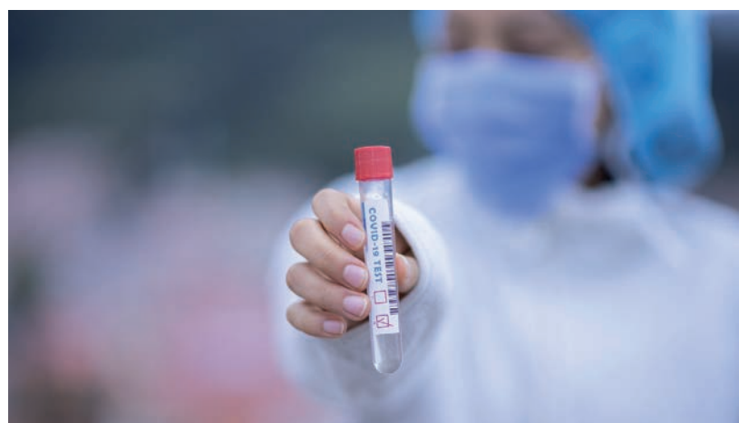
KEVÉS A TESZT ÉS VÉGTELENÜL LASSÚ A TESZTELÉS