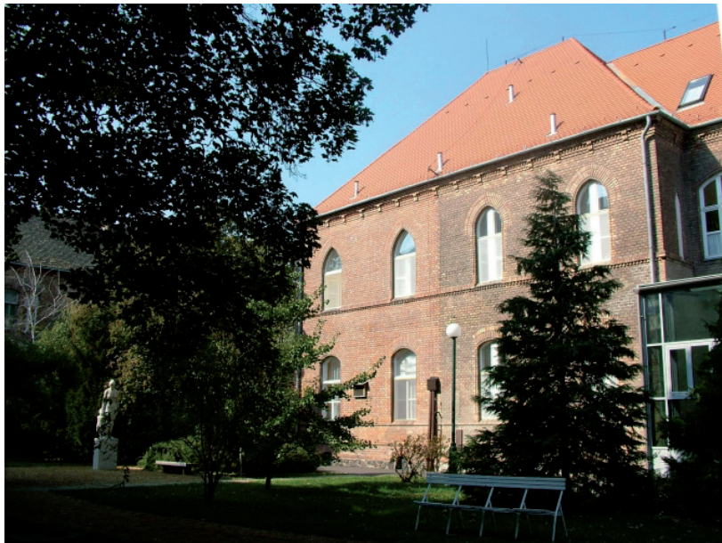
NEM TÁJÉKOZTATJÁK A HOZZÁTARTOZÓKAT A VÁSÁRHELYI KÓRHÁZBAN

Kerestük a Csongrád-Csanád megyei Betegellátó Központ- hódmezővásárhelyi tagintézményét e-mailben, hogy miként tájékoztatják a hozzátartozókat, de nem kaptunk választ. ■