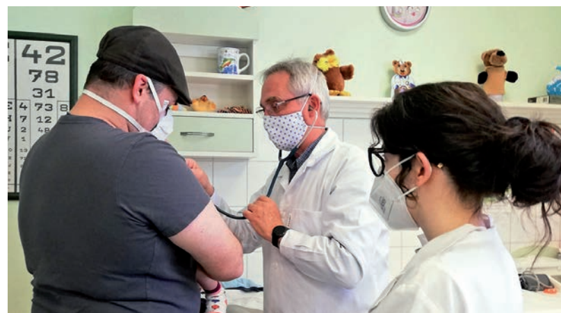
BERÉNYI DOKTOR SZERINT A MEGELŐZÉS A LEGFONTOSABB, KÜLÖNÖSEN MOST

VÍRUSHELYZET • Központi intézkedésekre van szükség