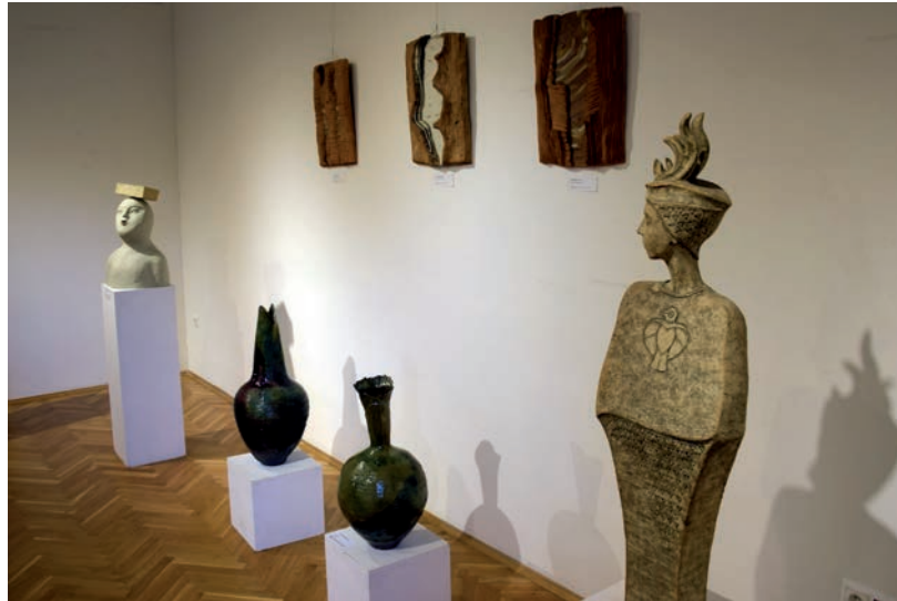
A KIÁLLÍTÁS DECEMBER KÖZEPÉIG LÁTOGATHATÓ