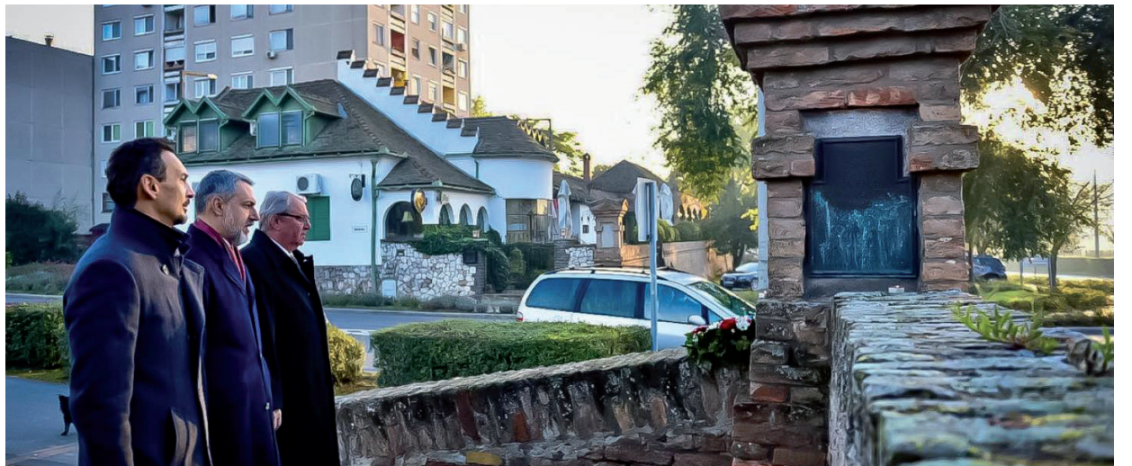
NEM CSATLAKOZOTT MOST SEM A VÁROSI ÜNNEPSÉGHEZ.

velünk tart: vigyáz mások egészségére, de otthon is ünnepel. Mesél a gyerekeknek, megtanítja a következő nemzedéknek, hogy mi október 23-a, nem pedig november 4-e országa vagyunk.” ■