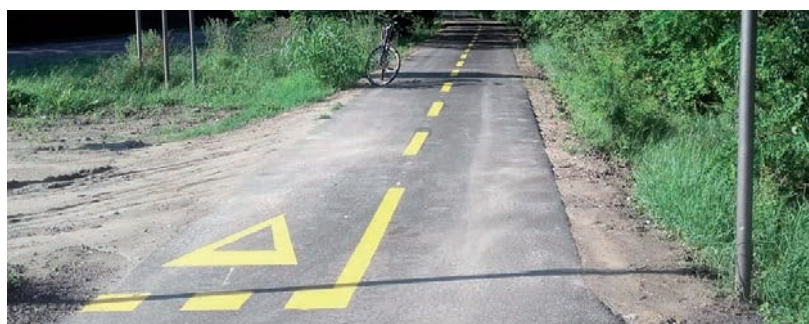
DEREKEGYHÁZ ÉS SZEGVÁR IS ELÉRHETŐ LENNE KERÉKPÁRRAL

November 16-ig jelentkezhetnek szakértő vállalkozások három új vásárhelyi külterületi kerékpárút-szakasz tervezésének és engedélyezésének előkészítésére – derül ki az uniós közbeszerzési értesítőtől. Mindhárom esetben 2x1 haladósáv