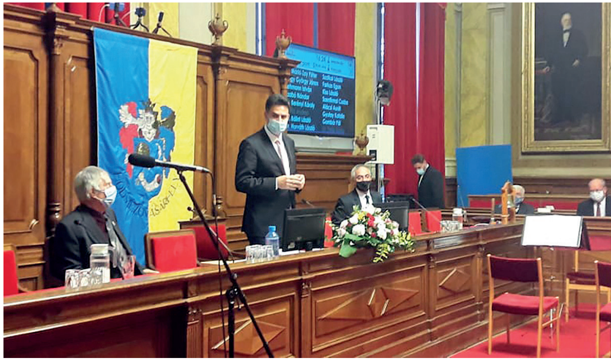
TÖRTÉNELMI JELENTŐSÉGŰ AZ EMLÉKEZÉS.