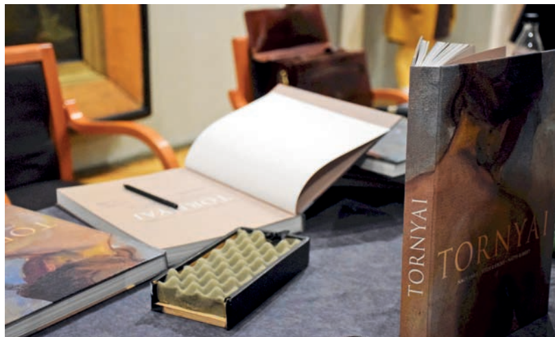
A TORNYAI CÍMŰ KÖNYV A VÁSÁRHELYI MÚZEUM ÉS AZ ALFÖLDI GALÉRIA PÉNZTÁRÁBAN VÁSÁROLHATÓ MEG 4000 FORINTOS ÁRON.

A kötet szerzői együttesen vallják: a Tornyai életmű – műveinek számát két-háromszáz alkotásra teszik – ma is aktuális és a saját korában is modernnek számító festészete számos újabb kutatási kérdést vet fel a művészettörténészeknek, így várhatóak még a jövőben is Tornyai Jánosról és kortársairól szóló tanulmányok, kiadványok. ■