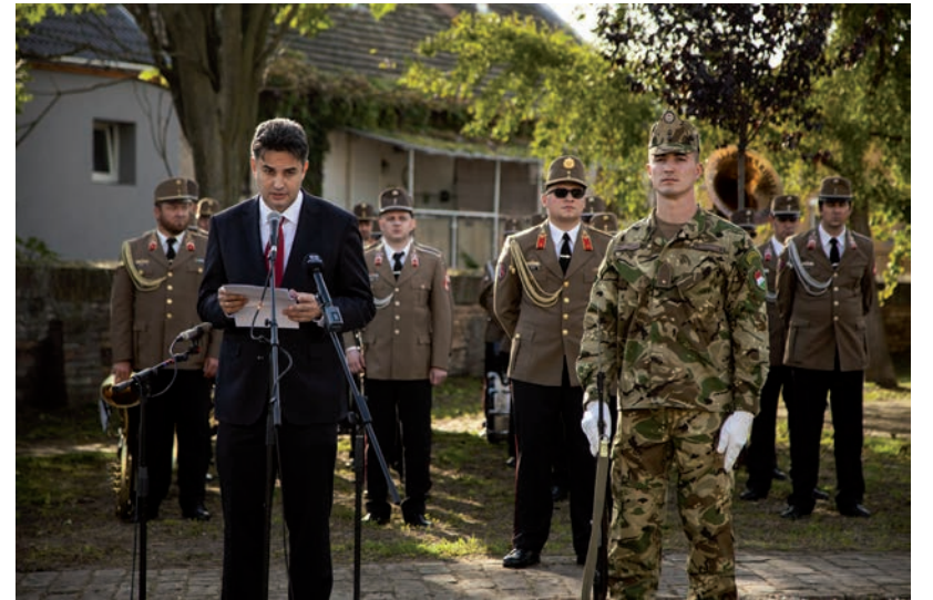
MÁRKI-ZAY PÉTER POLGÁRMESTER ÜNNEPI BESZÉDÉT FACEBOOK-OLDALÁN OLVASHATJÁK.

Am ezek az események nem értek véget október 23-án, sőt még november 4-én sem. Az akkori követé-