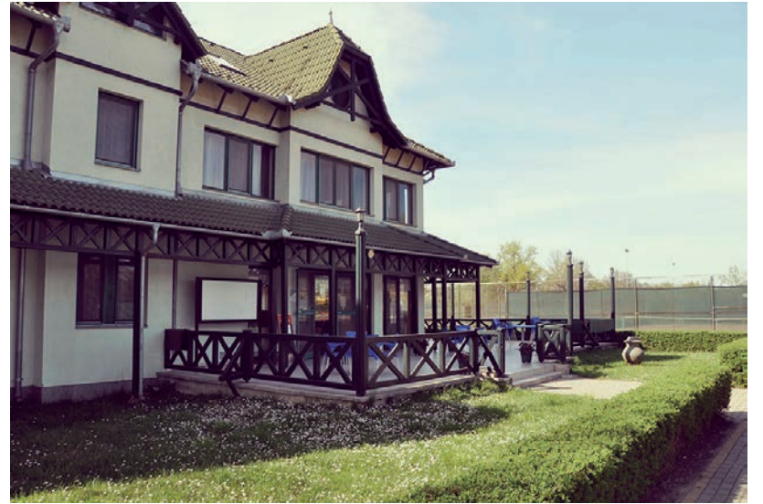
EGY LEHETSÉGES HELYSZÍN A GYEREKEK OKTATÁSÁRA A VÁSÁRHELYI TENISZ CLUB.

Egyrészt az infrastrukturális háttér miatt, hiszen 2 db latex keményborítású, a nemzetközi követelményeknek megfelelő fedett tenispályával rendelkezik a helyi teniszcentrum. Ezek automata gázfűtésűek és egy 200 fős lelátó tartozik hozzájuk. Illetve ezen felül 8 sálakos pályán lehet üzni a sportágat. A másik ok a tenisz helyi tradíciója. Tudniillik a világhírű Novak Djokovic is versenyzett itt annak idején, továbbá számos, nemzetközileg