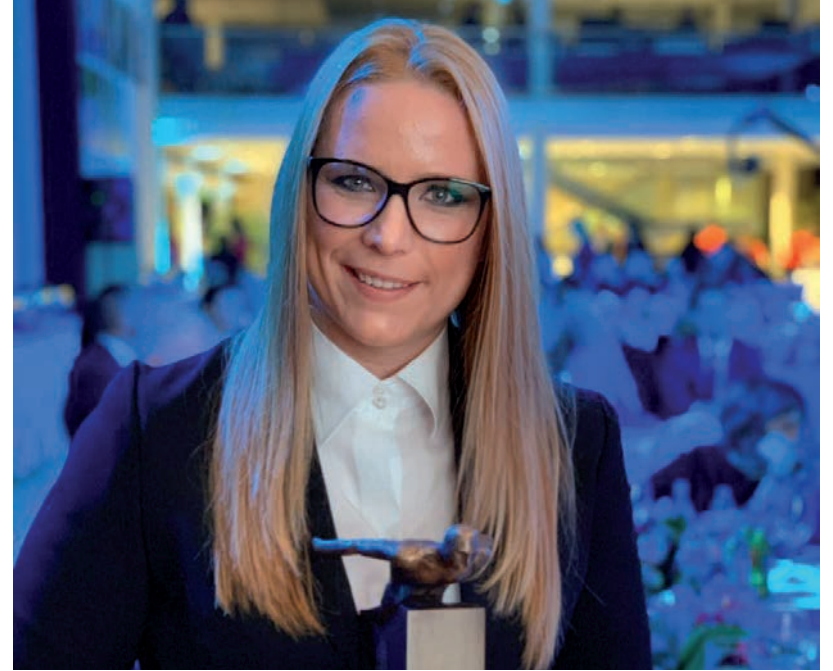
RISZTOV ÉVA ELNÖKSÉGI TAG LETT.