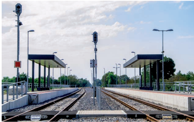
HIÁNYZIK A „DÍJAZÁS NÉLKÜL” KIFEJEZÉS A MOSTANI KORMÁNYHATÁROZATBÓL

hajtását, valamint koordinálja a regionális jelentőségű, határon átnyúló, Szeged-Szabadka-Baja vonal kialakítását. A kormánybiztos tevékenységét a feladatköre szerint illetékes politikai felsővezetőkkel és szakmai felsővezetőkkel, valamint a Csongrád-Csanád Megyei Kormányhivatallal szoros együttműködésben látja el. ■