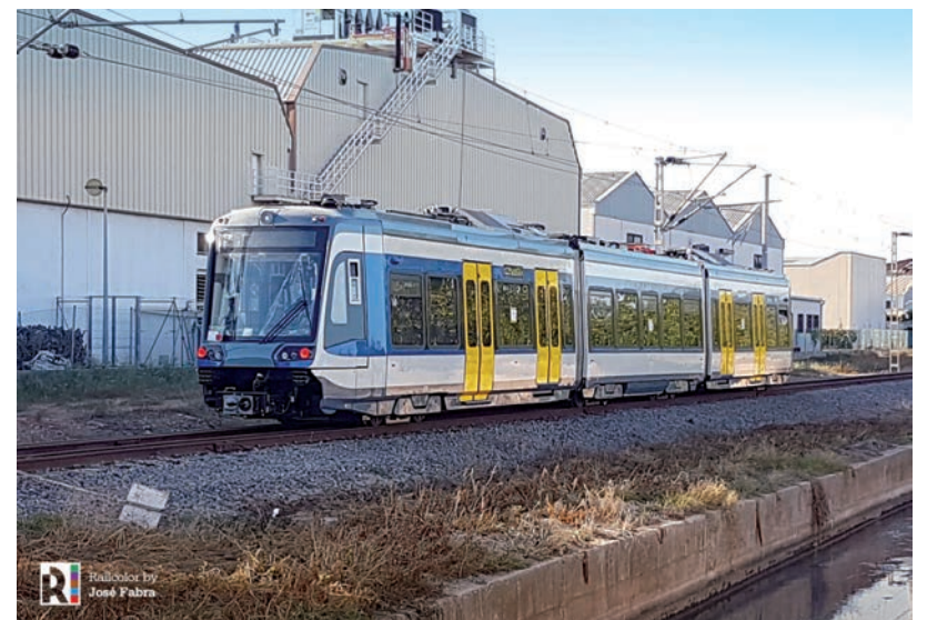
A SZAKPORTÁL CIKKE SZERINT EZ A VÁSÁRHELYI SZERELVÉNY.

A szakportál azt írja, a tesztek után az első 8 jármű 2021 őszén áll munkába, a fennmaradó egységeknek pedig 2022 nyarára kell megérkezniük Magyarországra. ■