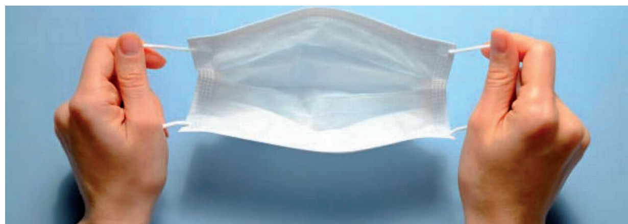
A MASZKHASZNÁLATTAL KÖRNYEZETÜNKET, A KÉZFERTŐTLENÍTÉSSEL MAGUNKAT IS VÉDJÜK