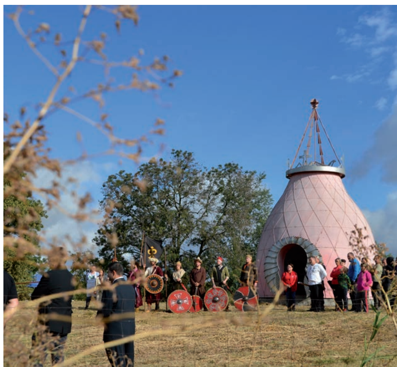
HAGYOMÁNYŐRZŐK GYŰLTEK ÖSSZE A KUN SÜVEG KÖRÜL

A hagyományőrző találkozón időszak is szép számmal képviseltették magukat. Az új a kunok fő fegyvere volt, de vesztüket is ez okozta: az esőben felázott íjak miatt nem tudták szokásos harcmódorukat használni, ez pedig eldöntötte a csata kimenetelét, és meghozta a magyarok győzelmét. ■