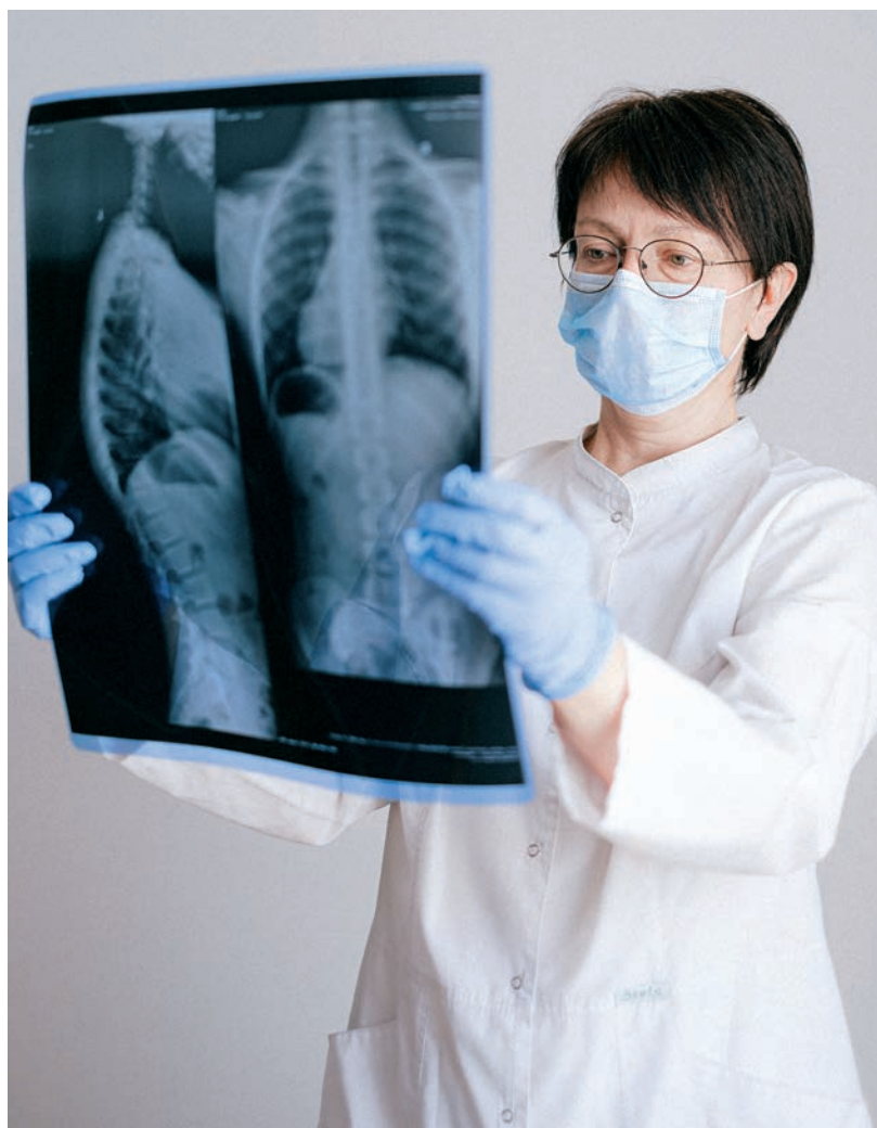
AZ ORSZÁGGYŰLÉS ELÉ MÁR NEM AZ EREDETI MOK JAVASLAT KERÜLT

A MOK szerint az alapítványoknál és magánszolgáltatóknál dolgozóakra is ki kellene terjeszteni a tervezetet. A másodállás korlátozását a MOK elvben támogatja, ugyanakkor annak pontos kidolgozását és differenciálását szükségesnek tartja, ez azonban jelenleg nem történt még meg. A kamara nehezményezi, hogy a tervezet elvileg lehetőséget ad az általuk javasolt alapbértől lefelé (igaz, felfelé is) eltérni, szerintük a tervezetben szereplő megoldás elfogadhatatlan: "A MOK egyetért a differenciálás lehetőségével, de miután Miniszterelnök úr a MOK bértábláját, mint alapbért fogadta el, az ettől való eltérést az ellentétes a meg egyezéssel."