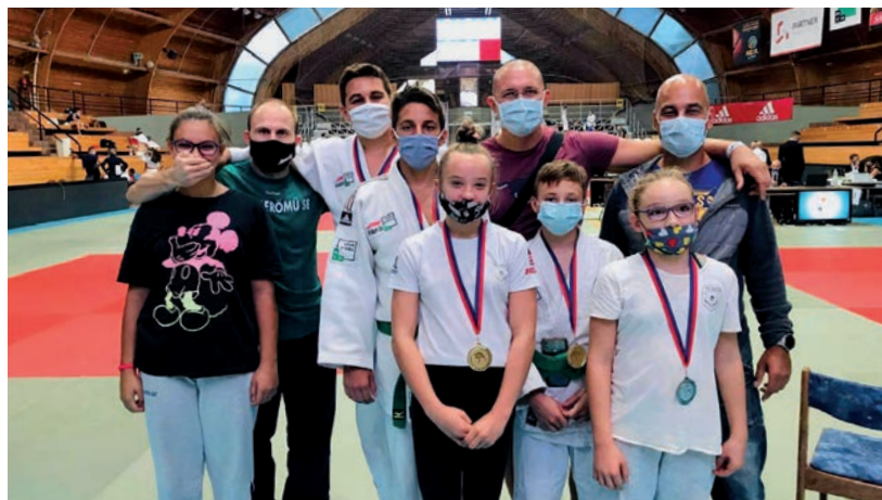
A PAKSI ATOMERŐMŰ SE-VEL KOOPERÁCIÓBAN DOLGOZNAK