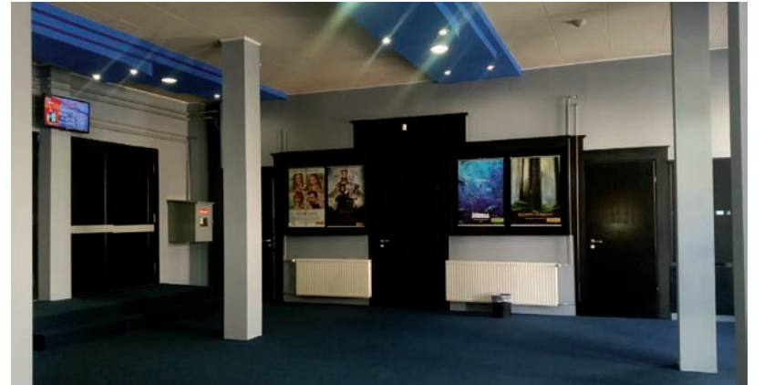
KEVÉS A FILM, KEVÉS A NÉZŐ, DE NEM ZÁRNAK BE

- A jegyeladások a nyáron folyamatosan felfelé ívelő tendenciát mutatnak, amit a Tenet, illetve a Miután összecsapunk és a Mulan filmek bemutatója látványosan megemelték. Sajnos azonban a koronavírus má-