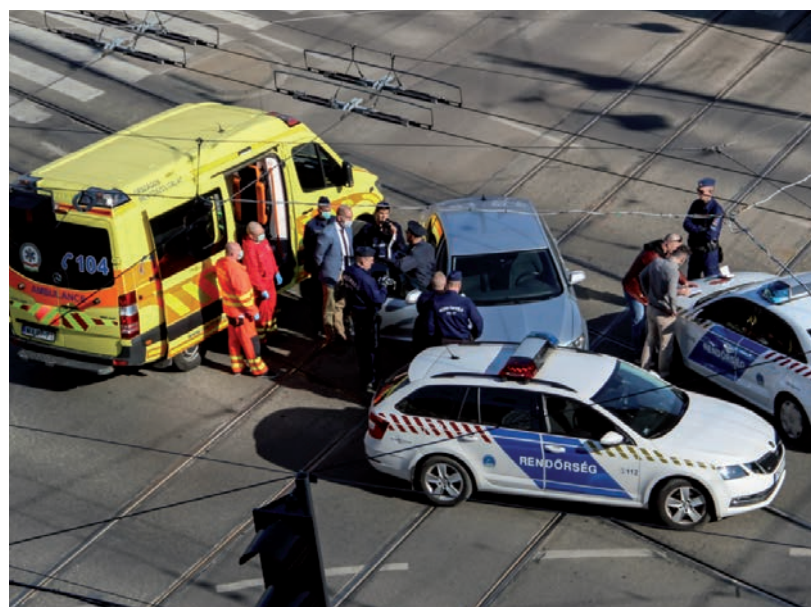
KERESZTBE ÁLLT A SÍNEKEN, EMIATT VITTEK EL A RENDŐRÖK.

A hirdetés szerint az értékesítés elvégzésének díját az 1 hektáros vagy kisebb ingatlanok esetében a földügyi központ, a nagyobbaknál a szerződés megkötésére jogosult vételi ajánlatot tevő fizeti. ■