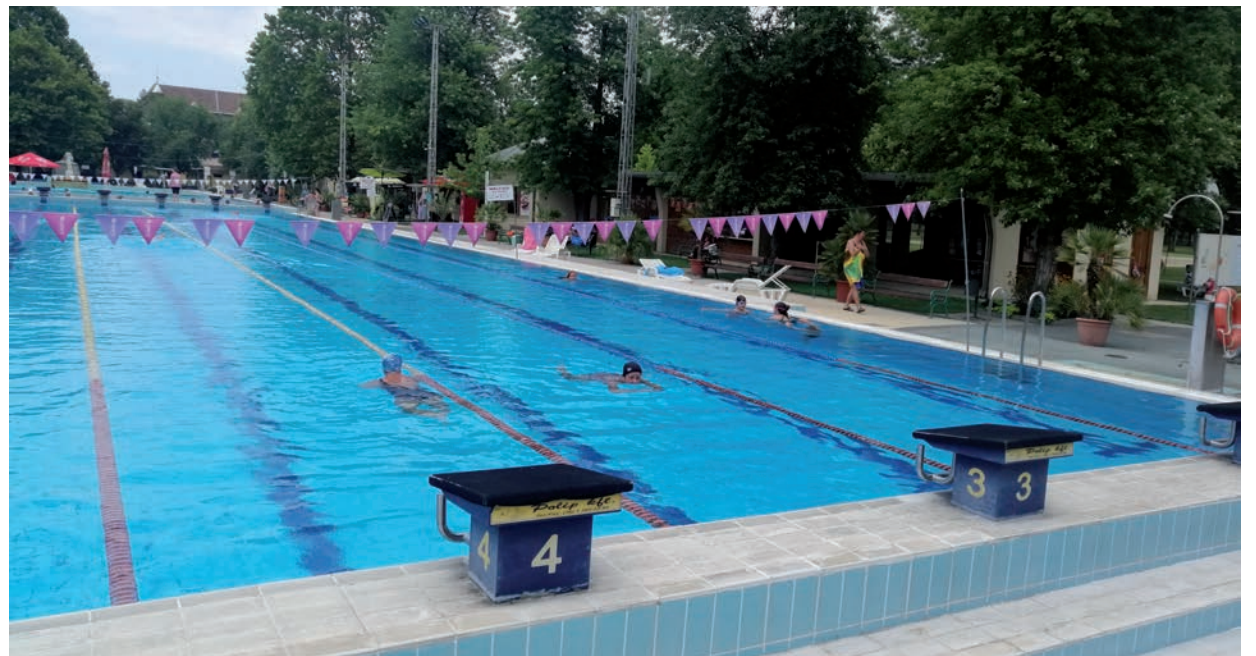
A HÓDMEZŐVÁSÁRHELYI FÜRDŐ