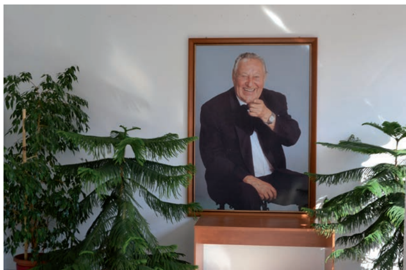
A MŰVÉSZETI DÍJ TAVALY VISELHETTE UTOLJÁRA BESSENYEI NEVÉT