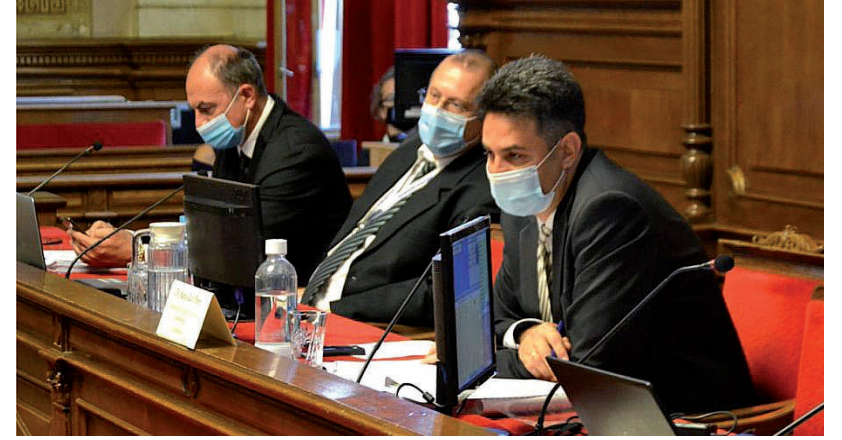
A KÉT VÁSÁRHELYI ÚSZÓKLUB UGYANANNYI TÁMOGATÁST KAPOTT