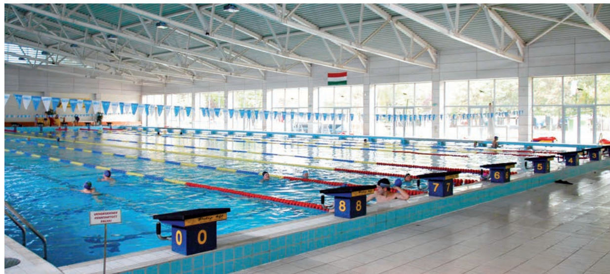
HA LESZ VERSENY, ZÁRTKÖRŰ LESZ.

Október 10-11-én rövid pályás viadalt rendez a Hód Úszó SE, december 4-6. között regionális országos bajnokságot szervez a szövetség a delfin, a cápa és a gyermek korosztálynak, december 12-13-án pedig cikluszáró versenye lesz a Hód Úszó SE-nek. ■