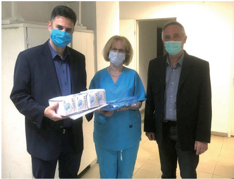
MÉG ÁPRILISBAN A KÖZPONTI ORVOSI ÜGYELET DOLGOZÓINAK 200 DB ARCMASZKOT ÉS 10 DB FEJMASZKOT ADOTT ÁT AZ ÖNKORMÁNYZAT.