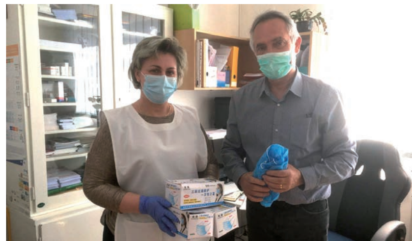
AZ ÖNKORMÁNYZAT MASZKOKAT ADOTT A HÁZIORVOSOKNAK TAVASSZAL

Berényi Facebook bejegyzésében rámutat: exponenciálisan nő a kimutatott esetszám szeptember elejétől kezdődően, a tavaszi járványhullámmal szemben pedig most a fiatalabb korosztályokban terjed a vírus. Az átlagéletkor már 30 év alatt van, óvodákban, általános- és kö-