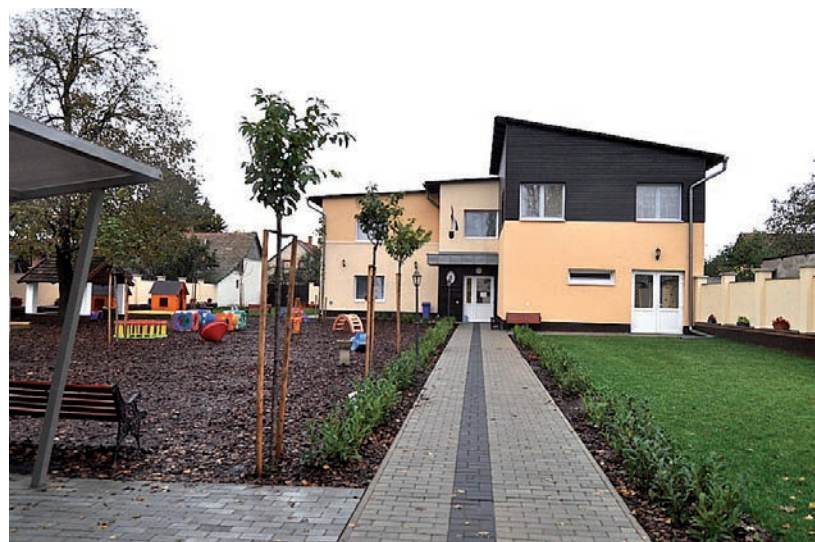
A NÁDOR UTCAI ÓVODÁBAN GYORSAN LÉPTEK ÉS TESZTELTEK

A polgármester nagyon jó példának tartja, amikor a Nádor utcai óvodában gyorsan léptek és teszteltek. Most viszont nagyon kevés információt kapnak, szerinte azért, mert nagyon nagyok az esetszámok, le vannak terhelve a szakemberek. ■