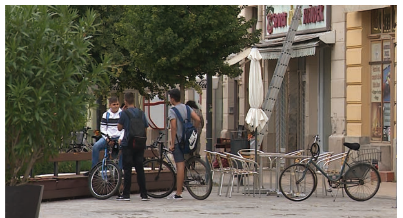
A TIZENÉVESEKÉ LESZ HAMAROSAN A FELÚJÍTÁS ALATT ÁLLÓ SÁRKÁNY

Lehet, hogy régi nevén, új funkcióval és programokkal éled újjá Hódmezővásárhely ikonikus játékboltja, a Sárkány. A létesítmény a továbbiakban is a fiatal korosztályt fogja megcélozni, azonban Legók és plüssök helyett darts, léghoki, informatikai szoba és bár várja majd az iskolás korú fiatalokat. Márki-Zay Péter a VTV-ben azt mondta, minden ami megvalósul a 12-18 éveseket