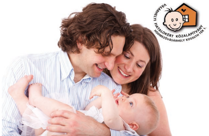
VÁSÁRHELYI SZÜLŐK GYEREKEI FELNŐTTKÉNT INGATLANVÁSÁRLÁSRA KÖLTHETÉK VOLNA