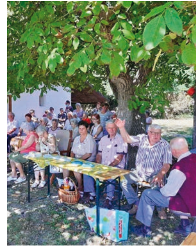
80-AN JÖTTEK EL A 2. KOPÁNCSI TALÁLKOZÓRA

Az egy évvel ezelőtti elhatározásuk, hogy minden év júniusában találkoznak, a járvány miatt szeptember első szombatjára tolódott. A szervezők munkáját nem csak a közel 80