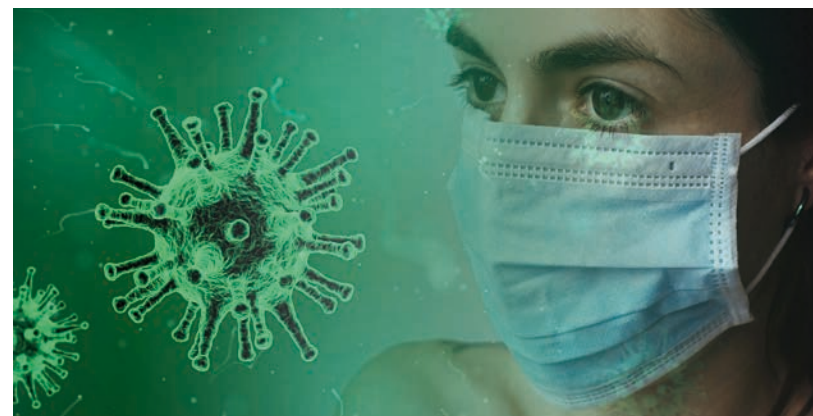
100 EZER FERTŐZÖTT IS LEHET AZ ORSZÁGBAN A SOTE REKTORA SZERINT