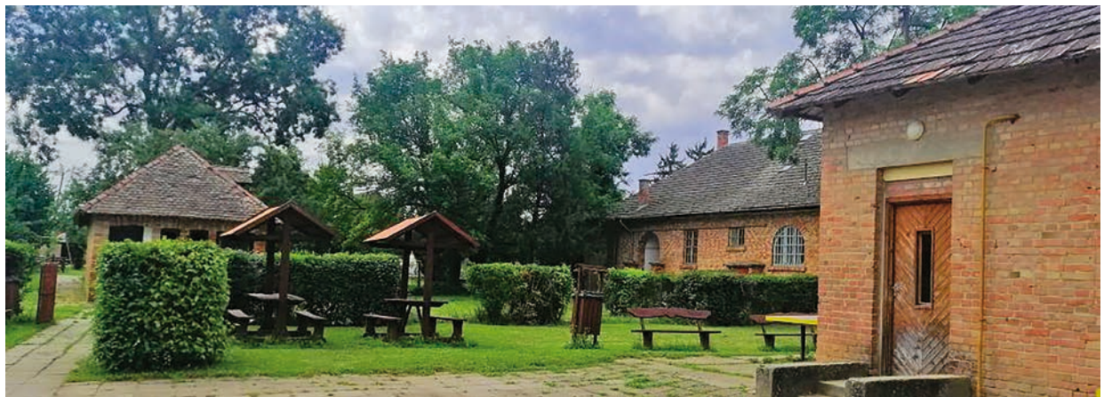
KIÜRÜLT AZ ÉPÜLET, KEVÉS AZ ESÉLY AZ ÚJRAINDELÁSRA