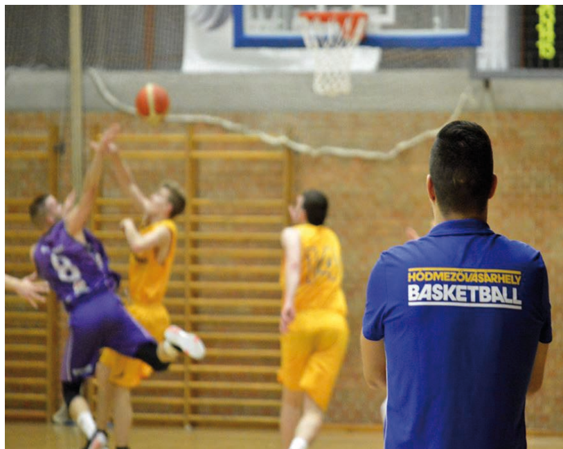
AZ ELŐDÖK MAGASRA TETTÉK A MÉRCÉT