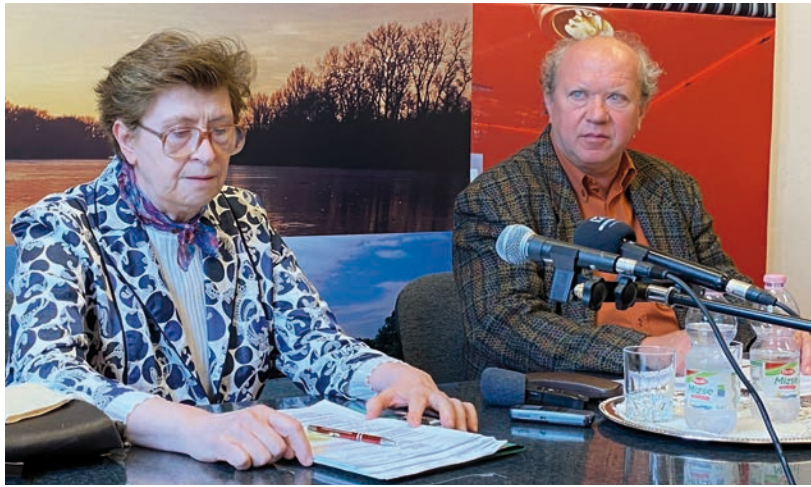
A JELENLEGI ELNÖK ÉS ALELNÖK ÖSSZEFOGLALÓJA AZ ELŐDÖK MUNKÁJÁRÓL