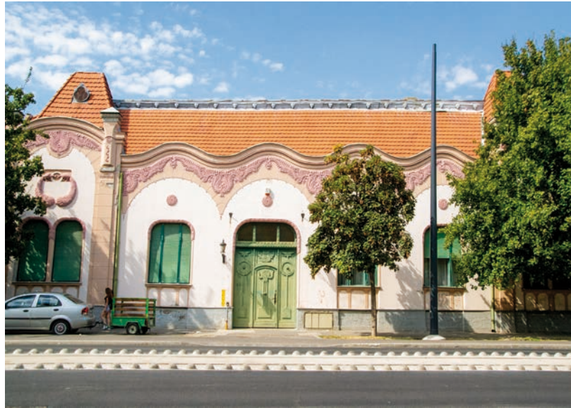
A PETŐFI UTCAI ÖNKORMÁNYZATI INGATLAN HELYETT VETTÉK MEG A PÁVÁS HÁZAT