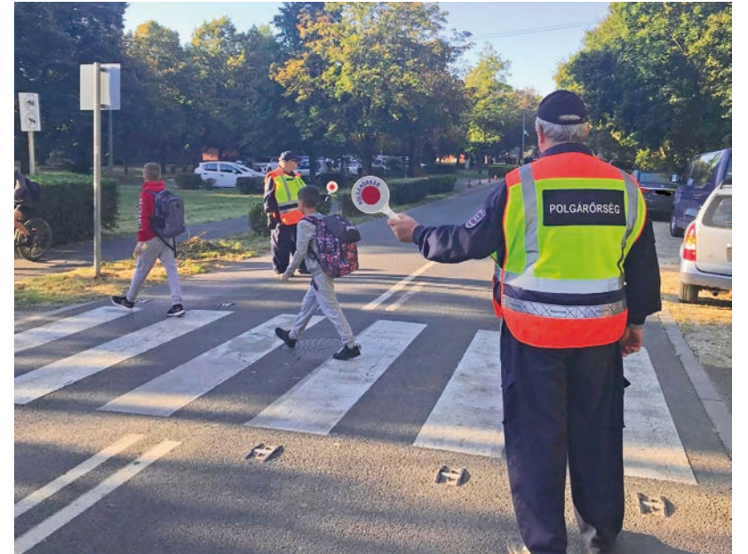
GYALOGÁTKELŐHELYEKNÉL VIGYÁZNAK AZ ISKOLÁBA IGYEKVŐ GYEREKEKRE