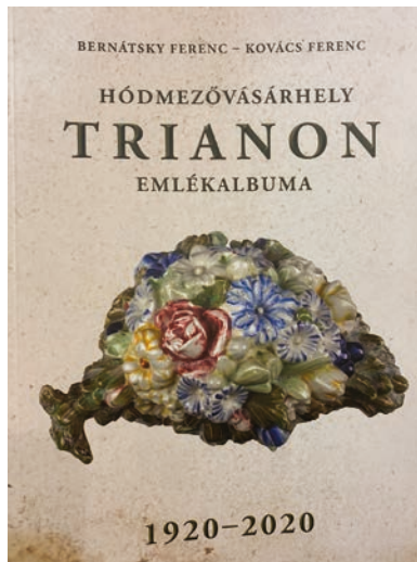
SZÁMOZOTT PÉLDÁNYOK IS KÉSZÜLTÉK A KÖTETBŐL

- Vásárhelynek nem egyszerű történelmi esemény, hanem egy hétköznapi napjainkban is megélt, az emberek