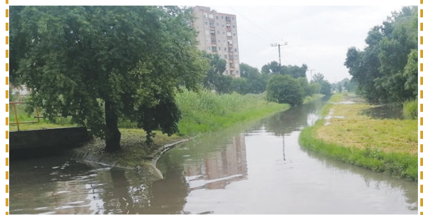
Folyónak tűnik a csapadékvíz elvezető csatorna.

és hogy ez mennyire kézzelfogható jelenség: információ-