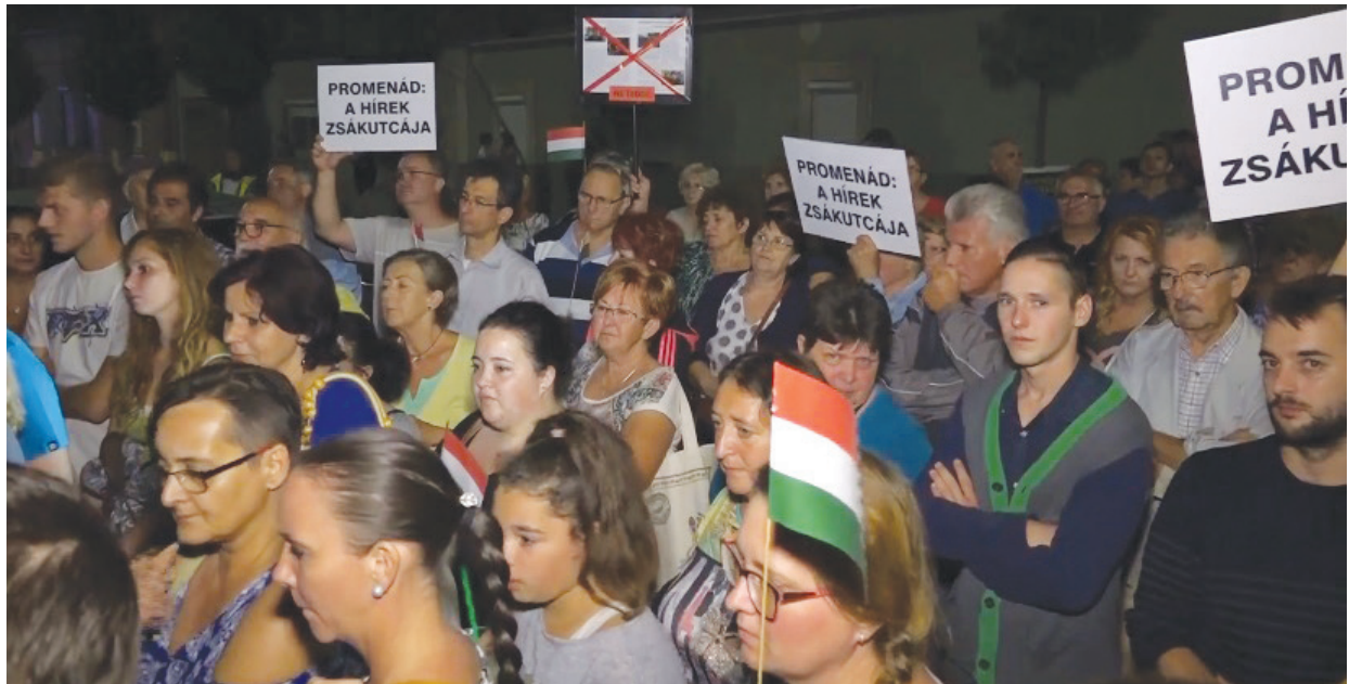
Az akkori demonstráción százak vettek részt.