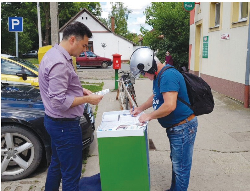
Vásárhely polgármestere mindenkit arra biztat, hogy írja alá a petíciót.

kérdéses eljárások köthetők a Fideszhez. Felidézi, hogy a vásárhelyi városházán személyes adatokat kérdezett le egy dolgozó; bár a választók életkorát tilos nyilván tartani, telefonon hívták a járvány idején a 65 éven felülieket; vagy az országszerte elhíresült Kubatov-listát. Mindenkit arra biztat: éljen a jogával, írjon alá az egészséges életkörülmények érdekében.