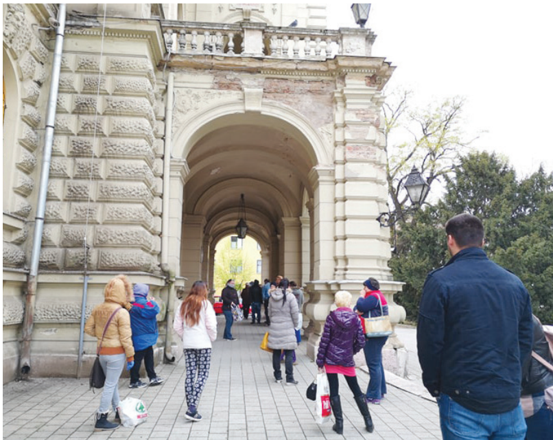
A veszélyhelyzetre való tekintettel a városházán is óvintézkedéseket hoztak. Az ügyfelek kint várakoznak, betartva az előírt távolságot

Lapzártnak idején, kedden délutánig két emberrel: egy 90 évnél idősebb vásárhelyi férfinél és egy 15 hónapos vásárhelyi kisgyermeknél diagnosztizáltak az új típusú koronavírus - állítja a Promenáád hírportál saját értesüléseire hivatkozva. A Vásárhely24 pedig azt, beszéltek a kislány szüleivel, akik azt nyilatkozták nekik: gyermekük az elmúlt szerdán váratlanul magas lázat mutatott, kicsit bedagadt a mandulája, kicsit étvágytalan volt, és hasmenés is jelentkezett nála. Ezt követően két tesztet végeztek rajta, amelyből a második lett pozitív, a szülők jelenleg várják saját tesztjük eredményét, de azóta nem hagyták el a házukat, a bevásárlásukat más végzi nekik. Mint a lap szerint elmondták: korábban is csak a férj járt dolgozni, de alig érintkezett emberekkel, a feleség pedig csak bevásárolni ment el.