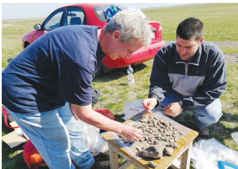
Régészek dolgoznak a Csomorkányi pusztában.

A Munkások Újsága szerint sokat fognak bukni az átalakítással az idősebb, nyugdíj előtt álló kulturális szakemberek is, mert eddig 25, 30 és 40 év közalkalmazotti jogviszonyban töltött idő után jubileumi jutalom illetve meg a közalkalmazottakat. A jutalom a közalkalmazott két-, három- illetve öthavi illetményének felel meg,