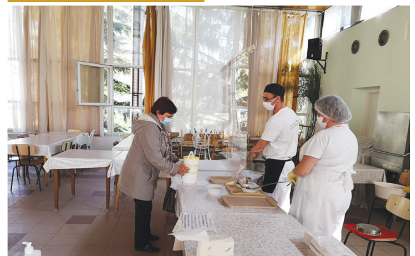
Maszkban plexi mögött cszolgálják ki a Cseresnyésben