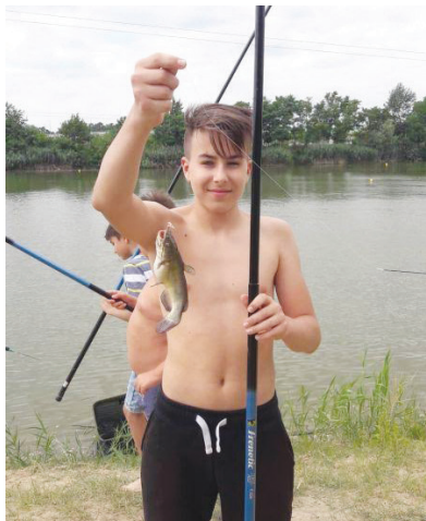
Tavaly nagy sikere volt a horgásztábornak.