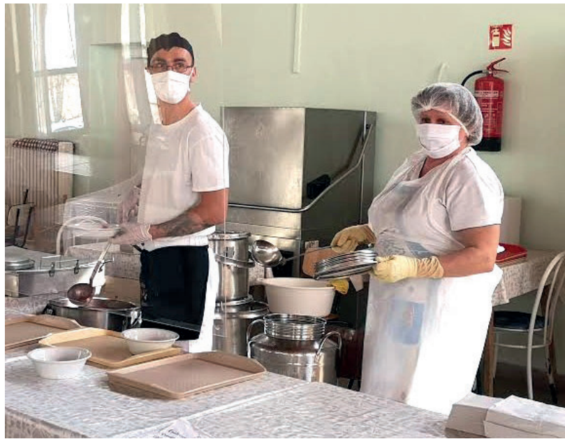
EBÉDOSZTÁS A HÓD-MENZÁNÁL. ILLUSZTRÁCIÓ

A véleményező ülésen elhangzott, a közfeladatot jelenleg ellátó Hódme-