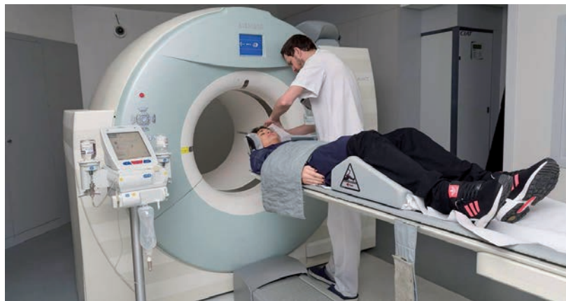
EGYELŐRE NEM LESZ ÚJ CT KÉSZÜLÉKE A HÓDMEZŐVÁSÁRHELYI KÓRHÁZNAK

November 24-én bontották volna föl a beérkezett ajánlatokat a Csongrád Megyei Egészségügyi Ellátó Központban, de jóval a határidő lejárta előtt lefújták az intézmény több százmillió forint értékű eszközbeszerzését – derül ki az uniós közbeszerzési értesítőből. A vásárhelyi kórház egy határon átnyúló uniós pályázat keretein belül új CT készüléket és patológiai eszközöket kívánt beszerezni. Az október október 21-én feladott hirdetményt november 18-án visszavonta az intézmény. A beszerzés költsége megközelítőleg 300 millió forint lett volna, amire