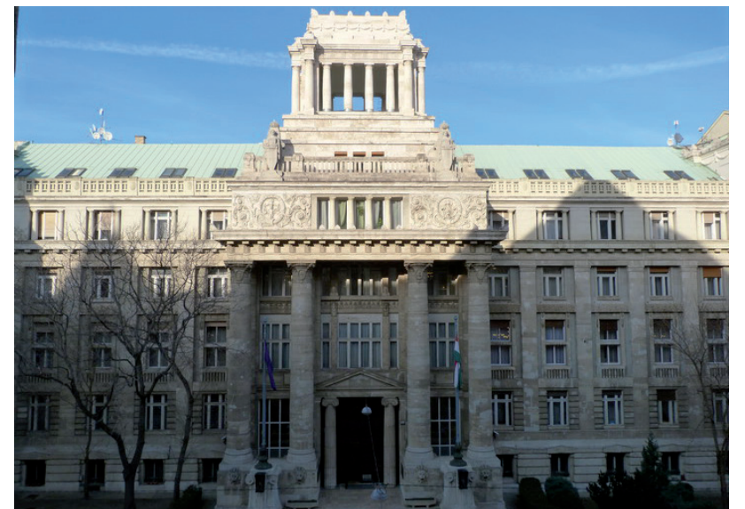
3-BŐL 2,5 ÜGYBEN GYŐZELMET ARATOTT MÁRKI-ZAY PÉTER A KÚRIÁN