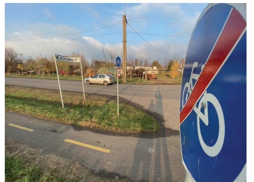
INNEN FOLYTATÓDHAT AZ EGYIK SZAKASZ ÓFÖLDEÁK FELÉ