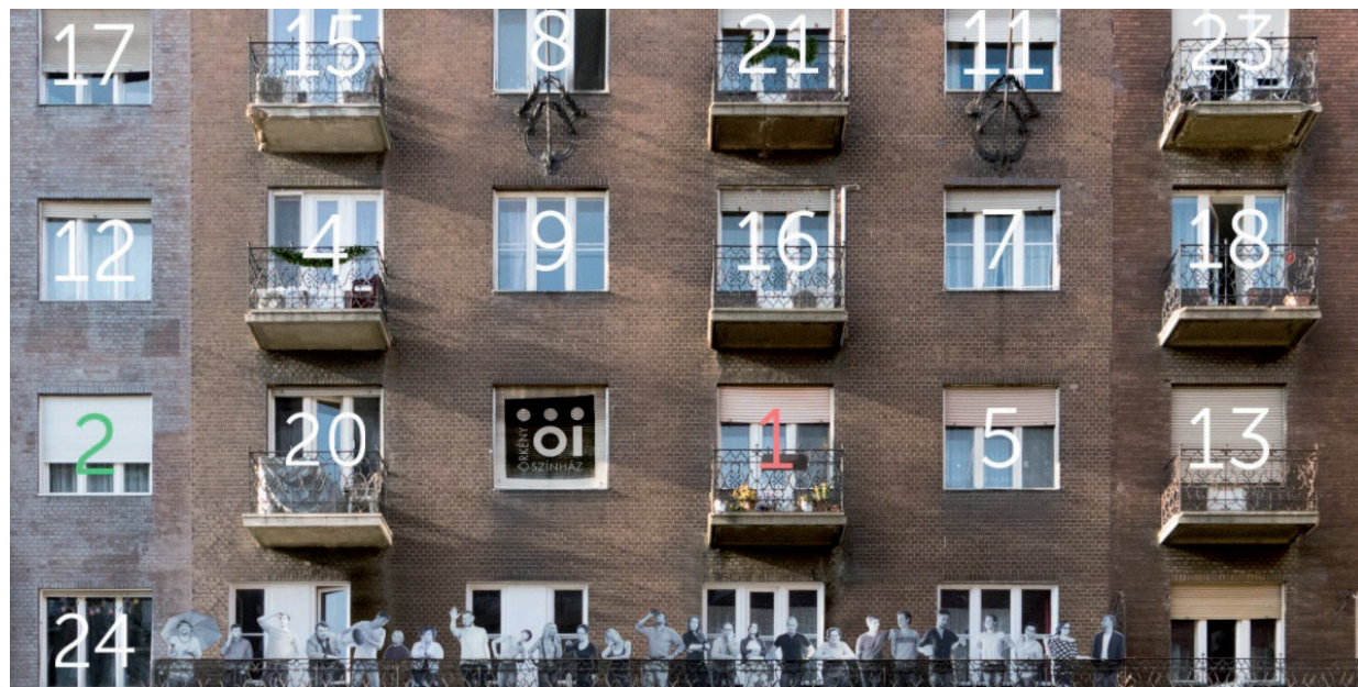
AKÁR EHHEZ HASONLÓ SZÁMZUHATAGOK LEHETNEK A HÓDMEZŐVÁSÁRHELYI ABLAKON. A KÉPEN AZ ÖRKÉNY SZÍNHÁZ ADVENTI ABLAKAI LÁTHATÓK.

ni szeretnének a fődíjakért (3 csokitorta), azoktól azt kéri, hogy küldjék el neki az ablakról készült fotót legkésőbb december 24-én estig. Egy zsűri fogja kiválasztani az első 3 helyezettet, a jutalmakat pedig a két ünnep között osztják majd ki. Természetesen, ha mások is kedvet kapnak, díszítsenek! Minél több ünnepi ablak lesz a városban, annál szebb lesz az advent, fűzte hozzá a képviselő. Az első feladványok már olvashatóak is a képviselőnk Facebook oldalán. ■