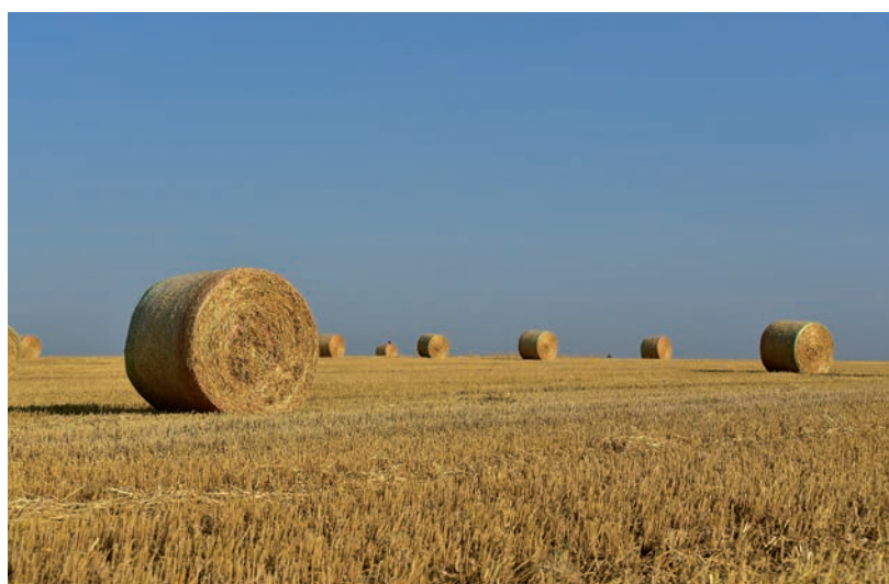
2 HEKTÁR FÖLDTERÜLET FELETT A HASZONBÉRBE ADÓKNAK KELL MAJD FÖLDADÓT FIZETNIÜK,

A veszélyhelyzet idején nem tartható közgyűlés, így Márki-Zay