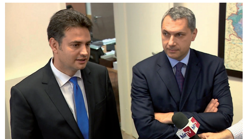
A FACEBOOKON FEJ-FEJ MELLETT ÁLLNAK. ÉS A POLITIKAI TÉRBEN?

Mondhatnánk, fej-fej melletti a két karakteres politikus népszerűsége a Facebookon fent lévő állampolgárok körében. Ha még vállaltva is ténykednének, mi mindenre lennének képesek? Ennek a kétismeretlenes egyenletnek az eredményét sajnos még nem tudni. Legfeljebb annyit, most hová tart. ■