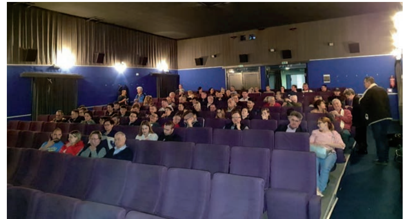
ENNYI NÉZŐRE MÉG HÓNAPOKIG NEM SZÁMÍTHAT A VÁSÁRHELYI ÉS A SZENTESI MOZI