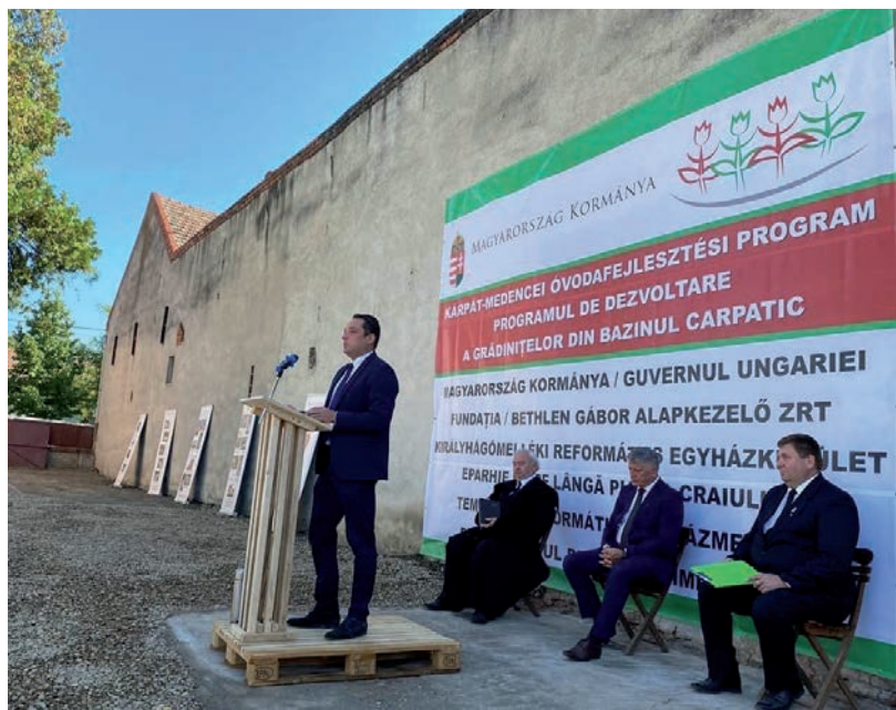
GREZSA ISTVÁN (KÖZÉPEN) ELLEN VÁLASZTÁSI BEAVATKOZÁS GYANÚJA MERÜLT FEL UKRAJNÁBAN

amelyek tiltják, hogy külföldi személy agitációt folytasson bármely ukrán politikai erő (ez esetben a Kárpátaljai Magyar Kulturális Szövetség, KMKSZ) mellett. A külügyi szóvivő szerint a beutazási tilalom kizárólag egy adott állampolgár bűncselekményre utaló cselekedteiről szól, „az elfogadott határozat nem érinti az államközi kapcsolatot”. ■