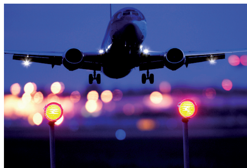
2020 FEKETE ÉV LESZ A NEMZETKÖZI TURIZMUS TÖRTÉNETÉBEN